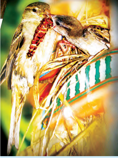
ဆုရဓာတ်ပုံပညာရှင်တစ်ဦး၏ ဓာတ်ပုံလက်ရာကို တွေ့ရစဉ်။

ရန်ကုန် မတ် ၁၃ မြန်မာနိုင်ငံမှ ဓာတ်ပုံပညာရှင်များ နိုင်ငံတကာအထိ ထိုးဖောက်ဝင်ရောက်နိုင်ရန်၊ ဓာတ်ပုံပညာရှင်များ အချင်းချင်း