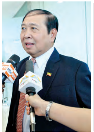
ပြည်ထောင်စု ဝန်ကြီး ဦးအေး မြင့် မိဒီယာ များ အား ဖြေကြားစဉ်။