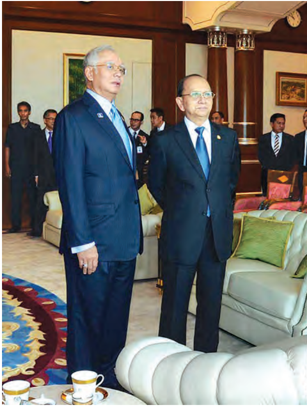
ထားကြောင်း သိရသည်။

မြန်မာနိုင်ငံရှိ နိုင်ငံခြားရင်းနှီး မြှုပ်နှံမှုများတွင် မလေးရှားနိုင်ငံသည် အဆင့် (၇)တွင်ရှိပြီး ၂၀၁၄ ခုနှစ် ဒီဇင်ဘာလကုန်အထိ လုပ်ငန်းပေါင်း ၅၀ တွင် အမေရိကန်ဒေါ်လာ ၁ ဒသမ ၆ ဘီလီယံကျော် ရင်းနှီးမြှုပ်နှံ