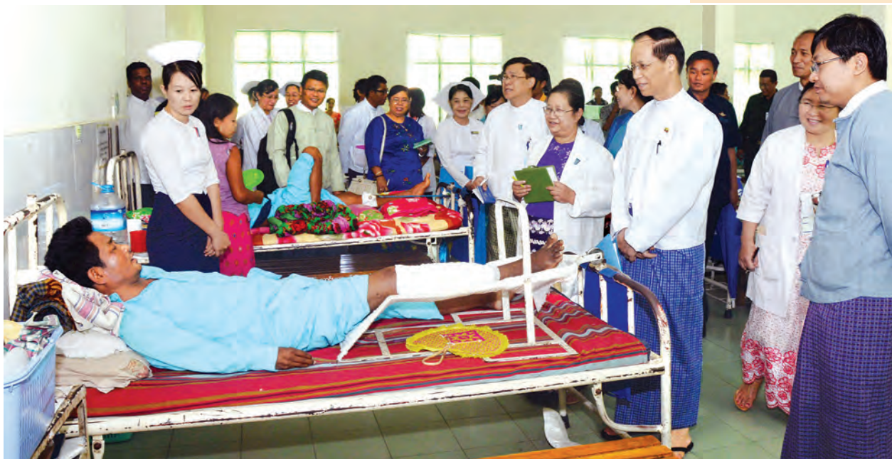
ဒုတိယသမ္မတ ဒေါက်တာစိုင်းမောက်ခမ်း လူနာအား ကြည့်ရှုအားပေးစဉ်။ (သတင်းစဉ်)

ယင်းနောက် ဒုတိယသမ္မတ ဒေါက်တာစိုင်းမောက်ခမ်းက အမှာ စကားပြောကြားရာတွင် နေပြည်တော်