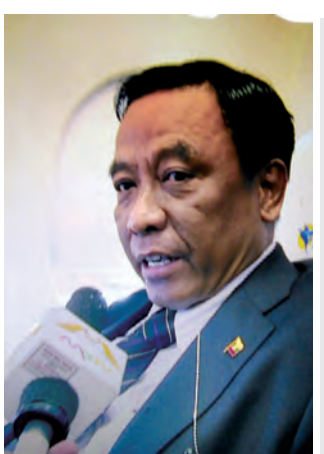
ပြည်ထောင်စု ဝန်ကြီး ဦးဌေး အောင် မိဒီယာ များ အား ဖြေကြားစဉ်။