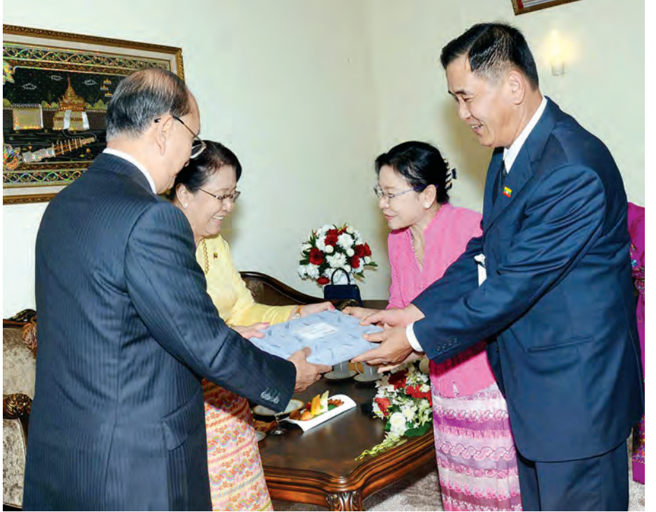
နိုင်ငံတော်သမ္မတ ဦးသိန်းစိန်နှင့်ဇနီး မလေးရှားသံရုံးမိသားစုဝင်များအား လက်ဆောင်ပစ္စည်းပေးအပ်စဉ်။ (သတင်းစဉ်)

ပြည်နှစ်မှစတင်၍ ဝန်ကြီးဌာန အသီးသီးမှ ဝန်ထမ်းများ စေလွှတ် ခဲ့ပြီး ယခုဆွေးနွေးပွဲတွင် ယင်း အစီအစဉ်ကို တိုးချဲ့ဆောင်ရွက်သွား ရန် ထည့်သွင်းဆွေးနွေးခဲ့သည်။ ယင်းနောက် နိုင်ငံတော်သမ္မတ နှင့်ဇနီးနှင့်အဖွဲ့အား မလေးရှား နိုင်ငံဆိုင်ရာ မြန်မာသံအမတ်ကြီး နှင့်ဇနီးနှင့်အဖွဲ့အား မလေးရှား နိုင်ငံဝန်ကြီးချုပ်နှင့် ဇနီးတို့က ရန်ကုန်မြို့လာဟိုတယ်၌ နေ့လယ်စာ စားပွဲဖြင့် တည်ခင်းဧည့်ခံခဲ့သည်။ ထို့နောက် နိုင်ငံတော်သမ္မတနှင့် ဇနီးအဖွဲ့သည် မလေးရှား နိုင်ငံဆိုင်ရာ မြန်မာသံအမတ်ကြီး နှင့်ဇနီးအဖွဲ့အား မလေးရှား နိုင်ငံဝန်ကြီးချုပ်နှင့် ဇနီးတို့က ဝန်ထမ်းများ၊ မိသားစုဝင်များ၊ မြန်မာပညာတော်သင်များနှင့် တွေ့ဆုံ၍ နိုင်ငံတော်သမ္မတက လိုအပ် သည့်များ မှာကြားကာ ပညာတော် သင်များအား ထောက်ပံ့ငွေများ ပေးအပ်သည်။ (သတင်းစဉ်)