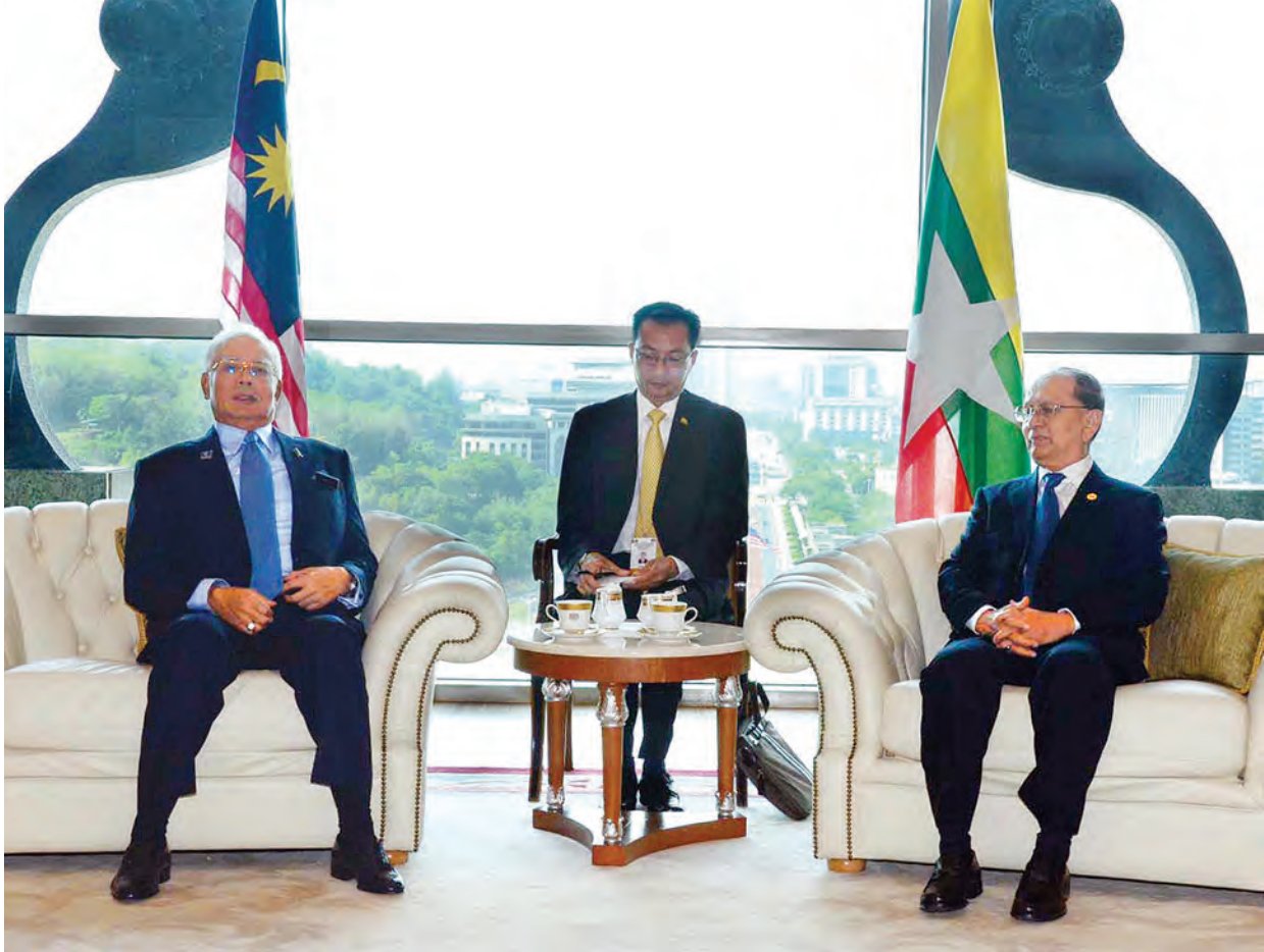
နိုင်ငံတော်သမ္မတ ဦးသိန်းစိန်နှင့် မလေးရှားနိုင်ငံဝန်ကြီးချုပ် မစ္စတာ နာဂျစ်ရာဇတ်တို့ တွေ့ဆုံစဉ်။ (သတင်းစဉ်)

peration Programme-MTCP) အရ မလေးရှားနိုင်ငံတွင် ဖွင့်လှစ် သော ကာလတိုသင်တန်းများ၊ လူ စွမ်းအားအရင်းအမြစ် တည်ဆောက် ရေး အစီအစဉ်များသို့ ၂၀၀၀