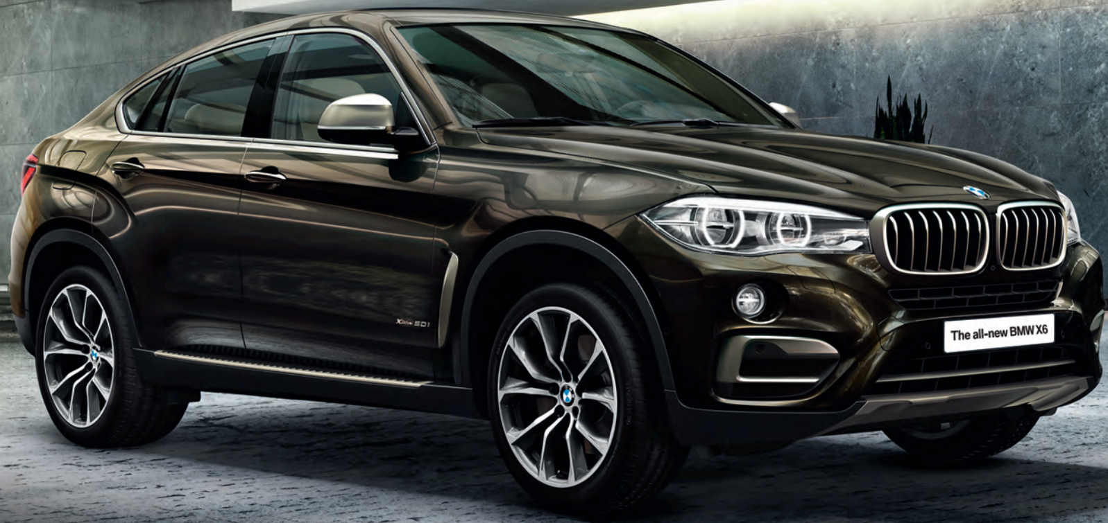
The all-new BMW X6