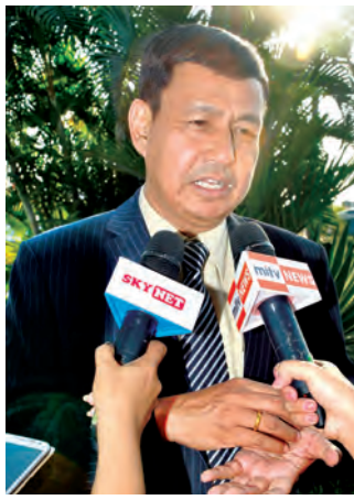
ပြည်ထောင်စု ဝန်ကြီး ဦးရဲ ထွဋ် မိဒီယာ များ အား ဖြေကြားစဉ်။

ဖွံ့ဖြိုးပါတယ်။ ရပ်နီးရပ်ဝေးက ကမ္ဘာလှည့်ခရီးသွား ၂၅ သန်းလောက်အထိ လာနေပါတယ်။ ဒါကိုဆက်ပြီး တိုးတက်လာအောင် မြှင့်တင်တာ၊ ကြော်ငြာတာတွေနဲ့ ထိန်းသိမ်းဆောင်ရွက်နေပါတယ်။ မလေးရှားနိုင်ငံနဲ့ မြန်မာနိုင်ငံက နှစ်နိုင်ငံပူးပေါင်းဆောင်ရွက်နေတဲ့ မိတ်ဖက်နိုင်ငံတွေဖြစ်ပြီး ၂၀၁၅ ခုနှစ်က အာဆီယံအဖွဲ့ဝင် နိုင်ငံဖြစ်တော့လည်း ဒေသတွင်းမှာ အမြဲတမ်း ပူးပေါင်း ဆောင်ရွက်ခဲ့ပါတယ်။ အခုချိန်မှာ အာဆီယံဒေသကို တစ်ခုတည်းသော ခရီးစဉ်ဒေသအဖြစ် ထူထောင်တဲ့နေရာမှာ မလေးရှားနဲ့ သာမက အခြားနိုင်ငံတွေနဲ့ပါ ဆက်စပ်ပြီး ဆောင်ရွက် ရတဲ့လုပ်ငန်းစဉ်တွေရှိပါတယ်။ ပြီးခဲ့တဲ့ ဇန်နဝါရီလက နေပြည်တော်မှာကျင်းပတဲ့ အစည်းအဝေးမှာ မလေးရှားက စတင်ပြီး ဦးဆောင်ဦးရွက်ပြုတဲ့ အစီအစဉ်ကို ဒီနှစ်ထဲမှာ အကောင်အထည်ဖော်မှာဖြစ်ပါတယ်။ အခုလ ၄ ရက်နေ့ က ဘာလင်မှာ ကျင်းပခဲ့တဲ့ နိုင်ငံတကာခရီးသွားပြပွဲမှာ မြန်မာနိုင်ငံအနေနဲ့လည်း အကြီးကျယ်ဆုံး ပါဝင်ပြသခဲ့ ပါတယ်။ အလားတူပဲ မလေးရှားကလည်း ပါဝင်ပြသ ပါတယ်။ အဲဒီမှာ ဒီအစီအစဉ်ကို ကျွန်တော်ဦးစီးပြီးတော့ပဲ လုပ်ငန်းမြှင့်တင်မှု ကြော်ငြာတွေ လုပ်ခဲ့ပါတယ်။ လုပ်ငန်း မြှင့်တင်မှုကြော်ငြာတွေကို ရေရှည်ပူးပေါင်းဆောင်ရွက် နိုင်အောင်နဲ့ မလေးရှားရဲ့ လူသားအရင်းအမြစ် တိုးတက် ဖွံ့ဖြိုးနေတာကို ကျွန်တော်တို့ရဲ့ လူသားအရင်းအမြစ် တိုးတက်ဖွံ့ဖြိုးအောင်လည်း ပေါင်းစပ်ပြီး ဆောင်ရွက်ရမှာ ဖြစ်ပါတယ်။ ခရီးသွားလာရေးဖွံ့ဖြိုးဖို့အတွက် မလေးရှားက လုပ်ငန်းရှင်၊ ကုမ္ပဏီတွေကို မြန်မာနိုင်ငံက ခရီးစဉ်ဒေသ တွေကို ဖိတ်ခေါ်မိတ်ဆက်ပြသပေးသွားမှာဖြစ်ပြီး မလေးရှားပြည်သူတွေသာမက နိုင်ငံတကာက ခရီးသွား တွေအနေနဲ့ မြန်မာနိုင်ငံရဲ့ စိတ်ဝင်စားဖွယ်ရာ နေရာ