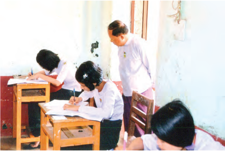
ဧရာဝတီတိုင်းဒေသကြီး ဝန်ကြီးချုပ် ဦးသိန်းအောင် အမှတ်(၁) အခြေခံပညာအထက်တန်း ကျောင်း၌ တက္ကသိုလ်ဝင်စာမေးပွဲဖြေဆိုနေကြသည့် ကျောင်းသား ကျောင်းသူများအား ကြည့်ရှု အားပေးစဉ်။ (သတင်းစဉ်)

နေပြည်တော် မတ် ၁၃ ၂၀၁၅ ခုနှစ် တက္ကသိုလ်ဝင်စာမေးပွဲကို မတ် ၁၁ ရက်မှစတင်၍ မြန်မာတစ်နိုင်ငံလုံး၌ တစ်ပြိုင်တည်း စတင်ကျင်းပခဲ့ရာ ကျောင်းသား ကျောင်းသူများက ယနေ့ နံနက် ၉ နာရီက သင်္ချာဘာသာရပ်ကို ဖြေဆို ကြသည်။ ယနေ့ဖြေဆိုမှုအနေဖြင့် တိုင်းဒေသကြီး၊ ပြည်နယ် နှင့် နေပြည်တော်ကောင်စီနယ်မြေတို့တွင် တက္ကသိုလ် ဝင်စာမေးပွဲ သင်္ချာဘာသာရပ်ဖြေဆိုသူ ကျောင်းသား ကျောင်းသူ ၅၉၆၆ ၂၅ ဦးရှိရာ အင်္ဂလိပ်စာဘာသာရပ် ဖြေဆိုသည့်နေ့ထက် ၄၄၄ ဦး လျော့နည်းပြီး စာမေးပွဲ စတင်ဖြေဆိုသည့်နေ့ထက် ဖြေဆိုသူ ကျောင်းသား ကျောင်းသူ ၁၁၄၃ ဦးလျော့နည်းကြောင်း သိရှိရ သည်။ (သတင်းစဉ်)