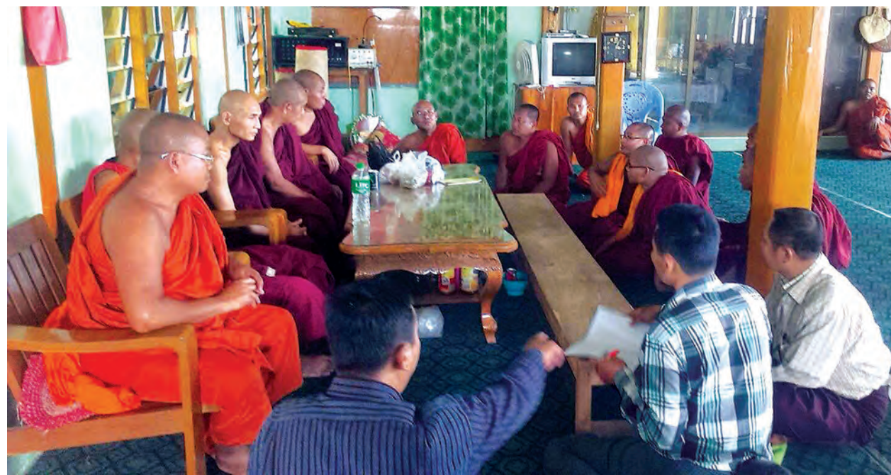
ရဟန်းသံဃာတော်များနှင့် မအပ်စပ်သည့်ကိစ္စများ၌ ပါဝင်ခဲ့ခြင်းအပေါ် ခွင့်လွှတ်သည့်ခံပေးပါရန် လျှောက်ထား၍ နိုင်ငံတော်သံဃမဟာနာယက အဖွဲ့က ထုတ်ပြန်ထားသော ညွှန်ကြားလွှာများနှင့်အညီ ကျင့်ကြံအားထုတ်မည်ဖြစ်ကြောင်း ဝန်ခံကတိပြုခဲ့ပြီး မတ် ၁၁ ရက် နံနက်ပိုင်းတွင် လက်ပံတန်း မြို့ အောင်မြေမိမိကျောင်းတိုက်မှ ပြန်လည်ထွက်ခွာသွားခဲ့သော မတ် ၁၀ ရက် လက်ပံတန်းဖြစ်စဉ်တွင် ပါဝင်ခဲ့သည့် သံဃာ ၁၀ ပါးအား တွေ့မြင် ရစဉ်။ (သတင်းဖော်ပြပြီး)