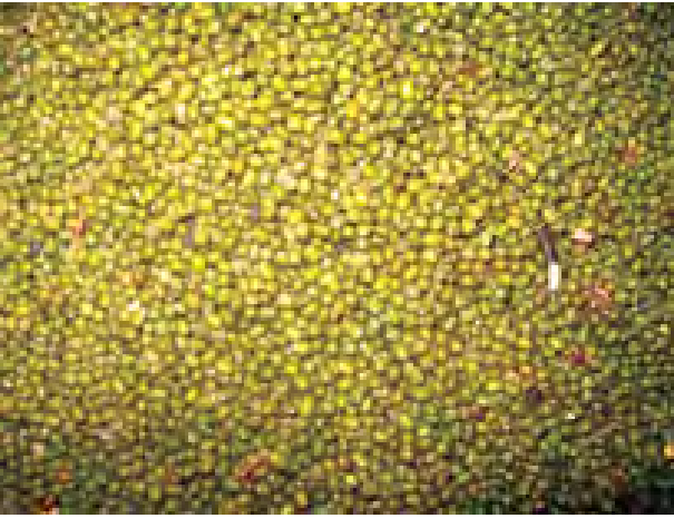
မရှိကြပါဘူး။ မနှစ်က အခုလို မတ်ပဲနဲ့ ပဲတီစိမ်း ပြိုင်ပြိုင်ပေါ်တဲ့အချိန်မှာ ကုန်သည်ပွဲစားများက ဈေးညှိပြီး ဈေးနှုန်းချယ်လို့ ပဲစိုက်တောင်သူလယ်သမားများ တွက်ခြေမကိုက်ကြပါတယ်”ဟု မြူးမြို့နယ်ကလေးများ မတ်ပဲနှင့် ပဲတီစိမ်းများ ပေါ်ဦး ပေါ်ဖျားကတည်းက ဈေးကတည်းက ပြောင်းလဲနေတဲ့ မြှင့်တင်လာလို့ ကျွန်တော်တို့ တောင်သူများ တက်ဈေးနဲ့ ရောင်းကြရတော့ တွက်ခြေမကိုက်ကြပါတယ်”ဟု မြူးမြို့နယ်ကလေးများ အရှေ့ဒေသခံတောင်သူတစ်ဦးက ပြောပြသည်။ (၁၁၃)

သိရသည်။ ယခုနှစ် မတ်ပဲနှင့် ပဲတီစိမ်းများ ပြိုင်ပြိုင်ပေါ်ချိန်တွင် ယမန်နှစ်များကဲ့သို့ ဈေးနှုန်းကျကျသွားဘဲ တက်ဈေးဖြင့် အရောင်းအဝယ် ဖြစ်လျက်ရှိရာ ပဲတီစိမ်း သုံးတင်းဝင် အိတ် ပီသာ ၆၀ ငွေကျပ် ၁၄၅၀၀၊ မတ်ပဲသုံးတင်းဝင်အိတ် ပီသာ ၆၀ ငွေကျပ် ၈၅၀၀၀ ဈေးဖြင့် အရောင်းအဝယ်သွက်လျက်ရှိသည်။ “အခုနှစ် ရာသီဥတုဖောက်ပြန်ပြီး နောက်မိုးမမှန်လို့ ဆောင်းစိုက်ပဲမျိုးစုံ အထွက်နှုန်း အနည်းငယ်ကျဆင်းခဲ့ပါတယ်။ ဒါပေမယ့် မတ်ပဲဈေးနဲ့ ပဲတီစိမ်းဈေးက မနှစ်ကထက်စာရင် ဒီနှစ်ဈေးကောင်းရလို့ ကျွန်တော်တို့ တောင်သူများ အနှိုး