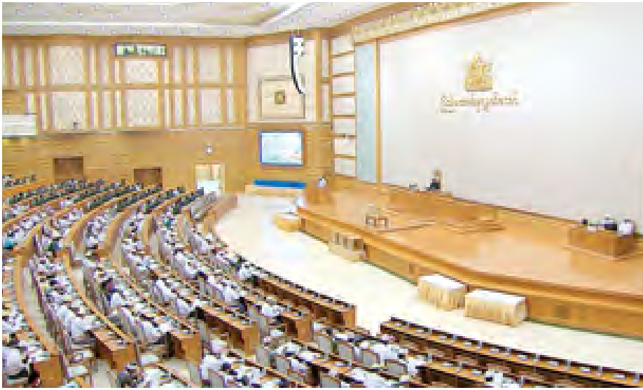
ပြည်ထောင်စုလွှတ်တော်အစည်းအဝေးကျင်းပစဉ်။ (သတင်းစဉ်)

အာဆီယံ ပြတင်းတစ်ပေါက် စနစ်အကောင်အထည်ဖော်မှုဆိုင်ရာ ဥပဒေမူဘောင် အခြေပြစာချုပ် သည် ချုပ်ဆိုခဲ့ပြီးဖြစ်သည့် ASW Agreement နှင့် ASW Protocol တို့ကိုထိရောက်စွာ အကောင်အထည် ဖော်ဆောင်ရွက်ရာတွင် ဆက်စပ် ယှက်နွယ်လျက်ရှိသည့် အချက် အလက်များအား ပိုမိုပြည့်စုံစွာ ထည့်သွင်းဖော်ပြ ရေးဆွဲထားခြင်းဖြစ်