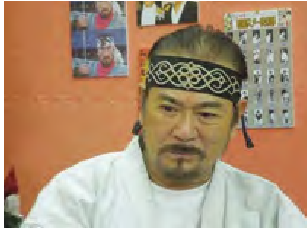
အဆိုပါရုပ်သံအစီအစဉ်ကို 5 Plus ရုပ်သံလိုင်းတွင် ပြသလျက်ရှိပြီး ဂျပန်တို့၏ ရိုးရာယဉ်ကျေးမှု မလေ့ထုံးစံများ၊ ဂျပန်မြို့တော်ပေါင်း ၁၃ မြို့ကို သွားရောက်လှည့်လည်ရိုက်ကူးထားသည့် ဗဟုသုတရဖွယ်ရာများနှင့် ဂျပန်အစား

မင်္ဂလာပါဂျပန် ရုပ်သံအစီအစဉ်အတွက် ဂျပန်မင်းသားကြီး ဆန်နီချီးပါးက မြန်မာနိုင်ငံအနှံ့ ခရီးစဉ်များထွက်ကာ ဒေသန္တရအတွေ့အကြုံများ ရိုက်ကူးမည့်အစီအစဉ်ကို မကြာမီစတင်တော့မည်ဖြစ်ကြောင်း မတ် ၇ ရက်တွင် ရန်ကုန်မြို့ Junction Square ၌ ကျင်းပသည့် မင်္ဂလာပါဂျပန်ရုပ်သံအစီအစဉ် မိတ်ဆက်ပွဲအခမ်းအနားမှ သိရသည်။