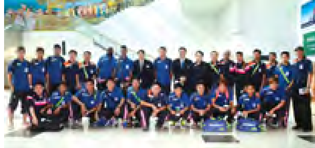
တောင်တရုတ်အသင်းနှင့် အဝေးကွင်းပွဲစဉ်ယှဉ်ပြိုင်ရမည့် ရတနာပုံအသင်းကို ရန်ကုန်အပြည်ပြည်ဆိုင်ရာလေဆိပ်မှထွက်ခွာမီ တွေ့ရစဉ်။