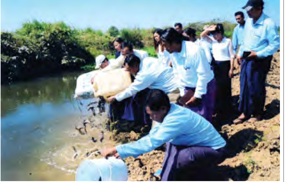
လုပ်ငန်းဦးစီးဌာနမှ၊ ခရိုင်နှင့်မြို့နယ် အဖွဲ့ဝင်များက ငါးမွေးတောင်သူများ ထံသို့ ငါးမျိုးများထောက်ပံ့ပေး အပ်ပြီး လယ်ကြားကန်/မြောင်းနှင့် တစ်နိုင်တစ်ပိုင် ငါးမွေးကန်များ အတွင်း ငါးမျိုးများ စိုက်ထည့်ပေးခဲ့ ကြောင်းသိရသည်။