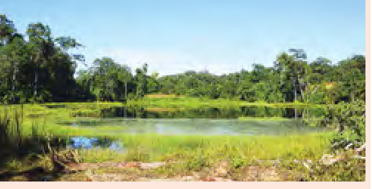
သိရသည်။ ယခင်နှစ်များကအစပြု၍ မော်လိုက်-ပြောင်ဘုတ်-လက်ဆေးကန်လမ်းကို စက်ယန္တရားကြီးများဖြင့် လမ်းဖောက်လုပ်ပြုပြင်ခြင်း၊ တံတားများတည်ဆောက်ခြင်းတို့ကို ဆောင်ရွက်နေပြီဖြစ်၍ ဘုရားဖူးသွားရောက်သူ၊ လေ့လာရေးခရီးသွားရောက်သူများအတွက် သွားလာရေးအဆင်ပြေလျက်ရှိသည်။ ထိုသို့ လမ်းပန်းဆက်သွယ်ရေးကောင်းမွန်လာပြီး ဘုရား၊ ကျောင်းကန်၊ ဇရပ်တို့ဖြင့်ပြည့်စုံလာသည့်အတွက် ဘုရားဖူးခရီး၊ လေ့လာရေးခရီး လာရောက်သူလည်း များပြားလျက်ရှိကာ အထူးသဖြင့်သီတင်းကျွတ်ချိန်၊ ကထိန်ခင်းချိန်နှင့် သင်္ကြန်ကာလတို့တွင် လာရောက်သူအများဆုံးဖြစ်ကြောင်း၊ ပြည်တွင်းသာမက ပြည်ပမှခရီးသွားဧည့်သည်များလည်း စိတ်ဝင်စားမှုများပြားသည့် ဒေသတစ်ခုဖြစ်ကြောင်း သိရသည်။ ကျွန်း

သီတင်းသုံးခဲ့ကြကြောင်း ကလေးမြို့ သမိုင်းကြောင်း စုဆောင်းသူအချို့၏ အဆိုအရ သိရသည်။ လက်ဆေးကန်တောင်ထိပ်ပေါ်တွင် ရွှေကံသာမုနိစေတီတော်မြတ်ကြီးကို ဖူးမြော်ကြည့်ညှိနိုင်ပြီး ဘုရားရင်ပြင်တော်မှ ကလေးမြို့နယ်တစ်ဝိုက်လုံး၏ သဘာဝအလှရှုခင်းများကို ကြည့်ရှုခံစားနိုင်သည်။ လက်ဆေးကန်တောင်ထိပ်တွင် ကျောင်းထိုင်သီတင်းသုံးသည့် ဆရာတော် ဦးကုမာရ(ဂန်ဂေါ)၏ မိန့်ကြားချက်အရ လက်ဆေးကန်သည် ယခုတိုင် တောတောင်ရေမြေ မပျက်ယွင်းသေးသည့် နေရာဖြစ်ကြောင်း၊ ဆွမ်းဘုဉ်းတောင်တွင် သစ်တော၊ ဝါးတောကြီးများ ကျန်သေးသည့်အပြင် သဘာဝတောကောင် သားကောင်များ၊ ကျား၊ ဝက်၊ ပြောင်စသည့် အကောင်ကြီးများပင် ကျန်ရှိသေးသည်ဟု