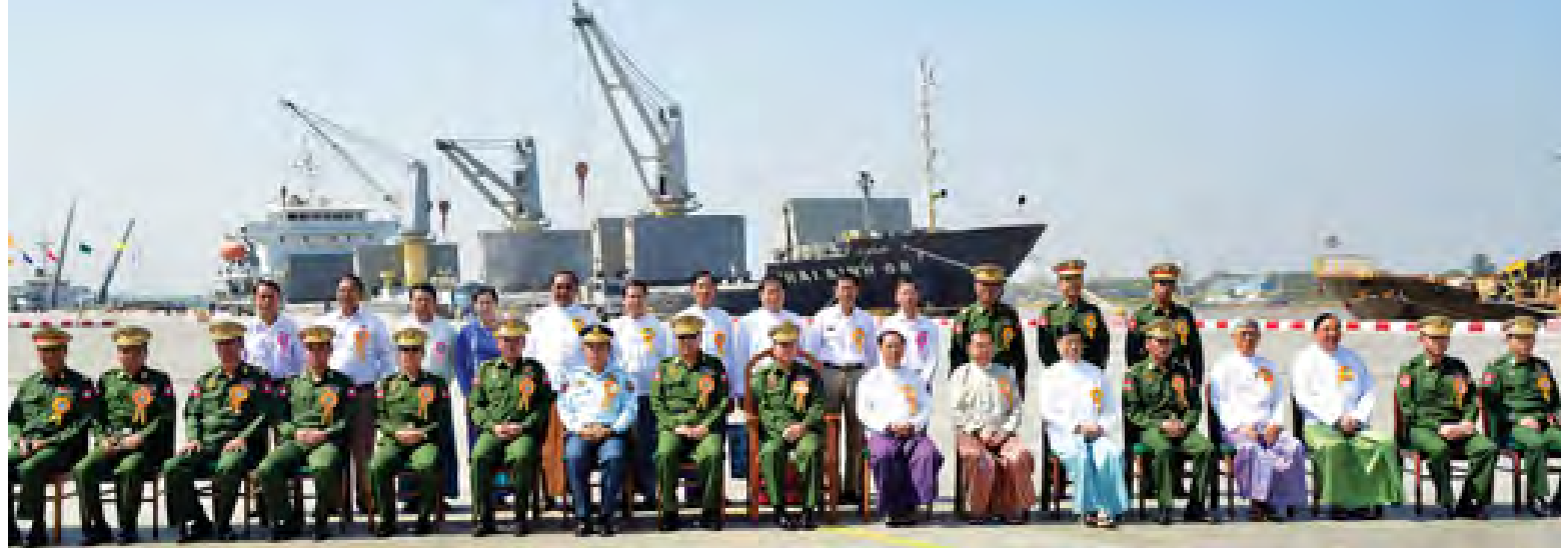
တပ်မတော်ကာကွယ်ရေးဦးစီးချုပ် ဗိုလ်ချုပ်မှူးကြီး မင်းအောင်လှိုင် အမှတ် (၁) အလုံအပြည်ပြည်ဆိုင်ရာဆိပ်ကမ်း ဖွင့်လှစ်ခြင်းအခမ်းအနားတွင် တက်ရောက်ကြသူများနှင့်အတူ မှတ်တမ်းတင် ဓာတ်ပုံရိုက်စဉ်။ (မြဝတီ)

ယနေ့ဖွင့်လှစ်သော အမှတ်(၁) အလုံအပြည်ပြည်ဆိုင်ရာဆိပ်ကမ်းသည် ရန်ကုန်ဆိပ်ကမ်းဖွံ့ဖြိုးတိုးတက်ရေးစီမံကိန်းအရ တိုးချဲ့ဆောက်လုပ်မည့် ဆိပ်ကမ်းခြောက်ခုအနက် ပထမဆုံးတည်ဆောက်ပြီးစီးဖွင့်လှစ်ခဲ့သော ဆိပ်ကမ်းဖြစ်ပြီး မြန်မာ စီးပွားရေးကော်ပိုရေးရှင်း၏ ရာနှုန်းပြည့် ရင်းနှီးမြှုပ်နှံမှုဖြင့် ဆောင်ရွက်ခဲ့သည့် လုပ်ငန်းဖြစ်သည်။ ဆိပ်ကမ်း၏ ဆိပ်ခံတံတားမှာ အလျား မီတာ ၆၀၀၊ ကုန်သေတ္တာလွင်ပြင် ၄၅ ဒသမ ၁၈၃ ဧကကို ပူးတွဲပိုင်ဆိုင်ဆောက်ထားသဖြင့် တန်ချိန် ၂၀၀၀ ရှိပင်လယ်ကူးသင်္ဘောကြီး သုံးစင်း တစ်ပြိုင်တည်း ဆိုက်ကပ်နိုင်မည်ဖြစ်ပြီး ကုန်သေတ္တာတိုင်တွယ်မှုအနေဖြင့် တစ်နှစ်လျှင် ကုန်သေတ္တာအလုံးရေ ၂၈၀၀၀ အထိ ဝန်ဆောင်မှု ပေးနိုင်စွမ်းရှိသည့် အတွက် ပြည်တွင်း/ပြည်ပ သင်္ဘောလှိုင်း/ ကုမ္ပဏီများ၏ လိုအပ်ချက်နှင့်အညီ ခေတ်မီကုန်တင်/ ကုန်ချယန္တရားကြီးများဖြင့် အကောင်းဆုံး ဝန်ဆောင်မှုပေးနိုင်ကာ နိုင်ငံတော်၏ ပင်လယ်ရေကြောင်း ကုန်သွယ်မှုကဏ္ဍကို ပိုမိုတိုးတက်လာစေရန် အထောက်အကူ ဖြစ်စေမည်ဖြစ်ကြောင်း သိရသည်။ (မြဝတီ)