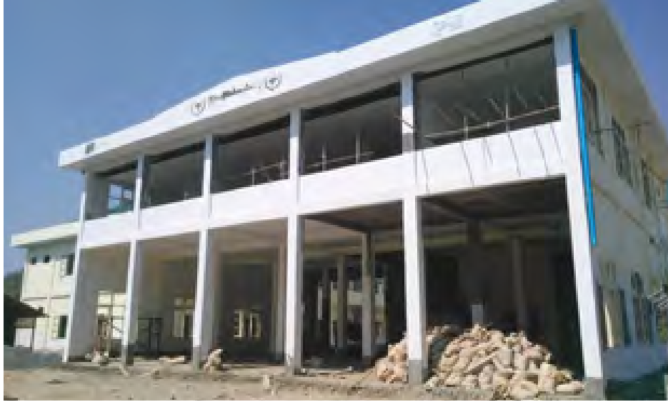
ဆောင်စိုးဝေ(iprd)

မြင်းမူမြို့နယ်မီးသတ်စခန်း အဆောက်အအုံသစ်ကို တိုင်းဒေသကြီးအစိုးရအဖွဲ့၏ ၂၀၁၄-၂၀၁၅ ဘဏ္ဍာရေးနှစ် ရန်ပုံငွေကျပ် ၅၅၀၀ သိန်းဖြင့် တည်ဆောက်ခြင်းဖြစ်ပြီး အလျား ၆၅ ပေ၊ အနံ ၅၂ ပေ၊ အမြင့် ၂၅ ပေရှိ ၅ ယူနစ် သံကွန်ကရစ် နှစ်ထပ်အဆောက်အအုံဖြစ်သည်။ မီးသတ်စခန်းအဆောက်အအုံသစ်အပြင် အလျားပေ ၁၀၀၊ အနံပေ ၄၀၊ အမြင့် ၂၂ ပေရှိ ရှိ လေးခန်းတွဲ သံကွန်ကရစ် နှစ်ထပ်ဝန်ထမ်းအိမ်ရာအဆောက်အအုံ နှစ်လုံးကိုလည်း တိုင်းဒေသကြီးအစိုးရအဖွဲ့ ရန်ပုံငွေ ကျပ်သိန်း ၁၈၀၀ စီဖြင့် ကျော်စွာဆောက်လုပ်ရေးကုမ္ပဏီက တာဝန်ယူဆောင်ရွက်လျက်ရှိပြီး မီးသတ်စခန်းနှင့် ဝန်ထမ်းအိမ်ရာအဆောက်အအုံများအတွက် စုစုပေါင်း ကုန်ကျစရိတ် ကျပ်သိန်း ၅၅၀၀ ဖြစ်ကြောင်း သိရသည်။