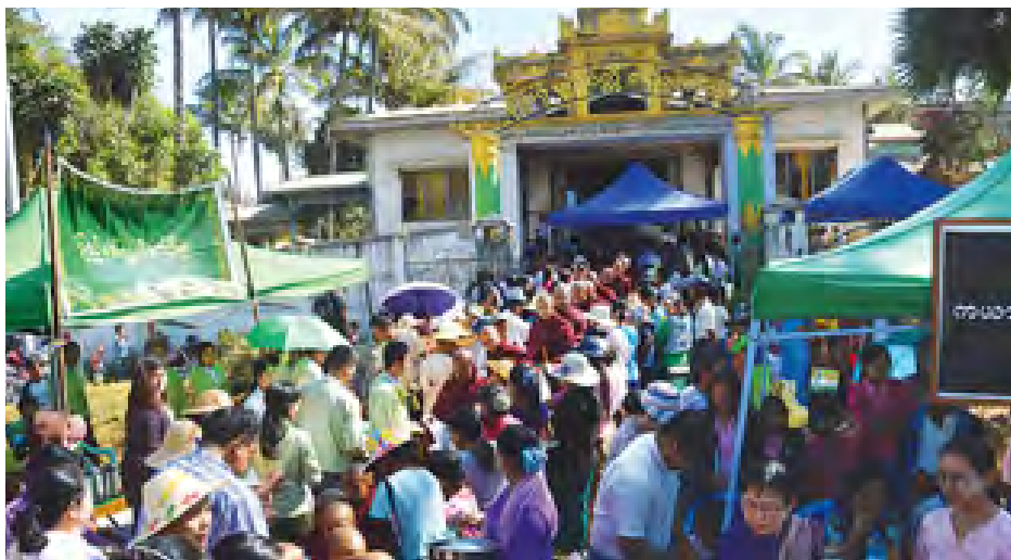
ပြည်နယ်ဝန်ကြီးချုပ် ဦးခင်မောင်ဦး စေတနာရှင်များ စုပေါင်း၍ သိုက်မြိုက်စွာ လောင်းလှူခဲ့ကြကြောင်း သိရသည်။ ရဲအောင်(လွိုင်ကော်)

ကယားပြည်နယ် လွိုင်ကော် မြို့ တောင်ကွဲစေတီတော်မြတ်ကြီး၏ ပရိဝုဏ်ပတ်လည်တွင် နှစ်စဉ် ကျင်းပသော (၄၆) ကြိမ်မြောက် မြို့လုံးကျွတ် ဆွမ်းဆန်တော်လောင်း လှူပွဲကို မတ် ၄ ရက် (တပေါင်းလပြည့်နေ့) မွန်းလွဲ ၂ နာရီက အဆိုပါ တောင်ကွဲစေတီတော် ပရိဝုဏ် အတွင်း၌ စည်ကားသိုက်မြိုက်စွာ ကျင်းပခဲ့သည်။