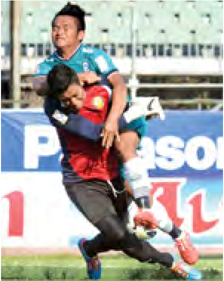
ရန်ကုန်နှင့် ဇေယျာရွှေမြေတို့ အကြိတ်အနယ်ယှဉ်ပြိုင်စဉ်။

သတင်း-ညီမြတ်သော်တာ > ဓာတ်ပုံ- ဖိုးသော်ဇင် ပွဲတွင်လည်း အခက်အခဲမရှိ ရိုးပြတ်နိုင်ပွဲထပ်မံရယူနိုင်ခဲ့သည်။ ရန်ကုန်အသင်းသည် စံချိန်တင်ကိုးပွဲဆက်အနိုင်ရလဒ်နှင့်အတူ ထိပ်ဆုံးနေရာ၌ ဆက်လက်ဦးဆောင်နိုင်ခဲ့ပြီး တိုက်စစ်မှူးဆီဇာကလည်း ယခုရာသီ ဒုတိယမြောက်ဟက်ထရစ်ရယူနိုင်ခဲ့သည်။ ဒဏ်ရာပြဿနာရှိနေသည့် တိုက်စစ်မှူး ကျော်ကိုကိုမှ လွဲ၍လူစုံပါဝင်လာသည့် ရန်ကုန်အသင်းသည် အိမ်ကွင်း၌ ပွဲစကတည်းက ဖိကစားနိုင်ခဲ့သည်။ ဇေယျာရွှေမြေအသင်းသည် ပွဲစကတည်းက ခံစစ်အသားပုံစံဖြင့် ကစားခဲ့ရာ ရန်ကုန်အသင်း စိတ်ကြိုက်ဖိကစားနိုင်ခဲ့သည်။ ၂၃ မိနစ်တွင် စာမျက်နှာ ၁၁ ကော်လံ ၅ ❁