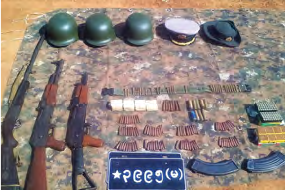
တပ်မတော်စစ်ကြောင်းများ ရှင်းလင်းဆောင်ရွက်ရာမှ သိမ်းဆည်းရမိသည့် လက်နက်ခဲယမ်းများနှင့် ပစ္စည်းများကို တွေ့ရစဉ်။ (မြဝတီ)