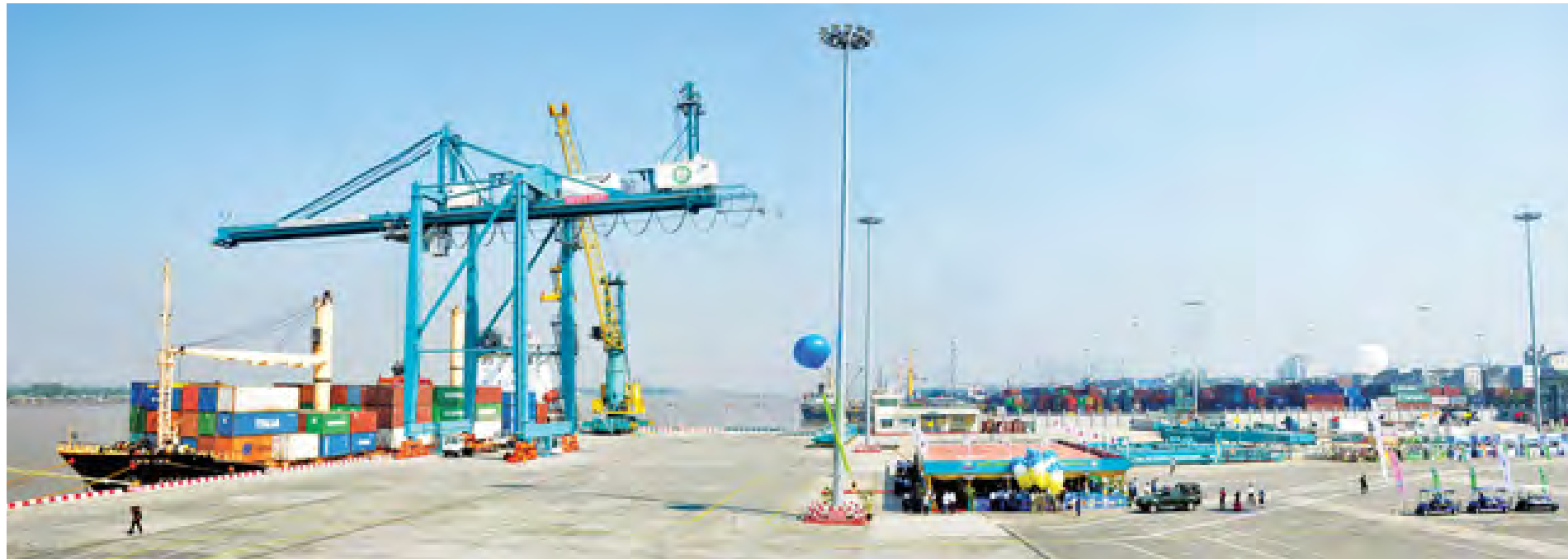
အမှတ် (၁) အလုံအပြည့်ပြည်ဆိုင်ရာဆိပ်ကမ်းကို တွေ့ရစဉ်။ (သတင်း၊ စာမျက်နှာ-၉)

မြန်မာနိုင်ငံလို ဒီမိုကရေစီ စတင်အုတ်မြစ်ချနေတဲ့ နိုင်ငံတစ်နိုင်ငံအတွက် မီဒီယာများရဲ့အခန်းကဏ္ဍဟာလည်း အလွန်ပဲ အရေးကြီးပါတယ်။ အထူးသဖြင့် မီဒီယာများအနေနဲ့ မိမိဖော်ပြတဲ့သတင်းတွေအပေါ်မှာ တာဝန်ယူမှု၊ တာဝန်ခံမှုရှိခြင်း၊ မျှတစွာဖော်ပြခြင်း စတဲ့ မီဒီယာကျင့်ဝတ်များနဲ့ ပြည့်စုံဖို့ လိုအပ်ပါတယ်။ ဒါမှသာလျှင် ဒီမိုကရေစီဖွံ့ဖြိုးတိုးတက်မှုအတွက် အထောက်အကူပြုနိုင်မှာ ဖြစ်ပါတယ်။ (နိုင်ငံတော်သမ္မတ၏ ၂၀၁၄ ခုနှစ်၊ နိုဝင်ဘာလ ၅ ရက်နေ့ ရေဒီယိုမိန့်ခွန်းမှ ကောက်နုတ်ချက်)