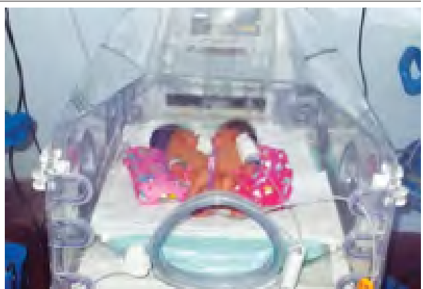
ကြည်မင်းစိုး

အခမ်းအနားအပြီးတွင် ဂုဏ်ထူး ဆောင်နာယကနှင့် ဧည့်သည်တော် များသည် အစည်းအဝေးခန်းမ အတွင်း ခင်းကျင်းပြသထားသည့် အမျိုးသမီးများဖွံ့ဖြိုးတိုးတက်ရေး ဆောင်ရွက်မှု မှတ်တမ်းဓာတ်ပုံများ၊ အမျိုးသမီးနှင့် ကလေးသူငယ်ဆိုင် ရာကော်မတီ၏ လှုပ်ရှားမှု မှတ်တမ်း ဓာတ်ပုံများနှင့် အမျိုးသမီးသက် မွေးပညာသင်တန်းကျောင်းနှင့် အိမ် တွင်းမှုသက်မွေးလုပ်ငန်းသင်တန်း ကျောင်းများမှ ထုတ်လုပ်သည့် ထွက် ကုန်များကို လှည့်လည်ကြည့်ရှု အားပေးခဲ့ကြသည်။ (သတင်းစဉ်)