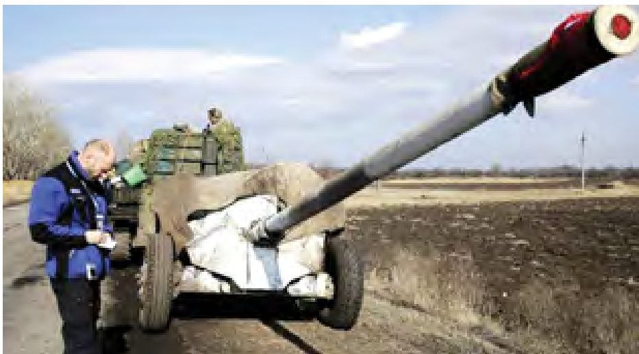
ကိုယ်ကပ်စ် မတ် ၈

အပစ်အခတ်ရပ်စဲရေး သဘောတူစာချုပ်အရ ရှေ့တန်းစစ်မျက်နှာမှ လက်နက်ကြီးများအားလုံး ပယ်ရှားပြီးပြီဖြစ်ကြောင်း ယူကရိန်းအရှေ့ပိုင်း