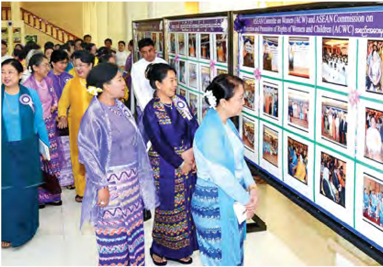
နိုင်ငံတော်သမ္မတ ဦးသိန်းစိန်၏ဇနီး မြန်မာနိုင်ငံအမျိုးသမီးရေးရာအဖွဲ့ချုပ် ဂုဏ်ထူးဆောင်နာယက ဒေါ်ခင်ခင်ဝင်းနှင့် တာဝန်ရှိသူများ ခင်းကျင်း ပြသထားသည့် မြန်မာအမျိုးသမီးများ ဖွံ့ဖြိုးတိုးတက်ရေးဆောင်ရွက်မှုမှတ်တမ်းဓာတ်ပုံများအား ကြည့်ရှုအားပေးစဉ်။ (သတင်းစဉ်)