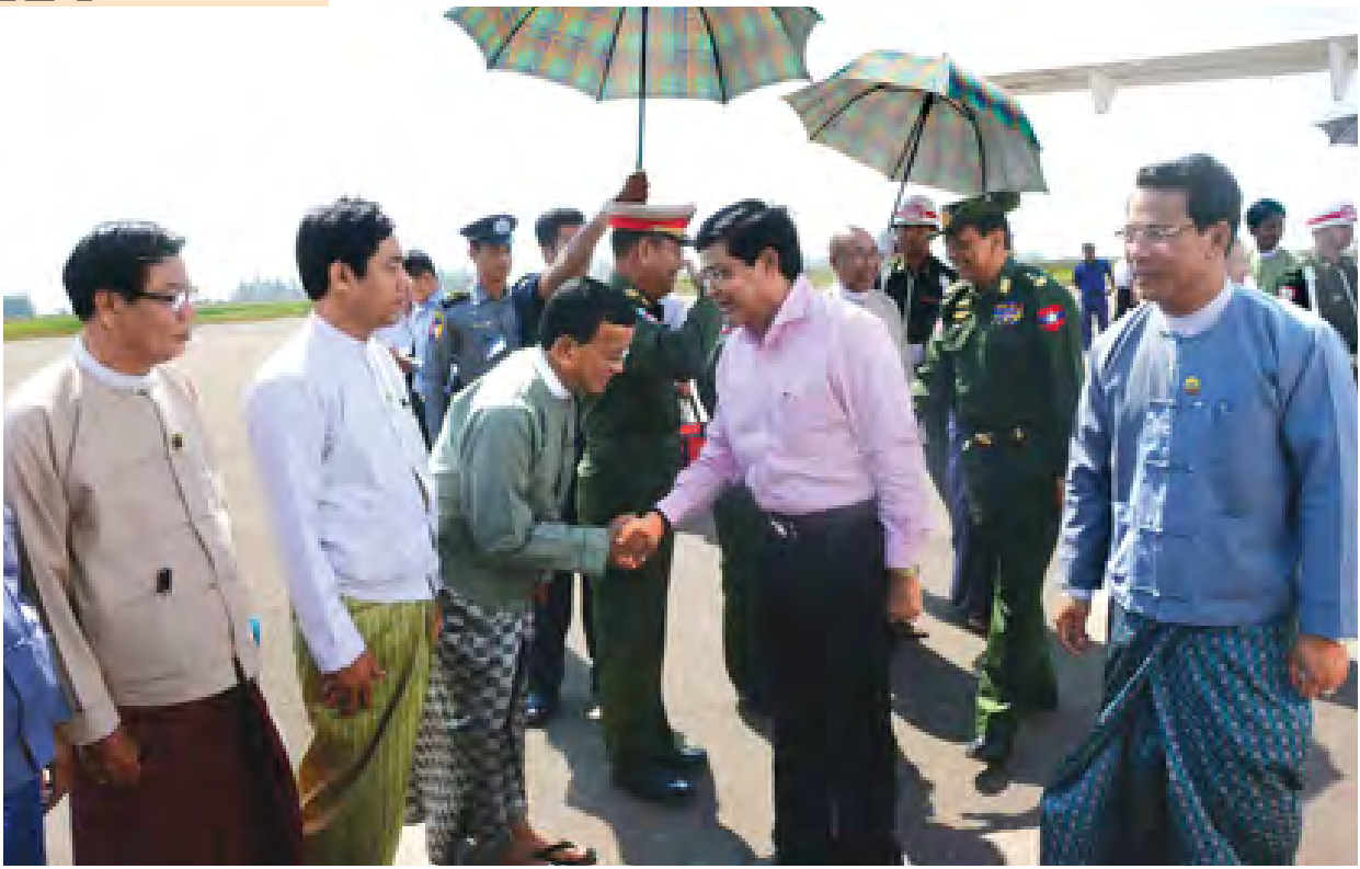
ဒုတိယသမ္မတ ဦးဉာဏ်ထွန်း စစ်တွေမြို့သို့ရောက်ရှိရာ ဒေသခံများက ကြိုဆိုနှုတ်ဆက်စဉ်။ (သတင်းစဉ်)

ဆက်လက်၍ ရေအရင်းအမြစ် နှင့် မြစ်ချောင်းများဖွံ့ဖြိုးတိုးတက် ရေးဦးစီးဌာနမှ ပြည်နယ်ဦးစီးမှူး ဦးမောင်မောင်နိုင်က စစ်တွေမြို့ မြို့လယ်ချောင်းရေစီးရေလာ ကောင်း မွန်ရေးနှင့် ကုလားတန်မြစ်ဆုံ ချောင်းဝ သာယာလှပရေးအတွက် အရှည်ပေ ၂၂၅၀ ပိုင်ရှိက်၍ကျောက် ကြီးနှင့် မြေထိန်းနံရံဆောင်ရွက်နေ မှု မြို့လယ်ချောင်းတံတားမှ ကုလား တန်မြစ်ဘက်သို့ အလျားပေ ၁၁၅၀ ရေစီးရေလာကောင်းမွန်ရေး ဆောင်ရွက်နေမှုနှင့် ကုလားတန်မြစ် ကြောင်းတစ်လျှောက် ဆက်ရိုးကျ ချောင်းဝမှ ကုလားတန်မြစ်ကြောင်း စီမံကိန်းဆိုင်ကမ်းအထိ မြို့ပြ မြေယာတိုးချဲ့ဖော်ထုတ်ရေး စီမံကိန်း လုပ်ငန်းများ ဆောင်ရွက်နေမှု၊ ပြီးစီး မှု စီမံကိန်းလုပ်ငန်းဆောင်ရွက်ပြီး ပါက ဖြစ်ထွန်းလာမည့် အခြေအနေ၊ ဒေသခံပြည်သူများအတွက် ရရှိနိုင် မည့်အကျိုးကျေးဇူးများ၊ ဟိုတယ် နှင့် ခရီးသွားလုပ်ငန်း ဖွံ့ဖြိုးတိုးတက် မှု မြို့ပြအိမ်ရာ တိုးတက်ဖွံ့ဖြိုးမှု များကို အသေးစိတ် ရှင်းလင်းတင်ပြ သည်။