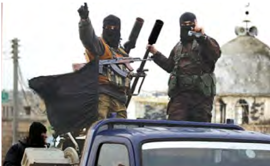
အာဆတ်ကိုဖြုတ်ချရန် တိုက်ပွဲဝင် နေသော အင်အားအကြီးဆုံးအုပ်စုများ အနက် တစ်ခုဖြစ်သည်။ အဓိကတိုက်ခိုက်မှုတွင် ဗုဒ္ဓဟူး

အဆိုပါ နူဆရာတပ်ဦးသည် ဆီးရီးယားသမ္မတ ဘာရှာအယ်လ်