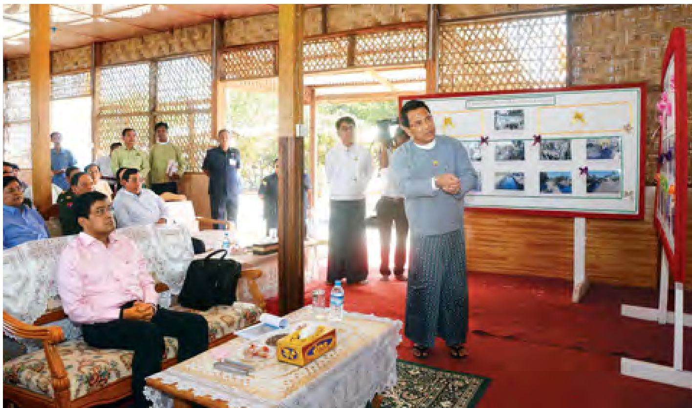
ဒုတိယသမ္မတ ဦးညွှတ်ထွန်းအား ကုလားတန်မြစ်ကြောင်းတစ်လျှောက် မြို့ပြဖွံ့ဖြိုးစီမံကိန်းဆောင်ရွက်မှုနှင့်ပတ်သက်၍ ရခိုင်ပြည်နယ် ဝန်ကြီးချုပ် ဦးမောင်မောင်အုန်း ရင်းလင်းတင်ပြစဉ်။

စီမံကိန်းလုပ်ငန်းများကြောင့် ကုလားတန် မြစ်ရေ ညစ်ညမ်းမှုမရှိစေရေး၊ ရေလမ်းကြောင်းများ ထိခိုက်မှုမရှိစေရေး၊ မြစ်ကြောင်းသဘာဝအလှများကို အကျိုးရှိရှိအသုံးပြုနိုင်စေရေးအတွက် သက်ဆိုင်ရာ အဖွဲ့အစည်းများက သဘာဝပတ်ဝန်းကျင်ထိန်းသိမ်း ရေးအဖွဲ့များနှင့် ညှိနှိုင်းဆောင်ရွက်