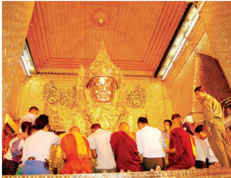
ရှေးဗုဒ္ဓ ပုထိုးတော်ကြီးကို ဝတ်တော်မူနေကြသည့် ဘုရားရှင်များနှင့် အသင်းများသည် ဘုရားရှင်တော်ကြီးကို ဝတ်တော်မူနေကြသည်။