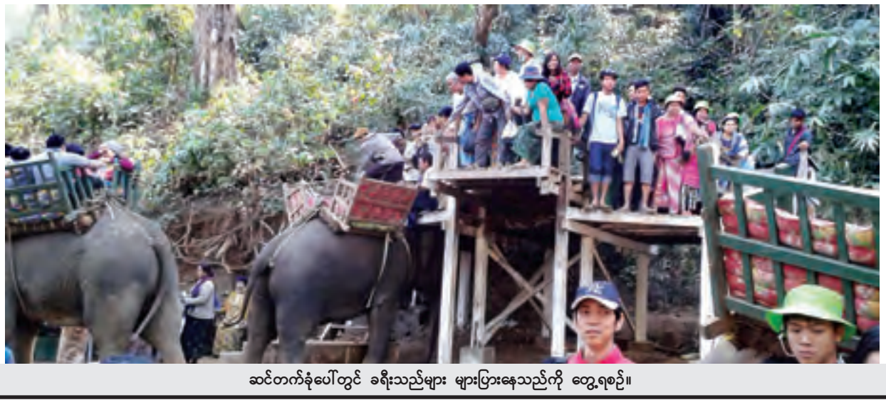
ဆင်တက်ခုံပေါ်တွင် ခရီးသည်များ များပြားနေသည်ကို တွေ့ရစဉ်။

ကောင်းတာပေါ့”ဟု ကိုယ်တိုင်ကြို တွေ့ခဲ့ရသူ ဘုရားဖူးတစ်ဦးကပြော သည်။ အလောင်းတော်ကသပ စံ ကျောင်းတော်သည် မုံရွာမြို့မှ ၅၂ မိုင်ခန့်ကွာဝေးပြီး နှစ်စဉ် နတ်တော် လအတွင်း ဘုရားဖူးခရီးစဉ်စတင်၍ တန်ခူးလ သင်္ကြန်အပြီးတွင် ပိတ်သိမ်း လေ့ရှိသည်။ ယခုအခါ အလောင်း တော်ကသပ ဘုရားဖူးယာဉ်ရပ်နား စခန်းမှ စံကျောင်းတော်သို့ သစ်တော ဦးစီးဌာန သစ်ထုတ်လုပ်ရေးမှ ဆင်ကောင်ရေ ၄၀ ခန့်ဖြင့် ဘုရား ဖူးခရီးသည်များအား ပို့ဆောင်ပေး လျက်ရှိသည်။ မန်း(ကိုယ်ပွား)