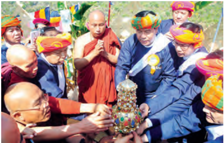
မွန်းလွဲပိုင်းတွင် လှူဒါန်းမှုအစစု တို့အတွက် ရေစက်သွန်းချအမျှပေးဝေ ခဲ့ကြသည်။ အဆိုပါ စေတီတော်မြတ် ကြီးကို အရှင်ပေါရိသ ဟိုပုံးကိုရင်

ယင်းနောက် ဆရာတော်၊ သံဃာ တော်များက တံခွန်၊ ကုက္ကား၊ မုလေး ပွားတို့ဖြင့် စေတီတော်မြတ်ကြီးအား ဗုဒ္ဓါဘိသေက အနေကဇာတင်တော် မူကြပြီး တာဝန်ရှိသူများက နေ့ဆွမ်း ဆက်ကပ်လှူဒါန်းကြသည်။