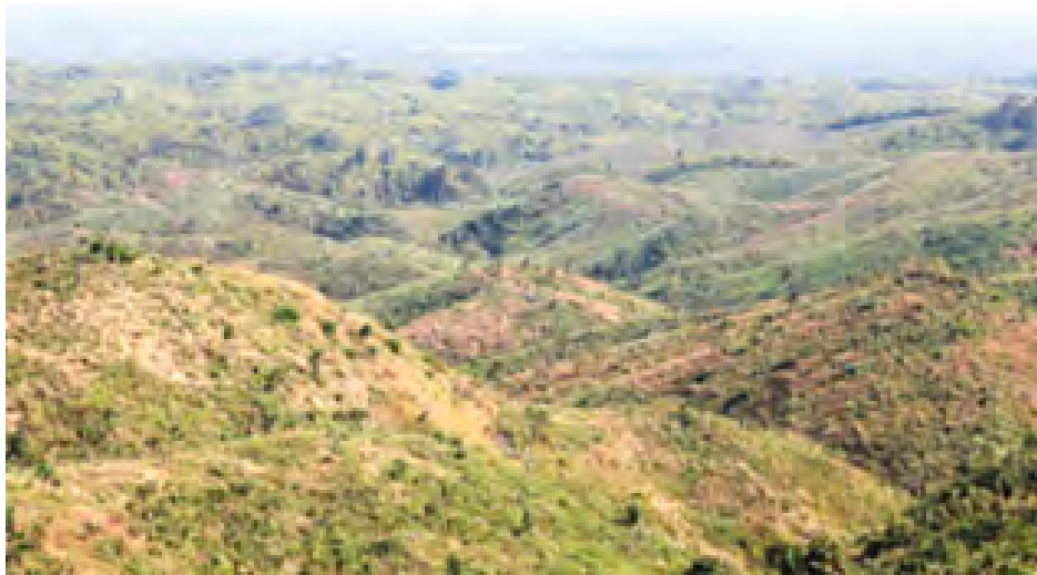
အတိုင်းအတာအားဖြင့် သစ်တော ကြောင်း စစ်တမ်းများအရသိရပြီး တွယ်သင့်ကြောင်း သုံးသပ်မှုများ ဧရိယာများစွာ ကျဆင်းလျက်ရှိကာ သစ်တောများထိန်းသိမ်းရေးအတွက် လည်း ရှိနေသည်။ ၄၇ ရာခိုင်နှုန်းကျော်သာ ရှိတော့ အောက်ခြေတွင် ထိရောက်စွာ ကိုင် ကိုလွင်(ဆွာ)

တရားမဝင်ကျွန်းသစ် ထုတ်ယူ ကြရာ၌ သစ်တောကြီးပိုင်းဒေသနေ သူများက ယာစိုက်ခင်းအတွင်းရှိ အပင်များကို တစ်နှစ်ကြိုတင်၍ အပင်သတ်ခြင်း ဆောင်ရွက်ရာ တစ်ပင်လျှင် ငွေကျပ် ၅၀၀ ဖြင့် ပြန်လည်ရောင်းချကြောင်း၊ ရေတာ ရှည်မြို့နယ်တွင် စကျေး(မရိုးခုံ) ဆိပ်ဆင်း၊ မြောင်သာမုတစ်ဆင့် ဖားအိုင်းပြေး ၁၅ မိုင်ကုန်းပင်-သာဂရ ရိုးမဖြတ်ကျော် ကားလမ်းအတိုင်း တရားမဝင် သစ်ထုတ်လုပ်မှုများရှိ နေဆဲဖြစ်ကြောင်း ဒေသခံများ၏ ပြောကြားချက်အရ သိရသည်။ မြန်မာနိုင်ငံတွင် တစ်နိုင်လုံး