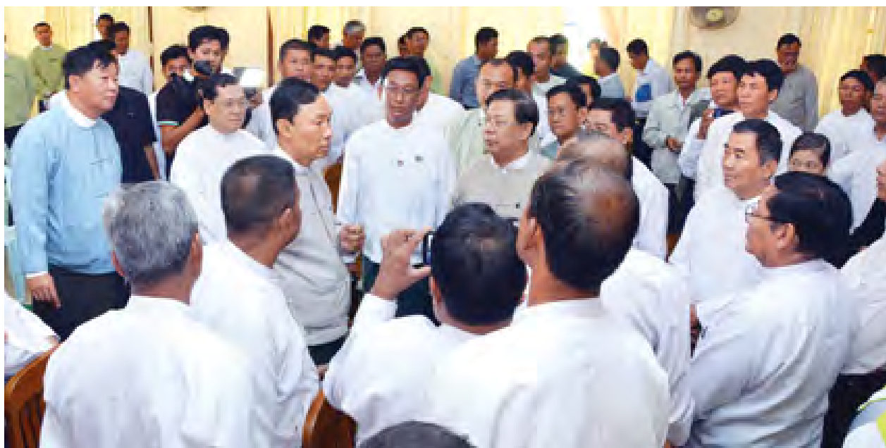
မည်ဖြစ်ပါကြောင်း။

ရေး၊ ဖွံ့ဖြိုးတိုးတက်ရေးကိစ္စရပ်များကို ပို၍ ပို၍ စည်ပင်သာယာလာအောင် မှန်မှန်ကန်ကန်စနစ်တကျ အသုံးပြုမည်ဖြစ်ကြောင်း၊ ယနေ့အချိန်ကာလသည် ယခင်ကထက် ဖွံ့ဖြိုးတိုးတက်အောင် ဆောင်ရွက်နိုင်သည့်အခွင့်အလမ်းများ ရှိပါကြောင်း၊ ရပ်ကွက်၊ ကျေးရွာအုပ်ချုပ်ရေးမှူးများသည် ပြည်သူများက ရွေးချယ်ထားသည့် ပြည်သူ့ကိုယ်စားလှယ်များ ဖြစ်သည်နှင့်အညီ မိမိရပ်ကွက်၊ ကျေးရွာကို မှန်ကန်မှုတစွာ စီမံအုပ်ချုပ်ရန် လိုအပ်ပါကြောင်း။