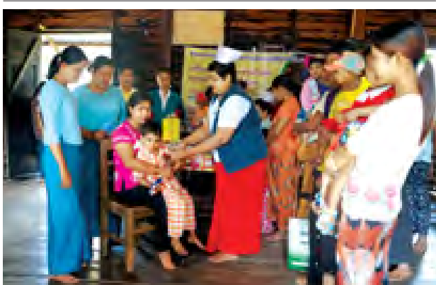
နိုင်ငံတစ်ဝန်း အရှိန်အဟုန်ဖြင့်ဆောင်ရွက်လျက်ရှိသော ဝက်သက်ဂျီကိုသိုး ကာကွယ်ဆေးထိုးလုပ်ငန်းများကို ဖေဖော်ဝါရီ ၂၅ ရက်က သာယာဝတီခရိုင် မင်းလှမြို့အမှတ် (၇) ရပ်ကွက် အမက ပြည်တော်သာကျောင်း၌ ကျန်းမာရေး ဝန်ထမ်းများက ပြည်သူလူထုအခြေပြု ကလေးများကို ကာကွယ်ဆေး ထိုးနှံပေးစဉ်။