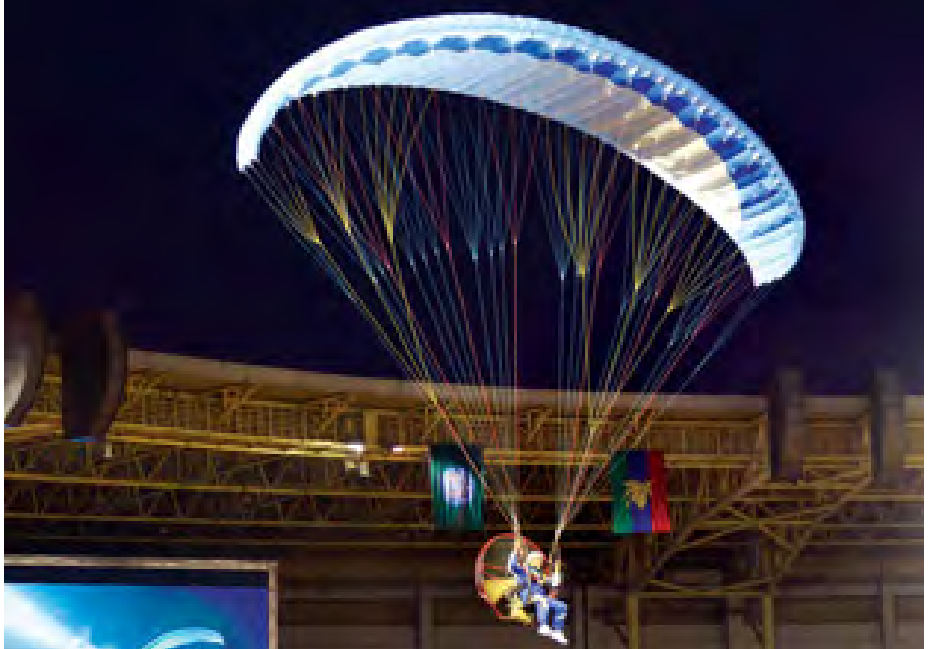
အမျိုးသားအားကစားပွဲတော် ပိတ်ပွဲအခမ်းအနားကျင်းပစဉ်။

တိုင်းရင်းသားညီအစ်ကိုမောင်နှမထမ်းဆောင်ကြသော အဖွဲ့ချုပ်များမှ ဥက္ကဋ္ဌနှင့် တာဝန်ရှိသူများ၊ ဒိုင်များ၊ ဂျူရီများ၊ အုပ်ချုပ်သူများ၊ နည်းပြများ၊ ကစားသမားများအားလုံးကို အထူးကျေးဇူးတင်ရှိပါကြောင်းကို မှတ်တမ်းတင်ပြောကြားလိုကြောင်း။ စင်ကာပူနိုင်ငံတွင် မကြာမီကျင်းပမည့် (၂၈) ကြိမ်မြောက် အရှေ့တောင်အာရှ အားကစားပြိုင်ပွဲနှင့် (၈) ကြိမ်မြောက် အာဆီယံမသန်မစွမ်းအားကစားပြိုင်ပွဲများတွင် အောင်မြင်မှုရရှိရေးအတွက် ရည်ရွယ်ပြီး ကြိုတင်ပြင်ဆင်သည့် အနေဖြင့် ယခုအမျိုးသားအားကစားပြိုင်ပွဲကို ကျင်းပခဲ့ခြင်းဖြစ်သည့်အတွက် ရည်ရွယ်ချက်များအတိုင်း ပေါက်မြောက်အောင်မြင်ရန် အရှိန်အဟုန်မပြတ် ဆက်လက်လေ့ကျင့်ပြင်ဆင်သွားကြရန် တိုက်တွန်းလိုပါကြောင်း။ လေ့ကျင့်သားပြည့်ဝမှု၊ စံချိန်စံညွှန်းကောင်းမွန်မှု၊ ကာယကြံ့ခိုင်မှု၊ ဉာဏ်ရည်ထက်မြက်မှု၊ စည်းလုံးညီညွတ်မှု၊ ဇွဲလုံ့လရှိမှု၊ စည်းကမ်းလိုက်နာမှု၊ စာရိတ္တကောင်းမွန်