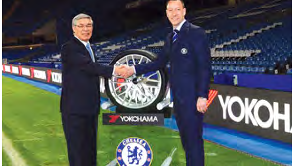
အသင်းဟာ ပရီမီယာလိဂ်မှာ အမှတ်လေးဇယား ထိပ်ဆုံးရောက်နေတဲ့ အပြင် ချန်ပီယံလိဂ် ၁၆ သင်း ပြိုင်ပွဲမှာလည်း နောက်တစ်ဆင့်တက်ဖို့ အလားအလာကောင်းနေပါတယ်။ အနောက်လန်ဒန်ကလပ် ချယ်လ်ဆီး အသင်းဟာ ကမ္ဘာမှာ လူသိအများဆုံး အသင်းတစ်သင်းဖြစ်ပြီး ပရိသတ်အင်အား သန်း ၅၀၀ ရှိတယ်လို့ ဆို

အင်္ဂလိပ် ဘောလုံးလောကရဲ့ ဒုတိယအကြီးဆုံး ရှုပ်အင်္ကျီစပွန်ဆာ စာချုပ်ကို ချယ်လ်ဆီးအသင်းက ချုပ်ဆိုနိုင်ခဲ့ပါတယ်။ ချယ်လ်ဆီးအသင်းဟာ ဒီစာချုပ်ကို ဂျပန်ကား တာယာထုတ်လုပ်ရေး ကုမ္ပဏီတစ်ခုနဲ့ ချုပ်ဆိုလိုက်တာပါ။ ဒီစာချုပ်အတွက် ချယ်လ်ဆီးက တစ်နှစ်ကို ပေါင်သန်း ၄၀ ရရှိမှာဖြစ်ပါတယ်။ ယိုကိုဟားမားရော်ဘာ ကုမ္ပဏီက ၂၀၀၆ ခုနှစ်က ဆင်ဆောင်းနဲ့ တစ်နှစ်ပေါင် ၁၈ သန်းပေးချုပ်ဆိုတဲ့ စာချုပ်ကို ကျော်ဖြတ်ပြီး တစ်နှစ်ပေါင်သန်း ၄၀ နဲ့ ငါးနှစ်စာချုပ်လိုက်တာဖြစ်ပါတယ်။ မန်ယူက အမေရိကန် ကားထုတ်လုပ်ရေးကုမ္ပဏီ ရှယ်ဗရီလက်နဲ့ တစ်နှစ်ပေါင် သန်း ၅၀ နဲ့ အများဆုံး ချုပ်ဆိုထားပြီး ခုနှစ်နှစ်စာချုပ်ထားပါတယ်။ ချယ်လ်ဆီး