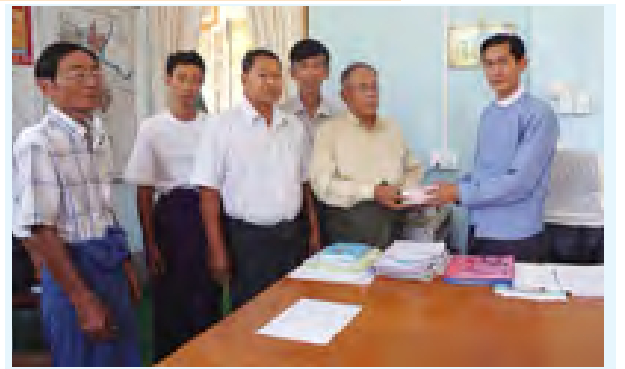
ရင်းပြည်နယ်(မြောက်ပိုင်း) လောက်ကိုင်တိုက်ပွဲရှောင်ပြည်သူများအတွက် မော်လမြိုင် အမှတ်(၂) ဈေးသူဈေးသားများနှင့်ဖြူစင် မေတ္တာစေတနာရှင် ဆေးလျှော့ခြင်းရေးအဖွဲ့က မွန်ပြည်နယ်အစိုးရအဖွဲ့ထံ အလှူငွေကျပ် ၁၀ သိန်း လာရောက်ပေးအပ်လျှောက်ခြင်းရာ စည်ပင်သာယာရေးဝန်ကြီးဒေါက်တာတိုးတိုးအောင်က လက်ခံရယူစဉ်။ (မြန်မာ့အလင်း)