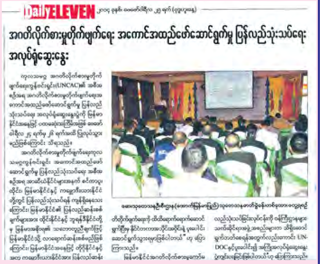
အဂတိလိုက်စားမှုတိုက်ဖျက်ရေးကော်မရှင်က အကောင်အထည်ဖော်ဆောင်ရွက်မှု ပြန်လည်သုံးသပ်ရေး အလုပ်ရုံဆွေးနွေးနေကြောင်း ဖော်ပြထားသည့် ဖော်ပြချက်များကို မြန်မာနိုင်ငံစာနယ်ဇင်းကောင်စီ(ယာယီ)က ဖြေရှင်းပေးရန် စာရေးသားရခြင်းဖြစ်ကြောင်း သိရသည်။