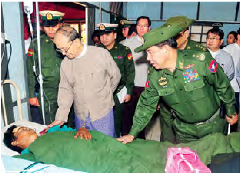
နိုင်ငံတော်သမ္မတ ဦးသိန်းစိန် လောက်ကိုင်ဒေသတိုက်ပွဲတွင် နိုင်ငံတော်အတွက် တိုက်ပွဲဝင်ကာကွယ်ခဲ့သည့် ဒဏ်ရာရ အရာရှိ၊ စစ်သည်များ၏ မိသားစုဝင်များအား အားပေးစကားပြောကြားစဉ်။ (သတင်းစဉ်)

အားပေးစကားပြောကြားသည်။ ယင်းနောက် နိုင်ငံတော်သမ္မတနှင့်အဖွဲ့ဝင်များသည် မန်ဆူကျောင်းဆရာတော်အား ဖူးမြော်ကြည်ညိုပြီး တိုက်ပွဲရှောင် ဒုက္ခသည်များအတွက်