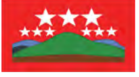
ဓနအမျိုးသားများအဖွဲ့ချုပ်ပါတီ၏အလံပုံစံ