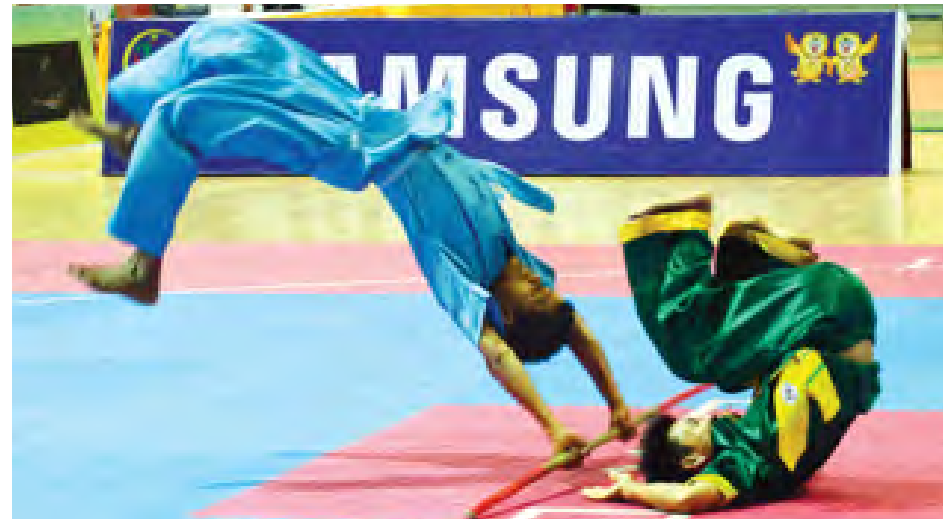
မြန်မာ့သိုင်းစွမ်းရည်မြှင့်ပွဲ၏ ပြကွက်တစ်ခု။

၂၀၁၅ ခုနှစ် စတုတ္ထအကြိမ်မြောက် အမျိုးသားအားကစားပွဲတော်ကို ယနေ့နံနက်ပိုင်းတွင် ဆက်လက်ကျင်းပရာ ကရာတေးဒို၊ မြန်မာ့သိုင်း၊ ဘောလုံး၊ ဘတ်စကက်ဘော၊ ဖူဆယ်၊ အလေးမ၊ ပိုက်ကျော်ခြင်း၊ လက်ဝှေ့နှင့် ဘော်လီဘောပြိုင်ပွဲများကို နေပြည်တော်ရှိ သတ်မှတ်ထားသည့်နေရာများ၌ ယှဉ်ပြိုင် ကြသည်။