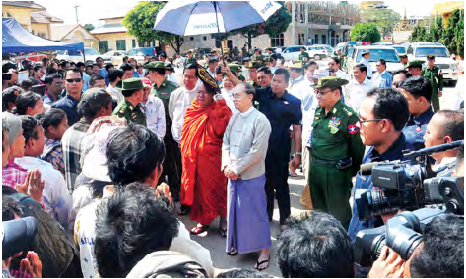
နိုင်ငံတော်သမ္မတ ဦးသိန်းစိန် သီရိမင်္ဂလာမင်္ဂလာရမ်းကျောင်းတိုက်၌ တိုက်ပွဲရှောင်ဒုက္ခသည်များအား ရင်းနှီးနှေးနှေးစွာ အားပေးစကားပြောကြားစဉ်။ (သတင်းစဉ်)

ယင်းနောက် နိုင်ငံတော်သမ္မတနှင့် အဖွဲ့ဝင်များသည် လောကီကိုင်ဒေသတိုက်ပွဲများ၌ နိုင်ငံတော်အတွက် ရဲဝံ့စွန့်စားစွာ တိုက်ပွဲဝင်ကာကွယ်ခဲ့ရာမှ ထိခိုက်ဒဏ်ရာ ရရှိခဲ့သော တပ်မတော်သားအရာရှိ၊ စစ်သည်များနှင့် မိသားစုဝင်များအား လားရှိုးတပ်နယ် တပ်မတော်ဆေးရုံ၌ သွားရောက်တွေ့ဆုံပြီး တစ်ဦးချင်းစီ တွေ့ဆုံအားပေးကာ ဂုဏ်ပြုငွေကျပ်သိန်း ၁၀၀ နှင့် လက်ဆောင်ပစ္စည်း၊ စားသောက်ဖွယ်ရာများကို ပေးအပ်ကြသည်။ ထို့နောက် နိုင်ငံတော်သမ္မတနှင့် အဖွဲ့ဝင်များသည် တပ်မတော်ဆေးရုံရှိ တပ်မှူးခန်းမ၌ ကျဆုံးစစ်သည်များ၏ မိသားစုဝင်များအား တွေ့ဆုံပြီး ထောက်ပံ့ငွေကျပ် ၁၅ သိန်းကို ပေးအပ်ကာ အားပေးစကား ပြောကြားသည်။ ယင်းနောက် နိုင်ငံတော်သမ္မတနှင့်အဖွဲ့ဝင်များသည် ကိုးကန့်သောင်းကျန်းသူများက အရပ်ဘက်ယာဉ်တန်းများအား ပစ်ခတ်တိုက်ခိုက်မှုကြောင့် ထိခိုက်ဒဏ်ရာရရှိခဲ့ကြသည့် အရပ်သားများနှင့် ပညာရေးဝန်ထမ်းများအား ကြည့်ရှုအားပေးပြီး စာမျက်နှာ ၈ ကော်လံ ၁ *