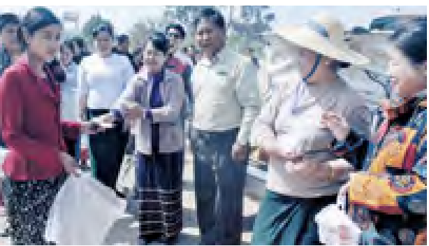
နှင့်ဝန်ထမ်း ၅၇၀၀ တို့ကို ငွေကြေးနှင့် ထမင်းထုပ် စားဖွယ်များကို မြို့အဝင်မုခ်ဦးမှ စောင့်ကြိုလှူဒါန်းခဲ့ကြပြီး ဆက်လက်ရောက်ရှိလာမည့် တိုက်ပွဲရှောင်သွေးချင်းများကိုလည်း ကြိုဆိုလျက် ကူညီပံ့ပိုးသွားမည်ဖြစ်ကြောင်း သိရသည်။ စိုင်း(သီပေါ)