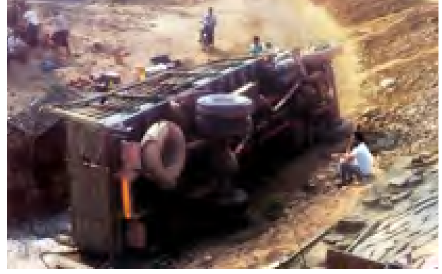
ငွေအိုး(ကသာ)

အင်းတော် ဖေဖော်ဝါရီ ၂၅ ကသာခရိုင် အင်းတော်မြို့နယ် နဘားကျေးရွာရဲကင်းနှင့် ခုနစ်မိုင်အကွာတွင် ဖေဖော်ဝါရီ ၂၁ ရက် ညနေ ၄ နာရီက ဆီသယ်ယာဉ်ကားတစ်စီး တိမ်းမှောက်မှုဖြစ်ပွားခဲ့ကြောင်း သိရသည်။ ဖြစ်စဉ်မှာ အင်းတော်မြို့နယ် နဘားကျေးရွာရဲကင်းစခန်းမှူး တာဝန်ထမ်းဆောင်နေစဉ် အင်းတော်-ကသာကားလမ်း မိုင်တိုင်အမှတ် ၁၁/၁ တံတားအမှတ် ၁/၁၂ တွင် ယာဉ်တိမ်းမှောက်မှု သတင်းအရ သွားရောက်ကြည့်ရှုစစ်ဆေးရာ ယာဉ်အမှတ် ၁၁/ --- NISSAN အဖြူရောင်တစ်စီး ဒီဇယ်ဆီပိ အလုံး ၆၀ ဖြင့် တိမ်းမှောက်နေ၍ မေးမြန်းရာ ယာဉ်မောင်းကော်မင်းထက် (၃၂၅၆) မြို့သစ်(၁) စစ်မှုထမ်းဟောင်းရပ်ကွက် မိတ္ထီလာမြို့နေသူမှာ ကသာမှ ဖားကန့်သို့ ဒီဇယ်ဆီတင်ဆောင်၍ မောင်းနှင်လာစဉ် တံတားကွင်းလမ်းအဆင်းတွင် ဘရိတ်ပေါက်၍ တိမ်းမှောက်လဲသွားခဲ့ခြင်း ဖြစ်ကြောင်း သိရသည်။