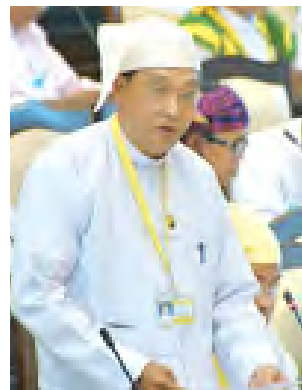
ဒုတိယဝန်ကြီး ဦးမြင့်ဇော် ရှင်းလင်းဖြေကြားစဉ်။ (သတင်းစဉ်)

မှာ ပြည်ထောင်စုတရားသူကြီးချုပ်ထံ ပုဒ်မ ၂၀ အရ လျှောက်ထားမှု မရှိသေးသည့်အတွက် ပြည်ထောင်စုတရားသူကြီးချုပ်က မဆုံးဖြတ်ရသေးသည့်ကိစ္စဖြစ်၍ မေးမြန်းသည့်ပြဿနာကို အထူးအယူခံခံရသူနှင့် ပြန်လည်စစ်ဆေးစီရင်/မစီရင်ကို ကြိုတင်ဖြေကြားနိုင်ခြင်း မရှိပါကြောင်းဖြင့် ရှင်းလင်းဖြေကြားသည်။ တနင်္သာရီတိုင်းဒေသကြီး မဲဆန္ဒနယ်အမှတ် (၅)မှ လွှတ်တော်ကိုယ်စားလှယ် ဦးမောင်စိန်၏ “တနင်္သာရီတိုင်းဒေသကြီး ထားဝယ်ခရိုင် ရေဖြူမြို့နယ် ကံပေါက်ဒေသတွင် PTTEPI ကုမ္ပဏီမှ ခြံစည်းရိုးခတ်ခြင်းကြောင့် ဒေသခံပြည်သူစာမျက်နှာ ၉ ကော်လံ ၁ သို့