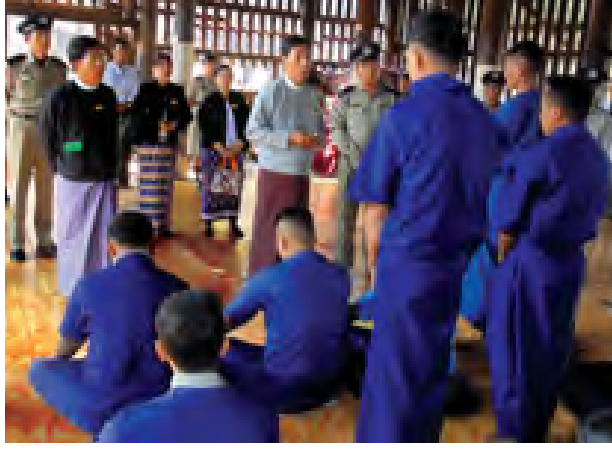
ထို့နောက် ရခိုင်ပြည်နယ်တရား ၂၃ ရက်က ပြည်ထောင်စု တရား သူကြီးချုပ်နှင့်အဖွဲ့သည် ဖေဖော်ဝါရီ စီရင်ရေးဥပဒေနှင့်အညီ သံတွဲ

ရခိုင်ပြည်နယ် တရားသူကြီးချုပ် ဦးကျောက်နှင့် ပြည်နယ်တရား ရေးဦးစီးမှူး ဦးခင်မောင်တို့သည် ပြည်ထောင်စုတရားလွှတ်တော်ချုပ် နှင့် တိုင်းဒေသကြီး / ပြည်နယ်တရား လွှတ်တော်တရားသူကြီးချုပ်များ၊ တိုင်းဒေသကြီး / ပြည်နယ်တရားရေး ဦးစီးမှူးများနှင့် ခရိုင်တရားသူကြီး များ၏ အဋ္ဌမအကြိမ် လုပ်ငန်းညှိနှိုင်း အစည်းအဝေးမှ မှာကြားချက်များ ကို ဖေဖော်ဝါရီ ၂၂ က သံတွဲခရိုင် တရားရုံး၌ ခရိုင်အတွင်းရှိ တရား သူကြီးများအား ရှင်းလင်းပြောကြား သည်။