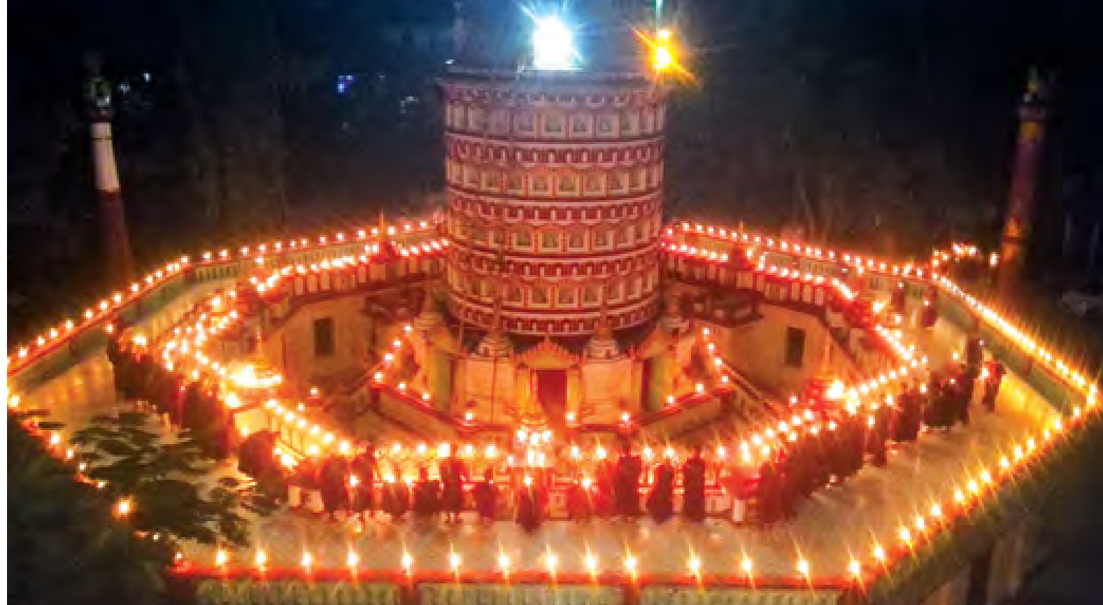
လောက်ကိုင်ဒေသ၌တိုက်ပွဲဝင်နေသည့် တပ်မတော်သားစစ်သည်များအတွက် အန္တရာယ်ကင်းပရိတ်တရားတော်များ ရွတ်ဖတ်ပူဇော်ပွဲနှင့် ဆီမီးထွန်းညှိပွဲကို ယနေ့ညပိုင်းက ပျဉ်းမနားမြို့ မဟာဝိသုတာရာဇ(ဈေးကုန်းကျောင်းတိုက်)၌ ကျင်းပရာ ဈေးကုန်းကျောင်းဆရာတော်ကြီးဦးဆောင်၍ သံဃာတော်များနှင့် ကျောင်းသား ကျောင်းသူများက ဆီမီးများထွန်းညှိစဉ်။ (သတင်း၊ စာ-၅)

နိုင်ငံတော်သမ္မတ ဦးသိန်းစိန် အက်စတိုးနီးယားလွတ်လပ်ရေးနေ့ သဝဏ်လွှာများပေးပို့ နေပြည်တော် ဖေဖော်ဝါရီ ၂၄ ၂၀၁၅ ခုနှစ် ဖေဖော်ဝါရီလ ၂၄ ရက်တွင် ကျရောက်သော အက်စတိုးနီးယားသမ္မတနိုင်ငံ၏ လွတ်လပ်ရေးနေ့အခါသမယ၌ ပြည်ထောင်စုသမ္မတမြန်မာနိုင်ငံတော် နိုင်ငံတော်သမ္မတ ဦးသိန်းစိန်ထံမှ အက်စတိုးနီးယားသမ္မတနိုင်ငံ သမ္မတ မစ္စတာ တိုမာ့စ် ဟင်းဒရစ်ခီအီပက်စ်ထံသို့ ဝမ်းမြောက်ကြောင်း သဝဏ်လွှာပေးပို့သည်။ စာမျက်နှာ ၃ ကော်လံ ၅ *