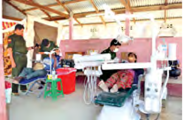
တောင်သာ ဖေဖော်ဝါရီ ၂၃

တောင်သာမြို့နယ်အတွင်းရှိ ဒေသခံပြည်သူများကို တပ်မတော်နယ်လှည့်အထူးကုအဖွဲ့က ကျန်းမာရေးစောင့်ရှောက်မှု လုပ်ငန်းများ အခမဲ့ဆောင်ရွက်ပေးလျက်ရှိရာ ဖေဖော်ဝါရီ ၂၀ ရက်က ဇရပ်ကြီးကျေးရွာဒေသသို့ ရောက်ရှိကုသပေးခဲ့ကြောင်း သိရသည်။