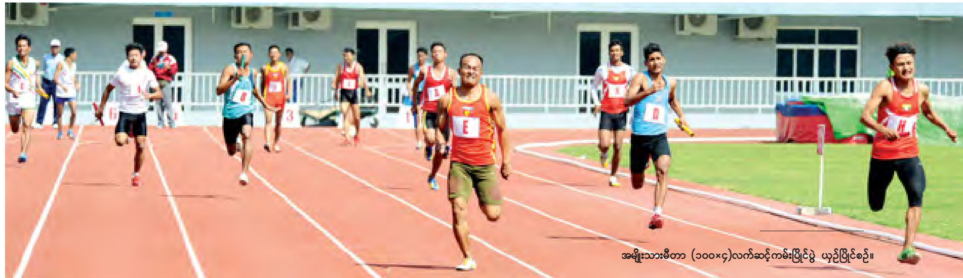
အမျိုးသားမိတာ (၁၀၀x၄)လက်ဆင့်ကမ်းပြိုင်ပွဲ ယှဉ်ပြိုင်စဉ်။

အလုပ်ရှင်၊ အလုပ်သမားမခွဲခြားဘဲ တည်ဆဲဥပဒေများနှင့်အညီ အရေးယူဆောင်ရွက်သွားမည် ရန်ကုန်တိုင်းဒေသကြီးအစိုးရအဖွဲ့ သတင်းထုတ်ပြန်ချက်(၂/၂၀၁၅) ၂၀၁၅ ခုနှစ်၊ ဖေဖော်ဝါရီလ ၂၃ ရက်နေ့ ၁၃၇၆ ခုနှစ်၊ တပေါင်းလဆန်း ၆ ရက် ၁။ ရန်ကုန်တိုင်းဒေသကြီး၊ မြောက်ပိုင်းခရိုင်၊ ရွှေပြည်သာစက်မှုဇုန်နှင့် လှိုင်သာယာစက်မှုဇုန်ရှိ စက်ရုံအချို့ တို့မှ အလုပ်သမားအချို့တို့သည် လုပ်အားခတိုးရလို့မနှစ်မြို့ဘဲ ဆန္ဒပြတောင်းဆိုမှုများအပေါ် ရန်ကုန်တိုင်း ဒေသကြီး အလုပ်သမားရေးရာဦးစီးဌာနနှင့်ဆွေးနွေးအဖွဲ့သည် သက်ဆိုင်ရာ စက်ရုံအသီးသီးမှအလုပ်ရှင်များ၊ အလုပ်သမားကိုယ်စားလှယ်များနှင့် တွေ့ဆုံ၍ ညှိနှိုင်းဆောင်ရွက်ပေးလျက်ရှိကြောင်း၊ ဥပဒေနှင့်မညီညွတ်သော ကိစ္စရပ်များကို ဦးတည်ဆောင်ရွက်သူများကို အလုပ်ရှင်၊ အလုပ်သမားမခွဲခြားဘဲ တည်ဆဲဥပဒေများနှင့်အညီ အရေးယူဆောင်ရွက်သွားမည်ဖြစ်ကြောင်းကို ရန်ကုန်တိုင်းဒေသကြီးအစိုးရအဖွဲ့မှ သတင်းထုတ်ပြန်ချက် (၁/၂၀၁၅) ဖြင့် (၁၇-၂-၂၀၁၅) ရက်နေ့က ထုတ်ပြန်၍ သတိပေးခဲ့ပါသည်။ ၂။ (၂၀-၂-၂၀၁၅) ရက်နေ့က ရွှေပြည်သာမြို့နယ်ရှိ စက်ရုံ(၃)ရုံရှိ တွင်းယာယီတဲများထိုး၍ ညအိပ်ခြေပြု ကာ ပိတ်ဆို့ဆန္ဒပြနေသော အစုအဖွဲ့များကိုလည်း မြို့မိမြို့ဖများနှင့်ဥပဒေစိုးမိုးရေးအဖွဲ့များက ညှိနှိုင်းဖျက်ဖြေ ခဲ့ပါသည်။ ထိုသို့ဆွေးနွေးညှိနှိုင်းဆွေးနွေးမှုများကြောင့် စက်ရုံ(၂)ရုံရှိ ယာယီတဲများနှင့် အစုအဖွဲ့များကို ဖယ်ရှားရှင်းလင်းနိုင်ခဲ့သော်လည်း ကျန်စက်ရုံ(၁)ရုံရှိ အစုအဖွဲ့များမှာမူ ပြင်ပမှ ဆူပူလိုသွားမှုများပေါင်းမိပြီး ရပ်ရွာအေးချမ်းသာယာရေးနှင့်တရားဥပဒေစိုးမိုးရေးကို ထိခိုက်ပျက်ပြားစေရန် ဦးတည်ဆောင်ရွက်လာပါသည်။ ထို့ကြောင့် တာဝန်ရှိရှိများက တည်ဆဲဥပဒေနှင့် စာမျက်နှာ ၁၁ ကော်လံ ၁