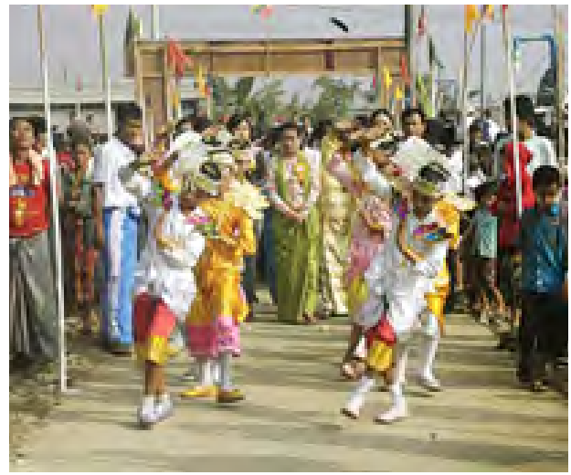
လှိုင်သာယာ ဖေဖော်ဝါရီ ၂၃

နှစ် (၇၀) ပြည့်တပ်မတော်နေ့ကို ကြိုဆိုဂုဏ်ပြုသောအားဖြင့် ရန်ကုန်တိုင်းဒေသကြီး လှိုင်သာယာမြို့နယ်အမှတ် (၁၅) ရပ်ကွက်တွင် အများပြည်သူသွားလာမှု လွယ်ကူစေရန် ပေ ၅၆၀၀ ရှိသော လမ်းပေါင်း ၁၀ ရှိ ကွန်ကရစ်လမ်းဖွင့်ပွဲ အခမ်းအနားကို ဖေဖော်ဝါရီ ၂၁ ရက် နံနက် ၉ နာရီက အဆိုပါရပ်ကွက်ရှိ မဇ္ဈလမ်းတွင် ဖွင့်ပွဲဖွင့်လှစ်ပေးခဲ့ကြောင်း သိရသည်။