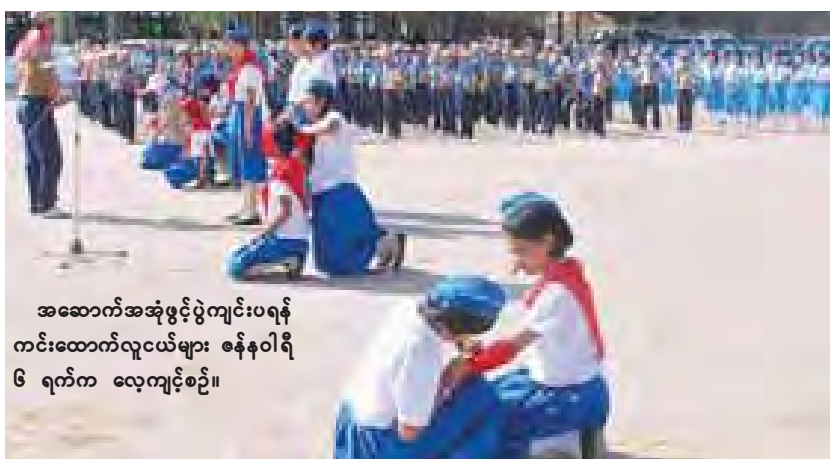
အဆောက်အအုံဖွင့်ပွဲကျင်းပရန် ကင်းထောက်လူငယ်များ ဇန်နဝါရီ ၆ ရက်က လေ့ကျင့်စဉ်။