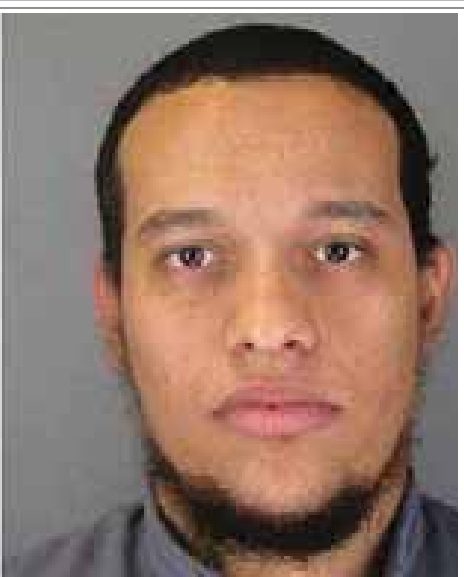
ရဲများက အလိုရှိနေသော သေနတ်သမားနှစ်ဦး၏ပုံများ ကြေညာထားသည်ကို တွေ့ရပုံ။