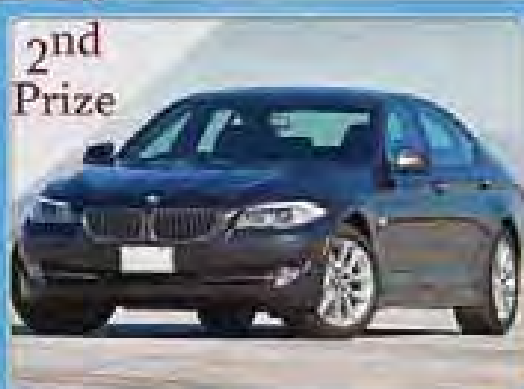
2nd Prize BMW 528 BRAND NEW