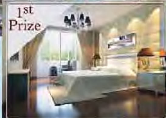
1st Prize (၂၅)ထပ်အိပ်ခန်းနှင့်ပေါ် CONDOMINIUM တစ်ခန်း