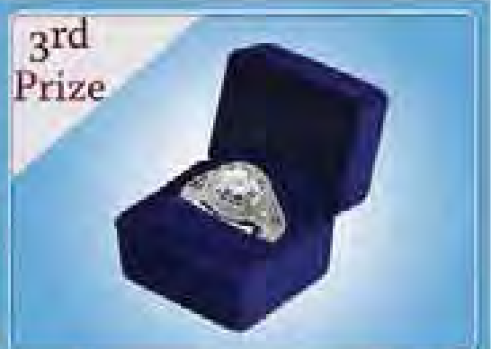
3rd Prize GIA(3) ကရက်ပိုင်နိနိကက်ရွှေတစ်ကောင်