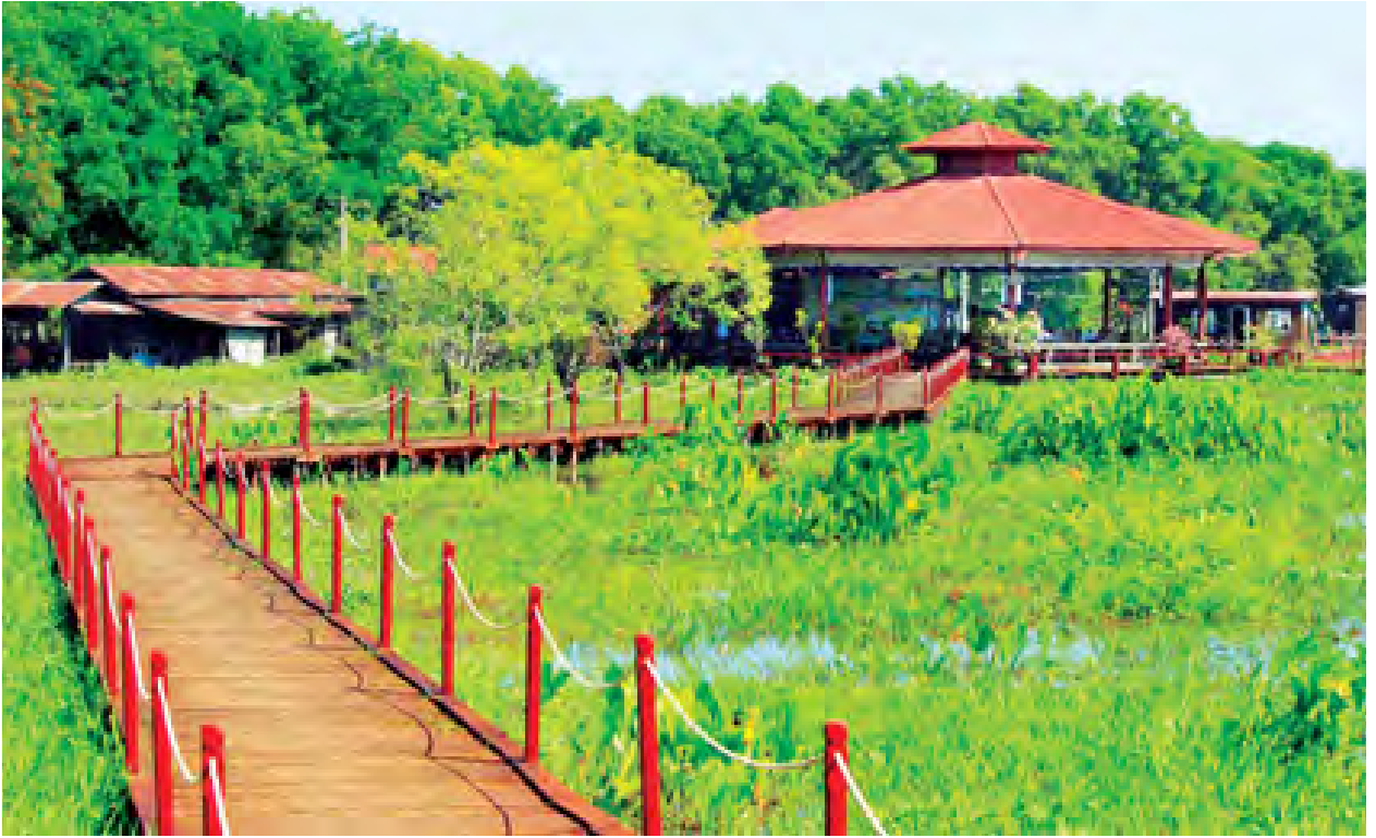
မိုးယွန်းကြီးအင်း ဘေးမဲ့တောနှင့်အတူ အနားယူတည်းခိုဆောင်များကို တွေ့ရစဉ်။

ကောင်း၊ ရေတိမ်ဒေသထိန်းသိမ်းရေး ဆောင်ရွက်ရာတွင် ပြည်သူလူထုပါဝင် ရေးနှင့် ရေတိမ်ဂေဟစနစ်၏ အရေး ကြီးမှုနှင့်ပတ်သက်၍ ပြည်သူလူထုကို အသိပညာပေးအစဉ်များ တိုးမြှင့် လုပ်ဆောင်ရန်အတွက် လည်း ကောင်း၊ ပြည်တွင်းပြည်ပ လေ့လာသူ များ အပန်းဖြေနိုင်စေရန်နှင့် သဘာဝအခြေခံ ခရီးသွားလုပ်ငန်း အား အထောက်အကူပြုရန်အတွက် လည်းကောင်း ရည်ရွယ်၍ တည် ထောင်ခဲ့သည်။