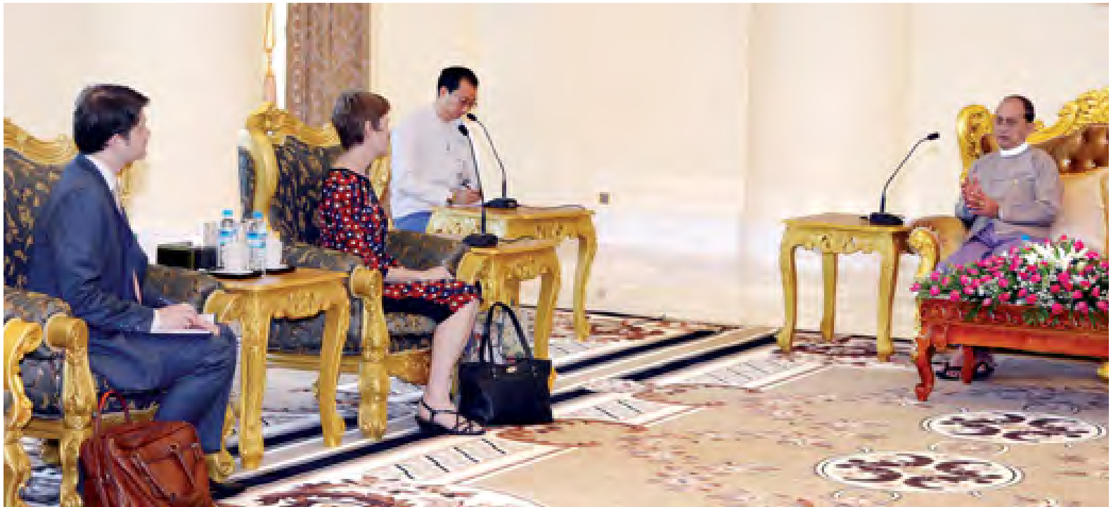
ဝန်ကြီး ဦးဝဏ္ဏမောင်လွင်၊ ဦးစိုးသိန်း၊ မြင့်အောင်နှင့် တာဝန်ရှိသူများ တက်ပြီးအုန်းမြင့်၊ ဒေါက်တာဒေါ်ခင်စန်းရီ၊ ဒေါက်တာသန်းအောင်၊ ဒေါက်တာ

ထိုသို့တွေ့ဆုံစဉ် ပညာရေး၊ ကျန်းမာရေးနှင့် သတ္တုကဏ္ဍများတွင် ပိုမိုတိုးမြှင့် ပူးပေါင်းဆောင်ရွက်ရေး၊ တက္ကသိုလ်အဆင့် ပညာတော်သင်များ စေလွှတ်သင်ကြားနိုင်ရေး၊ တိုင်းရင်းသား လက်နက်ကိုင်အဖွဲ့များနှင့် အပစ်အခတ်ရပ်စဲပြီး ငြိမ်းချမ်းရေး လက်မှတ် ရေးထိုးပြီးသည့်နောက် ပြန်လည်ထူထောင်ရေး ကဏ္ဍများတွင် ပူးပေါင်းပါဝင်ကူညီဆောင်ရွက်ရေးဆိုင်ရာကိစ္စရပ်များကို ရင်းနှီးပွင့်လင်းစွာ ဆွေးနွေးခဲ့ကြသည်။ အဆိုပါတွေ့ဆုံပွဲ၌ ပြည်ထောင်စု