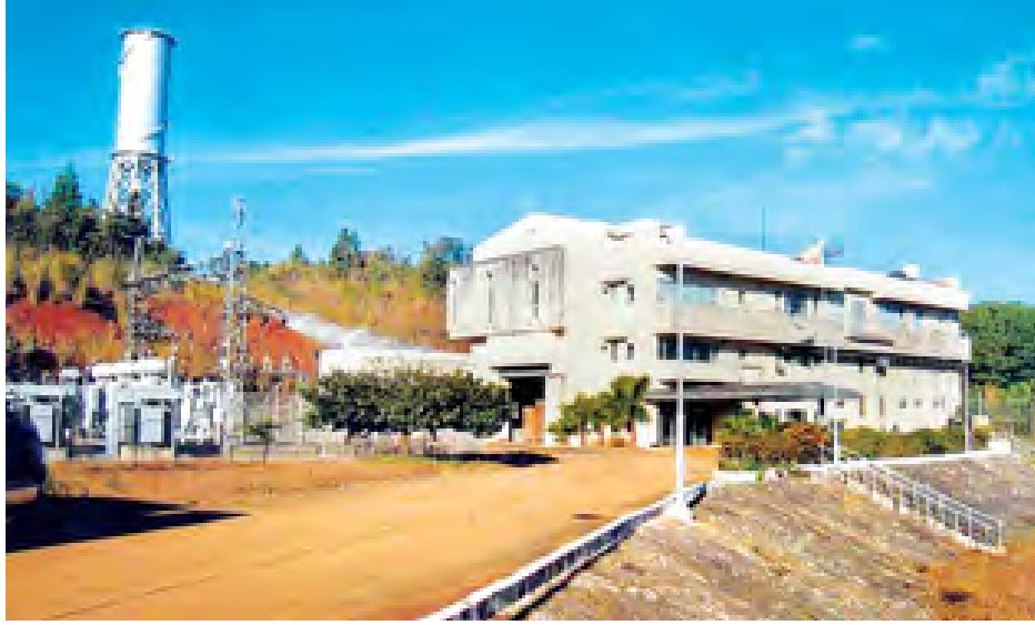
လွိုင်ကော်ရှိ ဘီလူးချောင်းအမှတ် (၁) ရေအားလျှပ်စစ်ဓာတ်အားပေးစက်ရုံကို တွေ့ရစဉ်။

ဘီလူးချောင်း အမှတ်(၁) ရေအားလျှပ်စစ် ဓာတ်အားပေးစက်ရုံသည် ကယားပြည်နယ် လွိုင်ကော်မြို့ အရှေ့တောင်ဘက် ၁၀ မိုင်ခန့်အကွာ ဘီလူးချောင်း၏ ကမ်းနံဘေးတွင် တည်ရှိပြီး ၁၉၈၇ ခုနှစ် မတ်လတွင် တည်ဆောက်ခဲ့သည်။ လွိုင်ကော်မြို့မှ ခြောက်မိုင်ခန့်အကွာ ရေသွင်းတံခါးနှင့် ရေပိုလွှဲများ တွဲဖက် တည်ဆောက်ကာ ကွန်ကရစ် ရေသွယ်မြောင်းဖြင့် ရေကန်သို့ သယ်ယူပြီး ရေကန်မှတစ်ဆင့် သံမဏိပိုက်လှိုင်းဖြင့် ရေများကို ယူ၍ ၁၄ မဂ္ဂါဝပ် ရီ ဓာတ်အားပေးစက်နှစ်လုံးနှင့် မောင်းနှင်နေသော ဓာတ်အားမဂ္ဂါဝပ် ၂၈ ထွက်ရှိသည့် စက်ရုံဖြစ်သည်။ ဘီလူးချောင်း အမှတ်(၁) ရေအားလျှပ်စစ် ဓာတ်အားပေးစက်ရုံစီမံကိန်းကို မြန်မာ့လျှပ်စစ်ဓာတ်အားလုပ်ငန်းနှင့် ဂျပန်နိုင်ငံမှ ကုမ္ပဏီလေးခုဖြင့် ပူးပေါင်း