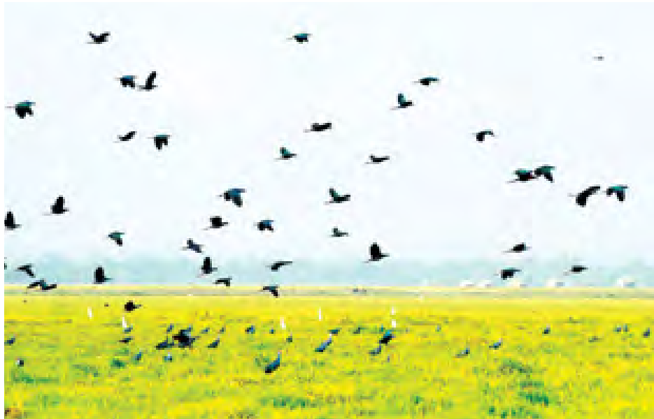
မိုးယွန်းကြီးအင်း၌ လာရောက်နားခိုကျက်စားသည့်ငှက်များကို တွေ့ရစဉ်။

ရေပျော်ငှက်မျိုး ၇၅ မျိုး ကုန်းတွင်းပိုင်း ငှက်များဖြစ်သည့် ချိုးလည်ပျောက်၊ လင်ကောင်ပိုး၊ ဇီးကွက်၊ ပုစဉ်းထိုး၊ စွန်နတ်တောင် စသည့် ငှက်မျိုးများနှင့် ရွှေပြောင်ငှက်များဖြစ်သည့် ခရု တုတ်၊ မြစ်တွေး၊ စင်ရော်၊ တောဝမ်း ဘဲ၊ ခရုစုတ်၊ လင်းယု၊ ဘဲဟင်္သာ၊ ကရ ကတ်၊ ဒေါင်းလန်းခြေထောက်၊ ငှက် ကျား၊ ရေဘဲ၊ ဘဲရစ်စသည့် ငှက်မျိုး စုစုပေါင်း ၅၆ မျိုး နေထိုင်ကျက်စားပြီး လိပ်ပြာမျိုးစိတ် ၃၃ မျိုး တွေ့ရှိရသည်။ ငှက်အပြင် ကုန်းနေရေနေနှင့် တွားသွားသတ္တဝါမျိုး ၂၇ ခန့်၊ လိပ်မျိုး စိတ်နှစ်မျိုး၊ ငါးမျိုးစိတ်များဖြစ်သည့် ငါးရံ၊ ငါးစင်ရိုင်း၊ ငါးဖယ်၊ ငါးဖန်းမ၊ ငါးပတ်၊ ငါးခူ၊ ငါးရှဉ့် အပါအဝင် အမျိုးပေါင်း ၄၁ မျိုး ကျက်စားနေထိုင် ၍ ငှက်ကောင်ရေ ၂၀၀၀ ကျော် နားခိုရာ နေရင်းဒေသတစ်ခုဖြစ်