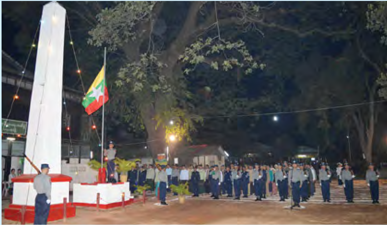
ကရင်ပြည်နယ် ကော့ကရိတ်မြို့နယ်၌ လွတ်လပ်ရေးနေ့အလံတင်အခမ်းအနားကို ကော့ကရိတ်မြို့လွတ်လပ်ရေးကျောက်တိုင်၌ ဇန်နဝါရီ ၄ ရက် နံနက် ၄ နာရီ မိနစ် ၂၀ က ကျင်းပရာ ကော့ကရိတ်ခရိုင်ရဲတပ်ဖွဲ့၊ ဂုဏ်ပြုတပ်ဖွဲ့များက အလံတော်အား တိုင်ထိပ်သို့လှူထူခဲ့ပြီး တက်ရောက်လာကြသော ဌာနဆိုင်ရာတာဝန်ရှိသူများနှင့် စည်သူတော်များက ပြည်ထောင်စုသမ္မတမြန်မာနိုင်ငံတော်အလံအား အလေးပြုခဲ့ကြသည်။ လွတ်လပ်ရေးနေ့ကို ဂုဏ်ပြုသောအားဖြင့် ကော့ကရိတ်မြို့မအားကစားကွင်းနှင့် ရပ်ကွက်အသီးသီးတွင် အားကစားပြိုင်ပွဲများဖြစ်သော အုန်းသီးရိုက်၊ အုန်းသီးလှိုင်ပွဲ၊ ချောတိုင်တက်၊ ခေါင်းအုန်းရိုက်၊ လက်စွဲ၊ တာတို၊ တာလတ်အပြေးပြိုင်ပွဲများ၊ မုန့်ကိုက်ပြိုင်ပွဲများ၊ ဘောလုံးပြိုင်ပွဲ၊ ခြင်းလုံးပြိုင်ပွဲနှင့် တင်းနစ်ပြိုင်ပွဲများကို ကျင်းပခဲ့သည်။ (ခရိုင် ဖြန့်/ဆက်)