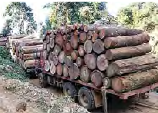
ဖမ်းဆီးရမိထားသည့် သစ်တင်ယာဉ်များအား တွေ့ရစဉ်။ (မြဝတီ)

ယာဉ် နှစ်စီး စုစုပေါင်းယာဉ် ၁၇ စီး၊ သစ်မျိုးစုံ အလုံး ၂၄၀၊ တစ်ဖက်နိုင်ငံသား အမျိုးသား ၁၇ ဦးတို့ကို ထပ်မံဖမ်းဆီးရမိခဲ့သည်။ ဝိုင်းမော်မြို့နယ် ဝါရှောင့်၊ မံဝိန်း၊ ဆီနီကူး၊ မံတောင်၊ လောခွန်ယန်၊ ဆဒုံးဒေသအတွင်း တပ်မတော်စစ်ကြောင်းများက ဇန်နဝါရီ ၂ ရက်မှ စတင်၍ နယ်မြေရှင်းလင်းခြင်းဆောင်ရွက်ခဲ့ရာ ဇန်နဝါရီ ၅ ရက်ထိ ဒိုလာတစ်စီး၊ ဘက်ဟိုး သုံးစီး၊ ပါဂျီရီးလေးစီး၊ ဝီကင်းဂျက် လေးစီး၊ ဝန်ဆွဲယာဉ် သုံးစီး၊ နှစ်ခန်းတွဲယာဉ် နှစ်စီး၊ သစ်တင်ယာဉ် (အမျိုးအစားမျိုးစုံ) ၄၄၇ စီး၊ တန်ဖုန်း/ဒေါင်းဖန်းယာဉ် လေးစီး၊ ကရိန်းလေးစီး စုစုပေါင်း ယာဉ် ၄၇၂ စီး (၁၄ စီး သစ်ပါရှိ) ဆိုင်ကယ်ကိုးစီး၊ မြန်မာနိုင်ငံသား အမျိုးသားလေးဦး၊ အမျိုးသမီး ၁၆