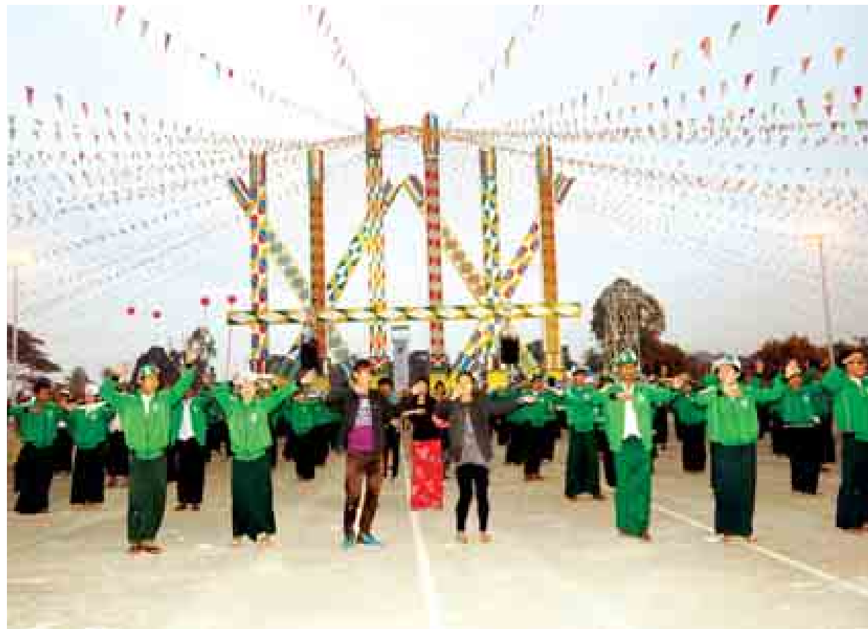
ကချင်ပြည်နယ်နေ့အထိမ်းအမှတ် မနောပွဲတော်အကြိုလေ့ကျင့်နေစဉ်။