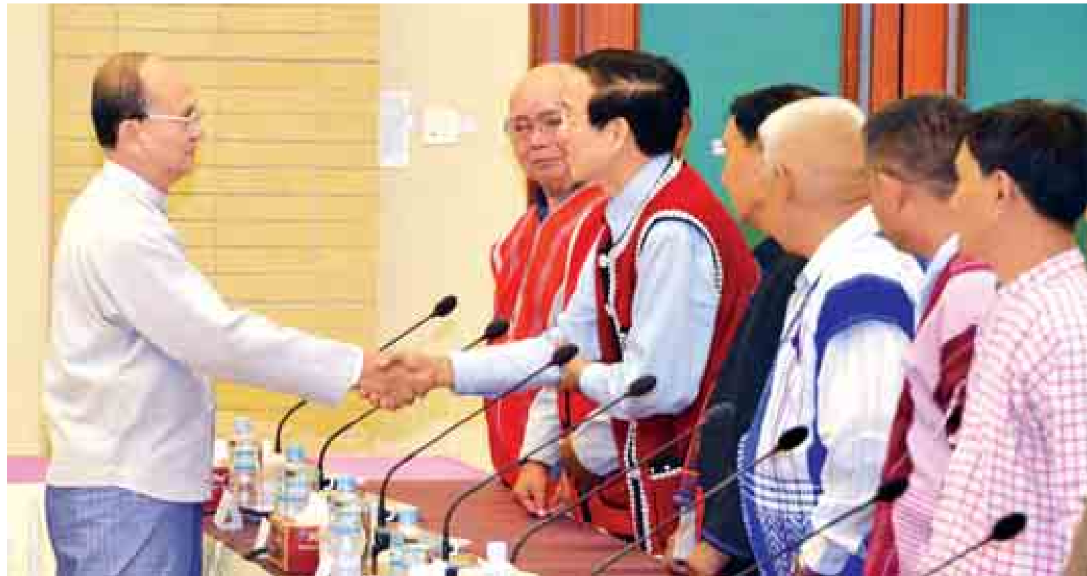
နေပြည်တော် ဇန်နဝါရီ ၅

နိုင်ငံတော်သမ္မတ ဦးသိန်းစိန်သည် (၆၇)နှစ်မြောက် လွတ်လပ်ရေးနေ့ ဗိုလ်ရှင်အခမ်းအနားသို့ တက်ရောက်ခဲ့ကြသည့် တိုင်းရင်းသားလက်နက်ကိုင်အဖွဲ့ (၁၂)ဖွဲ့မှ ခေါင်းဆောင်များနှင့် ယနေ့နံနက် ၉ နာရီတွင် မြန်မာအပြည်ပြည်ဆိုင်ရာ ကွန်ပင်းရှင်းဗဟိုဌာန-၂ (MICC-2) ၌ တွေ့ဆုံသည်။