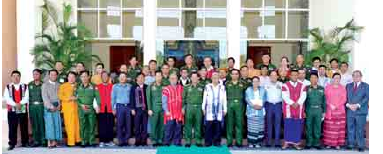
တပ်မတော်ကာကွယ်ရေးဦးစီးချုပ် ပိုင်ချုပ်မျိုးကြီး မင်းအောင်လှိုင် (၆၇)နှစ်မြောက် လွတ်လပ်ရေးနေ့ ဝိလင်းအစဦးအဖူးအသီး တက်ရောက်ခဲ့ကြသည့် တိုင်းရင်းသားလက်နက်ကိုင်အဖွဲ့များနှင့် စုပေါင်းဓာတ်ပုံရိုက်စဉ်။ (ဗြဝတီ)