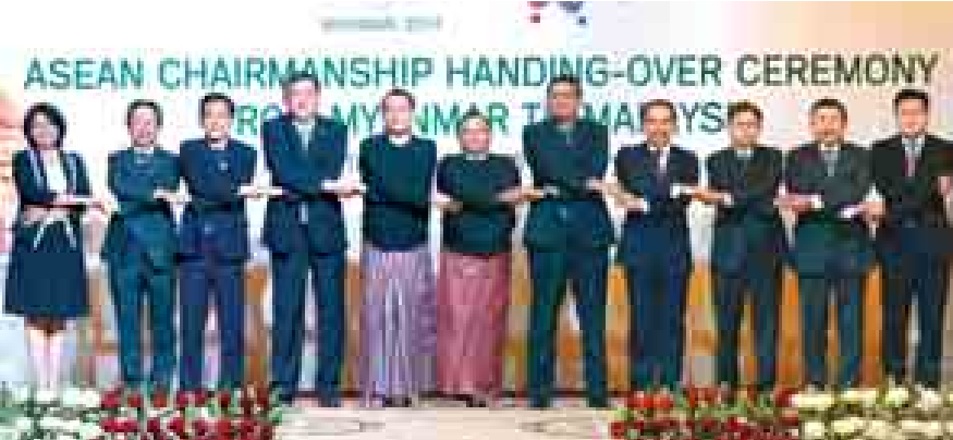
နေပြည်တော် ဇန်နဝါရီ ၅

မြန်မာနိုင်ငံအစွေမြင် အာဆီယံဥက္ကဋ္ဌတာဝန်ကို ၂၀၁၄ ခုနှစ် ဇန်နဝါရီ ၁ ရက်မှ ဒီဇင်ဘာ ၃၀ ရက်နေ့အထိ ထမ်းဆောင်ခဲ့ရာ မြန်မာနိုင်ငံ အာဆီယံဥက္ကဋ္ဌတာဝန် ထမ်းဆောင်မှု ပြီးဆုံးခြင်းအထိမ်းအမှတ်အဖြစ် မြန်မာနိုင်ငံမှ မလေးရှားနိုင်ငံသို့ အာဆီယံဥက္ကဋ္ဌရာထူးလွှဲပြောင်းပေးအပ်ခြင်း အခမ်းအနားကို ၂၀၁၅ ခုနှစ် ဇန်နဝါရီ ၅ ရက် ညပိုင်းတွင် နေပြည်တော်ရှိ တိုက်မက်(စ်)တွင် ကျင်းပပြုလုပ်ခဲ့သည်။