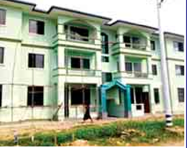
ဝေဘာဂီအိမ်ရာစီမံကိန်း (၃အဆင့်)