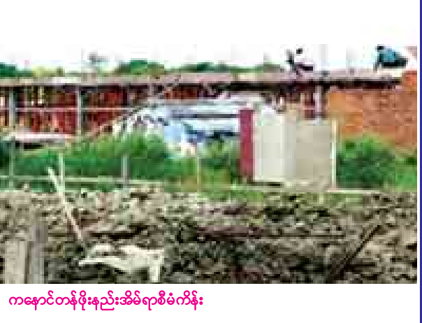
ကနောင်တန်ဖိုးနည်းအိမ်ရာစီမံကိန်း