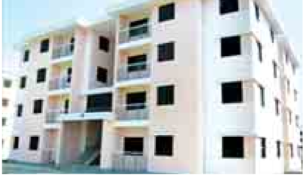
ကြီးပွားရေးအိမ်ရာစီမံကိန်း