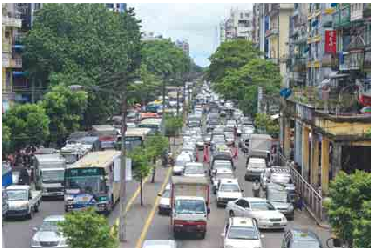
ရန်ကုန်မြို့ မဟာဗန္ဓုလလမ်းအတွင်း ယာဉ်များနေ့စဉ်ဖြတ်သန်းသွားလာနေစဉ်။

ထိရောက်သော ယာဉ်စည်းကမ်းထိန်းသိမ်းမှုများအတွက် ယာဉ်ထိန်းရဲများနှင့် ယာဉ်စည်းကမ်းထိန်းသိမ်းရေးဆောင်ရွက်နေသော မထသဝန်ထမ်းများ၏ အလုပ်လုပ်ခွင့်စွမ်းရည်ရန်လိုအပ်ပါသည်။ အလုပ်လုပ်ခွင့်စွမ်းရည်ရန်အတွက် လူအင်အား၊ စိတ်ဓာတ်နှင့် စေတနာလိုအပ်ပါသည်။ လူအင်အားများသော်လည်း စိတ်ဓာတ်