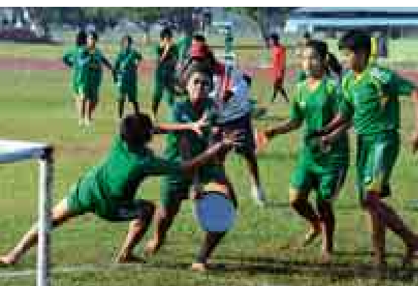
လွတ်လပ်ရေးအထိမ်းအမှတ် အားကစားပြိုင်ပွဲများကျင်းပစဉ်။