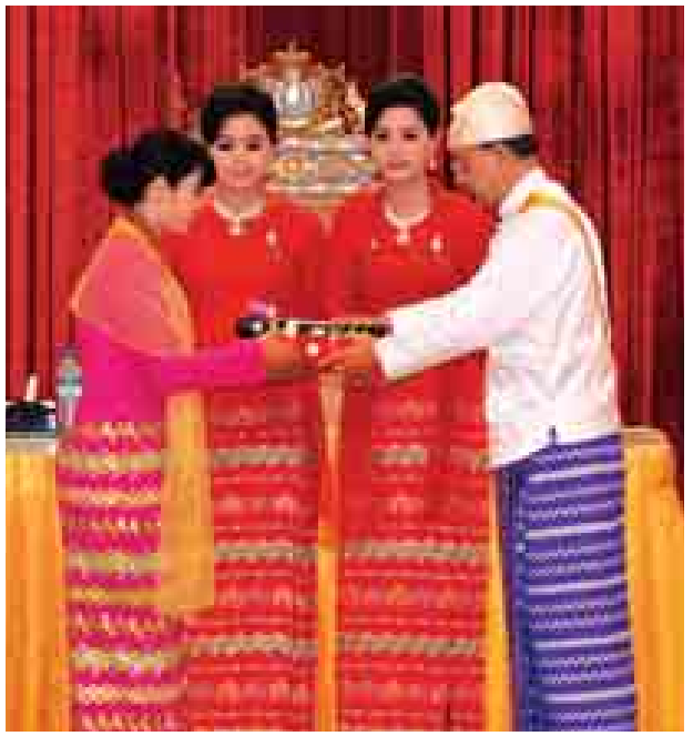
နိုင်ငံတော်သမ္မတဦးသိန်းစိန် သူရဘွဲ့ရရှိသူ ဒုတိယဗိုလ်မှူးကြီးဖြိုးဦးငြိမ်း(ကျဆုံး)ကိုယ်စား ဇနီးဒေါ်သိင်္ဂီရွှေစင်ဝင်းအား ချီးမြှင့်စဉ်။ (သတင်းစဉ်)