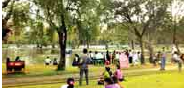
အများပြည်သူအားလပ်ရက်ဖြစ်သည့် လွတ်လပ်ရေးနေ့တွင် ရွှေတိဂုံ ဘုရားအနီးမှ ကန်တော်မင်ပန်းခြံ၌ အနားယူအပန်းဖြေနေသည့် ပြည်သူ များဖြင့် စည်ကားနေသည်ကိုတွေ့ရစဉ်။ မွန်းဦးနီ