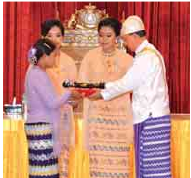
နိုင်ငံတော်သမ္မတဦးသိန်းစိန် သူရဘွဲ့ရရှိသူ တပ်ကြပ်မောင်ဖြူ(ကျဆုံး)ကိုယ်စား ဇနီးဒေါ်မြင့်မြင့်အေးအား ချီးမြှင့်စဉ်။ (သတင်းစဉ်)