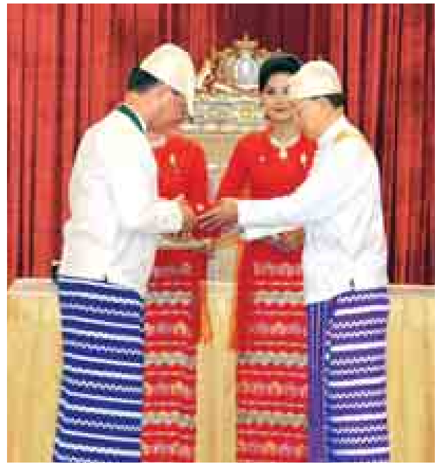
နိုင်ငံတော်သမ္မတဦးသိန်းစိန် သရေစည်သူဘွဲ့ရရှိသူ ဒုတိယသမ္မတဒေါက်တာစိုင်းမောက်ခမ်းအား ချီးမြှင့်စဉ်။ (သတင်းစဉ်)