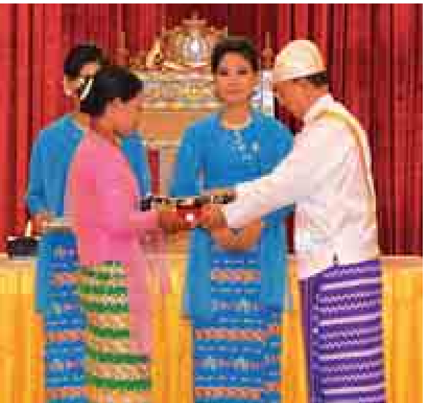
နိုင်ငံတော်သမ္မတဦးသိန်းစိန် သူရဘွဲ့ရရှိသူ ဒုတပ်ကြပ်ရန်နိုင်လင်း(ကျဆုံး)ကိုယ်စား ဇနီးဒေါ်သင်းသင်းအား ချီးမြှင့်စဉ်။ (သတင်းစဉ်)