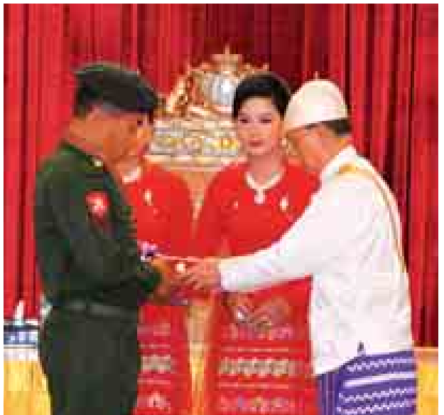
နိုင်ငံတော်သမ္မတဦးသိန်းစိန် သူရဘွဲ့ရရှိသူ တပ်ကြပ်ကြီးသန်းဌေးအောင်အား ချီးမြှင့်စဉ်။ (သတင်းစဉ်)