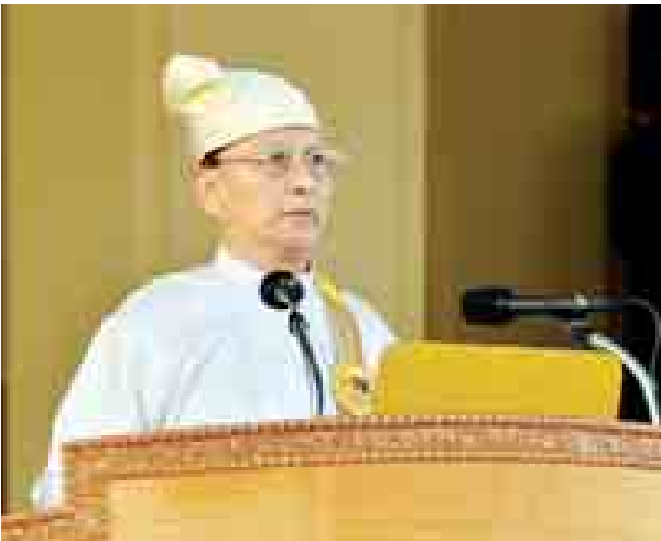
ချစ်ခင်လေးစားအပ်ပါသော စည်ညည်တော်ကြီးများနှင့် မိဘပြည်သူ အပေါင်းတို့ ခင်ဗျား-

အဆိုပါ မိန့်ခွန်းအပြည့်အစုံမှာ အောက်ပါအတိုင်း ဖြစ်ပါသည်-