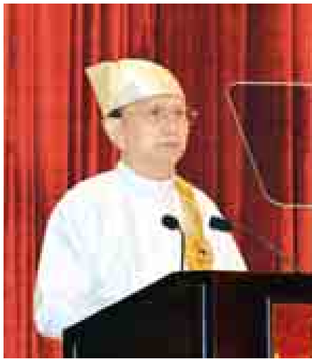
နိုင်ငံတော်သမ္မတ ဦးသိန်းစိန် ၂၀၁၅ ခုနှစ် ဂုဏ်ထူးဆောင်ဘွဲ့များ ချီးမြှင့် အပ်နှင်းခြင်း အခမ်းအနားတွင် မိန့်ခွန်းပြောကြားစဉ်။ (သတင်းစဉ်)

ဂုဏ်ထူးဆောင်ဘွဲ့များ၊ ဂုဏ်ထူးဆောင်တံဆိပ်များ ချီးမြှင့်အပ်နှင်း