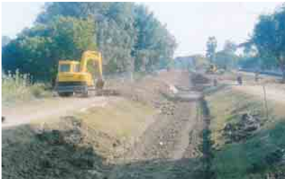
မိတ္ထီလာမြို့နယ်အတွင်း စိုက်ပျိုးရေးရရှိရေးအတွက် ရေမြောင်းများကို ပြုပြင်ဆောင်ရွက်စဉ်။

မိတ္ထီလာမြို့နယ် ရှမ်းတဲတိုက်နယ်၊ ညောင်ကိုင်းတိုက်နယ်၊ အလယ်ရွာ တိုက်နယ်နှင့် ရှမ်းမငယ်တိုက်နယ် တို့တွင် ကျေးရွာပေါင်း ၃၇၉ ရွာခန့် ရှိပြီး စိုက်ပျိုးရေးရရှိနိုင်ရေး ရေမြောင်းများ တိုးချဲ့ပြုပြင်ခြင်း စတင် နေပြီဖြစ်သည်။