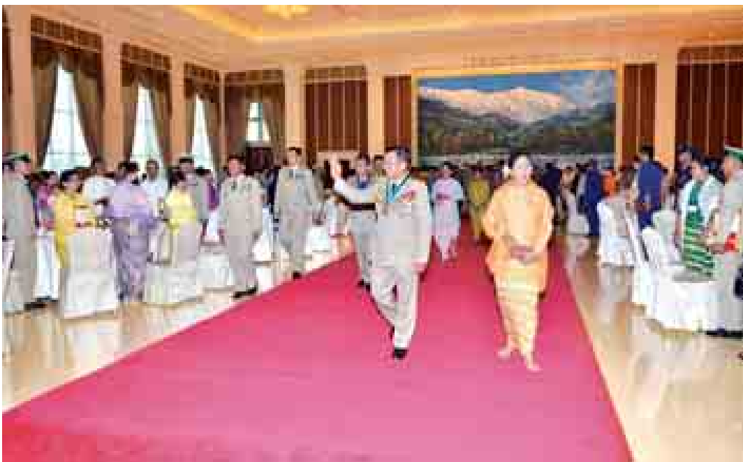
တပ်မတော် ကာကွယ်ရေးဦးစီးချုပ် ဗိုလ်ချုပ်မှူးကြီး မင်းအောင်လှိုင် တပ်မတော် စွမ်းရည် သတ္တိဆိုင်ရာ ဂုဏ်ထူးဆောင်တံဆိပ်နှင့် လက်မှတ်များ ရရှိခဲ့သည့် အရာရှိ/စစ်သည်များနှင့် အမွန်ခံများသို့ ဂုဏ်ထူးဆောင်တံဆိပ်နှင့် လက်မှတ်များ ချီးမြှင့်အပ်နှင်းပွဲသို့ တက်ရောက်ကြသူများအား နှုတ်ဆက်စဉ်။

နိုင်ငံတော်၏ လွတ်လပ်ရေးနှင့် အချုပ်အခြာအာဏာ တည်တံ့ခိုင်မြဲရေးအတွက် အကောင်းဆုံးသော အာမခံချက်သည် ရိုသေခန့်ညား လောက်သည့် ကာကွယ်ရေး စွမ်းအားစုတည်ဆောက်၊ ပိုင်ဆိုင် နိုင်ခြင်းပင်ဖြစ်ကြောင်း၊ နိုင်ငံတော် ကာကွယ်ရေးအတွက် မိမိအသက်ကို စွန့်လွှတ်နိုင်သည်အထိ သူရသတ္တိများဖြင့် ပြည့်စုံခြင်းသည် ယောက်ျားကောင်း၊ ယောက်ျားမြတ်များ၏ စိတ်ထားဖြစ်သကဲ့သို့ ကာကွယ်ရေး စွမ်းအားစုအတွက် ကြီးစွာသော အထောက်အပံ့လည်း ဖြစ်ကြောင်း၊ မိမိတို့ တပ်မတော်သည် ထိုကဲ့သို့ ယောက်ျားကောင်း၊ ယောက်ျားမြတ်များနှင့် တည်ဆောက်ထားသည့် တပ်မတော်ဖြစ်ကြောင်း၊ သမိုင်းအစဉ်အလာများ၊ နှစ်စဉ်ယခုကဲ့သို့ ဂုဏ်ပြုကျင်းပပေးနေသည့် အခမ်းအနားများအရ သိနိုင်မည်ဖြစ်ကြောင်းဖြင့် တပ်မတော် ကာကွယ်ရေးဦးစီးချုပ် ဗိုလ်ချုပ်မှူးကြီး မင်းအောင်လှိုင်က ယနေ့ မွန်းလွဲ ၁ နာရီတွင် နေပြည်တော်ရှိ ဝေယျာသီရိဗိမာန်၌ ကျင်းပပြုလုပ်သော ၂၀၁၃ ခုနှစ် နှင့် ၂၀၁၄ ခုနှစ် တပ်မတော် စွမ်းရည်သတ္တိဆိုင်ရာ ဂုဏ်ထူးဆောင် တံဆိပ်နှင့် လက်မှတ်များ ရရှိခဲ့သည့် အရာရှိ/စစ်သည်များနှင့် အမွန်ခံများသို့ ဂုဏ်ထူးဆောင် တံဆိပ်နှင့် လက်မှတ်များ ချီးမြှင့်ခြင်း အခမ်းအနားတွင် ဂုဏ်ပြုအမှာစကား ပြောကြားရာ၌ ထည့်သွင်းပြောကြားသည်။