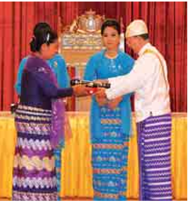
နိုင်ငံတော်သမ္မတ ဦးသိန်းစိန် သူရဘွဲ့ရရှိသူ တပ်ကြပ်ကြီးသက်ဦး(ကျဆုံး)ကိုယ်စား ဇနီးဒေါ်အေးအေးမာအား ချီးမြှင့်စဉ်။ (သတင်းစဉ်)