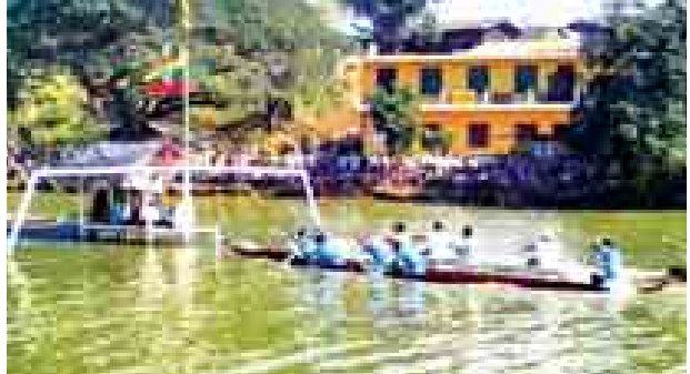
ဇန်နဝါရီ ၄ ရက်က (၆၇)နှစ်မြောက် လွတ်လပ်ရေးနေ့ကို ဂုဏ်ပြု သောအားဖြင့် မြန်မာ့ရိုးရာလှေသဘင်ပွဲတော်ကို မွန်ပြည်နယ် ရေးမြို့ ရှေးဟောင်းမြကန်သာ ကျုံးတော်ကြီး၌ ကျင်းပနေသည်ကိုတွေ့ရစဉ်။ နေမျိုးထွဋ်(ရေး)