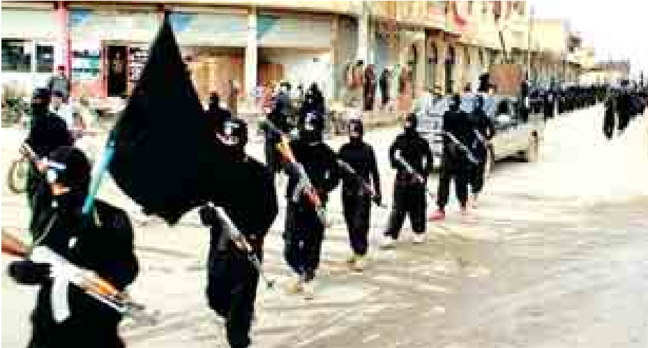
ကြောင်း အီရတ်တာဝန်ရှိသူများက ပြောသည်။ ပြန်ပေးဆွဲ ခံရသူများအနက် ၁၆၂ ဦးသည် ၎င်းတို့နေအိမ်များသို့ ပြန်ရောက်ပြီဖြစ်ကြောင်း သို့သော် ရှစ်ဦးမှာ အစွန်းရောက်များက ဖမ်းဆီး ထားဆဲဖြစ်ကြောင်း ဒေသခံများက အတည်ပြုပြောကြားသည်။ တက်ဖရီ စစ်သွေးကြွများသည် စက်တင်ဘာလအတွင်းတွင်လည်း အလားတူ လူအများအပြားကို ပြန်ပေးဆွဲခဲ့သည်။ (ပရက်စ်တီဗွီ)

ကယ်ကွတ် ဇန်နဝါရီ ၄ အီရတ်နိုင်ငံ မြောက်ပိုင်း ကာကွတ်ပြည်နယ်တွင် ယခုသီတင်း ပတ်အစောပိုင်းက ပြန်ပေးဆွဲခံရသော အရပ်သား ၁၆၀ ကျော်အား အိုင် အက်စ်အိုင်အယ်လ်တက်ဖရီ အစွန်း ရောက်များက ပြန်လွှတ်ပေးလိုက် ကြောင်း ဒေသဆိုင်ရာသတင်း ရပ်ကွက်များက ဆိုသည်။ အစွန်းရောက် အုပ်စုသည် ဇန်နဝါရီ ၂ ရက်က အီရတ်နိုင်ငံ ကာကွတ်ပြည်နယ်၊ အယ်လ်ရှာ ဂျာယာနှင့် ဝါရစ်ကျေးရွာများ၌ အိုင်အက်စ်အိုင်အယ်လ်အယ်နစ်ခဲ မီးတင်ရိုက်ခတ်ပြီးနောက် အဆိုပါ အမျိုးသား (၁၇၀)တို့ကို ပြန်ပေးဆွဲ ခြင်းဖြစ်သည်။ အစွန်းရောက် အုပ်စု သည် ဟော်ဝါမြို့အနီး ၎င်းတို့ မြေကုပ်စခန်းသို့ အဆိုပါ အရပ်သား များအား ခေါ်ဆောင်သွားခဲ့ကြ