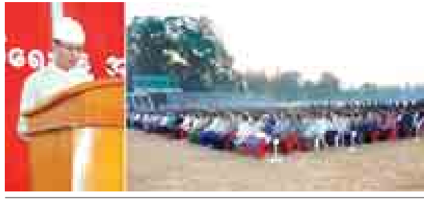
လွတ်လပ်ရေးနေ့ အခမ်းအနားကျင်းပ မြောင်းမြ ဇန်နဝါရီ ၄ (၆၇)နှစ်မြောက်လွတ်လပ်ရေးနေ့ အလံတင် အခမ်းအနားကို မြောင်းမြ မြို့ မြကန်သာပန်းခြံ လွတ်လပ်ရေး

တည်ဆောက်ရာတွင် စားသောက်ဆိုင် တည်းခိုခန်း၊ ပန်းခြံ၊ ကစားကွင်း များထည့်သွင်း တည်ဆောက်သွားရန် စီစဉ်လျက်ရှိသည်။ ကချင်ပြည်နယ် အတွင်း မြို့ကြီးခုနစ်မြို့၌ အဝေး ပြေးယာဉ်ရပ်နားစခန်းများ တည် ဆောက်ပါက ခရီးသွားပြည်သူများ အတွက် တစ်နေရာတည်းတွင် သွားရောက် စီးနင်းနိုင်မည်ဖြစ်ပြီး မြို့တွင်းများ၌လည်း ယာဉ်ကြော ပိတ်ဆို့မှုများကိုလည်း လျော့ချနိုင် မည်ဖြစ်သည်။ (မြန်မာ့အလင်း)