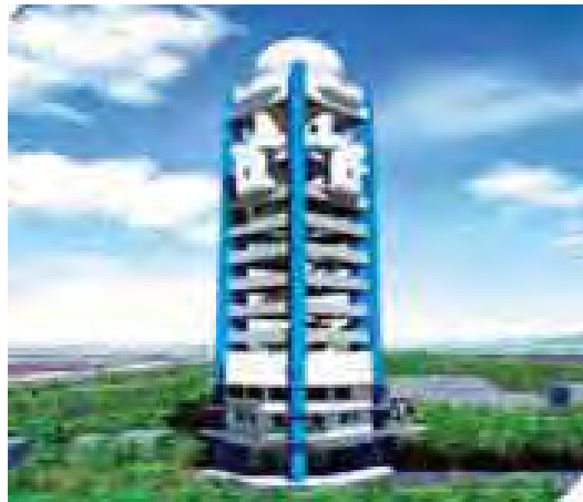
Mandalay Meteorological Radar

AWOS တပ် (30) ဝန်ထမ်း ၂၀၁၅ ခုနှစ် ၂၀၁၆ ခုနှစ် တစ်နှစ် ဝန်ထမ်း