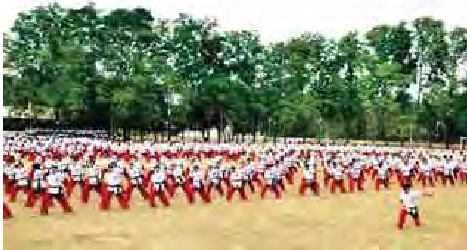
ppငါးဆယ့်သုံး Ze#Og&D 3