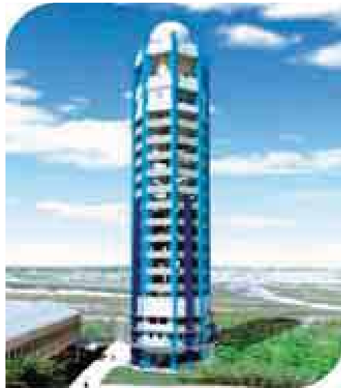
Yangon Meteorological Radar ရေဒါတိုင်တန်း; ဝါးဇာတိတိုင်