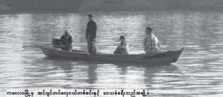
ကလေးဝမြို့မှ အင်ဂျင်တပ်လေ့ငယ်တစ်စင်းနှင့် ဒေသခံဦးမျိုးကျော်အချို့။

ထိုသို့ အင်ဂျင်တပ်လေ့ငယ်များကို စတင်အသုံးပြုလာကြသည်မှာ တစ်နှစ်ကျော်၊ နှစ်နှစ်ခန့်သာ ရှိသေးသော်လည်း သွားလာရေးအဆင်ပြေမှုနှင့် ကုန်ကျစရိတ်သက်သာမှုကြောင့် အချိန်တိုအတွင်း အသုံးများလာကြခြင်းဖြစ်ကြောင်း သိရသည်။