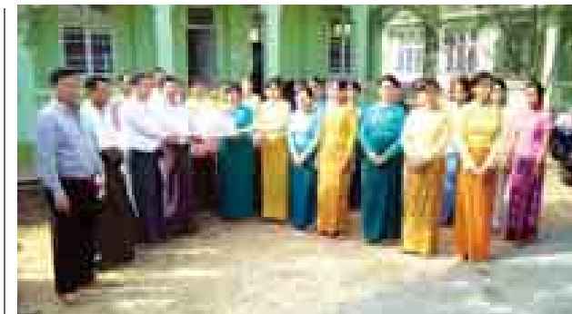
(၆၇)နှစ်မြောက် လွတ်လပ်ရေးနေ့ ပိုလ်ရှင်အခမ်းအနားသို့ ချီတက်အလေးပြုမည့် နေပြည်တော်ကောင်စီနယ်မြေကိုယ်စားပြု အမျိုးသမီးရေးရာအဖွဲ့နှင့် မိခင်နှင့်ကလေးစောင့်ရှောက်မှု ကြီးကြပ်ရေးအဖွဲ့များ လေ့ကျင့်ရေးစခန်းသို့ ဇန်နဝါရီ ၂ ရက်က ပျဉ်းမနားမြို့နယ် အထောက်အကူပြုအဖွဲ့နှင့် အလှူရှင်များက စားသောက်ဖွယ်ရာများ လှူဒါန်းစဉ်။ မျိုးဇေယျာ(ပျဉ်းမနား)

ဖြင့် စံနှုန်းများချမှတ်လျက်ရွေးချယ်ရေးမှုများဖြင့် စိစစ်လျက်ရှိသည်။ အသေးစား ငွေရေးကြေးရေးလုပ်ငန်း လုပ်ကိုင်လိုသော အဖွဲ့အစည်းများသည် သက်ဆိုင်ရာ နေပြည်တော်ကောင်စီ၊ တိုင်းဒေသကြီးနှင့်ပြည်နယ် အသေးစားငွေရေးကြေးရေးလုပ်ငန်း ဖွံ့ဖြိုးတိုးတက်ရေးလုပ်ငန်းကော်မတီများနှင့် လည်းကောင်း၊ ဘဏ္ဍာရေးဝန်ကြီးဌာန ငွေရေးကြေးရေးကြီးကြပ်စစ်ဆေးရေးဦးစီးဌာနနှင့်လည်းကောင်း ဆက်သွယ်ဆောင်ရွက်နိုင်ကြောင်း သိရှိရသည်။ (သတင်းစဉ်)