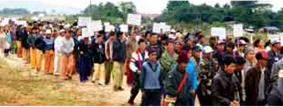
ဟိုပန်မြို့၌ ဒေသခံပြည်သူများ ငြိမ်းချမ်းစွာ စုပေါင်းဆန္ဒထုတ်ဖော်စဉ်။

အမြန်ဆုံးဆောင်ရွက်ပေးရေး၊ တိုင်းရင်းသားများ၏ အခွင့်အရေးနှင့် လိုလားတောင်းဆိုချက်များကို အစိုးရမှ ဦးဆောင်ဖြေရှင်းပေးရေး၊ ဖွဲ့စည်းပုံနှင့် အခြေခံဥပဒေပြင်ဆင်ရေးတွင် တိုင်းရင်းသားအားလုံး ကျယ်ကျယ်ပြန့်ပြန့်ပါဝင်နိုင်ရေး၊ မြောက်ပွင့်ဆိုင်အလိုမရှိ၊ တောင်းဆိုချက်များ အမြန်ဆုံး အကောင်အထည်ဖော် ဆောင်ရွက်ပေးရေးတို့ကို နိုင်ငံတော်အစိုးရ သို့ အသိပေးလိုသည့်အတွက် ယခုကဲ့သို့ ဆန္ဒထုတ်ဖော်ခြင်းဖြစ်ကြောင်း သိရသည်။ (သတင်းစဉ်)