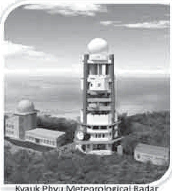
Kyauk Phyu Meteorological Radar

ကိရိယာတပ်ဆင်ခြင်း ဖေဖော်ဝါရီလ ၂၀၁၄ ဩဂုတ်လ ၂၀၁၅ Equipment work (45%)