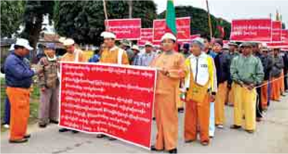
သီပေါမြို့၌ ဒေသခံပြည်သူများ ငြိမ်းချမ်းစွာ စုပေါင်းဆန္ဒထုတ်ဖော်စဉ်။

တော်ဖွံ့ဖြိုးတိုးတက်ရေးနှင့် ပြုပြင်ပြောင်းလဲရေးကို အစိုးရက အမြန်ဆုံး ဆောင်ရွက်ပေးရေး၊ တိုင်းရင်းသားများ၏ အခွင့်အရေးနှင့် လိုလားတောင်းဆိုချက်များကို ဥပဒေများ ပြဋ္ဌာန်းဆောင်ရွက်ပေးရေး၊ ဖွဲ့စည်းပုံအခြေခံဥပဒေပြင်ဆင်ရေးတွင် တိုင်းရင်းသားများ ကျယ်ကျယ်ပြန့်ပြန့် ပါဝင်နိုင်ရေး၊ တောင်းဆိုချက်များ အမြန်ဆုံး အကောင်အထည်ဖော်ဆောင်ရွက်ပေးရေးစသည့် အချက်ငါးချက်ပါဝင်သော တောင်းဆိုချက်များဖြင့် စီတန်းလှည့်လည် ဆန္ဒထုတ်ဖော်