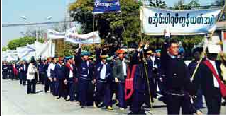
တောင်ကြီးမြို့၌ ဒေသခံပြည်သူများ ငြိမ်းချမ်းစွာ စုပေါင်းဆန္ဒထုတ်ဖော်စဉ်။

သောင်း ခေါင်းဆောင်၍ ပလောင်တိုင်းရင်းသားအင်အား ၁၁၀၀ ခန့် တို့မှလည်းကောင်း၊ တောင်းဆိုချက်များပါဝင်သော လက်ကိုင်ပို့စတာများကို ကိုင်ဆောင်၍ ငြိမ်းချမ်းစွာ စီတန်းလှည့်လည်၍ စုပေါင်းဆန္ဒထုတ်ဖော်ခဲ့ကြကြောင်း သိရသည်။ ဆန္ဒထုတ်ဖော်ရာတွင် ပြည်တွင်း ငြိမ်းချမ်းရေးကို အစိုးရမှ အောင်မြင်သည်အထိ ဖော်ဆောင်ပေးရေး၊ နိုင်ငံ