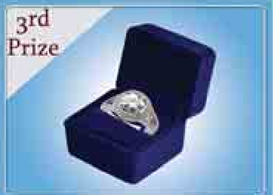
3rd Prize GIA(3) ကရက်ပိုင်စိန်ကွက်စွပ်တစ်ကွက်