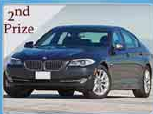
2nd Prize BMW 528 BRAND NEW