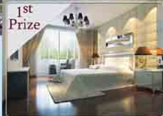
1st Prize (၂)ထပ်ပိုင်သုံးနှစ်သုံးပါ CONDOMINIUM တစ်သုံး