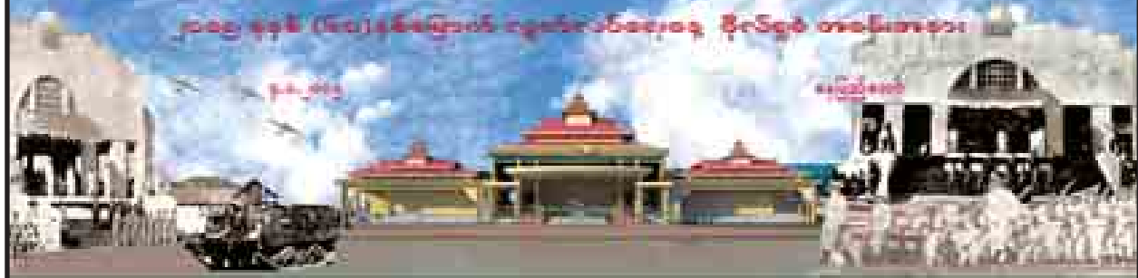
(၆၇)နှစ်မြောက် လွတ်လပ်ရေးနေ့ ဦးတည်ချက်