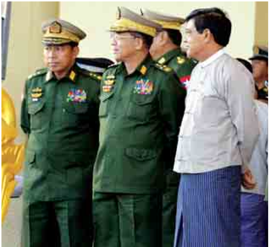
ဒုတိယသမ္မတ ဦးညွှန်ထွန်း (၆၇) နှစ်မြောက်လွတ်လပ်ရေးနေ့ နိုင်ငံတော်အလံတင်အခမ်းအနားနှင့် ပိုလ်ရှင် အခမ်းအနား ဝတ်စုံပြည့်အစမ်းလေ့ကျင့်နေမှုများကို ကြည့်ရှုစစ်ဆေးစဉ်။ (သတင်းစဉ်)

နေပြည်တော် ဇန်နဝါရီ ၁ ပိုလ်ရှင်အခမ်းအနားကျင်းပရေး ဗဟိုကော်မတီ ဥက္ကဋ္ဌ ဒုတိယသမ္မတ ဦးညွှန်ထွန်းသည် ယနေ့နံနက်ပိုင်း တွင် နေပြည်တော်ရှိ ပိုလ်ရှင်မဏ္ဍပ်ရှေ့ဥပစာ၌ ပြုလုပ် သည့် ၂၀၁၅ ခုနှစ် (၆၇) နှစ်မြောက်လွတ်လပ်ရေးနေ့ နိုင်ငံတော်အလံတင်အခမ်းအနားနှင့် ပိုလ်ရှင်အခမ်းအနား ဝတ်စုံပြည့်အစမ်းလေ့ကျင့်နေမှုများကို ကြည့်ရှုစစ်ဆေး သည်။ အခမ်းအနားတွင် နံနက် ၄ နာရီ မိနစ် ၂၀၅၅ ဂုဏ်ပြု တပ်ဖွဲ့က ပြည်ထောင်စုသမ္မတမြန်မာနိုင်ငံတော်အလံကို လွှင့်တင်ကြရာ တိုင်းရင်းသားတိုင်းရင်းသူလေးများက ဂုဏ်ပြု တပ်ဖွဲ့နှင့်အတူ နိုင်ငံတော်အလံကို အလေးပြုကြသည်။ ထို့နောက် အခမ်းအနားတွင် သရုပ်ပြချီတက်ကြမည့် စစ်ကြောင်းများက ပိုလ်ရှင်မဏ္ဍပ်ရှေ့သို့ ချီတက်ဝင်ရောက်