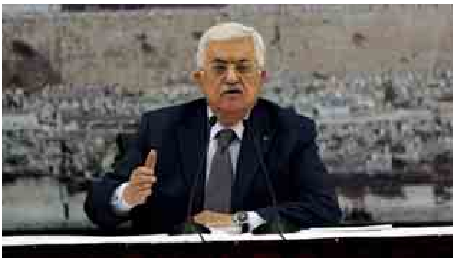
နိုင်ငံအနက် ရှစ်နိုင်ငံက အဆိုပါ ဆုံးဖြတ်ချက်ကို ထောက်ခံပေးခဲ့ သော်လည်း အမေရိကန်နှင့် ခန့်ပါရှိသော နိုင်ငံတကာတရားရုံး ဩစတြေးလျတို့က ကန့်ကွက်မဲ တည်ထောင်မှု စာချုပ်ပေါ်ကို ပေးခဲ့သည်။ မစ္စတာအဘတ်စ်က နိုင်ငံတကာ သဘောတူညီချက် ၂၀ သော်လည်း အမေရိကန်နှင့် ခန့်ပါရှိသော နိုင်ငံတကာတရားရုံး ဩစတြေးလျတို့က ကန့်ကွက်မဲ တည်ထောင်မှု စာချုပ်ပေါ်ကို

ပါလက်စတိုင်းသမ္မတ မာမူတ် အဘတ်စ်က အပြည်ပြည်ဆိုင်ရာ ရာဇဝတ်တရားရုံး (အိုင်စီစီ)သို့ ဝင်ရောက်ရန် ရာမာလာမြို့အစည်း အဝေး၌ လက်မှတ်ရေးထိုးလိုက်သည်။ အဖွဲ့ဝင်များက အစွဲအမူကို စစ်ရာဇဝတ်မှုများဖြင့် တရားစွဲဆိုရန် မျှော်လင့်ထားသည်။ ယင်းကဲ့သို့ လုပ်ဆောင်ခြင်းအပေါ် အစွဲအမူ ဝန်ကြီးချုပ်က ချက်ချင်းဆိုသလို ရှုတ်ချခဲ့သည်။