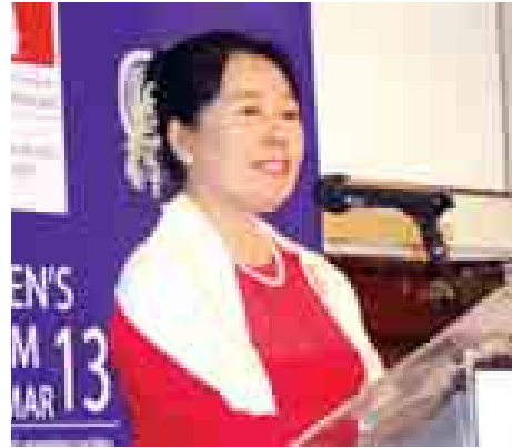
ပြည်ထောင်စုဝန်ကြီး ဒေါက်တာ ဒေါ်မြတ်မြတ်အုန်းခင်

လူမှုဝန်ထမ်း၊ ကယ်ဆယ်ရေးနှင့်ပြန်လည်နေရာချထားရေးဝန်ကြီးဌာန လူမှုဝန်ထမ်းဦးစီးဌာနက ဆောင်ရွက်လျက်ရှိသော အဓိကလုပ်ငန်းစဉ်ကြီး (၈) ရပ်၊ လူမှုကာကွယ်စောင့်ရှောက်ရေးဆိုင်ရာလုပ်ငန်းများ ပေါ်ပေါက်လာမှု၊ တစ်နိုင်ငံလုံးရှိ အသက် ၁၀၀ နဲ့အထက် ဘိုးဘွားများအား ဂုဏ်ပြုခံအဖြစ် ထောက်ပံ့ခြင်းအစီအစဉ်များနှင့်ပတ်သက်၍ သိရှိလိုသဖြင့် ပြည်ထောင်စုဝန်ကြီး ဒေါက်တာဒေါ်မြတ်မြတ်အုန်းခင်အား သတင်းအဖွဲ့က သွားရောက်တွေ့ဆုံမေးမြန်းခဲ့သည်များကို ပြန်လည်ရေးသားတင်ပြလိုက်ပါသည်-