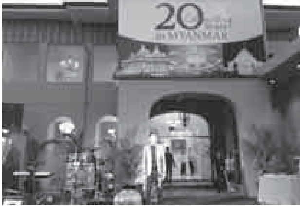
krislite သည် ယခုအခါတည်ထောင်သည့်နှစ် ၂၀ တိုင်ခဲ့ပြီဖြစ်ရာ Gallery များကို ရန်ကုန်၊ နေပြည်တော်နှင့် မန္တလေးတို့တွင် ဖွင့်လှစ်တော့မည်ဖြစ် သည်။ (၀၃၃)

ထို့အပြင် (၂၇)ကြိမ်မြောက် အရှေ့တောင်အာရှအားကစားပြိုင်ပွဲ ကျင်းပခဲ့ သည့် ဝဏ္ဏသိဒ္ဓိနှင့် ဇေယျာသီရိအားကစားကွင်းများတွင် Lighting လုပ်ငန်း များ၊ ရေကူးအားကစားပြိုင်ပွဲကျင်းပခဲ့သည့် ရေကူးတန်လုပ်ငန်းများတွင်လည်း ပူးပေါင်းဆောင်ရွက်ခဲ့သည်။ တစ်ဖန် (၂၅)ကြိမ်မြောက် အာဆီယံထိပ်သီး အစည်းအဝေးပွဲ၌လည်း Event Lighting ကို တာဝန်ယူဆောင်ရွက်ခဲ့သည့်