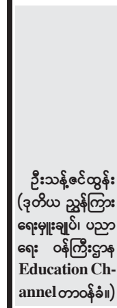
ဦးသန့်ဇင်ထွန်း (ဒုတိယ ညွှန်ကြားရေးမှူးချုပ်၊ ပညာရေး ဝန်ကြီးဌာန Education Channel တာဝန်ခံ။)

မေး။ ။ ပညာရေးကဏ္ဍ ဖွံ့ဖြိုးတိုးတက်မှုအတွက် နိုင်ငံတော်က တိုးမြှင့်ထောက်ပံ့ပေးနေတဲ့ အခြေအနေကို ရှင်းပြပေးပါရင့်။