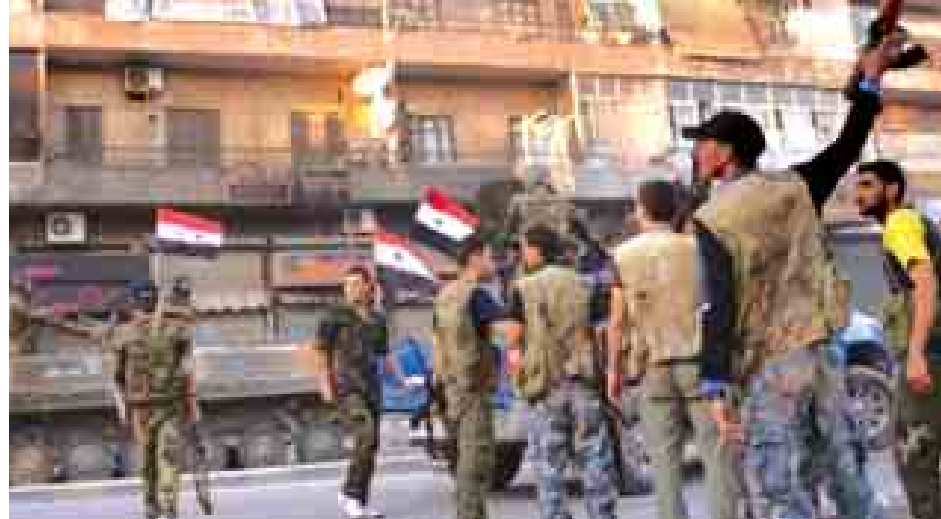
ဆီးရီးယားနိုင်ငံတွင် ဆက်လက် ဖြစ်ပေါ်နေသော ပဋိပက္ခများကြောင့် လူပေါင်း ၇ ဒသမ ၂ သန်း နေရပ် ပြောခဲ့သည်။ စွန့်ခွာခဲ့ရကြောင်း ကုလသမဂ္ဂအဖွဲ့က (ပရက်စ်တီဇီ)

နိုင်ငံခြားထောက်ပံ့ခံ စစ်သွေးကြွများသည် ဆီးရီးယားနိုင်ငံ အနောက်မြောက်ပိုင်း အလက်ပိုမြို့ရှိ လူနေရပ်ကွက်ကို စိန်ပြောင်းများဖြင့် ပစ်ခတ်တိုက်ခိုက်မှုကြောင့် အရပ်သားများ ထပ်မံသေဆုံးခဲ့ကြသည်။ အဆိုပါ အဖြစ်အပျက်သည် မြို့တော်၏ ဆူလိုင်မာနီယာရပ်ကွက်တွင် ဖြစ်ပွားခဲ့ခြင်းဖြစ်သည်။ စိန်ပြောင်းများဖြင့် ပစ်ခတ်တိုက်ခိုက်မှုကြောင့် အရေအတွက် အတိအကျမသိရသော ပြည်သူများ သေဆုံးခဲ့ကြောင်း ဆီးရီးယားမှ ပေးပို့သော သတင်းများအရ သိရသည်။ စစ်သွေးကြွများ ပစ်ခတ်လိုက်သော ဗုံးသီးတစ်လုံးမှာ အဆိုပါမြို့ရှိ မာအာဖရမ်ဘုရား ကျောင်းကို ထိမှန်ပျက်စီးစေခဲ့သည်။ ကြာသပတေးနေ့က စစ်သွေးကြွများက အလက်ပိုမြို့ဘက် ကီလိုမီတာ ၂၀ (၁၂ မိုင်)အကွာတွင် တည်ရှိသော အယ်လ်ဇာရားမြို့ရှိ လူနေအဆောက်အအုံများကို ဖုံးလွှမ်းမှုများဖြင့် တိုက်ခိုက်မှုကြောင့် ကလေးနှစ်ဦးနှင့် အမျိုးသမီးတစ်ဦး သေဆုံးခဲ့သည်။ ဆီးရီးယားသည် ၂၀၁၁ ခုနှစ် မတ်လကတည်းက ဤသို့ ပဋိပက္ခများနှင့် ရင်ဆိုင်ကြုံတွေ့နေရသော နိုင်ငံတစ်ခုဖြစ်သည်။ တက်ခီဖရစ်စစ်သွေးကြွအုပ်စုများ၏ အကြမ်းဖက်မှုကြောင့် ယခုဆိုလျှင် လူပေါင်း ၂၀၀၀၀၀ ကျော် သေဆုံးခဲ့ကြောင်း သတင်းထုတ်ပြန်ချက်များအရ သိရသည်။