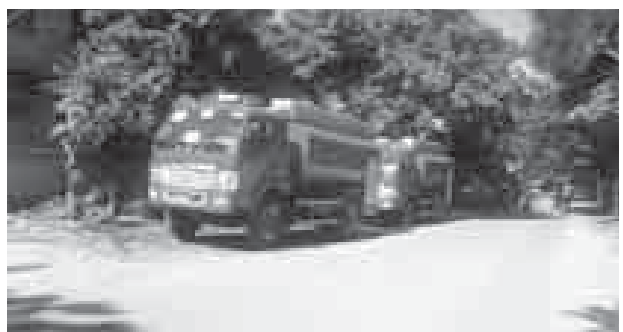
စာစာ(မကွေး)

မကွေးတိုင်းဒေသကြီး မကွေးမြို့ တိုင်းအားကစားကွင်းအတွင်း ဒီဇင်ဘာ ၂၉ ရက်က တိုင်းဒေသကြီးအစိုးရအဖွဲ့က လွှဲပြောင်းပေးအပ်သော မြို့နယ် များအတွက် မီးသတ်ယာဉ် ၃၂ စီးကို သက်ဆိုင်ရာမြို့နယ်များက လွှဲပြောင်း ရယူသည့် အခမ်းအနားကျင်းပခဲ့သည်။ မကွေးတိုင်းဒေသကြီးဝန်ကြီးချုပ် ဦးဘုန်းမော်ရွှေနှင့် တိုင်းဒေသကြီးအစိုးရ အဖွဲ့မှ တာဝန်ရှိသူများ၊ မြို့နယ်အသီးသီးမှ တာဝန်ရှိသူများနှင့် အဖွဲ့အစည်း အသီးသီးမှ ဖိတ်ကြားထားသူများ၊ မြို့နယ်အလိုက် မီးသတ်တပ်ဖွဲ့ဝင် စုစုပေါင်း ၁၀၀၀ ခန့် တက်ရောက်ကြသည်။