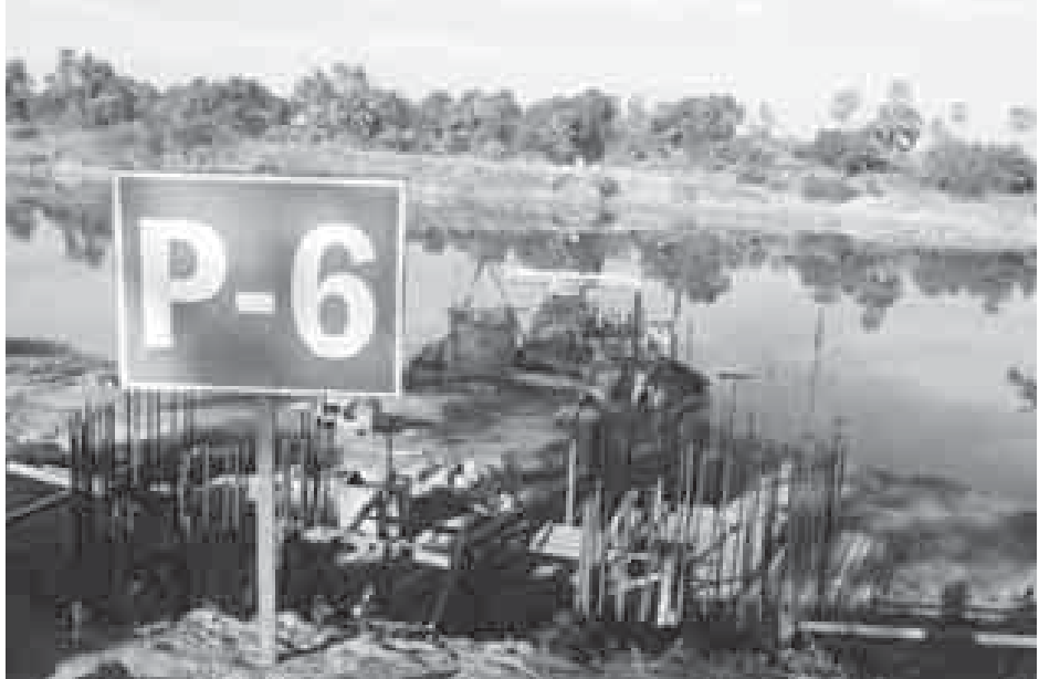
ချိုင်နေမင်း

မကွေးတိုင်းဒေသကြီး အနောက်ဘက်ခြမ်းဒေသဖွံ့ဖြိုးတိုးတက်ရေးအတွက် ပခုက္ကူ-ပေါက်-ထီးလင်း-ဂန့်ဂေါလမ်းမကြီးပေါ်၌ အမှတ်(၂)မြစ်သာမြစ်ကူး တံတား(ပျားရွာ)ကို တည်ဆောက်လျက်ရှိကြောင်း သိရသည်။ အဆိုပါတံတားကို ပြည်သူ့ဆောက်လုပ်ရေးလုပ်ငန်း အထူးစီမံကိန်းကြီးအဖွဲ့ (၃)က တည်ဆောက်နေခြင်းဖြစ်ပြီး တံတားအရှည်ပေ ၆၃၀၊ ခန်းဖွင့်ဖွဲ့စည်းပုံ ပေ ၉၀ ခုနစ်ခန်းဖြစ်ပြီး ယာဉ်သွားလမ်းအကျယ် ၁၃ ဒဿမ ၇၇၉ ပေ ဖြစ်ကြောင်း၊ ခံနိုင်ရည်အားမှာ ယာဉ်တစ်စီးချင်း ၃၆ တန်ဖြစ်ကြောင်း သိရသည်။