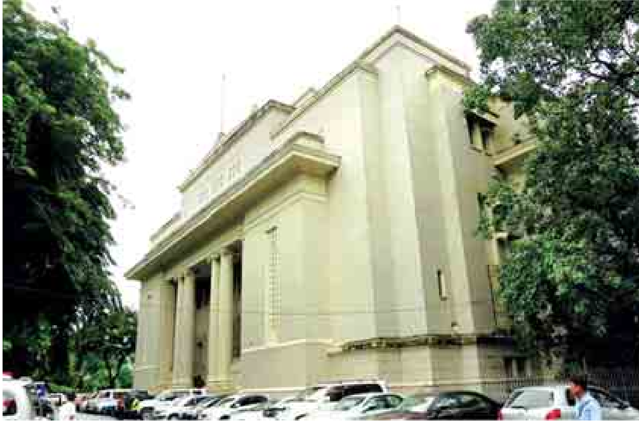
တစ်ပိုင်တစ်နိုင် စုဆောင်းငွေမှစ၍ ဝင်ရောက်ရင်းနှီးမြုပ်နှံပြီး စီးပွားရေးလုပ်ငန်းများ ဆောင်ရွက်နိုင်မည့် ရန်ကုန်စတော့အိတ်ချိန်းကို ၂၀၁၅ ခုနှစ်အတွင်း ပေါ်ပေါက်လာရန် ကြိုးပမ်းလျက်ရှိသည်။