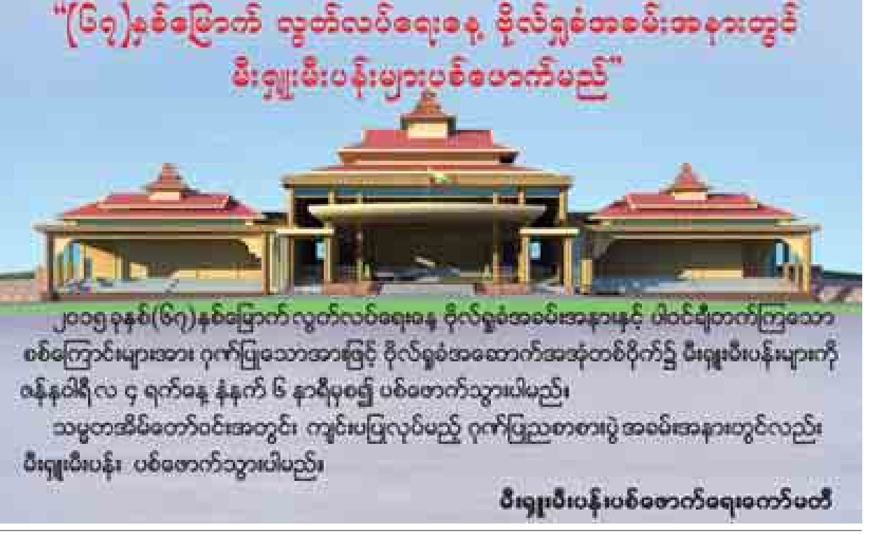
“(၆၇)နှစ်မြောက် လွတ်လပ်ရေးနေ့ ဗိုလ်ရှစ်အခမ်းအနားနှင့် ပါဝင်ချီတက်ကြသော ပစ်ကြွက်များအား ဂုဏ်ပြုသောအားဖြင့် ဗိုလ်ရှစ်အခမ်းအနားတစ်ပိုက်၌ ပီဂျူပီပန်းများကို ဝန်ဆောင်ရာမှ ၄ ရက်ခန့် နံနက် ၆ နာရီမှစ၍ ပစ်ခတ်ကင်းသွားပါမည်။ သမ္မတအိမ်တော်ဝင်အတွင်း ကျင်းပပြုလုပ်မည့် ဂုဏ်ပြုညစာစားပွဲ အခမ်းအနားတွင်လည်း ပီဂျူပီပန်း ပစ်ခတ်ကင်းသွားပါမည်။

စိတ်ဓာတ်တွေဟာ မေတ္တာတွေ လွှမ်းခြွာထားတဲ့အတွက် ကြောင့် မောက်မာတဲ့ စိတ်ဓာတ်မျိုးမထားဘဲနဲ့ ပျော့ပျောင်းတဲ့ စိတ်ဓာတ်မျိုး အဲဒီလိုစိတ်ဓာတ်မျိုးနဲ့သာလျှင် မေတ္တာနှစ်သစ်ကို တည်ဆောက်နိုင်မှာဖြစ်တယ်။ ဒါကြောင့်မို့ အကြမ်းဖက်မှုကင်းတဲ့နှစ်ဖြစ်ဖို့အတွက် အားလုံးဟာမိမိတို့ လိုက်နာရမယ့်အချက်တွေကို လိုက်နာကျင့်သုံးကြပြီး မိမိတို့စိတ်နေသဘောထားတွေကို အားလုံးတစ်ညီတည်း ပြင်ဆင်ပြီးတော့ မြတ်စွာရဲ့ အဆုံးအမအတိုင်း တစ်ဦးနဲ့တစ်ဦး အနိုင်ယူတဲ့အခါမှာ အကြမ်းဖက်မှုနဲ့ အနိုင်မယူဘဲ ဒေါသကို မေတ္တာဖြင့်အနိုင်ယူခြင်း၊ လက်နက်ကိုလည်း သည်းခံခွင့်လွှတ်ခြင်းဖြင့် အနိုင်ယူခြင်း အဲဒီလိုထာဝရကောင်းမြတ်တဲ့ အနိုင်ယူခြင်းနဲ့ အနိုင်ယူရတဲ့အခါမှာ မေတ္တာတွေလွှမ်းခြွတ် မေတ္တာနှစ်ဖြစ်မှာပါ။ ပဋ္ဌဘာသာဝင် သူတော်စင်တွေအနေနဲ့ မြတ်စွာရဲ့ အဆုံးအမကျင့်စဉ်များကို လိုက်နာ ကျင့်သုံးခြင်းဖြင့် အကြမ်းဖက်မှုကင်းတဲ့ မေတ္တာနှစ်ကို ကြီးဆိုပြီး မေတ္တာနှစ်ဖြစ်စေရောင်း ပိုင်းဝန်းဆောင်ရွက်ကြပါလို့ နှစ်ဦးမင်္ဂလာ အခါသမယမှာ အားလုံးသော ပဋ္ဌဘာသာဝင်သူတော်စင်တို့အား တိုက်တွန်းပြောကြားလိုပါတယ်။