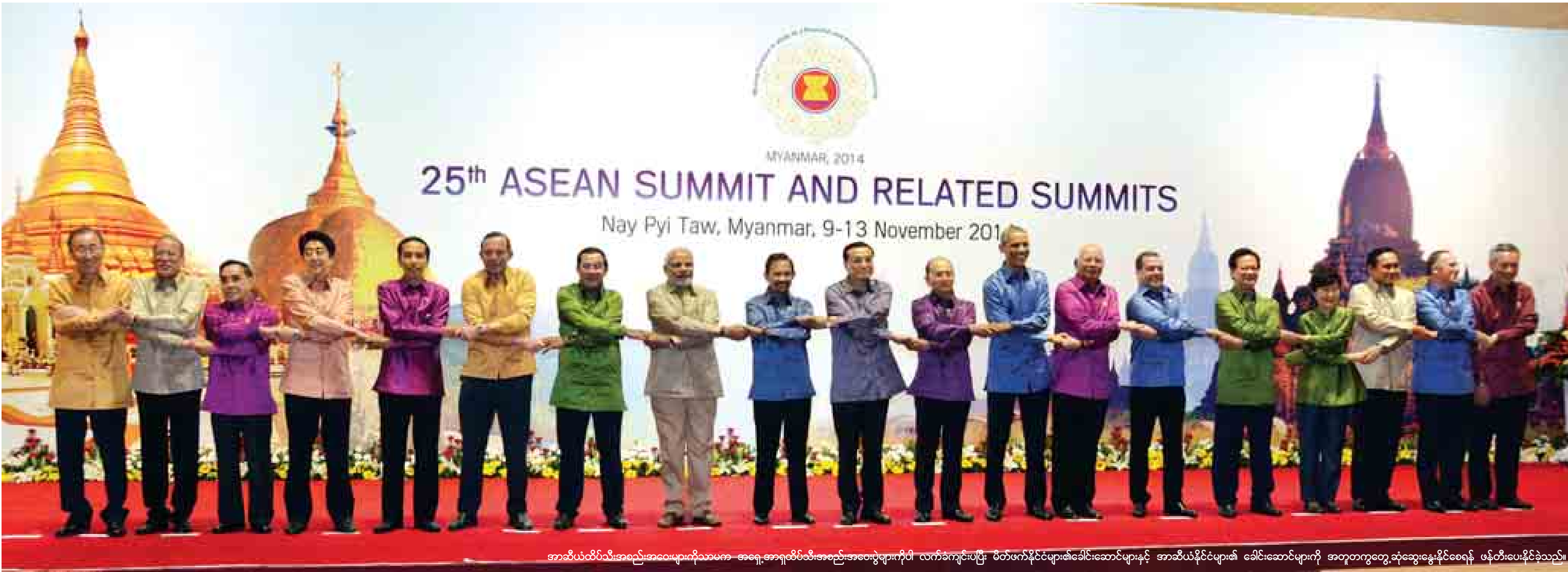
အာဆီယံထိပ်သီးအစည်းအဝေးများကိုသာမက အရှေ့အာရှထိပ်သီးအစည်းအဝေးများကိုပါ လက်ခံကျင်းပပြီး စိတ်ဖက်နိုင်ငံများ၏ခေါင်းဆောင်များနှင့် အာဆီယံနိုင်ငံများ၏ ခေါင်းဆောင်များကို အတူတကွတွေ့ဆုံဆွေးနွေးနိုင်စေရန် ဖန်တီးပေးနိုင်ခဲ့သည်။

၂၀၁၄ ခုနှစ်ဟာ လွတ်လပ်ရေးရပြီးနောက်ပိုင်း ကျွန်တော်တို့နိုင်ငံရဲ့ နိုင်ငံတကာဆက်ဆံရေးမှာ ထူးခြားတဲ့ နှစ်တစ်နှစ်ဖြစ်ခဲ့ပါတယ်။ ဒီကာလအတွင်းမှာ နှစ်ပေါင်း ၄၀ ကျော်အတွင်း မပြုလုပ်နိုင်ခဲ့တဲ့ အာဆီယံအားကစားပြိုင်ပွဲများကို အိမ်ရှင်အဖြစ်နဲ့ အောင်မြင်စွာကျွမ်းကျင်နိုင်ခဲ့ပြီး မြန်မာ့အားကစားစွမ်းရည်ကို ပြသနိုင်ခဲ့ပါတယ်။ ကျွန်တော်တို့နိုင်ငံဟာ အာဆီယံဥက္ကဋ္ဌတာဝန်ကိုလည်း ထမ်းဆောင်ခဲ့ပါတယ်။ အာဆီယံဥက္ကဋ္ဌတာဝန်ကို ထမ်းဆောင်နေစဉ်အတွင်း အာဆီယံထိပ်သီးအစည်းအဝေးများကို သာမက အရှေ့အာရှထိပ်သီးအစည်းအဝေးပွဲများကိုပါ လက်ခံကျင်းပပြီး မိတ်ဖက်နိုင်ခဲ့ဖူးရဲ့ ခေါင်းဆောင်တွေနဲ့ အာဆီယံနိုင်ငံများရဲ့ ခေါင်းဆောင်များကို အတူတကွ တွေ့ဆုံဆွေးနွေးနိုင်စေဖို့ ဖန်တီးပေးနိုင်ခဲ့ပါတယ်။ ဒီလိုထိပ်သီးအစည်းအဝေးများမှာ ဒေသတွင်းကိစ္စများ၊ တောင်တရုတ်ပင်လယ်အတွင်းက တင်းမာမှုများနဲ့ ကမ္ဘာလုံးဆိုင်ရာကိစ္စဖြစ်တဲ့ ရာသီဥတုပြောင်းလဲခြင်းဆိုင်ရာကိစ္စများအထိ ကျယ်ကျယ်ပြန့်ပြန့် ဆွေးနွေးနိုင်ခဲ့ကြပါတယ်။ ကျွန်တော်တို့နိုင်ငံအနေနဲ့ ဒီလိုဆွေးနွေးပွဲများကို ကျင်းပစီစဉ်ပေးရုံသက်သက်သာမက မတူညီတဲ့သဘောထားအမြင်များကို ပေါင်းကူးပေးခြင်း၊ တင်းမာမှုများကို လျော့ချပေးခြင်းနဲ့ အဘက်ဘက်က သဘောတူနိုင်မယ့် နည်းလမ်းများကို ရှာဖွေပေးနိုင်ခဲ့ပြီး နိုင်ငံတကာဆက်ဆံရေးရဲ့ အရေးကြီးတဲ့အခန်းကဏ္ဍမှာ ပါဝင်