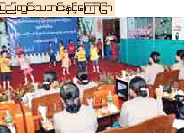
ရန်ကုန်တိုင်းဒေသကြီး အတွင်းရှိ လူမှုဝန်ထမ်းဦးစီးဌာန ဌာန၏ သင်တန်းကျောင်း ၁၁ ကျောင်းမှ ကလေးငယ်များ၊ သင်တန်းသားသင်တန်းသူ ၁၀၀ ကျော်တို့၏ စုပေါင်းပဒေသာကပွဲကို ဒီဇင်ဘာ ၂၉ ရက်က ဗဟန်းမြို့နယ် အလယ်ရွှေဂုံတိုင်လမ်းရှိ ကလေးပြုစုရေးဌာန (ရွှေဂုံတိုင်)ခန်းမတွင် ကျင်းပရာ ကလေးငယ်များ တပျော်တပါး ပါဝင်ဆင်နွှဲကပြပျော်ဖြေကြစဉ်။ အောင်သန်း(မင်္ဂလာတောင်ညွန့်)

ရောက်မှု အနည်းဆုံးဖြစ်စေမည့် ဝင်ငွေစုဆောင်းသည့် ရန်ပုံငွေစနစ် တစ်ခုထူထောင်သွားမည်ဖြစ်ကြောင်း၊ အဆိုပါ စုဆောင်းငွေနှင့်နေစရာ မပူပင်ရဘဲ ရင်သွေးငယ်များ၏ပညာရေး၊ ကျန်းမာရေးကိစ္စရပ်များတွင် စိတ်ချမ်းမြေ့ဖွယ် ပတ်ဝန်းကျင်တစ်ခုကို ဖော်ဆောင်ပေးနိုင်မည်ဖြစ်ကြောင်း၊ အခမဲ့ကျန်းမာရေးစောင့်ရှောက်မှုစနစ်၊ ကျန်းမာရေးနှင့် လူမှုစောင့်ရှောက်မှု အာမခံစနစ် ၂၀၁၅-၂၀၁၆ ပညာသင်နှစ်တွင် အခမဲ့အထက်တန်းအထိ ပညာရေးစနစ်ကို ဆောင်ရွက်ပေးရန် စီစဉ်ထားကြောင်း ပြောကြားသည်။ ယင်းနောက် ပညာရေးဝန်ကြီးဌာန ဒုတိယဝန်ကြီး၊ ကျန်းမာရေးဝန်ကြီးဌာန ဒုတိယဝန်ကြီး၊ ဘဏ္ဍာရေးဝန်ကြီးဌာန ဒုတိယဝန်ကြီး၊ အလုပ်သမား၊ အလုပ်အကိုင်နှင့် လူမှုဖူလုံရေးဝန်ကြီးဌာန ဒုတိယဝန်ကြီးများက ဝန်ကြီးဌာနအလိုက် ဝန်ထမ်းများနှင့်ပြည်သူများ သက်သာချောင်ချိရေးဆိုင်ရာအခြေအနေများကို ဘဏ္ဍာရေးနှစ်အလိုက် ကိန်းဂဏန်းအချက်အလက်များနှင့် ရှင်းလင်းတင်ပြကြသည်။ (သတင်းစဉ်)