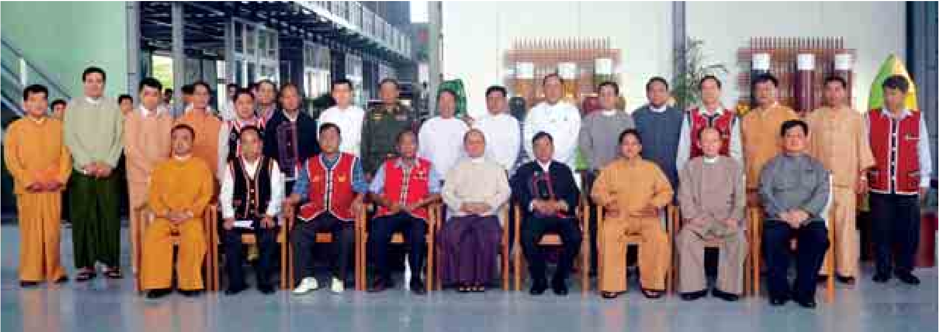
နှစ်ဖက်စေ့စေ့ဆွေးနွေးခြင်းနည်းလမ်းများနှင့် အဖြေရှာသည့် နိုင်ငံရေးယဉ်ကျေးမှုသစ်ကို ပိုမိုအသက်ဝင်အောင်ဆောင်ရွက်နိုင်ခဲ့ပြီဖြစ်သည်။

၂၀၁၅ အထွေထွေရွေးကောက်ပွဲများ အောင်မြင်စွာ ကျင်းပနိုင်ရေးနဲ့ တစ်နိုင်ငံလုံးအတိုင်းအတာ ပစ်ခတ်တိုက်ခိုက်မှုရပ်စဲရေး သဘောတူညီချက်ကို အခြေခံတဲ့ နိုင်ငံရေးဆွေးနွေးပွဲများ ကျင်းပနိုင်ရေး လုပ်ငန်းစဉ်များ အပြိုင်ပေါ်ပေါက်ရေးဟာ မိမိတို့အားလုံးအတွက် အလွန်အရေးကြီးတဲ့ နိုင်ငံရေးဖြစ်စဉ်များပဲဖြစ်