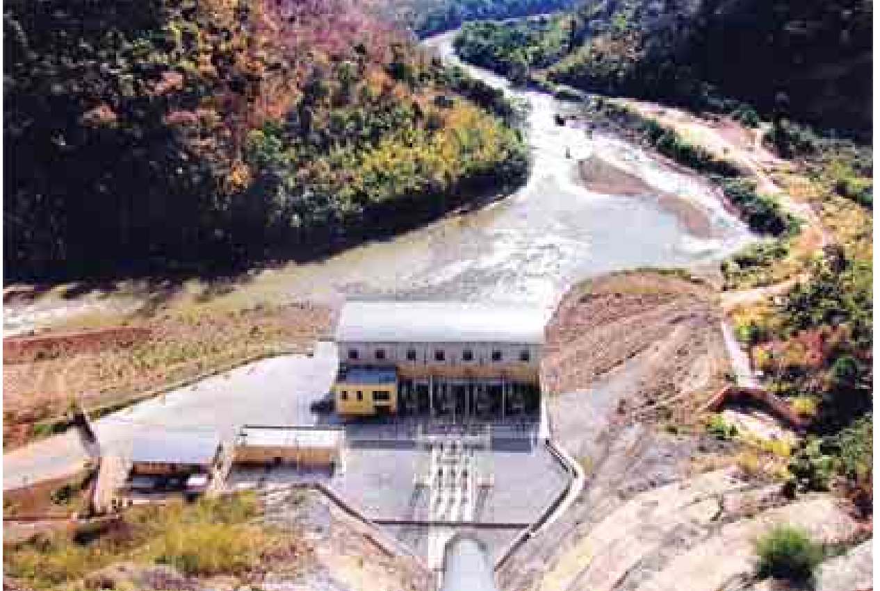
ဘီလူးချောင်းအမှတ်(၃)ရေအားလျှပ်စစ်စက်ရုံကို တွေ့ရစဉ်။

တည်ဆောက်ခဲ့သော စီမံကိန်းဖြစ် သည်။ ဘီလူးချောင်းအမှတ်(၃) စာမျက်နှာ ၉ ကော်လံ ၄