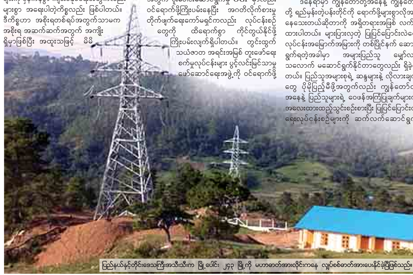
ပြည်နယ်နှင့်တိုင်းဒေသကြီးအသီးသီးက မြို့ပေါင်း ၂၄၃ မြို့ကို မဟာဓာတ်အားလိုင်းကနေ လျှပ်စစ်ဓာတ်အားပေးနိုင်ခဲ့ပြီဖြစ်သည်။

မိဘပြည်သူများ ကိုယ်၏ကျန်းမာခြင်း၊ စိတ်၏ ချမ်းသာခြင်းနှင့်ပြည့်စုံကြပါစေ။