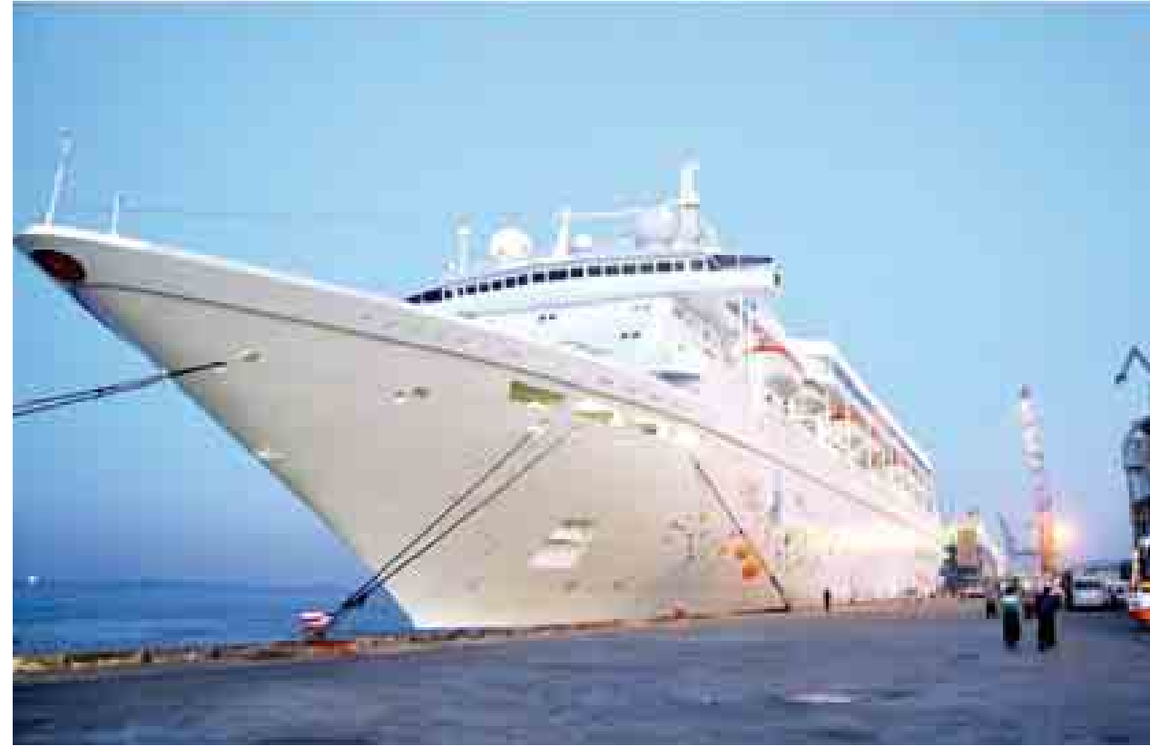
ခရီးသွားလုပ်ငန်းတွင် ၂၀၁၄ ခုနှစ်အတွင်း မြန်မာနိုင်ငံသို့ လာရောက် လည်ပတ်သူ သုံးသန်းကျော်ရှိခဲ့ပြီး တိုင်းပြည်အတွက် ဝင်ငွေ အမေရိကန်ဒေါ်လာ သုံးဘီလီယံခန့် တိုးတက်ရရှိခဲ့သည်။