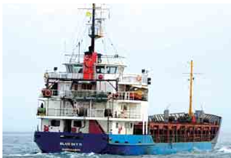
ရောမ ဒီဇင်ဘာ ၃၁ တင်ဆောင်လာသော ကုန်တင်သင်္ဘော ဆိပ်ကမ်း၌ ဆိုက်ကပ်ခဲ့ကြောင်း ရွှေ့ပြောင်းနေထိုင်သူ ၇၀၀ တစ်စင်း အီတလီနိုင်ငံ ဂါလီပိုလီ တာဝန်ရှိသူများက ပြောကြားသည်။

“သည်ဘလူးစကိုင်းအမ်” ဟု အမည်ပေးထားသည့် အဆိုပါကုန်တင်သင်္ဘောကို အီတလီဆိပ်ကမ်း တစ်ခုသို့ ဦးတည်ခတ်မောင်းနေစဉ် သင်္ဘောသားများက အလိုအလျောက် ခုတ်မောင်းစနစ်ဖြင့် ခုတ်မောင်းစေကာ စွန့်ပစ်ခဲ့သည်ဟု ဆိုသည်။ အဆိုပါ သင်္ဘောပေါ်တွင် လိုက်ပါလာသောသူများတွင် ဆီးရီးယားနှင့် ကာဒ်လူမျိုးများလည်း ပါဝင်သည်ဟု သတင်းများက ဖော်ပြသည်။ အဆိုပါ ဆိပ်ကမ်းရှိ လူများနှင့် ပြည့်နှက်နေသော သင်္ဘောပုံကိုဒေသဆိုင်ရာ အီတလီကြက်ခြေနီအဖွဲ့က မှတ်တမ်းတင်စာတိုက်များရှိ၍ ဖော်ပြခဲ့သည်။ အီတလီနိုင်ငံသည် ပြောင်းရွှေ့နေထိုင်သူများ၏ ပြဿနာကို ကိုင်တွယ်ဖြေရှင်းနေရပြီး အဓိကအားဖြင့် အရှေ့အလယ်ပိုင်းနှင့် အာဖရိက ဦးချိဒေသများမှ ပြောင်းရွှေ့နေထိုင်သူများ ဝင်ရောက်လျက်ရှိသည်။ (ဘီဘီစီ)