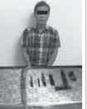
ဖြင့် အမှုများရေးဖွင့်ကာ အရေးယူ ဆောင်ရွက်ခဲ့သည့်အပြင် ယခင် တရားခံပြေးအမှုများဖြင့်လည်း ဆက် လက်အရေးယူ ဆောင်ရွက်လျက်ရှိ ကြောင်း သိရသည်။