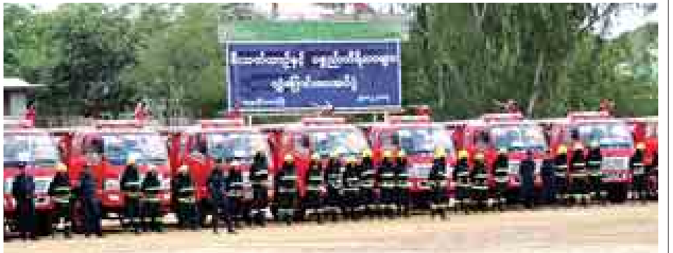
ဦးစီးအရာရှိ ဦးကျော်သိန်းထံသို့ လည်းကောင်း၊ လုံခြုံရေးနှင့် နယ်စပ်ရေးရာဝန်ကြီးဌာန ဗိုလ်မှူးကြီး ဇော်လင်းအောင်က သရက်ခရိုင်အတွက် မီးသတ်ရေသယ်ယာဉ် ခုနစ်စီး၊ မင်းဘူးခရိုင်အတွက် မီးသတ်ရေသယ်ယာဉ်ခုနစ်စီးတို့ကို သရက်ခရိုင်မီးသတ်ဦးစီးဌာနမှ ဦးစီးအရာရှိ ဦးမြင့်နိုင်ထံသို့ လည်းကောင်း ပေးအပ်ခဲ့ကြောင်းနှင့်မကွေးမြို့နယ် မီးသတ်ဦးစီးဌာနမှ တပ်ကြပ်ကြီး ဇော်မင်းထွန်းနှင့်အဖွဲ့က မီးလောင်မှုကို လက်တွေ့မီးငြိမ်းသတ်ခြင်း သရုပ်ပြမှုများပြုလုပ်ခဲ့ကြောင်း သိရသည်။ ကျော်ဇေယျ

မကွေး ဒီဇင်ဘာ ၃၁ မကွေးမြို့ ရန်ကော်ရပ်ရှိ မကွေးတိုင်းဒေသကြီးအားကစားကွင်းတွင် ဒီဇင်ဘာ ၂၉ ရက်နံနက် ၉ နာရီက မကွေးတိုင်းဒေသကြီး အစိုးရအဖွဲ့မှ တိုင်းဒေသကြီးအတွင်းရှိ မြို့နယ်များအတွက် CNG မီးသတ်ရေသယ်ယာဉ် ၃၁ စီး လွှဲပြောင်းပေးအပ်ခြင်းအခမ်းအနား ကျင်းပခဲ့သည်။ အခမ်းအနားတွင် တိုင်းဒေသကြီးဝန်ကြီးချုပ် ဦးဘုန်းမော်ရွှေက အမှာစကားပြောကြားပြီး မကွေးခရိုင်အတွက် မီးသတ်ရေသယ်ယာဉ် ၁၀ စီး၊ ပခုက္ကူခရိုင်အတွက် မီးသတ်ရေသယ်ယာဉ်ငါးစီး၊ ဂန့်ဂေါခရိုင်အတွက် မီးသတ်ရေသယ် ယာဉ်နှစ်စီးတို့ကို မကွေးခရိုင်မီးသတ်ဦးစီးဌာနမှ