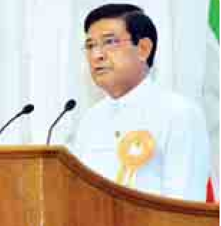
ဇွန်ထုညီမျှ ဝါဒဖြူစင်တဲ့မြေ” ဖြစ်အောင် ရဲ့တဲ့ သတ္တိ . . . ခိုင်မြဲတဲ့သန္နိဋ္ဌာန် . . . အရာရာအသင့်ဖြစ်မှုတွေနဲ့အတူ ကျွန်တော်တို့အားလုံး ပေါင်းစုံညီညွတ်စွာ အတူတကွထူထောင်တည်ဆောက်သွားကြဖို့ တိုက်တွန်းအပ်ပါတယ်ခင်ဗျား . . .

ကြောင့် စိတ်မကောင်းစရာတွေလည်း ကြီးခဲ့ရပါတယ် . . . ၂၀၀၄ ခုနှစ် ဖြတ်သန်းမှုအတွေ့အကြုံတွေကနေပြီး သင်ခန်းစာများ ဖော်ထုတ်ကာ လာတော့မယ့် ၂၀၁၅ ခုနှစ်ကို ပြည်ထောင်စုကြီးအတွက် ငြိမ်းချမ်းမှုနဲ့ ချမ်းသာကြွယ်ဝမှုကို ဆောင်ကြဉ်းလာနိုင်မယ့် နှစ်သစ်အဖြစ် ကျွန်တော်တို့အတွက် ဖန်တီးနိုင်ကြမယ်လို့ မျှော်လင့်ပါတယ်. . . “လူထုအား . . . အများကြီးလိုသည်” ဆိုတာ ကျွန်တော်တို့ရဲ့ စွဲမြဲတဲ့ခံယူချက်ဖြစ်ပါတယ်. . . လူထုရဲ့ ယုံကြည်မှုနဲ့ တက်ကြွစွာ ပူးပေါင်းဆောင်ရွက်မှုဟာ အောင်မြင်မှုအတွက် သော့ချက်ဖြစ်ပါတယ်. . . ကျွန်တော်တို့ရဲ့ ပြည်ထောင်စု မြန်မာနိုင်ငံတော်ကြီးကို “များလူခင်သိမ်း ငြိမ်းချမ်းစေဖို့ . . .