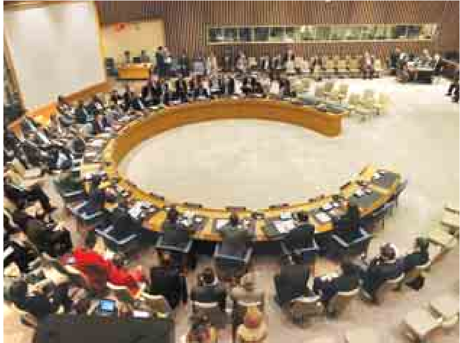
အဆိုပါ ဆုံးဖြတ်ချက်အရ သိမ်းပိုက်နယ်မြေများမှ အစွဲရောင်းတို့ ပြင်းချမ်းရေးစာချုပ်ရမည်ဟု ဆို ၂၀၁၅ ခုနှစ်အကုန် ပါလက်စတိုင်း လုံးဝရုပ်သိမ်းပေးပြီး တစ်နှစ်အတွင်း (ဘီဘီစီ)

ပါလက်စတိုင်းနယ်မြေများအား အစွဲရောင်းသိမ်းပိုက်မှုကို သုံးနှစ်အတွင်း အဆုံးသတ်ပေးရန် တောင်းဆိုချက် အပေါ် ကုလသမဂ္ဂ လုံခြုံရေးကောင်စီက ပယ်ချလိုက်သည်။ အာရပ် ၂၂ နိုင်ငံနှင့် ပါလက်စတိုင်း အာဏာပိုင်တို့ သဘောတူညီပြီးနောက် ယင်းအဆိုကို ရော့ဒ်နီက တင်ပြခဲ့ခြင်းဖြစ်သည်။ ကုလသမဂ္ဂ လုံခြုံရေးကောင်စီ အဖွဲ့ဝင် ၁၅ နိုင်ငံအနက် ရှစ်နိုင်ငံက ထောက်ခံပေးပြီး အမေရိကန်နှင့် ဩစတြေးလျတို့က ကန့်ကွက်ခဲ့ကြသည်။ ယင်းဆုံးဖြတ်ချက်အပေါ် အစွဲရောင်းက ရှုတ်ချလိုက်ပြီး လုံခြုံရေးကောင်စီအဖွဲ့ဝင် ကိုးနိုင်ငံထက် မနည်း ထောက်ခံပေးရမည်ဟု ဆိုသည်။ အဖွဲ့ဝင်ကိုးနိုင်ငံက မဲပေးသည့်တိုင်အောင် အမေရိကန်အနေဖြင့် ဗီတိုအာဏာဖြင့် ပယ်ချနိုင်သည်ဟု ဆိုသည်။