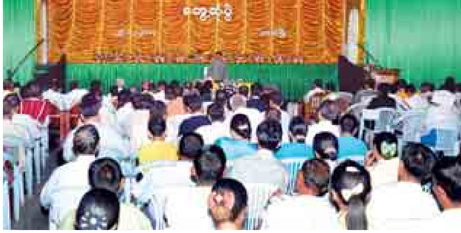
နေပြည်တော် ဒီဇင်ဘာ ၃၀

ပြည်ထောင်စု ရွေးကော်မရှင်အဖွဲ့အစည်း ၂၀၁၅ ခုနှစ် အောက်တိုဘာလကုန် သို့မဟုတ် နိုဝင်ဘာလ ပထမပတ်တွင် ကျင်းပရန် စီစဉ်ထားသည့် အထွေထွေရွေးကော်မရှင်အဖွဲ့အစည်းများ၊ လွတ်လပ်တရားမျှတသည့် ရွေးကော်မရှင်အဖွဲ့အစည်းများ၊ ပွင့်လင်းမြင်သာမှုမရှိခြင်း၊ လွတ်လပ်မှုနှင့် မျှတမှုမရှိခြင်းသည် ရွေးကော်မရှင်အဖွဲ့အစည်းများနှင့် ပြောကြားသည်။