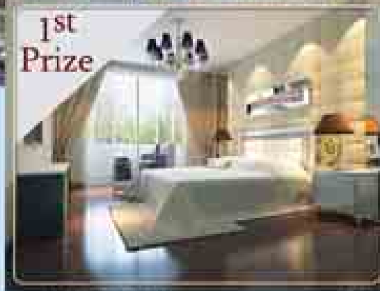
1st Prize (၂၅)ထပ်အိမ်သုံးအိမ်သုံးပါ CONDOMINIUM တစ်ခန်း