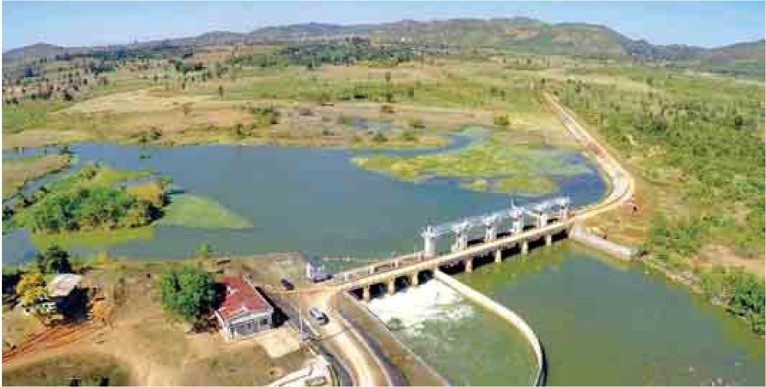
လျှပ်စစ်ဓာတ်အားထုတ်လုပ်ရေးသာမက စိုက်ပျိုးရေးအတွက်ရေပေးနေသည့် မိုးပြေရေလှောင်ကန်ကြီးကို ဤသို့တွေ့ရသည်။

ယနေ့ » မာတိကာ နောင်ချိုမြို့နယ်၌ ငြိမ်းချမ်းစွာ စုပေါင်းသန္ဓေထုတ်ဖော် စာ » ၅ အလမ်း၏ မြစ်ဖျား စာ » ၆၊ ၇ ဟေဖီတလုပ်ငန်း ဆောင်ရွက်သူအား နှလုံးလှထူးချွန်ချီးမြှင့် စာ » ၁၇