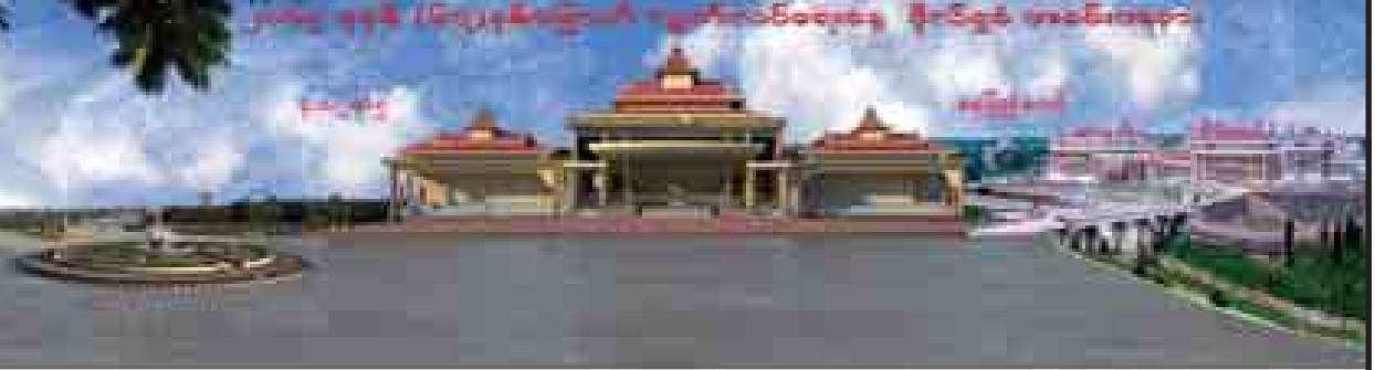
(၆၇)နှစ်မြောက် လွတ်လပ်ရေးနေ့ ဦးစည်ချက်