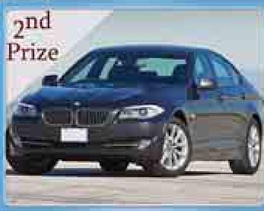
2nd Prize BMW 528 BRAND NEW