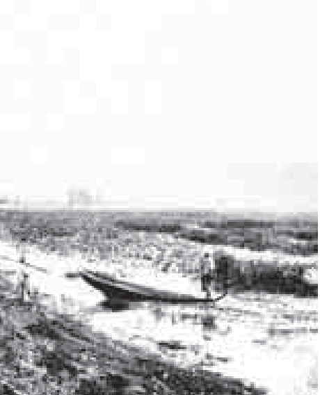
လက်တံမြောင်းဖြစ်၏။ ယခုလယ်ကွင်းများမရှိတော့ လူနေရပ်ကွက် အလယ်ကောင်မှာဖြစ်သည်။

စောင်းစောင်းဖြတ်သွားလေသည်။ ခပ်တိမ်တိမ်မြောင်းဖြစ်သောကြောင့် လမ်းမကြီးက မြင့်တက်ခုံးပေးရသည်။ ထိုနေရာကား အန္တရာယ်ကြီးလှသော နေရာဖြစ်၏။ ခုံးနေတာက တည့်တည့်မဟုတ်ဘဲ ၄၅ ဒီဂရီအစောင်းမို့ လမ်းက လိမ်နေသည်။ စစ်စစ်ရေနံမြောင်းသည် ရှေးမြန်မာမင်းများလက်ထက်က လယ်များ ရေးပေးဝေသည့်