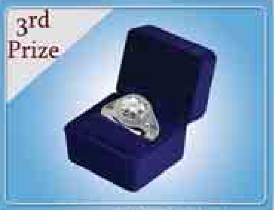
3rd Prize GIA(3) ကရက်ဂျီမီနိုက်ယက်စွပ်တစ်စွပ်