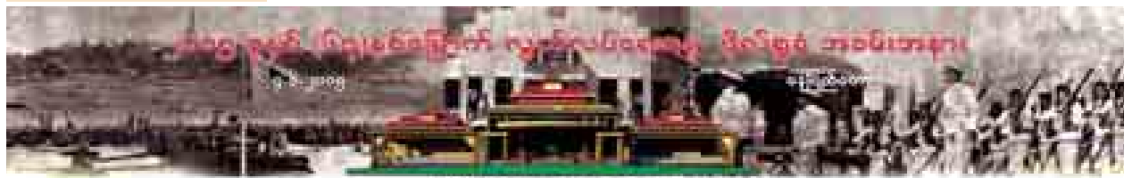
(၆၇)နှစ်မြောက် လူတော်လှန်ရေးရေ ဦးတည်ချက်