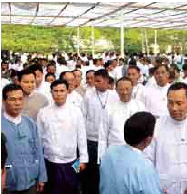
ပြည်ထောင်စုလွှတ်တော်နာယက ပြည်သူ့လွှတ်တော်ဥက္ကဋ္ဌ သူရဦးရွှေမန်း တောင်သူလယ်သမားရေးရာ လူထုတွေ့ဆုံပွဲအခမ်းအနားတွင် တက်ရောက်လာကြသူများအား ရင်းရင်းနှီးနှီး နှုတ်ဆက်စဉ်။

မန္တလေးတိုင်းဒေသကြီး မန္တလေးခရိုင်၊ ပြင်ဦးလွင်ခရိုင်၊ ကျောက်ဆည်ခရိုင်၊ မိတ္ထီလာခရိုင်၊ မြင်းခြံခရိုင်၊ ညောင်ဦးခရိုင်နှင့် ရမည်းသင်းခရိုင် တို့ အတွင်းရှိ မြို့နယ်များမှ တောင်သူလယ်သမားကြီးများ တက်ရောက်ကြသည့် တောင်သူလယ်သမားရေးရာ လူထုတွေ့ဆုံပွဲ အခမ်းအနားကို ယနေ့ နံနက် ၈ နာရီတွင် မန္တလေးတိုင်းဒေသကြီး စဉ့်ကိုင်မြို့ စံပြကျေးရွာကွင်း၌ကျင်းပရာ ပြည်ထောင်စုလွှတ်တော်နာယက ပြည်သူ့လွှတ်တော်ဥက္ကဋ္ဌ သူရဦးရွှေမန်း တက်ရောက်အမှာစကားပြောကြားသည်။