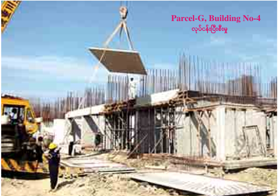
Parcel-G, Building No-4 လုပ်ငန်းပြီးစီးမှု

အထပ်မြင့်အိမ်ရာ စီမံကိန်းတစ်ခုဖြစ်သည့်အလျောက် နည်းပညာဆိုင်ရာမာသည့် နိုင်ငံတကာအဆင့်မီကုမ္ပဏီတစ်ခုဖြစ်သော စင်ကာပူနိုင်ငံအခြေစိုက် Surbana ကုမ္ပဏီအား Design အပ်နှံဆောင်ရွက်ခြင်းဖြစ်ပြီး ငလျင်ဒဏ်နှင့် လေမုန်တိုင်းဒဏ်များကို ခံနိုင်ရန် Design ပြုလုပ်ထားခြင်းဖြစ်သည်။ မြန်မာနိုင်ငံတွင် လက်ရှိ အသုံးပြုလျက်ရှိသော သမားရိုးကျ တည်ဆောက်မှု နည်းပညာများအစား ပေါင်းစပ်စနစ် (Combine Method) ကို ပြောင်းလဲအသုံးပြုတည်ဆောက်လျက် ရှိသည်။ မြန်မာနိုင်ငံတွင် နိုင်ငံတကာ အသုံးပြု တည်ဆောက်မှု နည်းပညာများ ဖွံ့ဖြိုးလာစေရန် မြန်မာ့ ရေမြေသဘာဝ ပထဝီအနေအထားတို့နှင့် လိုက်လျောညီထွေမှုရှိသည့် တည်ဆောက်ရေး နည်းပညာများကို နိုင်ငံတွင်းရှိ တိုင်းရင်းသားလုပ်ငန်းရှင်များ အမြင် ကျယ်ပြန့်စွာ လက်တွေ့အသုံးပြုတည်ဆောက်လာနိုင် ရန် ရည်ရွယ်၍ နည်းပညာအသစ်ဖြင့် တည်ဆောက်