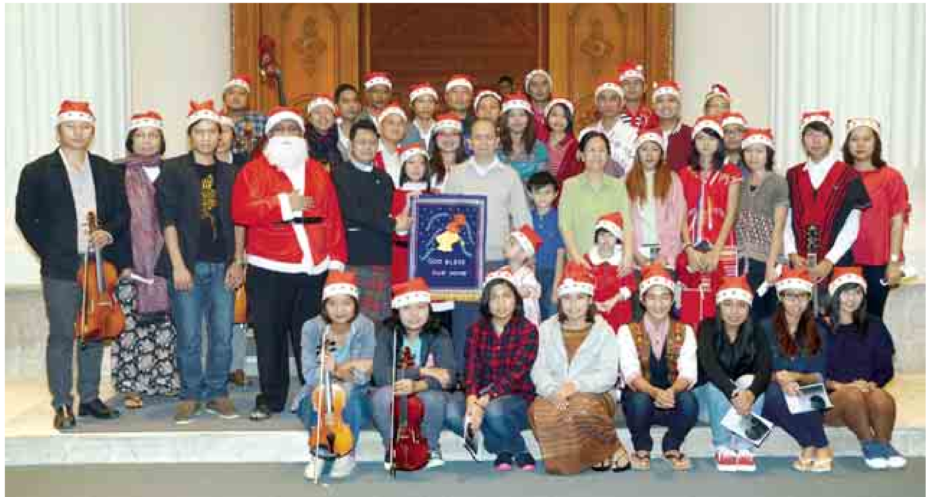
နိုင်ငံတော်သမ္မတ ဦးသိန်းစိန်၊ ဇနီးဒေါ်ခင်ခင်ဝင်းနှင့်မိသားစုတို့ ငြိမ်းချမ်းရေးအတွက် ခရစ်ယာန်လူငယ်များ ဓမ္မတေးအဖွဲ့နှင့် စုပေါင်းမှတ်တမ်းတင်ဓာတ်ပုံရိုက်စဉ်။ (သတင်းစဉ်)

နေပြည်တော် ဒီဇင်ဘာ ၂၄ နိုင်ငံတော်သမ္မတ ဦးသိန်းစိန်၊ ဇနီးဒေါ်ခင်ခင်ဝင်းနှင့် မိသားစုတို့အား ခရစ်တော်မွေးနေ့အကြိုအဖြစ် မြန်မာနိုင်ငံခရစ်ယာန်ကောင်စီမှ အမှုဆောင်အတွင်းရေးမှူးနှင့် တိုင်းရင်းသားလူငယ်များပါဝင်သော ငြိမ်းချမ်းရေး