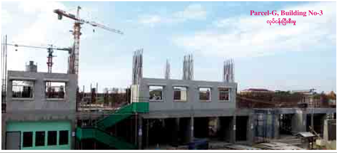
Parcel-G, Building No-3 လုပ်ငန်းပြီးစီးမှု

ရော့ဂ်၊ ရတနာအထပ်မြင့် အိမ်ရာစီမံကိန်းတွင် လျှပ်စစ်ဓာတ်အားရရှိရေးအတွက် ဆောင်ရွက်ထားရှိ ပြီးဖြစ်၍ ရော့ဂ်ဘက်အပိုင်းသို့ လျှပ်စစ်ဓာတ်အား ဖြန့်ဖြူးနိုင်ရန် (66/11 KV 60 MVA) ရော့ဂ် ဓာတ်အားရရှိရေးအတွက် (66/11KV 60 MVA ) ရတနာဓာတ်အားခွဲရုံတစ်ရုံကိုလည်း တည်ဆောက် ဆောင်ရွက်လျက်ရှိရာ ဓာတ်အားခွဲရုံနှစ်ခုလုံး ၁၀၀ ရာခိုင်နှုန်း တည်ဆောက်ပြီးစီးခဲ့ပြီး ဖြစ်ပါသည်။ စီမံကိန်းအတွင်း သောက်ရေ/သုံးရေ ဖြန့်ဖြူးပေး ရန်အဆောက်အအုံတစ်လုံးတွင် အများပြည်သူသုံး အတွက် ရေဂါလန် ၈၅၀၀၀ ဆုံ မြေအောက်ရေကန် တစ်လုံးနှင့် မီးသတ်ရေအဖြစ် ဂါလန် ၃၀၀၀၀ ဆုံ မြေအောက်ရေကန်တစ်လုံးတို့ ထည့်သွင်းတည်ဆောက် ထားပါသည်။ ရော့ဂ်၊ ရတနာစီမံကိန်းတွင် လူနေအိမ်ခန်းများ နှင့်အတူ ဆေးရုံ Bus Terminal၊ ကျောင်း၊ အားကစား ကွင်း၊ Shopping Mall များ ပေါင်းစပ်ပါဝင်ဖွဲ့စည်း တည်ဆောက်ထားသောကြောင့် တစ်နေရာတည်း၌ပင် လိုအပ်ချက်များ ပြီးပြည့်စုံစေနိုင်သည့် အိမ်ရာစီမံကိန်း တစ်ခုဖြစ်ကြောင်း သိရသည်။