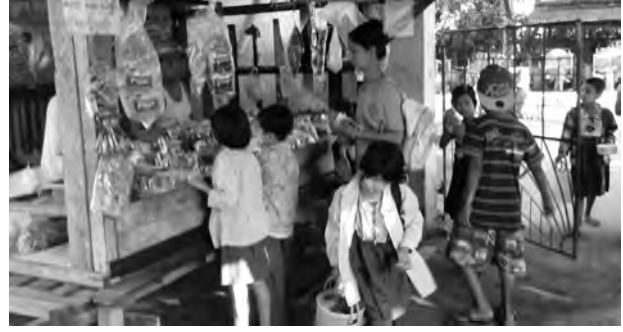
သာကေတမြို့နယ်ရှိ ကျောင်းတစ်ကျောင်းမှ မှန်ဈေးတန်းကို တွေ့ရစဉ်။

၂၀၀၀ ကျော် ဓာတ်ခွဲစမ်းသပ် မြန်မာနိုင်ငံတွင် ကျောင်းမှန်ဈေးတန်းမှန်များ ဘေးအန္တရာယ် ဆိုးကျိုးများ မဖြစ်ပေါ်စေရေးအတွက် စစ်ဆေးအရေးယူမှုများ ပြုလုပ်လျက်ရှိရာ မှန်အမျိုးအစားပေါင်း ၂၀၀၀ ကျော်ကို ဓာတ်ခွဲစမ်းသပ်စစ်ဆေးနိုင်ခဲ့ပြီးဖြစ်ကြောင်း ကျန်းမာရေးဝန်ကြီးဌာန အစားအသောက်နှင့် ဆေးဝါးကွပ်ကဲရေးဦးစီးဌာနမှ တာဝန်ရှိသူတစ်ဦးက ပြောကြားသည်။