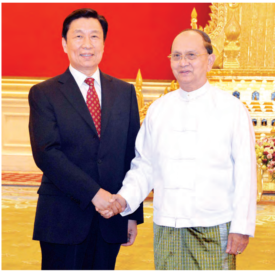
နိုင်ငံတော်သမ္မတ ဦးသိန်းစိန် တရုတ်ပြည်သူ့သမ္မတနိုင်ငံ ဒုတိယသမ္မတ မစ္စတာ လီယွမ်ချောင်အား ရင်းနှီးနှီး နှုတ်ဆက်စဉ်။ (သတင်းစဉ်)

အဖွဲ့ကဏ္ဍတိုးမြှင့်ရေး၊ နှစ်နိုင်ငံပြည်သူ့လူထုအကြား ယဉ်ကျေးမှုပူးပေါင်းမြှင့်တင်ရေး၊ နှစ်နိုင်ငံနယ်စပ် ဒေသ တစ်လျှောက် တည်ငြိမ်အေးချမ်းရေးအတွက် လက်တွဲ ပူးပေါင်းဆောင်ရွက်ရေး၊ နှစ်နိုင်ငံနိုင်ငံ့ခေါင်းဆောင်များ အပြန်အလှန် ချစ်ကြည်ရေးခရီးလည်ပတ်ရေးတို့နှင့် စပ်လျဉ်း၍ ရင်းနှီးပွင့်လင်းစွာ ဆွေးနွေးခဲ့ကြသည်။ ထိုသို့ တွေ့ဆုံရာတွင် နိုင်ငံတော်သမ္မတနှင့်အတူ ပြည်ထောင်စုဝန်ကြီး ဦးဝဏ္ဏမောင်လွင်၊ ဦးကျော်ဆန်း၊ ဦးအုန်းမြင့်၊ ဦးဇေယျာအောင်၊ ဦးဝင်းမြင့်၊ ဦးအေးမြင့်ကြူ၊ ဒေါက်တာကံဇော်၊ ဦးသန်းဌေးတို့ တက်ရောက်ကြပြီး ဧည့်သည်တော်တရုတ်နိုင်ငံဒုတိယသမ္မတ ဦးဆောင်သော ကိုယ်စားလှယ်အဖွဲ့နှင့်အတူ မြန်မာနိုင်ငံဆိုင်ရာ တရုတ် သံအမတ်ကြီး မစ္စတာ ယန်ဟိုလန်လည်း တက်ရောက်ခဲ့ သည်။ (သတင်းစဉ်)