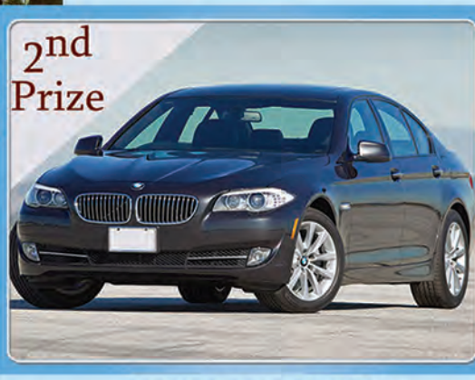
2nd Prize BMW 528 BRAND NEW