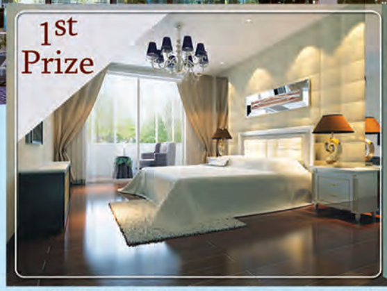
1st Prize (၂၅)ထပ်ပိုဒီပဲခန်းနှစ်ခန်းပါ CONDOMINIUM တစ်ခန်း