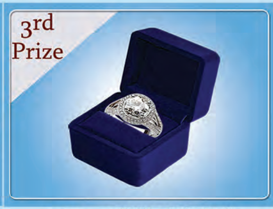
3rd Prize GIA(3) ကာရက်ဂျီမီနီယံလက်စွပ်တစ်ကွင်း