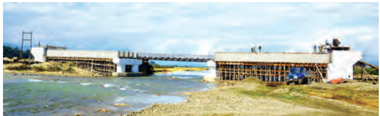
နမ်ထွမ်ချောင်းကူး(လုံးစွတ်)သံကူကွန်ကရစ်တံတားတည်ဆောက်နေမှုကို တွေ့ရစဉ်။

ကျေးလက်ဒေသပွံ့မြို့တိုးတက်ရေး ကဏ္ဍများတွင် ပိုမို ပူးပေါင်းဆောင်ရွက်ရေး၊ မြန်မာနိုင်ငံ၏စိုက်ပျိုးရေးနှင့် မွေးမြူ ရေးထွက်ကုန်များကို တန်ဖိုးမြှင့်ထုတ်လုပ်နိုင်ရေးအတွက် အသေး စားနှင့် အလတ်စားစက်မှုလက်မှုလုပ်ငန်းများ ထွန်းကားရေးဆွေးနွေး