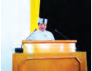
ဦးနုထန်ကတစ်က ချင်းတိုင်းရင်းသားရေးရာဝန်ကြီး

ဥက္ကဋ္ဌ ဦးသင်းလှိုင်၊ လွှတ်တော်ဒုတိယဥက္ကဋ္ဌ ဦးသောင်းစိန်နှင့် လွှတ်တော်ကိုယ်စားလှယ် ၇၇ ဦး တက်ရောက်ကြသည်။ (အပေါ်ယာပုံ) အစည်းအဝေးတွင် ကြယ်ပွင့်မြမေးခွန်းများ မေးမြန်းခြင်းကဏ္ဍတွင်