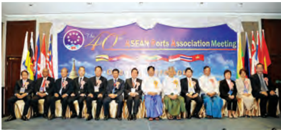
ပြည်ထောင်စုဝန်ကြီး ဦးညွှန်ထွန်းအောင် အကြိမ် (၄၀) မြောက် အာဆီယံဆိပ်ကမ်းများအသင်း အစည်းအဝေး တက်ရောက်ကြသူများနှင့်အတူ မှတ်တမ်းဓာတ်ပုံရိုက်စဉ်။

အကြိမ် (၄၀)မြောက် အာဆီယံ ဆိပ်ကမ်းများအသင်း အစည်းအဝေး (The 40 th ASEAN Ports Association Meeting) ကို မြန်မာနိုင်ငံက အိမ်ရှင်အဖြစ် လက်ခံကျင်းပခဲ့ပြီး အစည်းအဝေးကို ဒီဇင်ဘာ ၇ ရက်မှ ၁၀ ရက်အထိ ရန်ကုန်မြို့၊ Chatrium Hotel ၌ ကျင်းပခဲ့သည်။