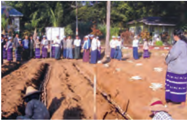
နေပြည်တော် ဒီဇင်ဘာ ၁၁

စက်မှုသီးနှံ ဖွံ့ဖြိုးရေးဦးစီးဌာန ကြီးကြပ်မှုဌာနမှ ပြန်ပေးရေးအစီအစဉ်ဖြင့် ကြိတ်တစ်ဆစ်ချင်း ပျိုးထောင်စိုက်ပျိုးခြင်း သရုပ်ပြပွဲနှင့် စံကွက်ခုတ်သိမ်းခြင်းကို ဒီဇင်ဘာ ၈ ရက် နံနက် ၈ နာရီခွဲက ပျဉ်းမနားမြို့နယ် ကြိတ်တစ်ဆစ်ချင်းပျိုးထောင်စိုက်ပျိုးရေးဦးစီးဌာန နည်းပညာပြန့်ပွားရေးအစီအစဉ်ဖြင့် ကြိတ်တစ်ဆစ်ချင်း ပျိုးထောင်စိုက်ပျိုးခြင်း သရုပ်ပြပွဲနှင့် စံကွက်ခုတ်သိမ်းခြင်းကို ဒီဇင်ဘာ ၈ ရက် နံနက် ၈ နာရီခွဲက ပျဉ်းမနားမြို့နယ် ကြိတ်တစ်ဆစ်ချင်းပျိုးထောင်စိုက်ပျိုးရေးဦးစီးဌာန နည်းပညာပြန့်ပွားရေးအစီအစဉ်ဖြင့် ကြိတ်တစ်ဆစ်ချင်း ပျိုးထောင်စိုက်ပျိုးခြင်းကို လက်တွေ့စိုက်ပျိုးပြသကြပြီး ကြိတ်တစ်ဆစ်ချင်းပျိုးထောင်စိုက်ပျိုးခြင်းကို ဆက်လက်ဆောင်ရွက်သည်။