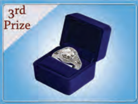
3rd Prize GIA(3) ကာရက်ပိုမိုနိမ့်လက်စွပ်တစ်ကွင်း