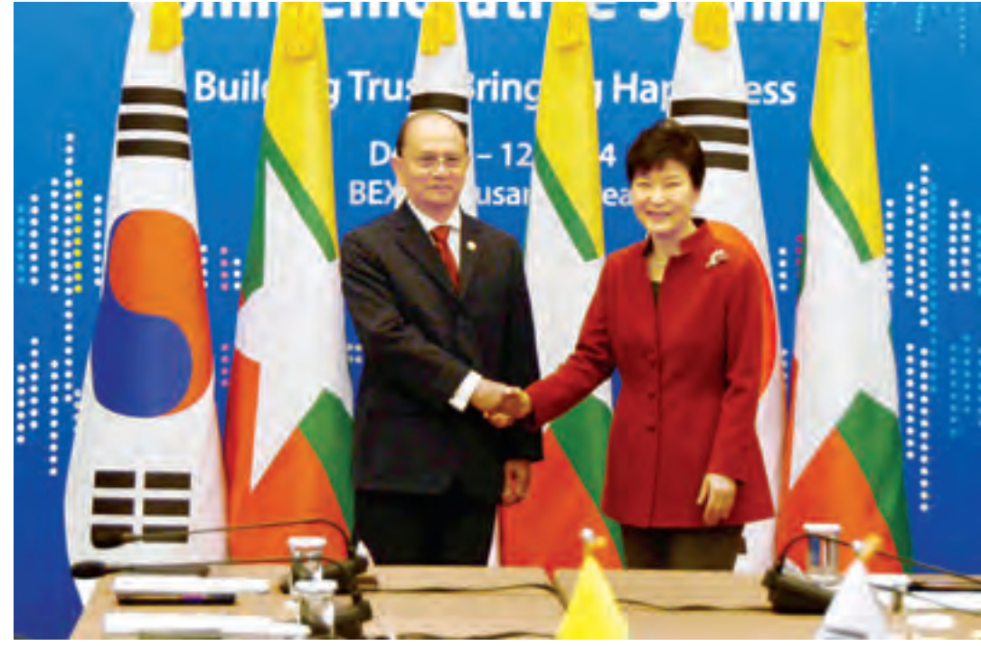
နိုင်ငံတော်သမ္မတ ဦးသိန်းစိန်နှင့် ကိုရီးယားသမ္မတ နိုင်ငံသမ္မတ မာမိတ် ပတ်ဂွန်ဟေးတို့ ရင်းနှီးနှီးနှီး နှုတ်ခတ်စဉ်။ (သတင်းစဉ်)

မြန်မာအပြည်ပြည်ဆိုင်ရာ ကွန်ဂရက် အစည်းအဝေးတွင် ကျင်းပခဲ့သည့် ၂ ရက်က ကျင်းပနိုင်ခဲ့သည်။ ဤအစီအစဉ်သည် မြန်မာနိုင်ငံရှိ ကျေးလက်နှင့် မြို့ပြအကြား ဆင်းရဲချမ်းသာကွာဟမှုကို လျော့နည်းအောင် ရည်ရွယ်ဆောင်ရွက်ခြင်းဖြစ်သည်။