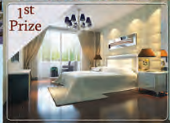
1st Prize (၂၅)ထပ်ပိုက်သုံးနှစ်သုံးပါ CONDOMINIUM တစ်ခန်း