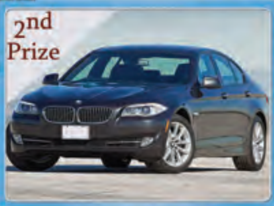
2nd Prize BMW 528 BRAND NEW