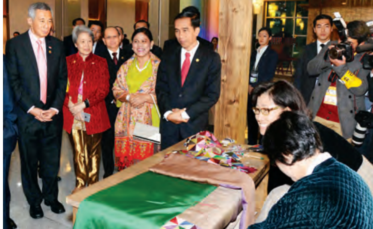
(အောက်ပုံ)