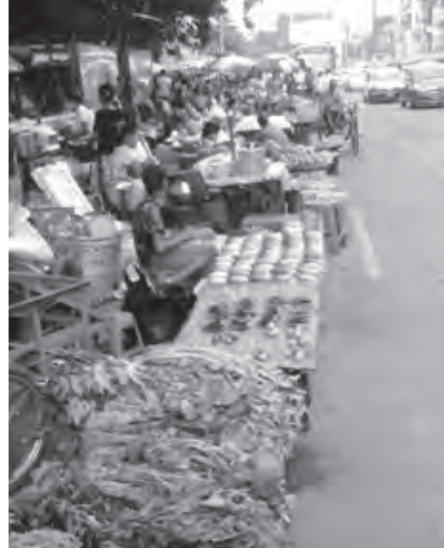
တာမွေလမ်းဆုံ ကားလမ်းမပေါ်တွင် ခင်းကျင်းရောင်းချနေသော လမ်းဘေးဈေးသည်များ။