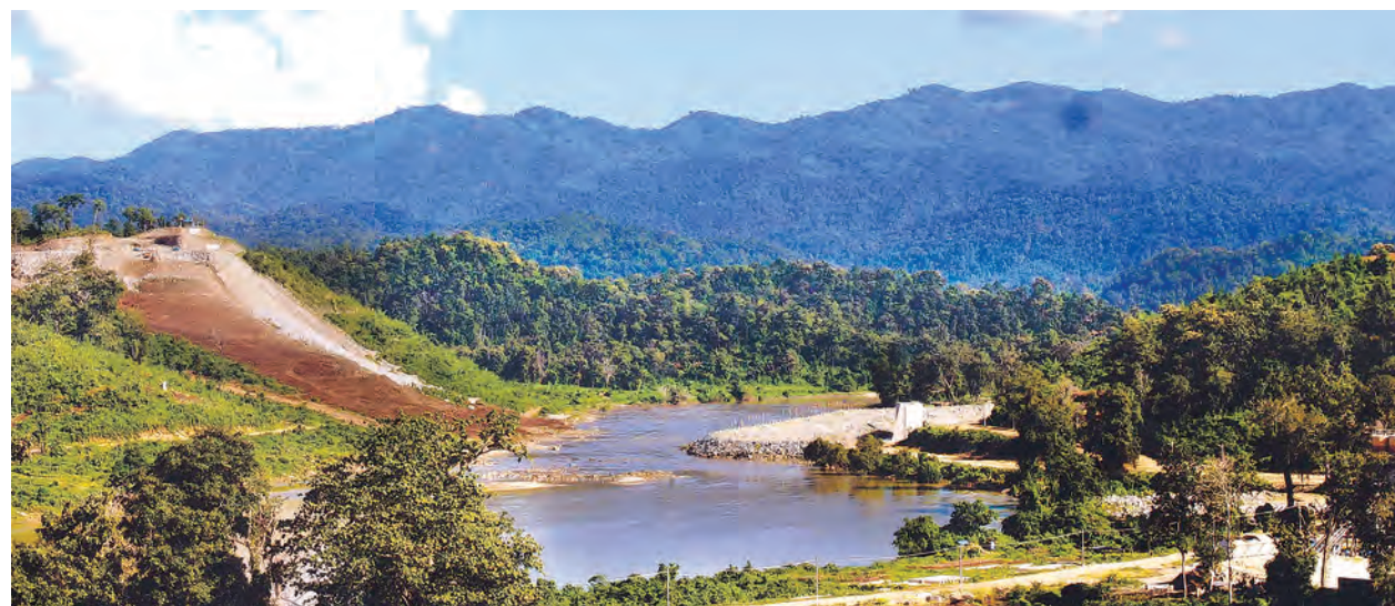
ရှမ်းပြည်နယ်(မြောက်ပိုင်း) မိုးမိတ်မြို့မြောက်ဘက် ရွှေလီမြစ်ပေါ်၌ တည်ဆောက်လျက်ရှိသည့် ရွှေလီရေအားလျှပ်စစ်စီမံကိန်း။

သတင်း-ခရမ်းစိုးမြင့်