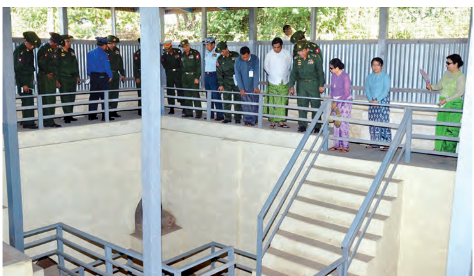
လိုက်လံရှင်းလင်းပြသသည်။ ယင်းနောက် တပ်မတော် ကာကွယ်ရေးဦးစီးချုပ်နှင့် အဖွဲ့ဝင်များသည် ဟန်လင်းမြို့ ရေပူစမ်းသို့ သွားရောက် ကြည့်ရှုခဲ့ကြောင်း သတင်းရရှိသည်။ (အပေါ်ပုံ)(မြဝတီ)