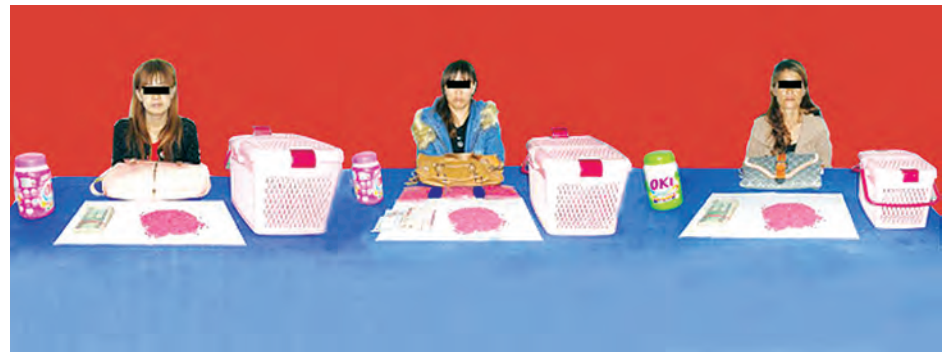
မကော်ရန်မိန့်၊ မတွမ်ရှင်ရှိုးနှင့် မတွမ်ချင်ဟွေးတို့သုံးဦးအား ပမ်းဆီးရမိ မူးယစ်ဆေးဝါးများနှင့်အတူ တွေ့ရစဉ်။