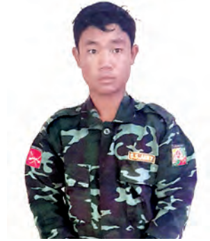
မောင်အိုက်လူ