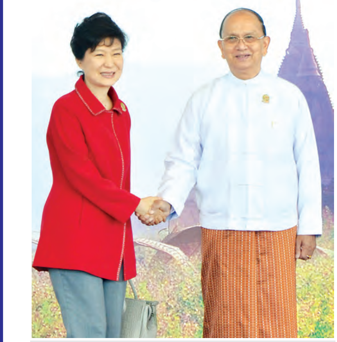
နိုင်ငံတော်သမ္မတဦးသိန်းစိန် နိုဝင်ဘာ ၁၃ ရက်က ကျင်းပခဲ့သည့် (၉) ကြိမ်မြောက် အရှေ့အာရှ ထိပ်သီးအစည်းအဝေးသို့ တက်ရောက်လာသော ကိုရီးယားသမ္မတနိုင်ငံသမ္မတ မဒမ်ပတ်ဂွန်ဟေးအား ရင်းနှီးနှီးနှီး နှုတ်ဆက်စဉ်။ (သတင်းစဉ်)

၁၀-၁၂-၂၀၁၄ ရက်နေ့ ထုတ် မြန်မာ့အလင်းသတင်းစာ စာမျက်နှာ(၃)၌ ပါရှိသည့် သံအမတ်ကြီး ဦးစိုးနွယ် သံအမတ်ခန့်အပ်လွှာ ပေးအပ် သတင်းတွင် “ဘာလင်မြို့” အစား “တာလင်မြို့”ဟု ပြင်ဆင် ဖတ်ရှုပါရန်။ (မြန်မာ့အလင်း)