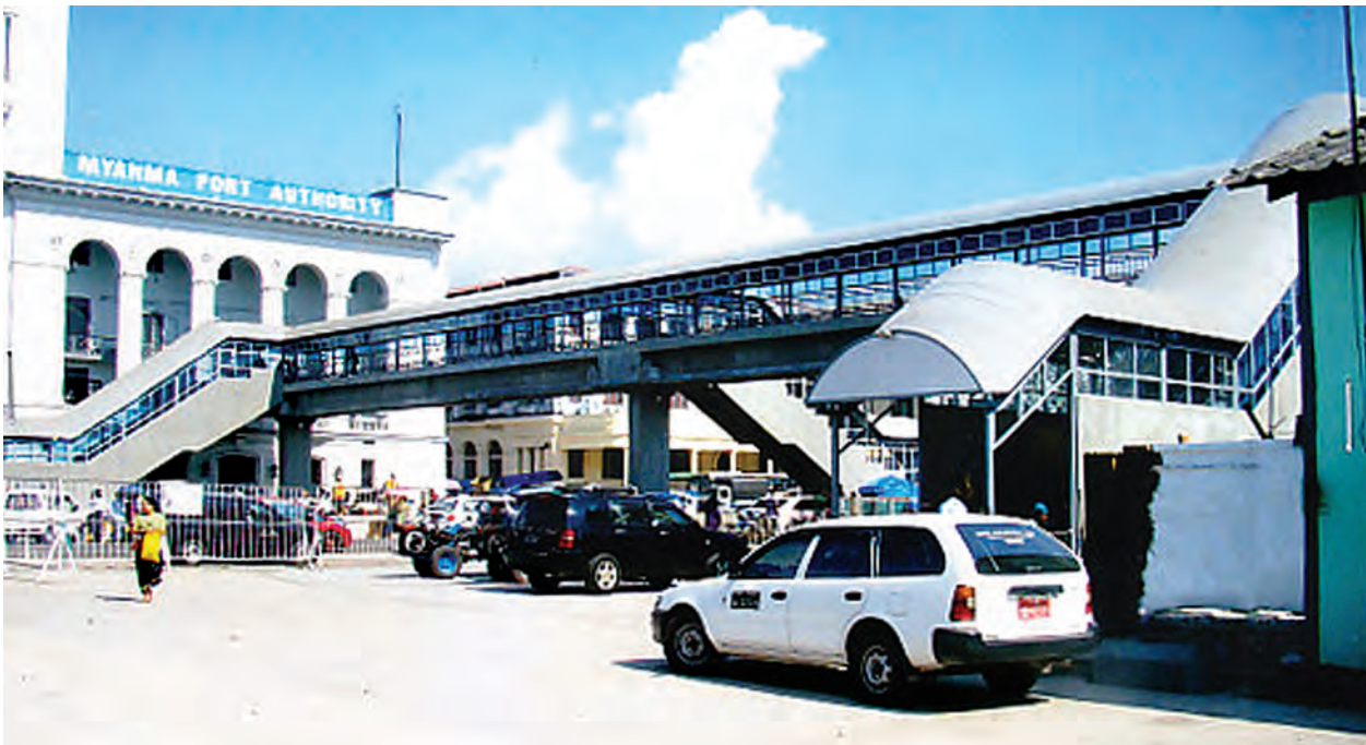
ပန်းဆိုးတန်းခုံးကျော်တံတားတည်ဆောက်ပြီးစီးမှုကို ဒီဇင်ဘာ ၁၀ ရက် နံနက်ပိုင်းက တွေ့ရစဉ်။

သတင်း တင်ဝင်းလေး(ကြည့်မြင်တိုင်)