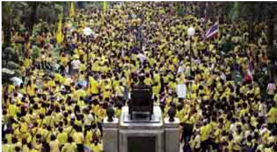
ကျန်းမာရေးကို စစ်ဆေးလျက်ရှိရာ တော်ဝင်ပရိသတ်အား တွေ့ဆုံရန် အသင့်မဖြစ်သေးကြောင်း သောကြာ နေ့တွင် ဘုရင်ရုံးတော်က ထုတ်ပြန်

ထောင်ပေါင်း များစွာသော ပြည်သူများ မြို့တော်ဗန်ကောက်၌ လှည့်ပြန်ခဲ့ရသည်။ အများစုက တော်ဝင်နန်းတော်၌ တွေ့ဆုံရလိမ့်မည် ဟု မျှော်လင့်ထားကြသည်။ ဆရာဝန်များက ဘုရင်ကြီး၏