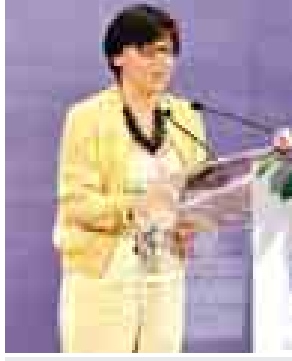
ပြင်သစ်နိုင်ငံ State for Development and Francophony ဝန်ကြီး Mrs. Annick GIRARDIN ရှင်းလင်းပြော ကြားစဉ်။

ဝမ်းကျောင်းမှု၊ အမျိုးသမီးများနှင့် ပညာရေး၊ လေ့ကျင့်သင်ကြားရေး၊ အမျိုးသမီးများနှင့် ကျန်းမာရေး၊ အမျိုးသမီးများ အပေါ် အကြမ်းဖက်မှု အမျိုးသမီးများနှင့် အရေးပေါ် အခြေအနေများ၊ အမျိုးသမီးများနှင့် စီးပွားရေး၊ အမျိုးသမီးများနှင့် ဆုံးဖြတ်ချက်ချမှတ်ရေး၊ အမျိုးသမီး ဖွံ့ဖြိုးတိုးတက်ရေးလုပ်ငန်း ယန္တရား၊ အမျိုးသမီးနှင့် လူ့အခွင့်အရေး၊ အမျိုးသမီးနှင့် မိမိဒီယာ၊ အမျိုးသမီး နှင့် ပတ်ဝန်းကျင်နှင့် အမျိုးသမီး ငယ်ရွယ်သူများအရေးကို အကောင် အထည်ဖော်ဆောင်ရွက်ပေးလျက်ရှိ ပါကြောင်းဖြင့် ရှင်းလင်းပြောကြား သည်။ ဆက်လက်၍ ပြင်သစ်နိုင်ငံ State for Development and Francophony ဝန်ကြီး Mrs. Annick GIRARDIN က အမျိုး သမီးများအပေါ် အကြမ်းဖက်မှု ကို ဆန့်ကျင်ရေး၊ နိုင်ငံရေး၊ စီးပွား ရေး၊ လူမှုရေးနှင့် ယဉ်ကျေးမှုကဏ္ဍ များတွင် အမျိုးသမီးများ အပြည့်