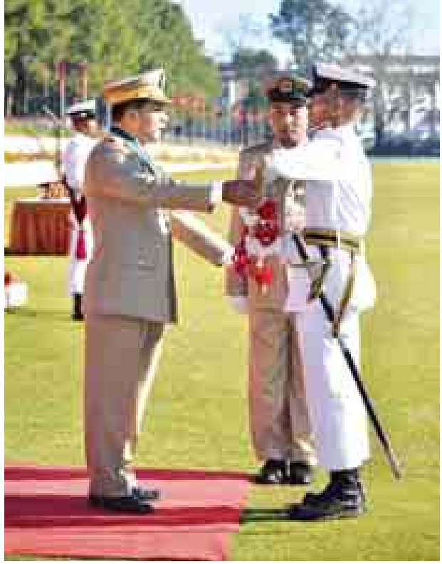
တပ်မတော်ကာကွယ်ရေးဦးစီးချုပ် ဗိုလ်ချုပ်မှူးကြီး သရေစည်သူ မင်းအောင်လှိုင် အောင်စစ်သည် ဆုရရှိသူ ဗိုလ်လောင်းအားဆုချီးမြှင့်စဉ်။

တိုးတက်ရေးလုပ်ငန်းများ မျှော်မှန်းသလောက် မဆောင်ရွက်နိုင်ဘဲ အခြားနိုင်ငံများထက် နောက်ကျခဲ့ရကြောင်း၊ ယနေ့တွင် မိမိတို့နိုင်ငံကို ခေတ်မီဖွံ့ဖြိုးတိုးတက်ပြီး စည်းကမ်းရှိသည့် ဒီမိုကရေစီနိုင်ငံတော်အဖြစ် ဖော်ဆောင်လျက်ရှိကြောင်း၊ ပြည်သူ့လူထုက တစ်ခဲနက်ထောက်ခံရွေးချယ်ထားသည့် ဒီမိုကရေစီနိုင်ငံ ထူထောင်မှုကို တပ်မတော်ကလည်း အထူးလိုလားပြီး အစဉ်ထိန်းကျောင်းသွားမည်ဖြစ်သည့်အပြင် အခြေတည်ခိုင်မာအောင်လည်း မဖြစ်မနေပိုင်ခြင်းဖြစ်ကြောင်း။