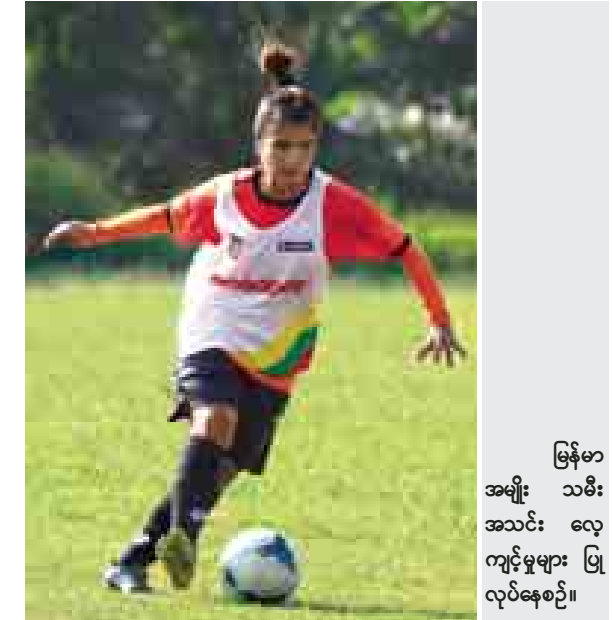
မြန်မာအမျိုးသမီးအသင်း လေ့ကျင့်မှုများ ပြုလုပ်နေစဉ်။