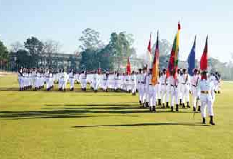
တပ်မတော် ကာကွယ်ရေးဦးစီးချုပ် ဗိုလ်ချုပ်မှူးကြီး သရေစည်သူ မင်းအောင်လှိုင် အား ဗိုလ်လောင်း တပ်ရင်းများက ချီတက် အလေးပြုစဉ်။ (မြဝတီ)

များ၊ စစ်တက္ကသိုလ်ကျောင်းအုပ်ကြီးနှင့် ပြင်ဦးလွင်တပ်နယ်မှ တပ်မတော်အရာရှိကြီးများ၊ ပြည်ထောင်စုသမ္မတမြန်မာနိုင်ငံတော်ဆိုင်ရာ နိုင်ငံခြား