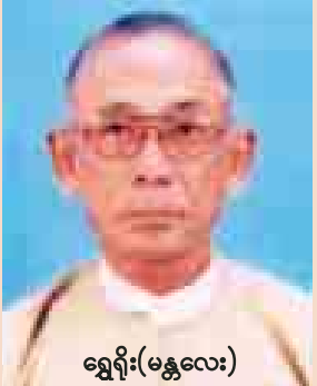
ရွှေရိုး(မန္တလေး)

သတင်းစာတစ်စောင် ထွက်ဖို့ဆိုတာမလွယ်လှပါ။ ကိုယ်စွမ်း၊ ဉာဏ်စွမ်း၊ ပညာစွမ်း၊ ဓနအင်အား၊ လူအင်အားအများအပြားလိုအပ်ပါတယ်။ အခုလိုလိုအပ်ချက်တွေနဲ့ မလွယ်ကူတဲ့အချိန်မှာ သတင်းနှင့်စာနယ်ဇင်းလုပ်ငန်းကိုယ်ပွား သတင်းစာတိုက် (မန္တလေး)မှ ပုံနှိပ်ဖြန့်ချိတဲ့ နေ့စဉ်ထုတ် မြန်မာ့အလင်းနဲ့ ကြေးမုံသတင်းစာတို့တွင် မန္တလေးမြို့နဲ့ အထက်မြန်မာပြည်ဆိုင်ရာ သတင်းများ၊ ကာတွန်းများ၊ ဆောင်းပါးများကို မန္တလေးစာမျက်နှာအဖြစ် သီးသန့်ဖော်ပြပေးနိုင်ဖို့ စီစဉ်နေကြောင်း သတင်းကောင်းတစ်ခု ကြားရပါတယ်။