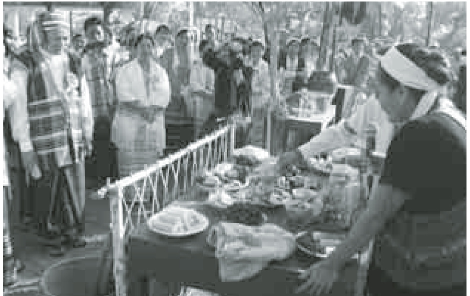
ယခင်နှစ်က ကရင်နှစ်သစ်ကူးပွဲတော်ကျင်းပစဉ်။

ဘားအံ ၃ ဇူလိုင် ၂၀၁၄ - ကရင်ပြည်နယ် ဘားအံမြို့၊ သီရိ ကွင်း၌ ကရင်သက္ကရာဇ် ၂၅၅၄ ခုနှစ် ကရင်နှစ်သစ်ကူးနေ့အခမ်းအနားကို ဒီဇင်ဘာ ၂၁ ရက်တွင် ယခင်နှစ်များ ထက် ပို၍စည်ကားစွာ ကျင်းပရန် စီစဉ်လျက်ရှိကြောင်း သိရသည်။ ကရင်နှစ်သစ်ကူးပွဲတော်ကို ကရင် ပြည်နယ်အစိုးရအဖွဲ့က ကြီးမှူး၍ ကရင်နှစ်သစ်ကူးပွဲတော်ကျင်းပရေး ကော်မတီက စီစဉ်ကျင်းပမည်ဖြစ်ပြီး ယခုနှစ်တွင် ပိုမိုကျယ်ဝန်းသော သီရိကွင်းဒေသကြီးတွင် ကရင်နှစ်သစ် ကူးအလဲတင် အခမ်းအနားကို ဆောင်ရွက်၍ အခမ်းအနားတွင် ကရင်တိုင်းရင်းသား အဘိုး၊ အဘွား များအား ဂုဏ်ပြုဂါရဝပြုခြင်းနှင့် ကျောင်းသား ကျောင်းသူများအား ပညာရည်ချွန်ဆုများ ချီးမြှင့်ခြင်း အစီအစဉ်များ ပါဝင်မည်ဖြစ်ကြောင်း သိရသည်။ ဆက်လက်၍ ကရင်အမျိုးသား နှစ်သစ်ကူးပွဲတော် အထိမ်းအမှတ် ကောက်သစ်ပေါ်ချိန် စပါးစောင်နတ် သမီးပူဇော်ပွဲ၊ ကောက်သစ်စားပွဲ၊