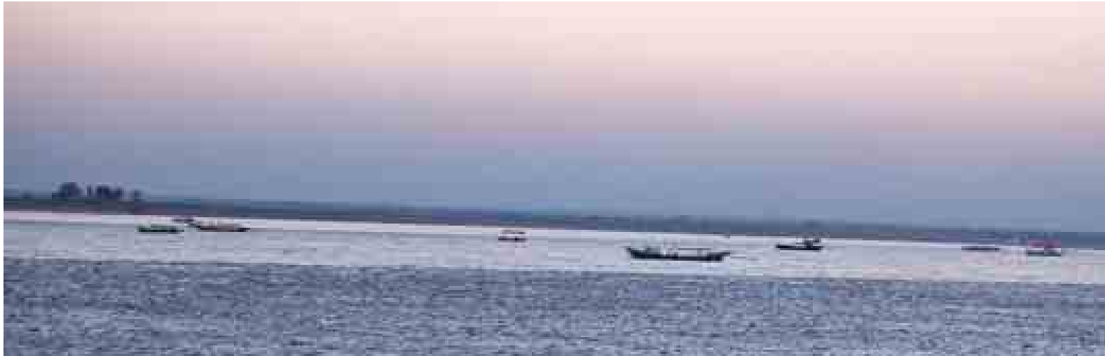
ရှုရန် နိုင်ငံခြားသားများအတွက် များမှာလည်း နေ့စဉ်လုပ်ငန်းများ ဝန်ဆောင်မှုပေးနေသော ပုဂံ လုပ်ဆောင်နေရ၍ အဆင်ပြေလျက် ပြောင်းဦးဒေသရှိ စက်လှေသား များမှာလည်း နေ့စဉ်လုပ်ငန်းများ အချို့သော နိုင်ငံခြားသားများမှာ စက်လှေကိုငှားရမ်းပြီး ရေနည်းစ ပြုနေပြီဖြစ်၍ ပေါ်ထွန်းလာသော သဲသောင်ခုံများပေါ်သို့ တက်၍ နေဝင်ချိန်ကို ကြည့်ရှုခံစားကြပြီး ညဦးပိုင်းအချိန်များကို သဲသောင်ခုံ များပေါ်တွင် ကုန်လွန်သွားကြသူ များကိုလည်း တွေ့ရသည်။

နိုင်ငံတကာမှ ခရီးသွားများ အများဆုံး သွားရောက်လည်ပတ် လေ့လာကြသော ပုဂံရှေးဟောင်း ယဉ်ကျေးမှုနယ်မြေတွင် နိုင်ငံခြား သားများ မက်မက်မောမော ခံစား ကြည့်ရှုလေ့ရှိသည့် တန်ကြည်တောင် တန်းတွင် နေလုံးကြီး ငုပ်လျှိုးသွားပုံ နေဝင်ချိန်မြင်ကွင်းကို ပုဂံဘုရားများ ၏ ရင်ပြင်တော်များပေါ်မှ ကြည့်ရှု ခံစားကြသကဲ့သို့ ရော့တီမြစ် အတွင်းမှ စက်လှေများဖြင့် သွား ရောက်ပြီး ကြည့်ရှုခံစားကြသည့် နိုင်ငံတကာဧည့်သည်များ ပိုမိုများပြား လာကြောင်း တွေ့ရသည်။