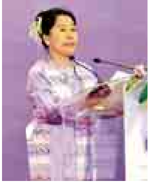
ပြည်ထောင်စုဝန်ကြီး ဒေါက်တာ ဒေါ်မြတ်မြတ်အုန်းခင် ရှင်းလင်း ပြောကြားစဉ်။

ကမ္ဘာလုံးဆိုင်ရာအမျိုးသမီးများ ဖိရမ်ကို နေပြည်တော်ရှိ မြန်မာ အပြည်ပြည်ဆိုင်ရာကွန်ဗင်းရှင်း ဗဟို ဌာန-၂ ၌ ယနေ့နံနက်ပိုင်းတွင် ကျင်းပ ရာ နိုင်ငံတော်သမ္မတ ဦးသိန်းစိန် တက်ရောက်ဖွင့်လှစ်ပေးခဲ့သည်။ ဆွေးနွေးပွဲတွင် လူမှုဝန်ထမ်း၊ ကယ်ဆယ်ရေးနှင့်ပြန်လည်နေရာချ ထားရေးဝန်ကြီးဌာန ပြည်ထောင်စု ဝန်ကြီး ဒေါက်တာဒေါ်မြတ်မြတ် အုန်းခင်က မြန်မာ့လူ့အဖွဲ့အစည်းတွင် အမျိုး သားအမျိုးသမီးများသည် အမျိုးသား များနည်းတူ အခွင့်အရေးများအပြည့် အဝ ရရှိခံစားနေကြရပါကြောင်း၊ မြန်မာ့လူ့အဖွဲ့အစည်းတွင် အမျိုး သား၊ အမျိုးသမီးတန်း တူညီမျှရေးကို အထူးအလေးထားပါကြောင်း၊ မြန်မာ နိုင်ငံတွင်အမျိုးသမီး ပြည်ထောင်စု ဝန်ကြီး၊ ဒုတိယဝန်ကြီးနှင့် အမျိုးသမီး လွှတ်တော် ကိုယ်စားလှယ်များသည် သက်ဆိုင်ရာကဏ္ဍများ၌ တက်ကြွစွာ ပါဝင်ဆောင်ရွက်နေကြပါကြောင်း၊ ထို့အပြင် အမျိုးသမီး ညွှန်ကြားရေးမှူး