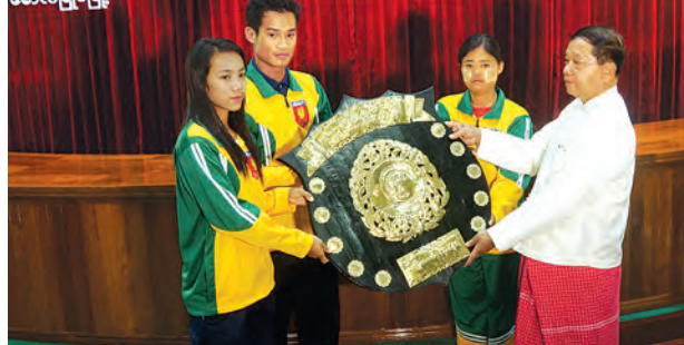
ပြည်နယ်ဝန်ကြီးချုပ် ဦးအုန်းမြင့်၊ ပြည်နယ်လွှတ်တော်ဥက္ကဋ္ဌ ဦးကျင် ဖေနှင့် ပြည်နယ်အစိုးရအဖွဲ့ဝင် ဝန်ကြီးများက ဆုများချီးမြှင့်ခဲ့ကြ သည်။ (အပေါ်ပုံ) အားကစား ပြိုင်ပွဲများတွင် မွန်ပြည်နယ်မှ အားကစားသမား များအနေဖြင့် ရွှေ ၂၄ ခု၊ ငွေ ၁၉ ခု၊ ကြေး ၂၅ ခု ဆွတ်ခူးရရှိခဲ့ သည်။ မောင်မေတ္တာ(ရွှေမြိုင်)

မော်လမြိုင် ဒီဇင်ဘာ ၁ ၂၀၁၄ ခုနှစ် တိုင်းဒေသကြီးနှင့် ပြည်နယ်အစိုးရအဖွဲ့ ဝန်ကြီးချုပ် ဖလား အားကစားပြိုင်ပွဲများတွင် အောင်မြင်မှုရရှိခဲ့သော မွန်ပြည်နယ်မှ အားကစားသမားများအား မွန် ပြည်နယ်အစိုးရအဖွဲ့နှင့် အလှူရှင် များက ဂုဏ်ပြုချီးမြှင့်ပွဲအခမ်းအနား ကို နိုဝင်ဘာ ၃၀ ရက် နံနက် ၉ နာရီက မွန်ပြည်နယ် အစိုးရအဖွဲ့ရုံး အောင်ဆန်းခန်းမ၌ ကျင်းပခဲ့သည်။ အခမ်းအနားတွင် အားကစား ပြိုင်ပွဲများ၌ တံခွန်စိုက်၊ ဒိုင်းဆုများ ရရှိအောင် စွမ်းဆောင်ပေးခဲ့သော အားကစားသမားများအား မွန်