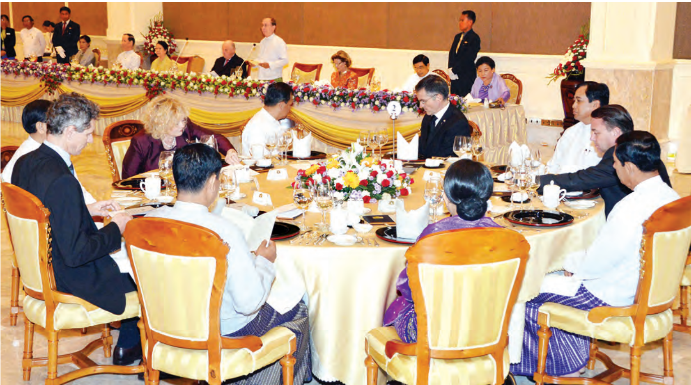
နိုင်ငံတော် သမ္မတ ဦးသိန်းစိန် နှင့် ဇနီးတို့က နော်ဝေနိုင်ငံ ဘုရင် နှင့် မိဖုရားတို့အား ဂုဏ်ပြု နေ့လယ်စာ ပြု၍ တည်ခင်းစည်ခံ စဉ်။ (သတင်းစဉ်)

နိုင်ငံတော် နှင့် ဇနီးတို့က မိဖုရားတို့အား မိတ်ဆက်ရန် ခန်းမ လယ်စာစားပွဲ ဝင်ပါသည်။ မြန်မာ ဘင်ရှီနေသည့် သန်းကို ပယ် ဝင်နိုင်အောင် နိုင်ငံ ပေးရေး အစီ ဝင်သို့ ဖွံ့ဖြိုး တိုး ပေးရန် ဦးစား ဖော်ဆောင်ရွက် နော်ဝေနိုင်ငံ ငြိမ်းချမ်းရေး အကူပြုအလှူ ဝင်ပြီး အော် တာနှင့် မြန်မာ ပြန်လည် ဖွံ့ဖြိုးရေး ဗဟိုဌာနတို့