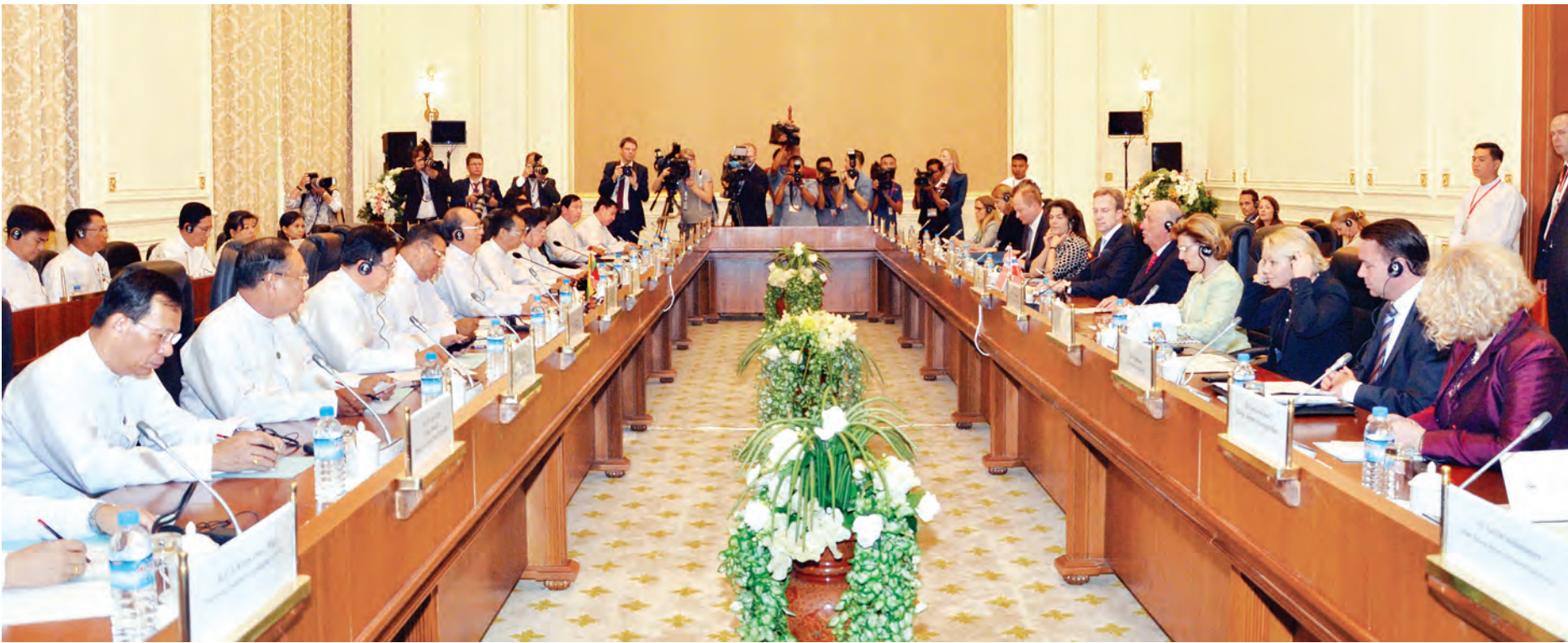
မြန်မာ-နော်ဝေ နှစ်နိုင်ငံ ဆွေးနွေးပွဲ ကျင်းပစဉ်။ (သတင်းစဉ်)

နိုင်ငံတော် နှင့် ဇနီးတို့က မိဖုရားတို့အား မိတ်ဆက်ရန် ခန်းမ လယ်စာစားပွဲ ဝင်ပါသည်။ မြန်မာ ဘင်ရှီနေသည့် သန်းကို ပယ် ဝင်နိုင်အောင် နိုင်ငံ ပေးရေး အစီ ဝင်သို့ ဖွံ့ဖြိုး တိုး ပေးရန် ဦးစား ဖော်ဆောင်ရွက် နော်ဝေနိုင်ငံ ငြိမ်းချမ်းရေး အကူပြုအလှူ ဝင်ပြီး အော် တာနှင့် မြန်မာ ပြန်လည် ဖွံ့ဖြိုးရေး ဗဟိုဌာနတို့