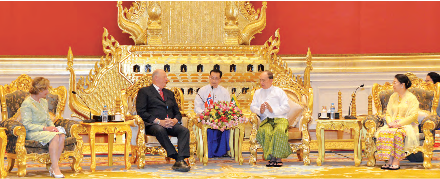
နိုင်ငံတော်သမ္မတ ဦးသိန်းစိန်နှင့် ဇနီးနှင့် နော်ဝေနိုင်ငံဘုရင်နှင့် မိဖုရားတို့ တွေ့ဆုံစဉ်။ (သတင်းစဉ်)

နိုင်ငံတော်သမ္မတ ဦးသိန်းစိန် နှင့် နော်ဝေနိုင်ငံဘုရင်တို့၏ ရှေ့ မှောက်၌ ဖွံ့ဖြိုးတိုးတက်မှု ပူးပေါင်း ဆောင်ရွက်ရေးဆိုင်ရာ နားလည်မှု စာချုပ်လွှာကို ပြည်ထောင်စုဝန်ကြီး ဒေါက်တာ က်ဇော်နှင့် နော်ဝေနိုင်ငံ နိုင်ငံခြား ရေးဝန်ကြီး မစ္စတာ ဘော့ဂျီ ဘရန်ဒီတို့ လက်မှတ်ရေးထိုးစဉ်။ (သတင်းစဉ်)