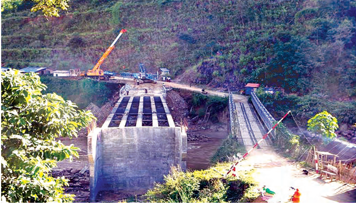
ရှမ်းပြည်နယ်(အရှေ့ပိုင်း) ကျိုင်းတုံ-မိုင်းခတ်-မိုင်းယန်းလမ်း အဆင့်မြှင့်တင်နေမှုကို တွေ့ရစဉ်။