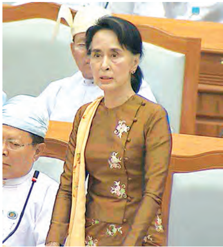
ကျော့မှူး မဲဆန္ဒနယ်မှ ဒေါ်အောင်ဆန်းစုကြည် အဆိုတင်သွင်းစဉ်။ (သတင်းစဉ်)

ထိုသို့ ဆောင်ရွက်ရာတွင် ဘဏ္ဍာရေးဝန်ကြီးဌာနက ရေးဆွဲထားသည့် ဝန်ကြီးဌာနအလိုက်ဘဏ္ဍာရေး