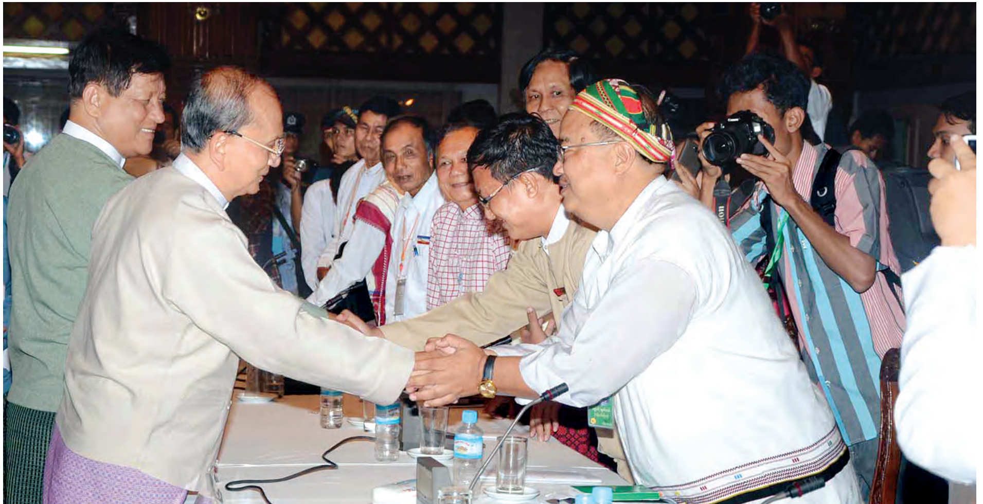
နိုင်ငံတော်သမ္မတ ဦးသိန်းစိန် နိုင်ငံရေးပါတီခေါင်းဆောင်များနှင့်အဖွဲ့ဝင်များအား ရင်းရင်းနှီးနှီးနှုတ်ဆက်စဉ်။