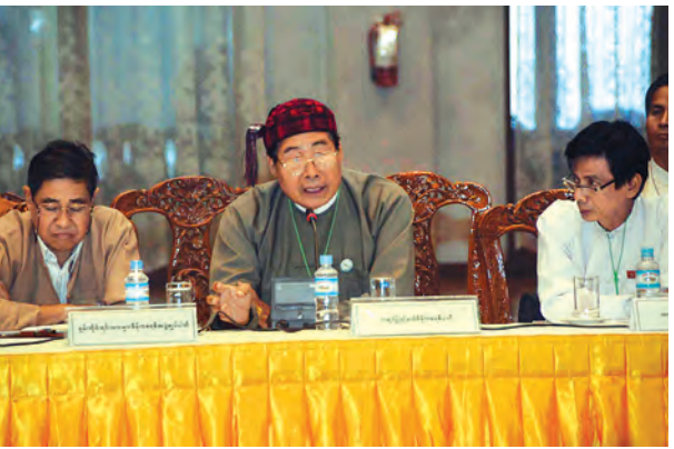
ကချင်ပြည်နယ် ဒီမိုကရေစီပါတီမှ တင်ပြစဉ်။ (သတင်းစဉ်)

တွင် ပြုလုပ်သ ပွဲကဲ့သို့ ဆွေး ဖြေလုပ်သွားမည့် အားလုံးပါဝင် နိုင်ငံအောင် စီ အခါ အချိန်န ကြောင့် က ကြောင်း၊ ယင်း လာမည့် ဆွေး နိုင်ရန် အားလုံးပါဝင် မည်ဖြစ်သည်။