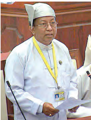
ဒုတိယဝန်ကြီး ဒေါက်တာအောင်ကျော်မြတ် ဖြေကြားစဉ်။ (သတင်းစဉ်)

အစည်းအဝေးတွင် ကမာရွတ် မဲဆန္ဒနယ်မှ ဒေါက်တာစိုးရင်၏ “G.T.I ကျောင်းသစ်များ ထပ်မံဆောင်ရွက်ပေးရန်အစား လက်ရှိနည်းပညာတက္ကသိုလ်များတွင် G.T.I သင်တန်းများအား ပူးတွဲသင်ကြားပေးရန် အစီအစဉ် ရှိမရှိ” မေးခွန်းနှင့်စပ်လျဉ်း၍ သိပ္ပံနှင့် နည်းပညာဝန်ကြီးဌာန ဒုတိယဝန်ကြီး ဒေါက်တာအောင်ကျော်မြတ်က ပညာရေးဥပဒေ ထွက်ပေါ်လာပြီးနောက် ယင်းဥပဒေနှင့်ဆီလျော်သည့် အခြေခံပညာရေးဥပဒေ၊ နည်းပညာနှင့် သက်မွေးပညာရေး ဥပဒေ၊ အဆင့်မြင့်ပညာရေး ဥပဒေတို့ကို ဆက်လက်ရေးဆွဲလျက်ရှိကြောင်း၊ သိပ္ပံနှင့် နည်းပညာဝန်ကြီးဌာန အောက်ရှိ နည်းပညာတက္ကသိုလ်များသည် အဆင့်မြင့်ပညာရေးကဏ္ဍတွင် အကျိုးဝင်သွားမည်ဖြစ်ပြီး အစိုးရစက်မှုသိပ္ပံများသည် နည်းပညာနှင့် သက်မွေးပညာရေး ဥပဒေအရ ဆောင်ရွက်ရမည် ဖြစ်ကြောင်း၊