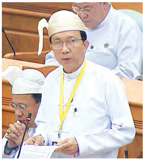
ပြည်ထောင်စုဝန်ကြီး ဒေါက်တာကံစော် ရှင်းလင်း ဆွေးနွေးစဉ်။ (သတင်းစဉ်)