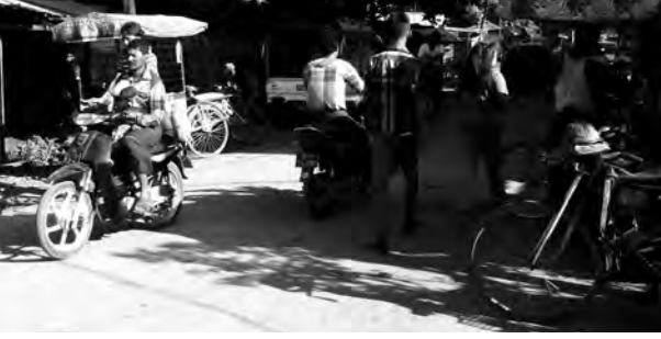
သာကေတမြို့နယ်အတွင်း စီးနင်းနေသောဆိုင်ကယ်များ။

ရန်ကုန်တိုင်းဒေသကြီးအတွင်း ယာဉ်အန္တရာယ်ကင်းရှင်းစေရေး ကြိုးပမ်းမှုတစ်ရပ်အဖြစ် မြို့ပေါ်နှင့်ဆင်ခြေဖုံးမြို့နယ်များတွင် တရားမဝင်ဆိုင်ကယ်စီးနင်းမှုများကို မရှိဘဲ ဆိုင်ကယ်စီးနင်းသူများအား စည်ပင်သာယာဥပဒေအရ ထိရောက်စွာ အရေးယူဆောင်ရွက်သွားမည်ဖြစ်ကြောင်း ရန်ကုန်မြို့တော်စည်ပင်သာယာရေးကော်မတီမှ တာဝန်ရှိသူတစ်ဦးက ပြောသည်။ “ရန်ကုန်တိုင်းဒေသကြီး ဆင်ခြေဖုံးမြို့နယ်တွေမှာ ခွင့်ပြုချက်မရှိဘဲ ဆိုင်ကယ်စီးနင်းသွားလာမှုတွေ များပြားလာတာကြောင့် ယာဉ်မတော်တဆမှုတွေ ဖြစ်ပွားလာတာတွေ့ရပါတယ်။ တရားမဝင် ဆိုင်ကယ်စီးနင်းမှုတွေကို စည်ပင်သာယာဥပဒေနှင့်အညီ အရှိန်အဟုန်ဖြင့် အရေးယူဆောင်ရွက်သွားမှာဖြစ်ပါတယ်”ဟု အဆိုပါတာဝန်ရှိသူက ပြောသည်။ ရန်ကုန်မြို့တော်စည်ပင်သာယာရေးကော်မတီအနေဖြင့် ရန်ကုန်တိုင်းဒေသကြီးအစိုးရနှင့် သဘောတူညီချက်ရယူကာ ခွင့်ပြုချက်မရှိဘဲ ဆိုင်ကယ်စီးနင်းသူများအား ၂၀၁၃ ခုနှစ် ရန်ကုန်မြို့တော် စည်ပင်သာယာရေးကော်မတီဥပဒေပုဒ်မ ၆၃၊ ပုဒ်မခွဲ(ဃ)နှင့် ပုဒ်မ ၈၅၊ ပုဒ်မခွဲ(ခ) တို့အရ လုပ်ပိုင်ခွင့်များကို အသုံးပြုကာ ထိရောက်စွာ အရေးယူဆောင်ရွက်သွားမည်ဖြစ်ကြောင်း ရန်ကုန်မြို့တော်စည်ပင်သာယာရေးကော်မတီက မကြာမီက ကြေညာချက်ထုတ်ပြန်ထားသည်။ ရန်ကုန်မြို့တော်စည်ပင်သာယာရေးနယ်နိမိတ်အတွင်း ဆင်ခြေဖုံးမြို့နယ်များ၌ ခွင့်ပြုချက်မရှိဘဲ ဆိုင်ကယ်စီးနင်းသူများအား ဥပဒေနှင့်အညီ အရေးယူဆောင်ရွက်မည့်အပြင် စည်ပင်သာယာနယ်နိမိတ်ပြင်ပမှ ဝင်ရောက်လာသော ဆိုင်ကယ်များကိုလည်း မြို့ဝင်၊ မြို့ထွက်ဂိတ်များ၌ စစ်ဆေးကြပ်မတ်တားဆီးသွားမည်ဖြစ်ကြောင်း သိရသည်။ သတင်း-မောင်နေ့သစ်