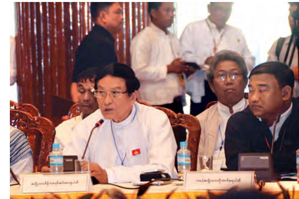
အမျိုးသားဒီမိုကရေစီအင်အားစုပါတီမှ တင်ပြစဉ်။ (သတင်းစဉ်)

လက်ပြုလုပ်လျက်ရှိပါကြောင်း။ NCA ချုပ်ဆိုပြီးသည့်အခါ လိုအပ်သော တပ်နေရာချထားမှု များ၊ လက်နက်ကိုင်တပ်များ၊ လိုက်နာရမည့် စည်းကမ်းများ၊ နှစ်ဖက်ပဋိပက္ခ တားဆီးဆောင်ရွက် မှုများ၊ စောင့်ကြည့်လေ့လာမှု များကို ပိုမိုအားကောင်းစွာပြုလုပ် လာနိုင်မည်ဖြစ်ပြီး နှစ်ဖက်အကြား မလိုလားအပ်သော ပစ်ခတ်တိုက် ခိုက်မှုများ၊ ထိတွေ့မှုများကို အပြီး ကြိုးပမ်း ဆောင်ရွက်နေခြင်း ဖြစ်ပါ ကြောင်း၊ ယခုရက်ပိုင်းတွင် ဖြစ်ပွား ခဲ့သော ပစ်ခတ်မှုများနှင့်ပတ်သက်ပြီး စောင့်ကြည့် လေ့လာရေးအဖွဲ့များ