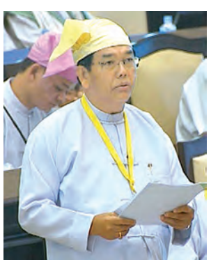
ဒုတိယဝန်ကြီး ဦးအုန်းသန်း ဖြေကြားစဉ်။ (သတင်းစဉ်)

နှစ်ရှည်သီးနှံများတွင် ရခိုင်ပြည်နယ်အတွက် အဓိကဝင်ငွေရရှိနိုင်သော သရက်၊ တညင်း၊ ကွမ်းသီးတို့ကို တိုးချဲ့စိုက်ပျိုးခြင်း၊ ခြံများထူထောင်ခြင်း၊ မျိုးကောင်း မျိုးသန့်ဖြန့်ဖြူးခြင်းတို့ကို ပုဂ္ဂလိကလုပ်ငန်းရှင်များအား စည်းရုံးဆောင်ရွက်လျက်ရှိပါကြောင်း။