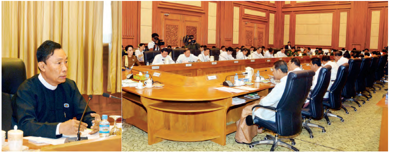
ပြည်သူ့လွှတ်တော်ဥက္ကဋ္ဌ သူရဦးရွှေမန်း ကော်မတီ၊ ကော်မရှင်များ၏လုပ်ငန်းညှိနှိုင်းအစည်းအဝေးတွင် အမှာစကားပြောကြားစဉ်။ (သတင်းစဉ်)

အဆိုပါလုပ်ငန်းညှိနှိုင်းအစည်းအဝေးသို့ ပြည်သူ့လွှတ်တော်ဒုတိယဥက္ကဋ္ဌ ဦးနန္ဒကျော်စွာ၊ ပြည်သူ့လွှတ်တော်ကော်မတီများမှ ဥက္ကဋ္ဌနှင့် အတွင်းရေးမှူးများ၊ ဥပဒေရေးရာနှင့် အထူးကိစ္စရပ်များ လေ့လာဆန်းစစ်သုံးသပ်ရေးကော်မရှင် အဖွဲ့ဝင်များနှင့် ပြည်သူ့လွှတ်တော်ရုံးမှ တာဝန်ရှိသူများ တက်ရောက်ခဲ့ကြသည်။ (သတင်းစဉ်)