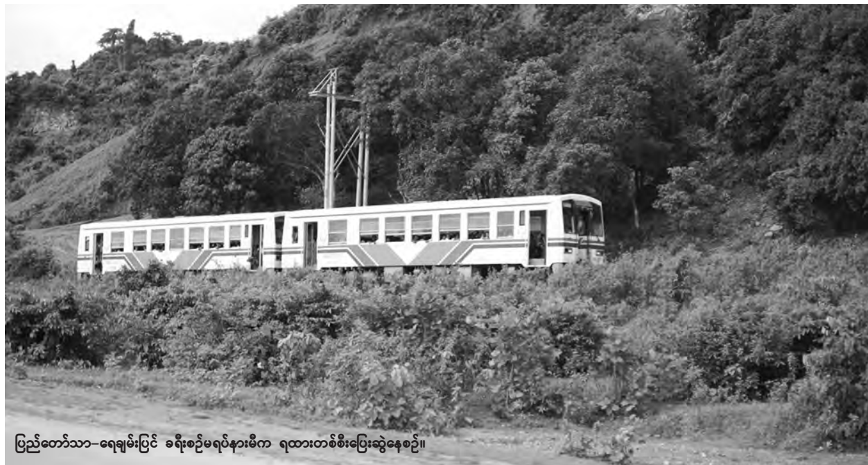
ပြည်တော်သာ-ရေချမ်းပြင် ခရီးစဉ်မရပ်နားမီက ရထားတစ်စီးပြေးဆွဲနေစဉ်။