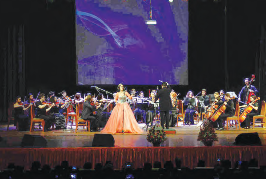
အာဆီယံ-ရုရှား လူငယ်အနုပညာ သံစုံတီးဝိုင်း ဖျော်ဖြေတင်ဆက်ပွဲကျင်းပစဉ်။ (သတင်းစဉ်)

ဖျော်ဖြေတင်ဆက်မှုအပြီးတွင် တိုင်းဒေသကြီးဝန်ကြီးချုပ် ဦးမြင့်ဆွေနှင့် The Embassy of the Russian Federation, Ambassador, H.E.Mr.Vasily Pospelov တို့က ဖျော်ဖြေတင်ဆက်ကြသည့် နှစ်နိုင်ငံအနုပညာရှင်များအား ဂုဏ်ပြုပန်းစည်းများ ပေးအပ်ခဲ့ကြောင်း သတင်းရရှိသည်။ (မြန်မာ့အလင်း)