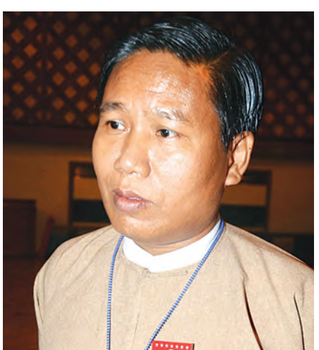
ဦးအေးလွင်၊ ဥက္ကဋ္ဌ(ပြည်ထောင်စုမြန်မာနိုင်ငံ အမျိုးသားနိုင်ငံရေးအဖွဲ့ချုပ်ပါတီ)

ဖြစ်ပါတယ်။ ခုနစ်ယောက်စလုံးပါတီတွေလည်း ဘာဖြစ်လဲ ဒါကျွန်တော်တို့တိုင်းရင်းသားအများစုရဲ့ ရင်ခုန်သံလည်း ဖြစ်ပါတယ်။