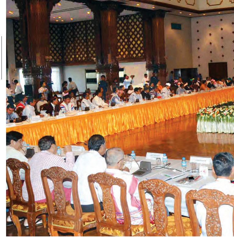
နိုင်ငံတော်သမ္မတ ဦးသိန်းစိန်နှင့် နိုင်ငံရေးပါတီခေါင်းဆောင်များ တွေ့ဆုံပွဲကျင်းပစဉ်။

နွေးမှုများကို သဘက်သဘာဝအတိုင်း မိမိအနေ ရောက်လာကြ များနှင့် နိုင်ငံရေးပါတီ များနှင့် အကြံ နားထောင်ပြီး မိမိတို့အနေဖြင့် များအားလုံးပါ ဆွေးနွေးမှုများ သွားရန်ရှိပါကြ