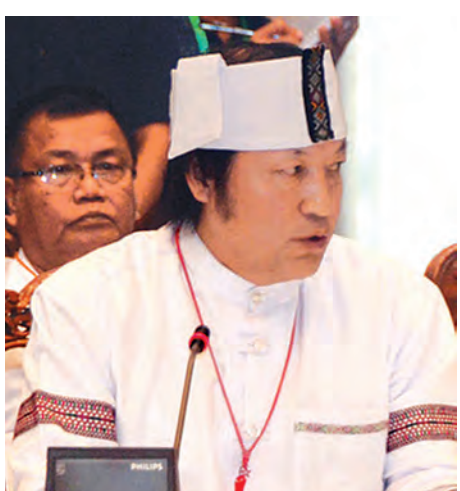
ဦးနီထန်ကပ်၊ ဥက္ကဋ္ဌ(ချင်းတိုးတက်ရေးပါတီ)

ရေးက အောင်မြင်လာမယ်။ ယုံကြည်မှုရှိလာမယ်။ ခဏခဏတွေ့မှ ယုံကြည်မှုရမယ်။ ယုံကြည်မှု အလုပ် တွဲလုပ်လို့ရမယ်။ အလုပ်လုပ်မှ တိုင်းပြည်က တိုးတက်မယ်။