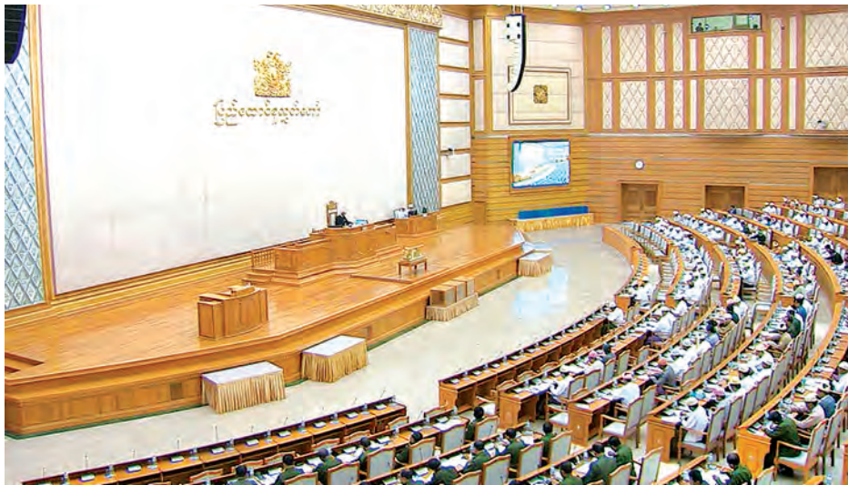
ပြည်ထောင်စုလွှတ်တော်(၁၁)ကြိမ်မြောက် ပုံမှန်အစည်းအဝေးကျင်းပစဉ်။ (သတင်းစဉ်)

နေပြည်တော် နိုဝင်ဘာ ၂၄ ပြည်ထောင်စုလွှတ်တော်(၁၁) ကြိမ်မြောက် ပုံမှန်အစည်းအဝေး ၃၂ ရက်မြောက်နေ့ကို ယနေ့မနက် ၁၀ နာရီခွဲတွင် ကျင်းပခဲ့သည်။ အစည်းအဝေးတွင် နိုင်ငံတော် သမ္မတထံမှ ပေးပို့သော အာရုံအခြေခံ အဆောက်အအုံ ရင်းနှီးမြှုပ်နှံမှုဘဏ် တွင် မြန်မာနိုင်ငံမှ မူလအဖွဲ့ဝင်အဖြစ် ပါဝင်ရန်နှင့်စပ်လျဉ်း၍ လွှတ်တော် ကအတည်ပြုခဲ့သည်။ ထို့အပြင် ဖွဲ့စည်းပုံအခြေခံဥပဒေ ပြင်ဆင်နိုင်ရေးအကောင်အထည်ဖော် မှုကော်မတီ၏ လုပ်ငန်းဆောင်ရွက်မှု အစီရင်ခံစာအပေါ် လွှတ်တော် ကိုယ်စားလှယ်များက ဆက်လက် ဆွေးနွေးခဲ့ကြသည်။