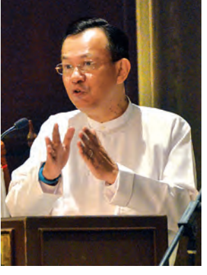
ပြည်ထောင်စုဝန်ကြီး ဒေါက်တာကဏ္ဍက ပြောကြားစဉ်။

“ကျွန်တော်တို့အခုလို ဆောင်ရွက်နိုင်တာက အီးယူအနေနဲ့