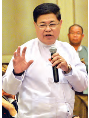
ပြည်ထောင်စုဝန်ကြီး ဦးစိုးသိန်း ပြောကြားစဉ်။

ရည်ရွယ်ထားသည်။ ကျန်းမာရေးကဏ္ဍကို တစ်နှစ်အတွက် ယူရို သန်း၄၀ အထိ ထောက်ပံ့ပေးသွားမှာဖြစ်ပြီး အခြေခံ ကျန်းမာရေးစောင့်ရှောက်မှုတွေနဲ့ ဆရာဝန်တွေ၊ သူနာပြုတွေ လေ့ကျင့်ပေးမှု၊ စွမ်းဆောင်ရည်မြှင့်တင်တန်းတွေနဲ့ ရေသန့်စနစ်တွေ၊ မျိုးဆက်ပွား ကျန်းမာရေးတွေကို