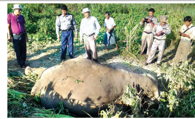
သို့ စားကျက်ပြောင်းရွှေ့ကျက်စားစဉ် သတ်ဖြတ်မှုကြောင့် သေဆုံးရ ခြင်းဖြစ်သည်ဟု ယူဆကြောင်း သိရသည်။ အဆိုပါ ဆင်သေဆုံးမှုနှင့် ပတ်သက်ပြီး ဥပဒေနှင့်အညီ အရေး ယူ ဆောင်ရွက်သွားမည်ဖြစ်ကြောင်း သိရသည်။

အမြင့်ခုနစ်ပေ၊ အလျား ခုနစ်ပေ အရွယ်ရှိပြီး အသက် ၁၅ နှစ်ခန့်ရှိ ကြောင်း၊ ယင်းဆင်၏ခန္ဓာကိုယ် အတွင်း ခွဲစိတ်ကြည့်ရာ ၁၃ လသား အရွယ် ဆင်သနွေးသားပေါက်ကို တွေ့ရှိခဲ့ကြောင်း သိရသည်။ ဒေသခံများနှင့် ဆင်ကျွမ်းကျင် သူများ၏ပြောကြားချက်အရ အဆိုပါ တောဆင်ရိုင်းများသည် မကွေးတိုင်း ဒေသကြီး မြို့သစ်မြို့နယ် စတုံကြီး ပိုင်းဘက်မှနေ၍ နယ်ကျွဲရောက်ရှိလာ သော ဆင်များဖြစ်ပြီး ယင်းဆင်အုပ် ကို သံပုးတီးမောင်းနှင့်မူများ ရှိခဲ့ရာမှ မုဆိုးများ၏ ဘေးရန်ကြောင့် တပ်ကုန်းမြို့နယ်ဘက်သို့ စားကျက် ပြောင်းရွှေ့ခဲ့ကြောင်းဖြစ်ကြောင်း ထို