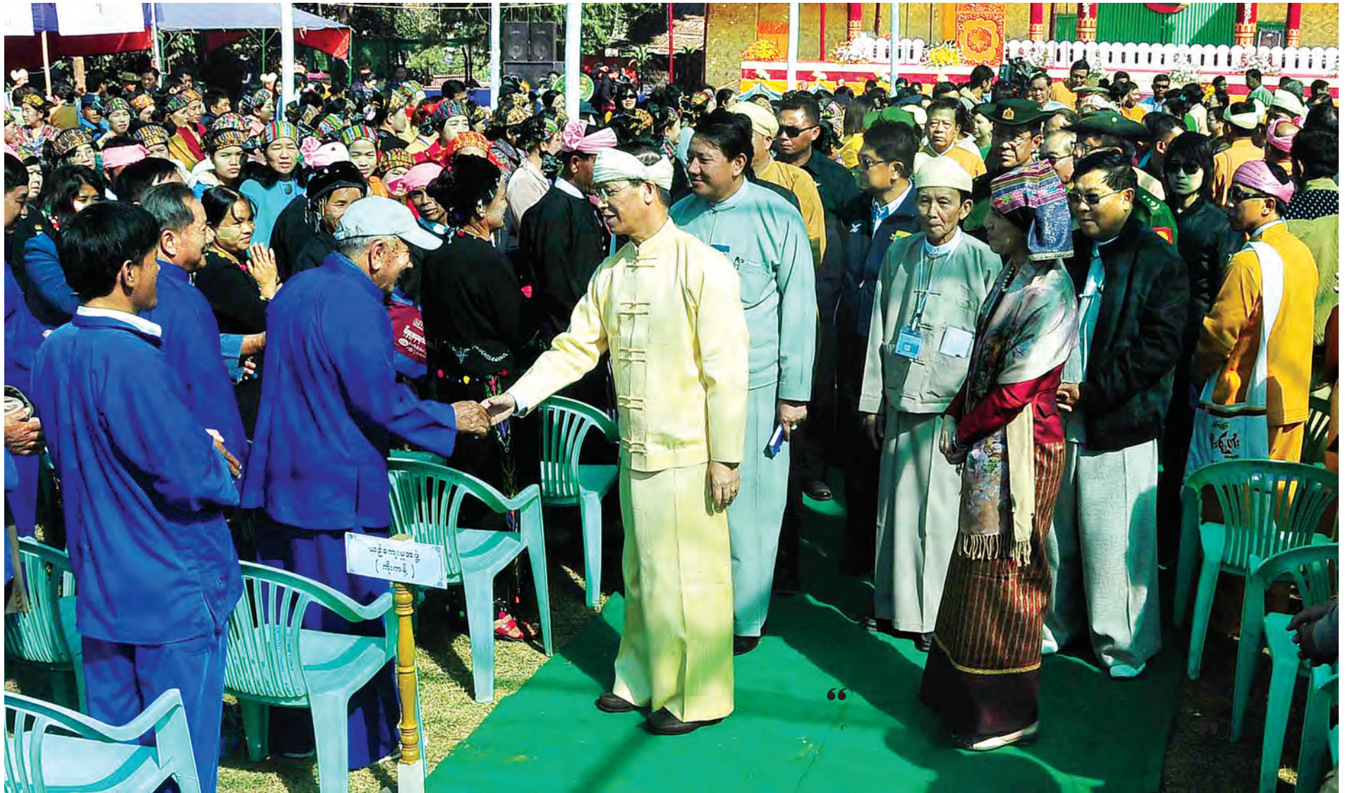
ဒုတိယသမ္မတ ဒေါက်တာစိုင်းမောက်ခမ်း ၂၀၀၉ ခုနှစ် ရှမ်းနှစ်သစ်ကူးကောက်သစ်စားပွဲတော် အခမ်းအနားသို့ တက်ရောက်လာကြသူများအား ရင်းရင်းနှီးနှီးနှုတ်ဆက်စဉ်။