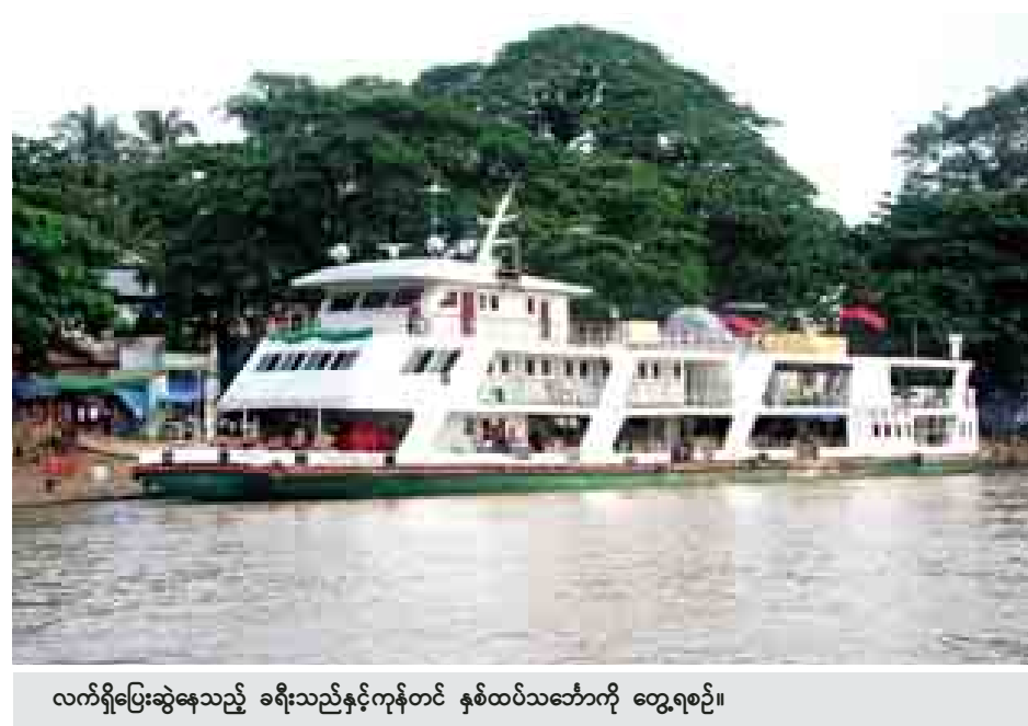
လက်ရှိပြေးဆွဲနေသည့် ခရီးသည်နှင့်ကုန်တင် နှစ်ထပ်သင်္ဘောကို တွေ့ရစဉ်။

“သင်္ဘောတွေကို ခေတ်မီတဲ့ အတိုင်းအတာ အသွင်အပြင်တွေ ပြောင်းလဲလိုက်မှ ပုဂ္ဂလိကနဲ့ ယှဉ်ပြိုင်နိုင်မှာ။ ရေရှည်ရပ်တည်နိုင်မှာ”ဟု