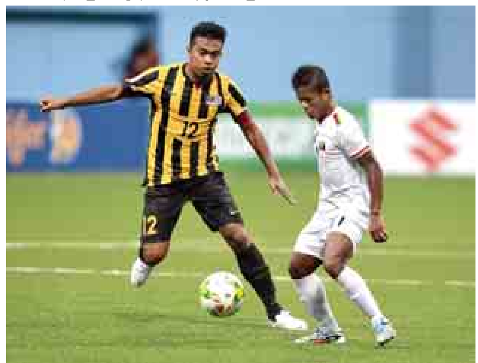
မြန်မာအသင်းနှင့် မလေးရှားအသင်းတို့ အကြိတ်အနယ် ယှဉ်ပြိုင်ကစားစဉ်။

သတင်း-ညီမြတ်သော်တာ ကျော်ဝန်းကျင်ရောက်မှ လူစားလဲ မှုများ ပြုလုပ်ခဲ့၍ ကစားကွက် မှာ သိသိသာသာပြောင်းလဲခဲ့ခြင်း မရှိပေ။ သရေတစ်မှတ်သာ ရရှိ ခဲ့သည့် မြန်မာအသင်းသည် စာမျက်နှာ ၉ ကော်လံ ၆