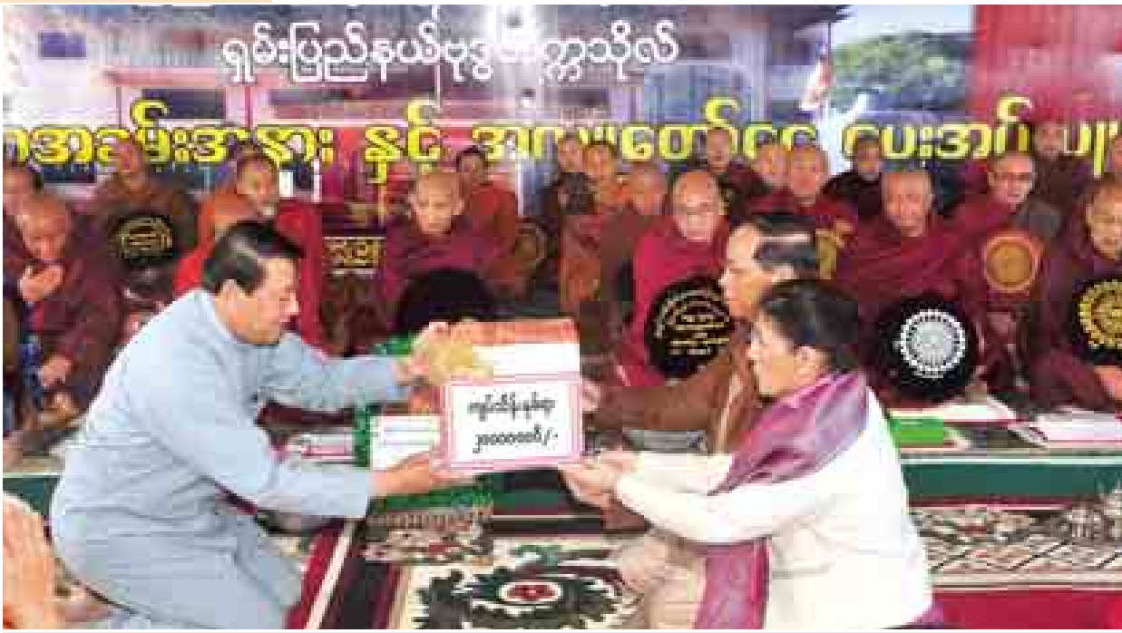
ဒုတိယသမ္မတ ဒေါက်တာစိုင်းမောက်ခမ်းနှင့်ဇနီး ဗုဒ္ဓတက္ကသိုလ်တည်ဆောက်ရေးအတွက် အလှူငွေလှူဒါန်းစဉ်။ (သတင်းစဉ်)

ယင်းနောက် ဒုတိယသမ္မတက စီမံကိန်းလုပ်ငန်းများနှင့် စပ်လျဉ်း၍ သိရှိလိုသည်များကိုမေးမြန်းပြီး စီမံကိန်း သတ်မှတ်ကာလအတွင်း အချိန်မီ ပြီးစီးအောင်ဆောင်ရွက်ရန်၊ အဆောက်အအုံများဆောက်လုပ်ရာတွင် နေထိုင်မည့်သူများ ကျန်းမာရေးအတွက် အထောက်အကူပြုစေမည့် အားကစားလုပ်