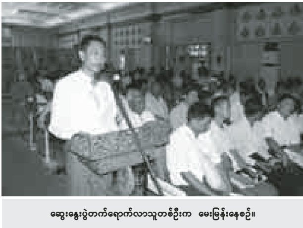
ဆွေးနွေးပွဲတက်ရောက်လာသူတစ်ဦးက မေးမြန်းနေစဉ်။

သားမြေအသုံးချမှု မူဝါဒ(မူကြမ်း)ရေးဆွဲထားရှိမှု၊ အမျိုးသားမြေအသုံးချမှုမူဝါဒ(မူကြမ်း)ကို တိုင်းဒေသကြီးနှင့် ပြည်နယ်များအလိုက် အကြံပြုဆွေးနွေးပွဲများ ပြုလုပ်သွားမည့် အစီအစဉ်နှင့် ယခုရေးဆွဲလျက်ရှိသော အမျိုးသားမြေအသုံးချမှုမူဝါဒ(မူကြမ်း)အား ပြည်သူများ၏ အကြံပြုချက်များနှင့်အညီ ပြင်ဆင်ရေးဆွဲရန်အတွက် ပြည်သူများ၏ အကြံပြုချက်၊ ဆွေးနွေးချက်များကို ရယူခြင်းဖြစ်ကြောင်း ရှင်းလင်းပြောကြားသည်။ ထို့နောက် တက်ရောက်လာသော မကွေးမြို့နယ် ဖွံ့ဖြိုးတိုးတက်ရေးကော်မတီ၊ မကွေးတိုင်းဒေသကြီးတောင်သူလယ်သမားသမဂ္ဂ လူငယ်ကွန်ရက်၊ မကွေးလူမှုကွန်ရက်များနှင့် ဒေသခံတောင်သူများက အကြံပြုမေးမြန်းကြသည်။