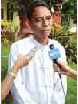
ဒေါက်တာအောင်သူ ရန်ကုန်တက္ကသိုလ်ပါမောက္ခချုပ်