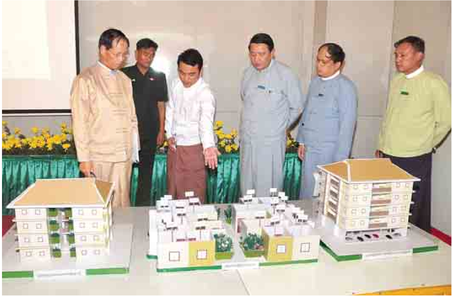
လှူဒါန်းကြရာ စုစုပေါင်း အလှူငွေကျပ်သိန်းပေါင်း ၁၃၉၈၅ သိန်းကျော် လက်ခံရရှိကြောင်း သိရသည်။ ယင်းနောက် ရတနာအုတ်မြစ်တော်စီမံကိန်းအစီအစဉ်အတွက် ဆက်လက်ကျင်းပရာ ဒုတိယသမ္မတ ဒေါက်တာစိုင်းမောက်ခမ်း၊ ပြည်ထောင်စုဝန်ကြီး၊ ပြည်နယ်ဝန်ကြီးချုပ်၊ တိုင်းမှူးနှင့် တာဝန်ရှိသူများက ရတနာအုတ်မြစ်တော်နှင့် ရတနာအုတ်မြစ်တော်များကို ပင့်ဆောင်၍ မင်္ဂလာအချိန်၌ သတ်မှတ်နေရာများအလိုက် ရတနာအုတ်မြစ်တော်များ စီသွင်းပေးကြပြီး အမွှေးနံ့သာရည်ဖြင့် ပတ်ဖျန်းပူဇော်ကြသည်။ မွန်းလွဲပိုင်းတွင် ဒုတိယသမ္မတ ဒေါက်တာ စိုင်းမောက်ခမ်းနှင့် အဖွဲ့သည် စာမျက်နှာ ၈ ကော်လံ ၁ *

ယနေ့ အခမ်းအနားတွင် စေတနာရှင်ပြည်သူများက ပုဒ္ဒတက္ကသိုလ် တည်ဆောက်ရေးအတွက် အလှူငွေများကို ပေးအပ်