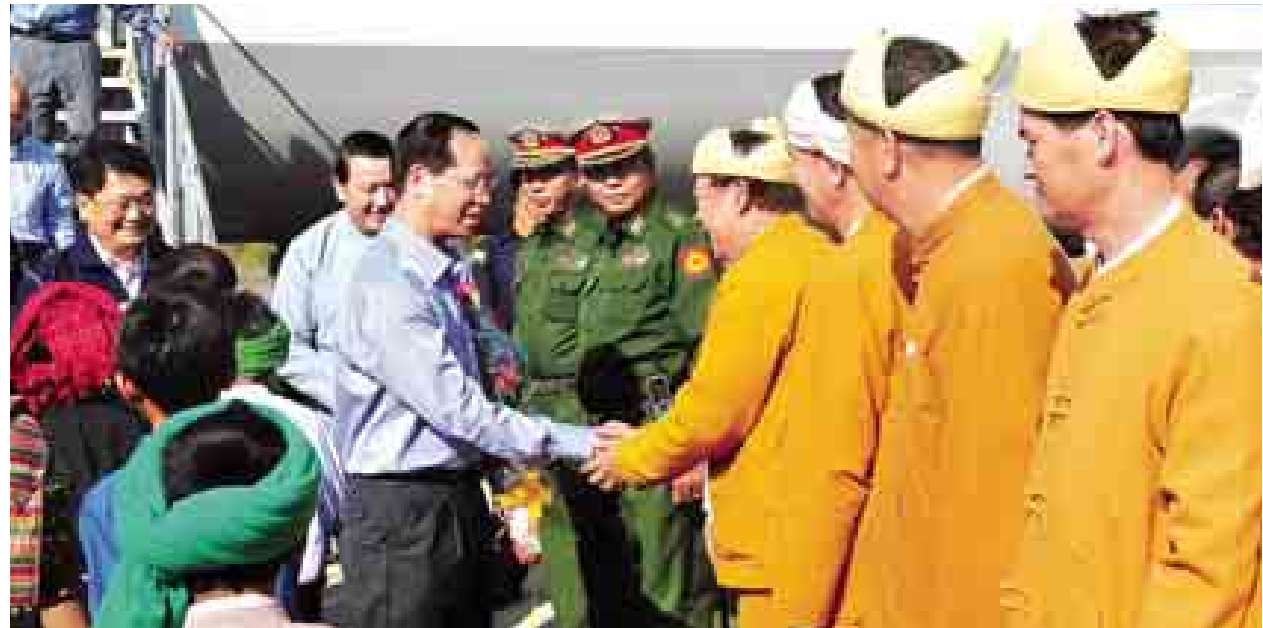
ဒုတိယသမ္မတဒေါက်တာစိုင်းမောက်ခမ်း ရှမ်းပြည်နယ် တောင်ကြီးမြို့သို့ရောက်ရှိရာ တာဝန်ရှိသူများက ကြိုဆိုနှုတ်ဆက်စဉ်။ (သတင်းစဉ်)

နေပြည်တော် နိုဝင်ဘာ ၂၀ ဒုတိယသမ္မတ ဒေါက်တာစိုင်းမောက်ခမ်းသည် ယနေ့နံနက်ပိုင်းတွင် ရှမ်းပြည်နယ် တောင်ကြီးမြို့နယ်ရှိ အားကစားဝန်ကြီးဌာန၊ အားကစားနှင့် ကာယပညာဦးစီးဌာန၊ အားကစားနှင့် ကာယပညာသိပ္ပံ(တောင်ကြီး)သို့ ရောက်ရှိပြီး လှည့်လည်ကြည့်ရှုစစ်ဆေးသည်။