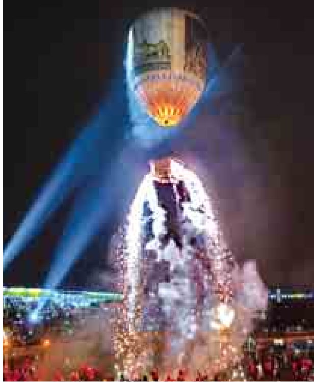
နိုဝင်ဘာ ၂၀ ရက်က ပြင်ဦးလွင်မြို့ မဟာအံ့ထူးကံသာ ဆုတောင်းပြည့် ဘုရားကြီး (၁၀) ကြိမ်မြောက် အထိမ်းအမှတ်အဖြစ် မြန်မာနိုင်ငံအရပ်ရပ်မှ ဓာတ်ပုံပညာရှင်များအား တန်ဆောင်တိုင် မီးပုံးပျံ (ဖိတ်ခေါ်)ဓာတ်ပုံဖြိုင့်ပွဲ ကို သာသနာဗိမာန်တော်ကြီး၌ပြုလုပ်ရာ ညအလှမ်းပုံးဖြိုင့်ပွဲတွင် ပထမဆု ရရှိသော စိုးပိုင်သူ (ရွှေကျောင်းကြီး)၏ လက်ရာကိုတွေ့ရစဉ်။ (၁၄၇)

နေပြည်တော်ကောင်စီနယ်မြေရှစ်မြို့နယ်တွင် ပျဉ်းမနားမြို့နယ်၌ မီး လောင်မှုဖြစ်စဉ် အများဆုံး ဖြစ်ပွားနေကြောင်း တွေ့ရသည်။ ပေါ့ဆမှုကြောင့်လောင်သော မီးလောင်မှုများကြောင့် မြို့နယ်၌ ရပ်ကွက်များမှ ပြည်သူများအနေဖြင့် မီးဘေးအန္တရာယ်ကို လွန်စွာစိုးရိမ် ထိတ်လန့်နေကြရသည်။ ပျဉ်းမနားမြို့နယ်အတွင်းရှိ ရပ်ကွက်များတွင် ဓာတ်ဆီသိုလှောင်ကယ်၊ သုံးဘီးဆိုင်ကယ်များအတွက်ရောင်းချနေသော ဓာတ်ဆီ သိုလှောင်ဆိုင်ငယ်လေးများ နေရာအနှံ့တွေ့မြင်နေရပြီး ရောင်းဝယ်နေကြသည်။ နေပြည်တော်ကောင်စီနယ်မြေ မြို့နယ်များတွင် ပုဂ္ဂလိကဓာတ်ဆီဆိုင်ကြီးများ မြို့နယ်တိုင်းတွင်ရှိနေသော်လည်း မြို့နယ်အတွင်း ဓာတ်ဆီသိုလှောင်ရောင်းချ နေသော ဆိုင်ငယ်များရှိနေခြင်းသည် မီးဘေးအန္တရာယ်ကျရောက်ချိန်၌ အထောက်အကူပြုစေဘဲ မီးလောင်ရာကို ပိုမိုအင်အားကြီးစွာဖြစ်စေနိုင် သည်ဟု မြို့နယ်ပြည်သူများက သုံးသပ်နေကြသည်။ ရွှေချိုရပ်ကွက်နေပြည်သူတစ်ဦးက “ကျွန်တော်တို့မြို့မှာ တစ်ချိန်က ပေါ့ဆမီးကစလိုက်တဲ့မြင်းကျကန်မီးဘေးဟာ မြို့ပေါ်မှာရှိတဲ့ ပြည်သူတွေကို အိုးမဲ့၊ အိမ်မဲ့တော်တော်များများ ဖြစ်စေခဲ့တယ်။ ပြည်သူတွေ ဒုက္ခ တော်တော်ရောက်ခဲ့တယ်။ အခုလို ကား၊ ဆိုင်ကယ်ပေါလာသမျှ ရပ်ကွက် ထဲမှာလည်း ဓာတ်ဆီသိုလှောင်ရောင်းချနေတဲ့ ဆိုင်ငယ်တွေလည်း များလာတယ်။ ဆိုင်တွေကို သက်ဆိုင်ရာက တားဆီးအရေးယူဆောင်ရွက် သင့်တယ်။ ဒါမှပြည်သူတွေအတွက် အသက်အိုးအိမ်နဲ့ မလိုလားအပ်တဲ့ မီးလောင်မှု၊ မီးဘေးအန္တရာယ်အတွက် ကြိုတင်ကာကွယ်ရာရောက်မှာပဲ” ဟု ပြောကြားသည်။ (၁၈၅)