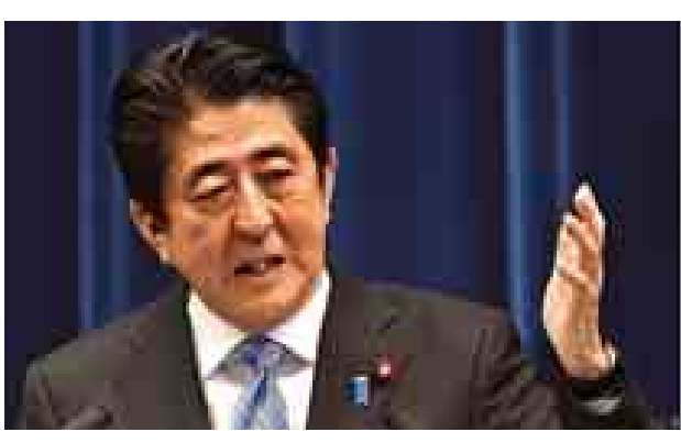
မစ္စတာအာဘေးနှင့် ၎င်း၏ လစ်ဘ ရယ်ဒီမိုကရက်တစ်ပါတီ (အယ်လ်ဒီပီ) သည် ရွေးကောက်ပွဲတွင် အနိုင်ရရှိ ရန်မျှော်လင့်နေဆဲဖြစ်သည်။ အောက် လွှတ်တော်တွင် မဲအများဆုံးရရှိထား

တိုကျို နိုဝင်ဘာ ၂၁ ရွေးကောက်ပွဲအတွက် လမ်းခင်း ပေးသည့်အနေဖြင့် ဂျပန်ဝန်ကြီးချုပ် ရှင်ဇိုအာဘေးက ပါလီမန်ကို ဖျက် သိမ်းလိုက်သည်။ မစ္စတာအာဘေးအနေဖြင့် စီးပွား ရေး ပြုပြင်ပြောင်းလဲရေးအတွက် လုပ်ပိုင်ခွင့်အသစ်ရရှိရန်နှင့် ကုန် ရောင်း အခွန်ကောက်ခံမှု အစီအစဉ် နှင့်ပတ်သက်၍ ၎င်းအပေါ် လူကြိုက် နည်းလာမှုကို လျော့နည်းသက်သာ လာစေရန်ဆောင်ရွက်နေသည်။ သို့ သော်လည်း ဝန်ကြီးချုပ် မစ္စတာ အာဘေးသည် ဒေသမီဒီယာက ဆောင်ရွက်သည့် လူထုထောက်ခံမှု စစ်တမ်းတွင် ထောက်ခံမှုကျဆင်းနေ သည်ဟု သိရသည်။ လူအများစုက