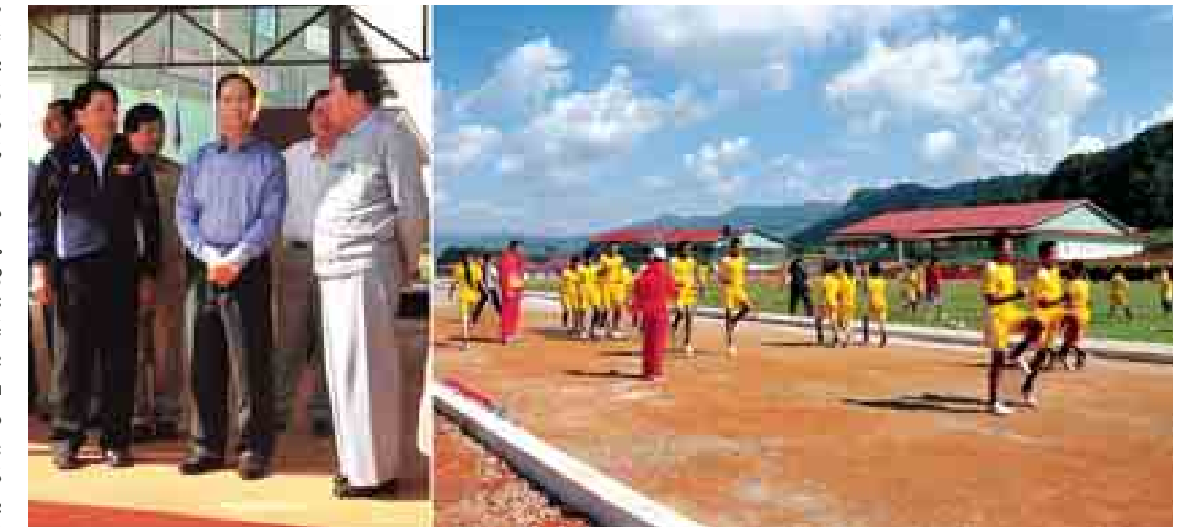
ဒုတိယသမ္မတဒေါက်တာစိုင်းမောက်ခမ်း အားကစားနှင့်ကာယပညာသိပ္ပံ (တောင်ကြီး)ရှိ အားကစားသမားများ လေ့ကျင့်နေမှုကို ကြည့်ရှုစဉ်။ (သတင်းစဉ်)

(တောင်ကြီး)သည် အားကစား နှင့် ကာယပညာသိပ္ပံ(ရန်ကုန်)၊ အား ကစားနှင့်ကာယပညာသိပ္ပံ(မန္တလေး)၊ အားကစားနှင့် ကာယပညာသိပ္ပံ (မော်လမြိုင်)တို့ကို ဖွင့်လှစ်ပြီးနောက် စတုတ္ထမြောက်အဖြစ်ဖွင့်လှစ်နိုင်သော အားကစားနှင့် ကာယပညာသိပ္ပံဖြစ် သည်။ ရန်ကုန်နှင့်မန္တလေးတို့သည် (က)အဆင့်ရှိပြီး မော်လမြိုင်နှင့် ကြောင်း၊ ရှမ်းပြည်နယ်နှင့် ကယား ပြည်နယ်တို့မှ ရွေးချယ်ထားသည့် လူငယ်အမျိုးသား ၇၅ ဦး၊ လူငယ် အမျိုးသမီး ၇၅ ဦး စုစုပေါင်း သင်တန်းသားဦးရေ ၁၅၀ ရှိပြီး လက်ရှိ အခြေအနေတွင် အားကစားနည်း ၁၀ မျိုးကို လေ့ကျင့်သင်ကြားပေးလျက် ရှိကြောင်း သိရသည်။ မွန်းလွဲပိုင်းတွင် ဒုတိယသမ္မတ ဒေါက်တာစိုင်းမောက်ခမ်းနှင့် အဖွဲ့ သည် ဆေးတက္ကသိုလ်(တောင်ကြီး) စီမံကိန်းသို့ရောက်ရှိရာ ဆေးသိပ္ပံ ပညာဦးစီးဌာန သွန်သင်ရေးမှူးချုပ် ဒေါက်တာသန်းဇော်မြင့်က ဆေး တက္ကသိုလ်သုံးထပ်ပင်မဆောင်၊ သုံး ထပ်သင်ကြားရေးဆောင်၊ လူ ၂၅၀