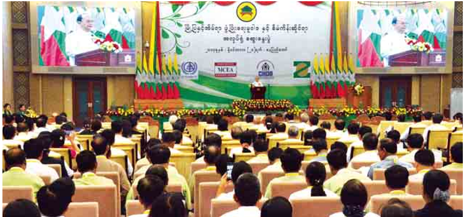
နိုင်ငံတော်သမ္မတ ဦးသိန်းစိန် မြို့ပြနှင့် အိမ်ရာဖွံ့ဖြိုးရေးမူဝါဒနှင့် စီမံကိန်းဆိုင်ရာ အလုပ်ရုံဆွေးနွေးပွဲတွင် အမှာစကားပြောကြားစဉ်။