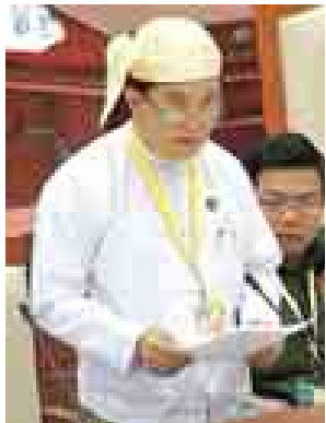
ဒုတိယဝန်ကြီး ဒေါက်တာပွင့်ဆန်း။ (သတင်းစဉ်)

နိုင်ငံတော်၏ ကုန်သွယ်မှုကဏ္ဍတွင် ပို့ကုန်ကဏ္ဍ ဖွံ့ဖြိုးတိုးတက်မှုအတွက် အမျိုးသားအဆင့် ပို့ကုန်မဟာဗျူဟာ ဖွံ့ဖြိုးတိုးတက်ရေးအစီအစဉ်ကို ဦးစားပေးကဏ္ဍများ ကုန်စည် (၅)မျိုးအဖြစ် ဆန်၊ ပဲမျိုးစုံနှင့်