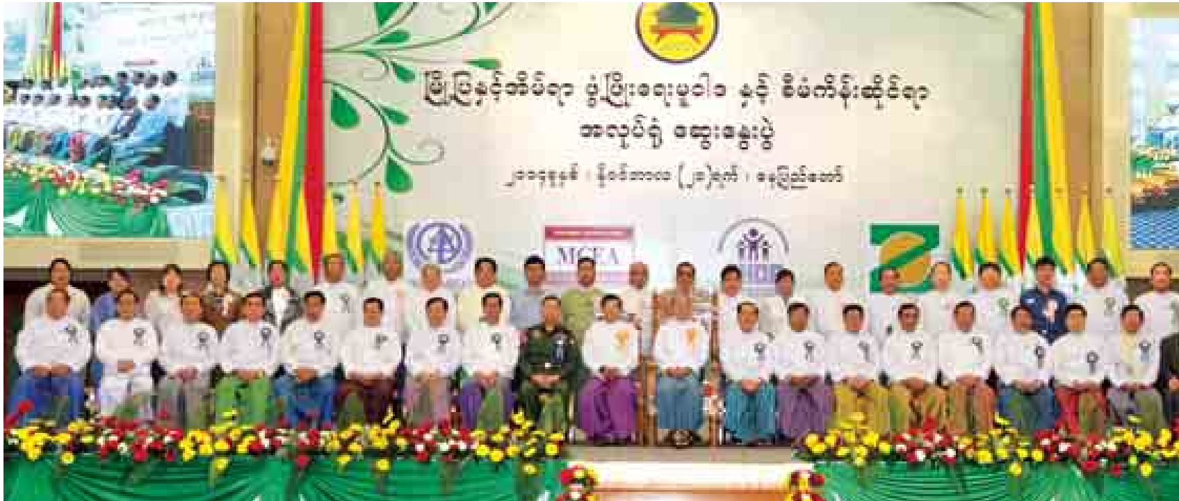
နိုင်ငံတော်သမ္မတ ဦးသိန်းစိန် မြို့ပြနှင့်အိမ်ရာ ဖွံ့ဖြိုးရေးမူဝါဒနှင့် စီမံကိန်းဆိုင်ရာ အလုပ်ရုံဆွေးနွေးပွဲ အခမ်းအနားတွင် မှတ်တမ်းတင်ဓာတ်ပုံရိုက်စဉ်။

မိမိတို့အစိုးရ စတင်တာဝန်ယူစဉ်ကတည်းက ပြည်သူတို့၏ စားဝတ်နေရေး၊ အခြေခံလူမှုစီးပွားဖွံ့ဖြိုးတိုးတက်ရေးအတွက် ပြည်သူ့ဗဟိုပြု ဖွံ့ဖြိုးတိုးတက်ရေးလုပ်ငန်းစဉ်များကို တစိုက်မတ်မတ်လုပ်ဆောင်လာခဲ့ခြင်း ဖြစ်ပါကြောင်း၊ ကျေးရွာဖွံ့ဖြိုးတိုးတက်ရေးစီမံကိန်းများနှင့် ပူးပေါင်းကာ ကျေးလက်ပြည်သူများက ကိုယ်တိုင်ပါဝင်ရေးဆွဲအကောင်အထည်ဖော်တတ်စေရန် လေ့ကျင့်ဆောင်ရွက်ခဲ့ရာ၌ ယခုအခါ ကျေးရွာ အတော်များများ ဆောင်ရွက်ပြီး ဖြစ်သကဲ့သို့ မွေးမြူရေး၊ ရေလုပ်ငန်းနှင့် ကျေးလက်ဒေသဖွံ့ဖြိုးရေးဝန်ကြီးဌာန အနေဖြင့် ကျေးရွာအနှံ့ ပြည်သူများနှင့် ထိတွေ့ပြီး လိုအပ်ချက်များဖြည့်ဆည်း