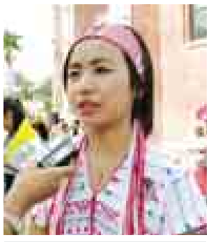
မရီးနာ (ရန်ကုန်တိုင်းဒေသကြီး အင်းစိန်)

ဒီအထိမ်းအမှတ် အခမ်းအနားကတော့ နှစ်(၅၀၀)မှာ တစ်ခါကြိုရတဲ့ ပွဲဖြစ်တဲ့အတွက် အလွန်ဝမ်းသာပါတယ်။ ဘိုးဘေး ခရစ်ယာန် ကက်သလစ်ဘာသာကို အမိမြန်မာနိုင်ငံမှာ မျိုးစေ့ချပေးခဲ့တဲ့အတွက် ဘိုးဘွားတွေကို ဆုတောင်းပေးခြင်းဖြစ်ပါတယ်။ ခရစ်ယာန်အသင်းတော်မှာရှိတဲ့ အသင်းဝင် အသင်းသားများပိုပြီး ယုံကြည်ခြင်း ခိုင်မာဖို့ ဒီပွဲတော်ကြီးက နှိုးဆော်ခြင်းဖြစ်ပါတယ်။ ပွဲတော်ကြီးအတွက် မြန်မာနိုင်ငံအသီးသီးက ကြိုရောက်လာတဲ့ ဘာသာတူအားလုံးကိုလည်း ပွဲတော်ကျင်းပရေးပတ်ပတ်ကော်မတီနဲ့ အထောက်အကူပြုကော်မတီက လှိုက်လှိုက်လှဲလှဲကြိုဆိုပြီးတော့ ပွဲတော်မှာ လိုအပ်တာ