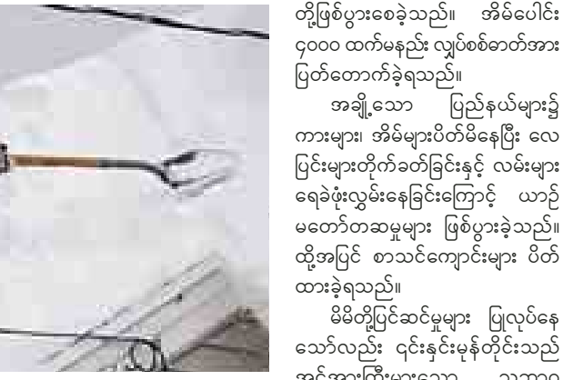
ကြောင့် နှင်းများကျလာခဲ့ရာ နှင်းထု သည် သုံးပေအထိ ရောက်ရှိနိုင် ကြောင်း ၎င်းဌာနက သတိပေးခဲ့ သည်။ အဆိုပါ နှင်းများထူထပ်စွာ ကျဆင်းမှုသည် အမျိုးမျိုးပြုကျခြင်း၊ လေကြောင်းလိုင်းများ ဖျက်သိမ်းရ ခြင်း၊ ကားများသောင်တင်နေခြင်း

ဝါရှင်တန် နိုဝင်ဘာ ၂၁ အမေရိကန်ပြည်ထောင်စု အရှေ့ မြောက်ပိုင်း၌ နှင်းမှန်တိုင်းတိုက်ခတ်မှု ကြောင့် သေဆုံးသူဦးရေ ၁၀ ဦးအထိ ရှိလာပြီဖြစ်ပြီး နှင်းပိုမိုကျလာနိုင် သည့်အတွက် အာဏာပိုင်များက ဒေသခံပြည်သူများကို သတိပေးချက် ထုတ်ပြန်ထားသည်။ ဘတ်ဖဲလိုးမြို့အပါအဝင် အမေ ရိကန်ပြည်ထောင်စု နေရာအနှံ့အပြား သည် နှင်းထု ၅ ပေအောက် ရောက် ရှိနေပြီး နယူးယောက်၌ ၁၀ ဦး သေဆုံးခဲ့ပြီဖြစ်ကြောင်း အမျိုးသား မိုးလေဝသဌာနက ပြောခဲ့သည်။ အေးမြသော ကမ္ဘာလေထုအခြေ အနေတွင် လေအေးများသည် နွေးသောရေပြင်ပေါ် ဖြတ်သွားခြင်း