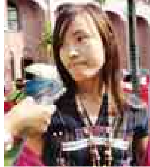
မိုင်နင်းရီတာစ် (ချင်းလူမျိုး၊ ရခိုင်ပြည်နယ်)

နှစ်(၅၀၀)ပြည့် ဂျူဘလီကို လာရတဲ့အတွက် မပြောပြနိုင်လောက်အောင် ဝမ်းသာပါတယ်။ ဂုဏ်ယူပါတယ်။ တိုင်းသူပြည်သားတွေက ယုံကြည်ခြင်းမှာ တိုးတက်လာတယ်။ တကယ်တမ်းလုံးမဆိုတာ ရှိလာတယ်။