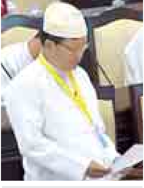
ဒုတိယဝန်ကြီး ဦးတင်ဦးလွင်။ (သတင်းစဉ်)

ရှေးဦးစွာ လွှတ်တော်ဥက္ကဋ္ဌက အမျိုးသားလွှတ်တော်က အတည်ပြုပြီးပေးပို့ထားသော ပြည်ထောင်စုအဆင့်ပုဂ္ဂိုလ်များ၏ချီးမြှင့်ငွေ၊ စရိတ်နှင့် အဆောင်အယောင်များဆိုင်ရာ ဥပဒေကို ပြင်ဆင်သည့်ဥပဒေကြမ်း၊ နေပြည်တော်ကောင်စီ ဥက္ကဋ္ဌနှင့် ကောင်စီဝင်များ၏ ချီးမြှင့်ငွေ၊ စရိတ်နှင့် အဆောင်အယောင်များဆိုင်ရာ ဥပဒေကို ပြင်ဆင်သည့်ဥပဒေကြမ်းနှင့် ကိုယ်ပိုင်အုပ်ချုပ်ခွင့်ရတိုင်း သို့မဟုတ် ကိုယ်ပိုင်အုပ်ချုပ်ခွင့်ရဒေသ ဥက္ကဋ္ဌနှင့် အလုပ်အမှုဆောင်ကော်မတီဝင်များ၏ ချီးမြှင့်ငွေ၊ စရိတ်နှင့်အဆောင်အယောင်များဆိုင်ရာဥပဒေကို ပြင်ဆင်သည့်ဥပဒေကြမ်း တို့အား ပြည်သူ့