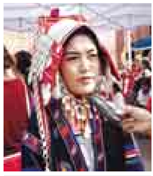
မေရီ (တာချီလိတ်၊ ရှမ်းအရှေ့ပိုင်း)

မင်္ဂလာတောင်ညွန့် စိန်အန်ထော်နီ ဘုရားကျောင်း ကျောင်းထိုင်ဘုန်းတော်ကြီးပါ။ ပွဲတော်မှာ ကျင်းပနေထိုင်မတ်ဥက္ကဋ္ဌအနေနဲ့ရော၊ ပွဲတော်တာဝန်ခံအနေနဲ့ပါ လုပ်ပေးပါတယ်။ နှစ်(၅၀၀)တိုင်တိုင် အသင်းတော်ကြီးအနေနဲ့ သစ္စာရှိရှိနဲ့ ဘုရားသခင်ရဲ့ အမှုတော်ထမ်းဆောင်ပါတယ်။ ဘာသာတူတွေကို ခရစ်တော်ရဲ့ သွန်သင်မှုတွေ နားလည်နိုင်အောင် သမ္မာကျမ်းစာများ သိရှိနိုင်ရအောင် ခရစ်ယာန်များရဲ့ ကျင့်စဉ်များကို ကျင့်ကြံပြီး ဘာသာတစ်ခုတည်း မဟုတ်ဘဲ ဘာသာပေါင်းစုံနဲ့ ချစ်ကြည်ညီညွတ်ပြီး ဒွန်တွဲလုပ်ဆောင်နေပါတယ်။ အခုဆိုရင် ဒီပွဲတော်ကျင်းပဖို့လည်း ဘာသာပေါင်းစုံသာသနာအကြီးအကဲများနဲ့ နေလယ်စာ သုံးဆောင်ပါမယ်။ သံဃနာယကအဖွဲ့ဥက္ကဋ္ဌ ဆရာတော်ကြီးကိုလည်း ဖိတ်ပါတယ်။ ၂၃ ရက်နေ့မှာ မိန့်ခွန်းချွေဖို့ ကမ်းလှမ်းထားပါတယ်။ ဘာသာရေးရာ နိုင်ငံရေးပါ အားလုံး ဒွန်တွဲပြီး လူသားထုတစ်ရပ်လုံးရဲ့ ဖွံ့ဖြိုးတိုးတက်မှုနှင့်အတူတကွ ဒွန်တွဲနေထိုင်ဖို့ဆိုတာ ဦးတည်ချက်တစ်ခုပါ။ မြန်မာပြည်တစ်ပြည်လုံးက လူမျိုးပေါင်းစုံရှိတယ်။ ဘာသာပေါင်းစုံကလည်း ပါဝင်ကြတဲ့အတွက် ဂုဏ်