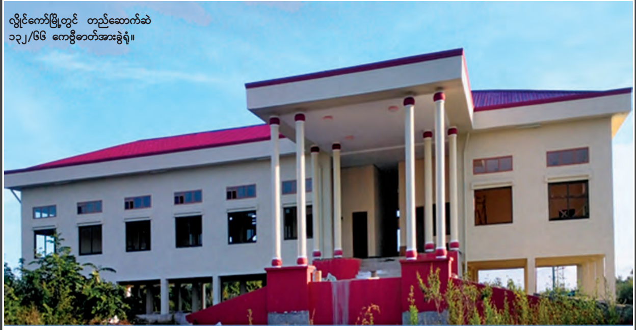
လှိုင်ကော်မြို့တွင် တည်ဆောက်ခဲ့ ၁၃၂/၆၆ ကေပီဓာတ်အားခွဲရုံ။

သို့ဖြစ်၍ လျှပ်စစ်ဓာတ်အားရရှိမှုအပေါ် အခြေခံပြီး ကယားပြည်နယ် အတွင်းရှိ မြို့များနှင့် ကျေးရွာများတွင် ပညာရေး၊ လူမှုရေး၊ ကျန်းမာရေး ဖွံ့ဖြိုးတိုးတက်မှုများ ရရှိလာမည်ဖြစ်ပါသည်။ နိုင်ငံတော် အနေဖြင့် ကယား ပြည်နယ်နည်းတူ ကျန်တိုင်းဒေသကြီး/ပြည်နယ်များတွင်လည်း လျှပ်စစ် ဓာတ်အား ပိုမိုဖြန့်ဖြူးပေးနိုင်ရန်အတွက် စီမံကိန်းလုပ်ငန်းများ ဆောင်ရွက် လျက်ရှိကြောင်း ရေးသားလိုက်ရပါသည်။