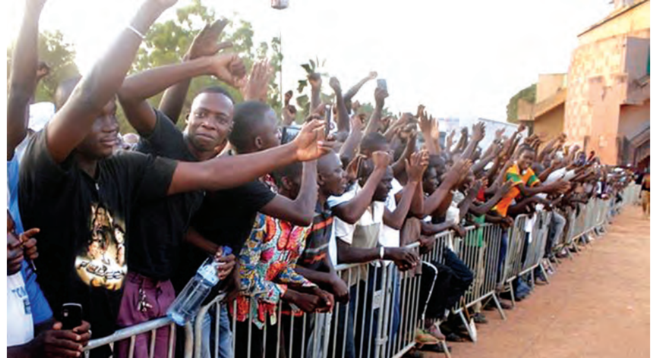
ကြားဖြတ်သမ္မတကို ပြည်သူများက ဝမ်းပန်းတသာကြိုဆိုနေကြစဉ်။

များရေးဆွဲပြီး တနင်္ဂနွေနေ့က စာချုပ် လက်မှတ်ရေးထိုးအပြီး အဆိုပါ ကြားဖြတ်သမ္မတ ရွေးချယ်မှု ပေါ်ထွက်လာခြင်းဖြစ်သည်။