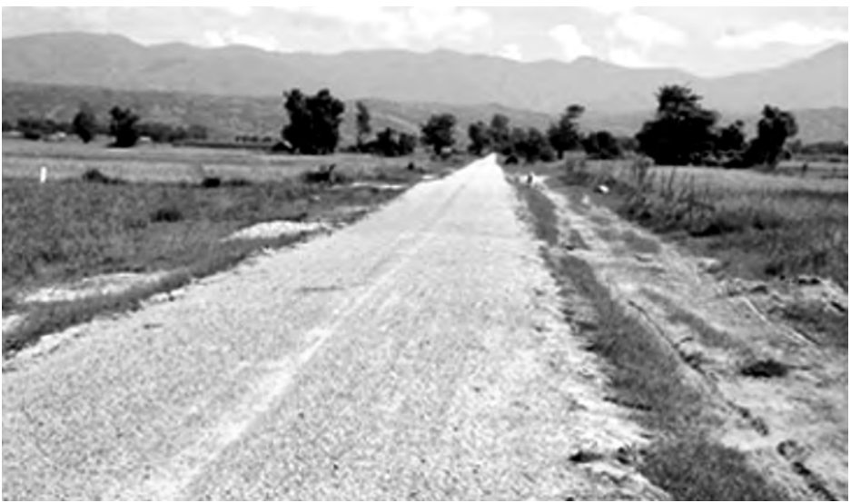
အထိ မြင့်တက်လျက်ရှိသည်ကို တွေ့ ရသည်။ စစ်တောင်းမြစ် အရှေ့ဘက် ခြမ်းနှင့် အနောက်ဘက်ခြမ်းတို့