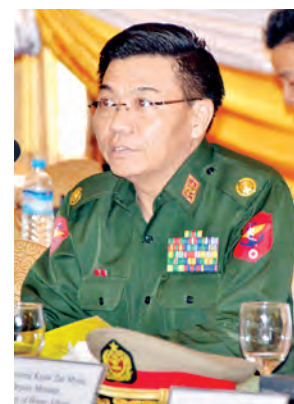
ဒုတိယဝန်ကြီး ဗိုလ်မှူးချုပ်ကျော်စံမြင့်

မေး။ ။ ဒီအစည်းအဝေးရဲ့ သဘောတူညီမှုတွေကို နှစ်နိုင်ငံကိုယ်စားလှယ်ခေါင်းဆောင်တွေအနေနဲ့ ဘယ်အတိုင်းအတာအထိ မျှော်မှန်းထားလဲဆိုတာ သိရှိလိုပါတယ်။ ဖြေ။ ။ အထက်ကပြောခဲ့သလို အဓိကကိစ္စရပ်တွေကို နှစ်နိုင်ငံအကျိုးအတွက် နှစ်ဖက်ကိုယ်စားလှယ်ခေါင်းဆောင်တွေ အပြန်အလှန်ဆွေးနွေးကြပြီး သဘောတူညီချက်တွေကိုဆွေးနွေးပွဲအပြီးမှာ လက်မှတ်ရေးထိုးကြမှာဖြစ်ပါတယ်။ နှစ်နိုင်ငံအကျိုးကိုရှေးရှုပြီး ရင်းနှီးပွင့်လင်းစွာ နှစ်နိုင်ငံကိစ္စရပ်များကို အောင်အောင်မြင်မြင်ဆွေးနွေးကြတဲ့အတွက် များစွာကျေနပ်ဝမ်းမြောက်ကြမှာပါ။ လာမယ့်အနာဂတ်မှာ နှစ်နိုင်ငံအနေနဲ့ အပြန်အလှန်နားလည်မှုရှိရှိ ပိုမိုနီးကပ်စွာ ပူးပေါင်းလက်တွဲဆောင်ရွက်သွားကြမှာဖြစ်သလို နှစ်နိုင်ငံအကြား အပြန်အလှန် ပူးပေါင်းဆောင်ရွက်ခြင်းဖြင့် ချစ်ခင်ရင်းနှီးမှုတိုးတက်မြှင့်မားလာစေမှာဖြစ်ကြောင်း မျှော်မှန်းထားပါတယ်ဟု မြန်မာကိုယ်စားလှယ်အဖွဲ့ခေါင်းဆောင် ပြည်ထောင်စုဝန်ကြီးဌာန ဒုတိယဝန်ကြီး ဗိုလ်မှူးချုပ်ကျော်စံမြင့်က ပြောကြားသွားသည်။ (မြန်မာ့အလင်း)