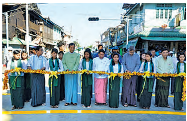
စာပေမြင့်မှ လူမျိုးတင့်မည်