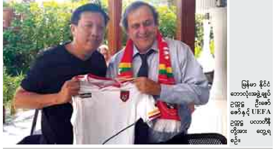
မြန်မာ နိုင်ငံ ဘောလုံးအဖွဲ့ချုပ် ဥက္ကဋ္ဌ ဦးဇော်ဇော်နှင့် UEFA ဥက္ကဋ္ဌ ပလာတီနိုတို့အား တွေ့ဆုံစဉ်။

ကိစ္စရပ်များ၊ မြန်မာဘောလုံးတိုးတက်ရေးအတွက် ဆွေးနွေးခဲ့ကြပြီး ယူ - ၂၀ ကမ္ဘာ့ဖလားဝင်ခွင့်ရရှိထားသည့် မြန်မာယူ-၁၉ အသင်းအား ဥရောပနိုင်ငံများ၌ လေ့ကျင့်ပြီး ခြေစမ်းပွဲများ ကစားရန်အတွက်လည်းဆွေးနွေးခဲ့ကြသည်။ ပလာတီနိုက မြန်မာယူ-၁၉အသင်း ကမ္ဘာ့ဖလား ဝင်ခွင့်ရရှိမှုအပေါ် ချီးကျူးဂုဏ်ပြုခဲ့ပြီး ဥရောပကလပ်များနှင့် ခြေစမ်းပွဲများ ကစားခွင့်ရရှိရန် ကူညီဆောင်ရွက်ပေးမည်ဖြစ်ကြောင်း ပြောသည်။ ဖိုးသော်ဇော်