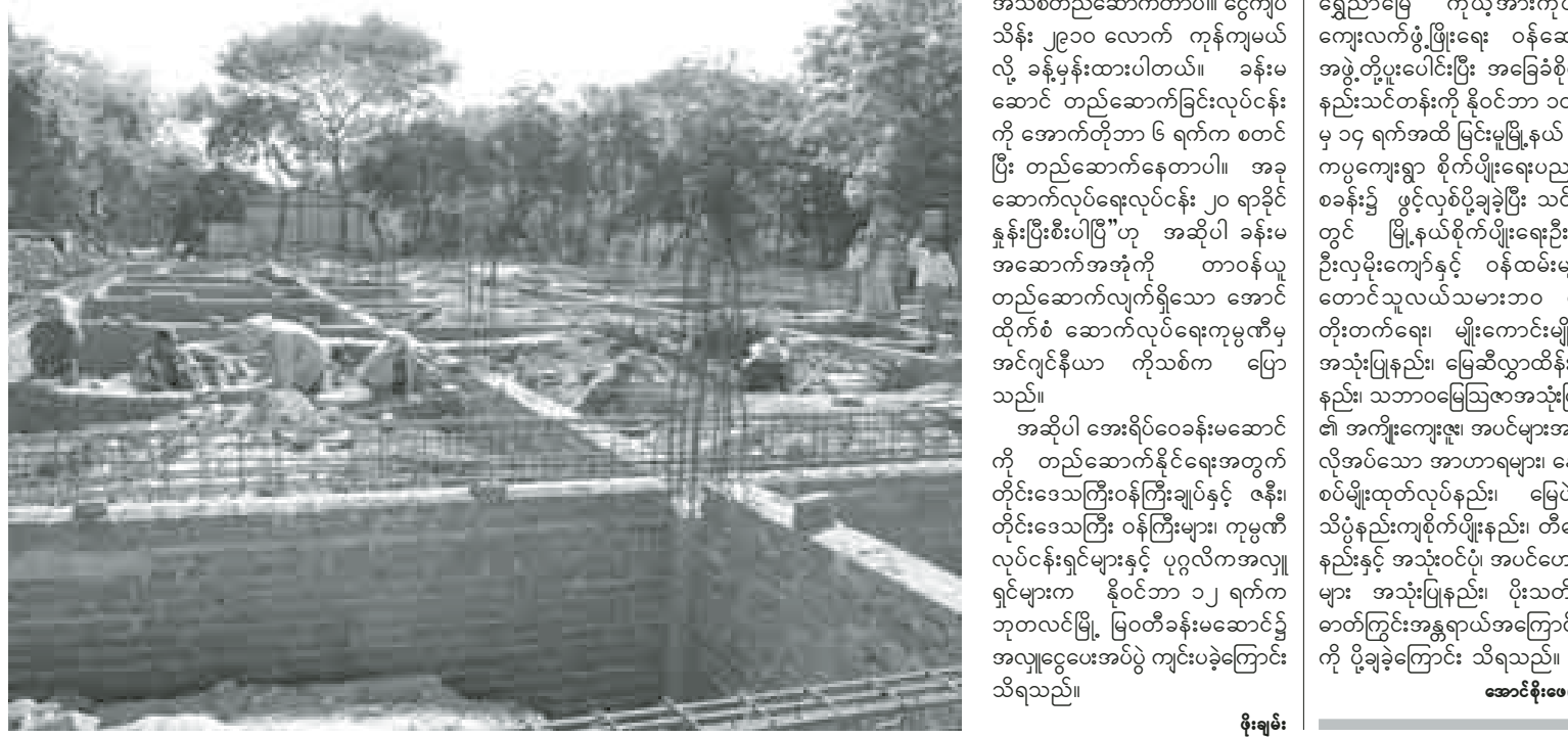
ဖိုးရမ်း

နဂါး နိုဝင်ဘာ ၁၆ အနံ့ပေ ၆၀၊ အမြင့် ၂၆ ပေရှိ အေးရိပ်ဝေခန်းမဆောင် တည်ဆောက် ဘုတလင်မြို့ အခြေခံပညာအထက် တန်းကျောင်းတွင် အလျား ၁၂၈ ပေ၊ “ဒီနေရာမှာ အရင်က အလျား ပေ ၁၂၀၊ အနံ့ ၃၆ ပေရှိတဲ့ နံကပ် ပညာရတနာခန်းမရှိတယ်။ ခန်းမက အသုံးပြုလာတာ နှစ်ကြာလာပြီ။