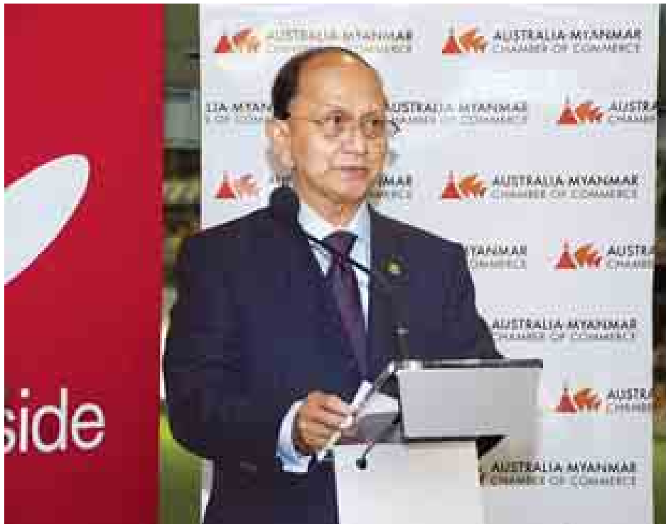
နိုင်ငံတော်သမ္မတ ဦးသိန်းစိန် ညစာစားပွဲတွင် တက်ရောက်မိန့်ခွန်းပြောကြားစဉ်။ (သတင်းစဉ်)

ဩစတြေးလျနှင့် မြန်မာနိုင်ငံတို့၏ ကုန်သွယ်မှုသည် ၃၈ ဒသမ ၂ ရာခိုင်နှုန်းအထိ တိုးတက်ခဲ့ပြီး စုစုပေါင်း