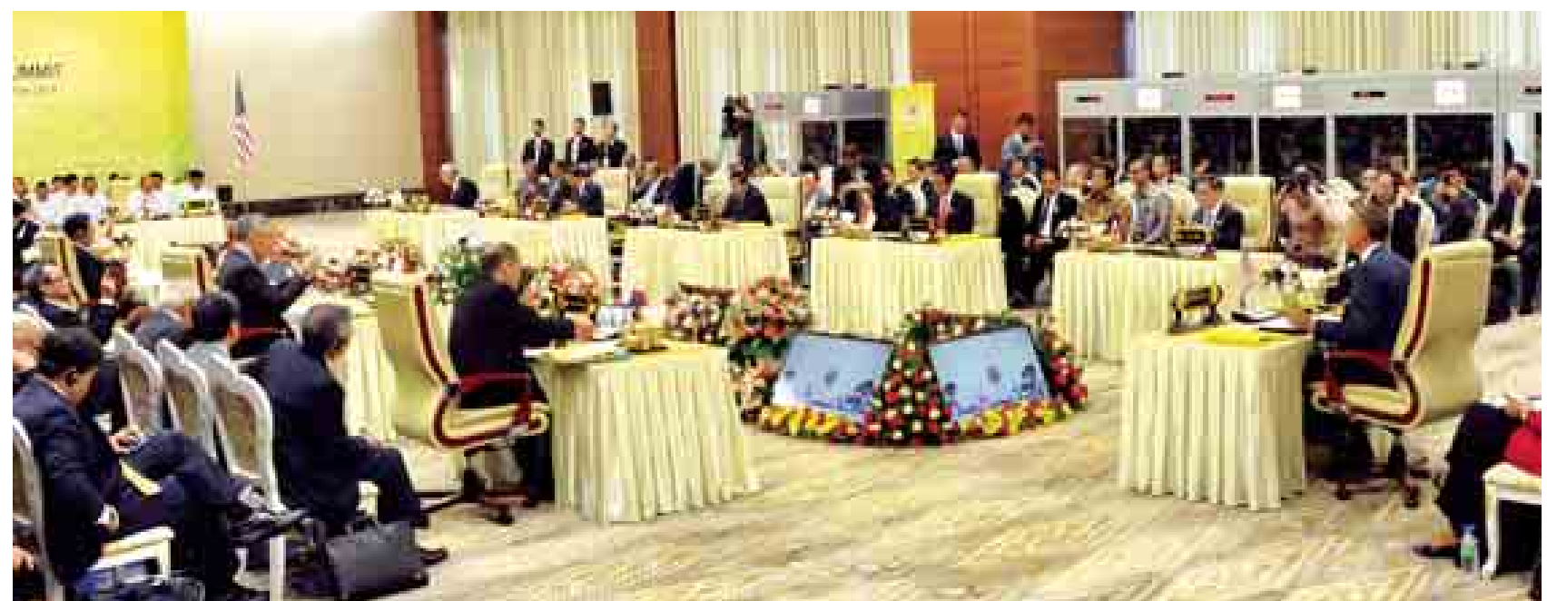
နိုဝင်ဘာ ၁၃ ရက်က ဒုတိယအကြိမ်မြောက် အာဆီယံ-အမေရိကန်ထိပ်သီးအစည်းအဝေးကျင်းပစဉ်။