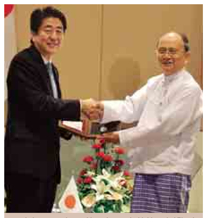
နိုဝင်ဘာ ၁၂ ရက်က နိုင်ငံတော်သမ္မတ ဦးသိန်းစိန် ဂျပန်ဝန်ကြီးချုပ် ရင်နိုအာဘေးအား ရင်းရင်းနှီးနှီးနှုတ်ဆက်စဉ်။