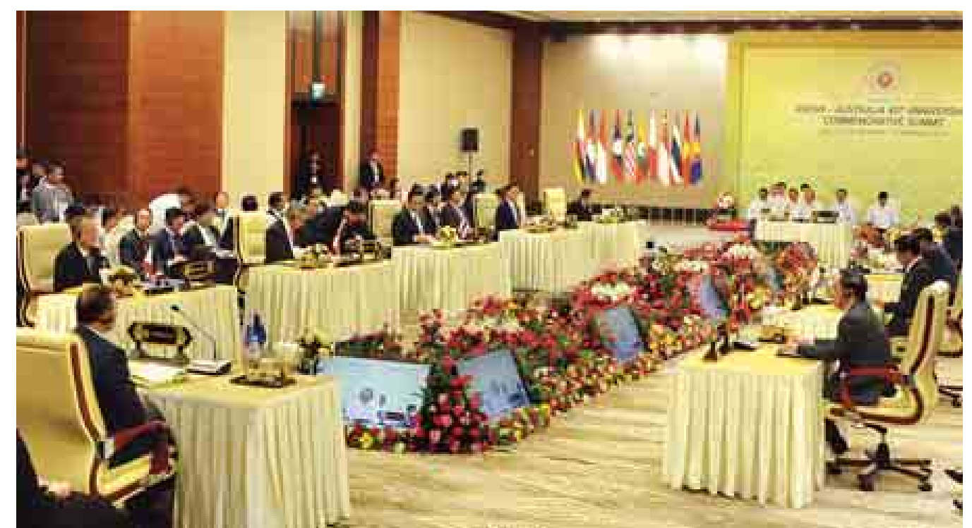
နိုဝင်ဘာ ၁၂ ရက်က အာဆီယံ-ဩစတြေးလျ နှစ် (၄၀)ပြည့် အထိမ်းအမှတ် ထိပ်သီးအစည်းအဝေး ကျင်းပစဉ်။