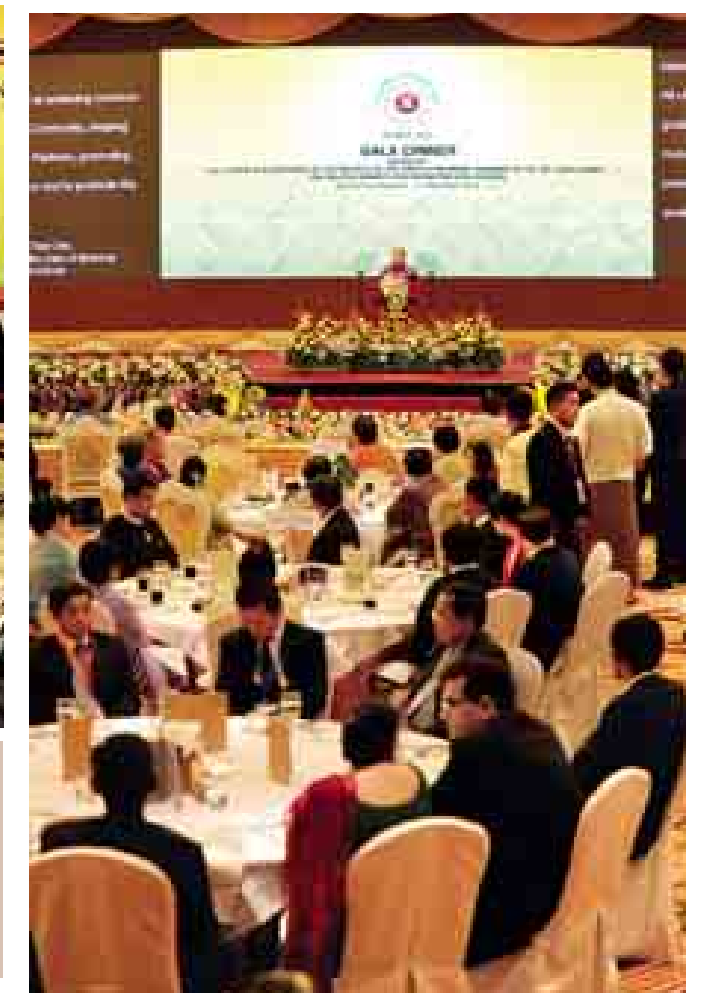
နိုဝင်ဘာ ၁၂ ရက်က ဂါလညာစာစာ့တွင် နိုင်ငံတော်သမ္မတ ဦးသိန်းစိန် ကြိုဆိုနှုတ်ခွန်းဆက် စကားပြောကြားစဉ်။ (ယာဝုံ)