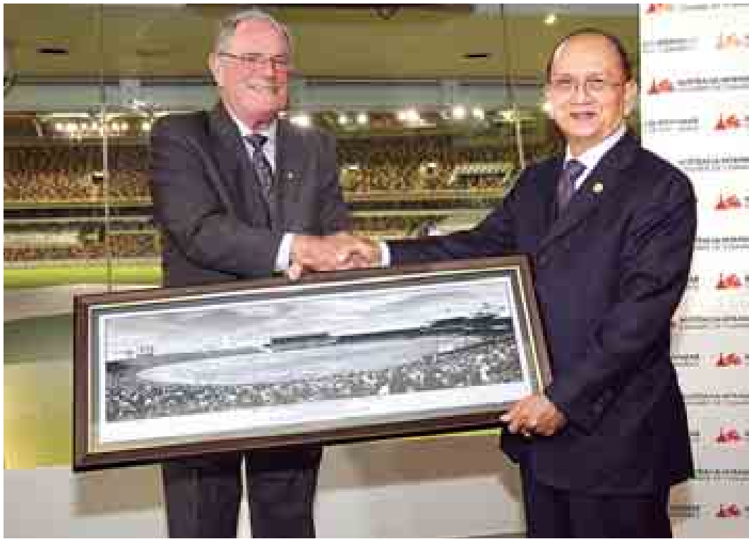
နိုင်ငံတော်သမ္မတ ဦးသိန်းစိန် အား ဩစတြေးလျ-မြန်မာ ကုန်သည်ကြီးများအသင်း ဥက္ကဋ္ဌ မစ္စတာ ဂလန်ရော်ဘင်ဆန်က အမှတ်တရလက်ဆောင်ပေးအပ်စဉ်။ (သတင်းစဉ်)

နိုင်ငံတော်သမ္မတဦးသိန်းစိန် ဩစတြေးလျ-မြန်မာ ကုန်သည်ကြီးများအသင်းဥက္ကဋ္ဌ မစ္စတာ ဂလန်ရော်ဘင်ဆန် တည်ခင်းစဉ်ခံသည့် ညစာစားပွဲ တက်ရောက်စဉ်။ (သတင်းစဉ်)