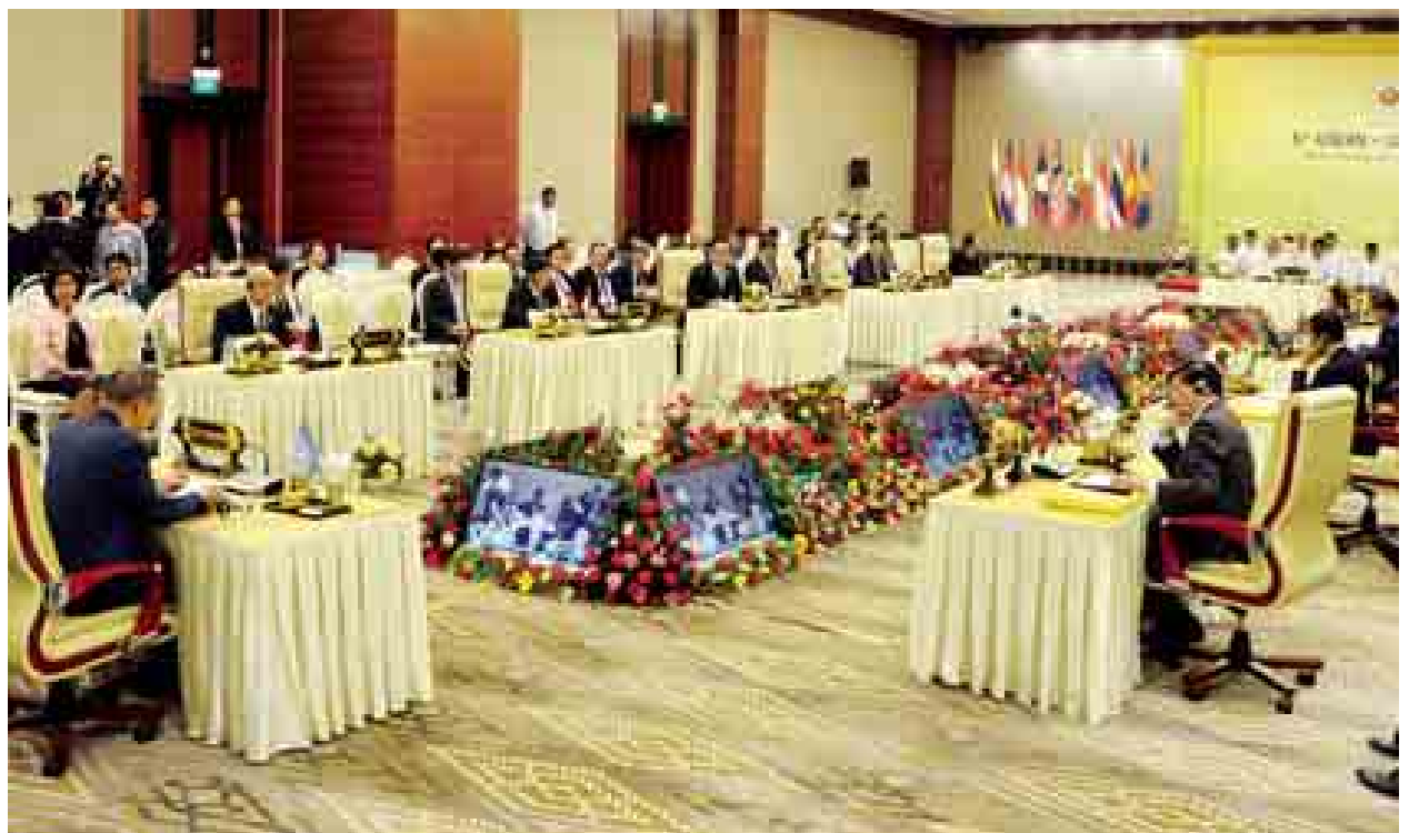
နိုဝင်ဘာ ၁၂ ရက်က (၆)ကြိမ်မြောက် အာဆီယံ-ကုလသမဂ္ဂထိပ်သီးအစည်းအဝေးကျင်းပစဉ်။ (အပေါ်ပုံ) နိုဝင်ဘာ ၁၃ ရက်က နိုင်ငံတော်သမ္မတဦးသိန်းစိန် အရှေ့အာရှထိပ်သီးအစည်းအဝေးသို့ တက်ရောက်လာသော အမေရိကန်ပြည်ထောင်စု သမ္မတ ဘားရက်အိုဘားမားအား ရင်းရင်းနှီးနှီးနှုတ်ဆက်စဉ်။ (ဝဲပုံ)