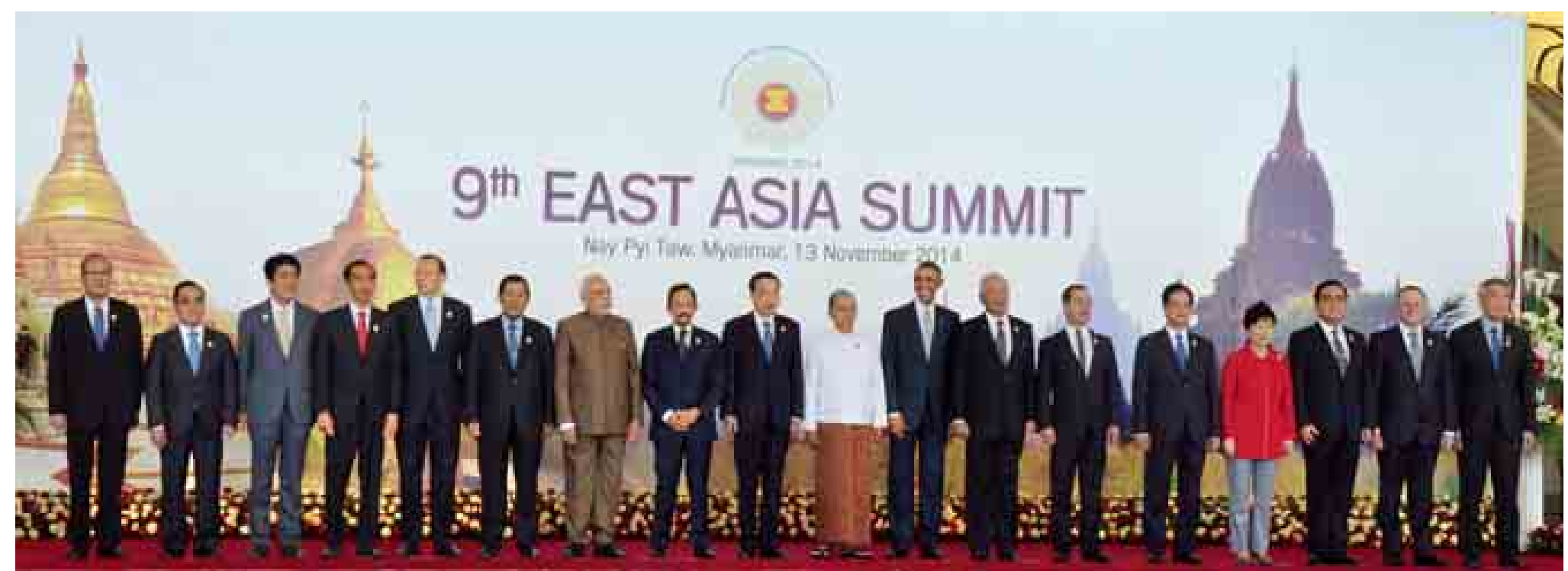
နိုဝင်ဘာ ၁၃ ရက်က နိုင်ငံတော်သမ္မတ ဦးသိန်းစိန်နှင့် (၉)ကြိမ်မြောက် အရှေ့အာရှထိပ်သီးအစည်းအဝေးသို့ တက်ရောက်လာကြသော နိုင်ငံအကြီးအကဲများနှင့် အစိုးရအဖွဲ့ အကြီးအကဲများ မှတ်တမ်းတတ်ပုံ။