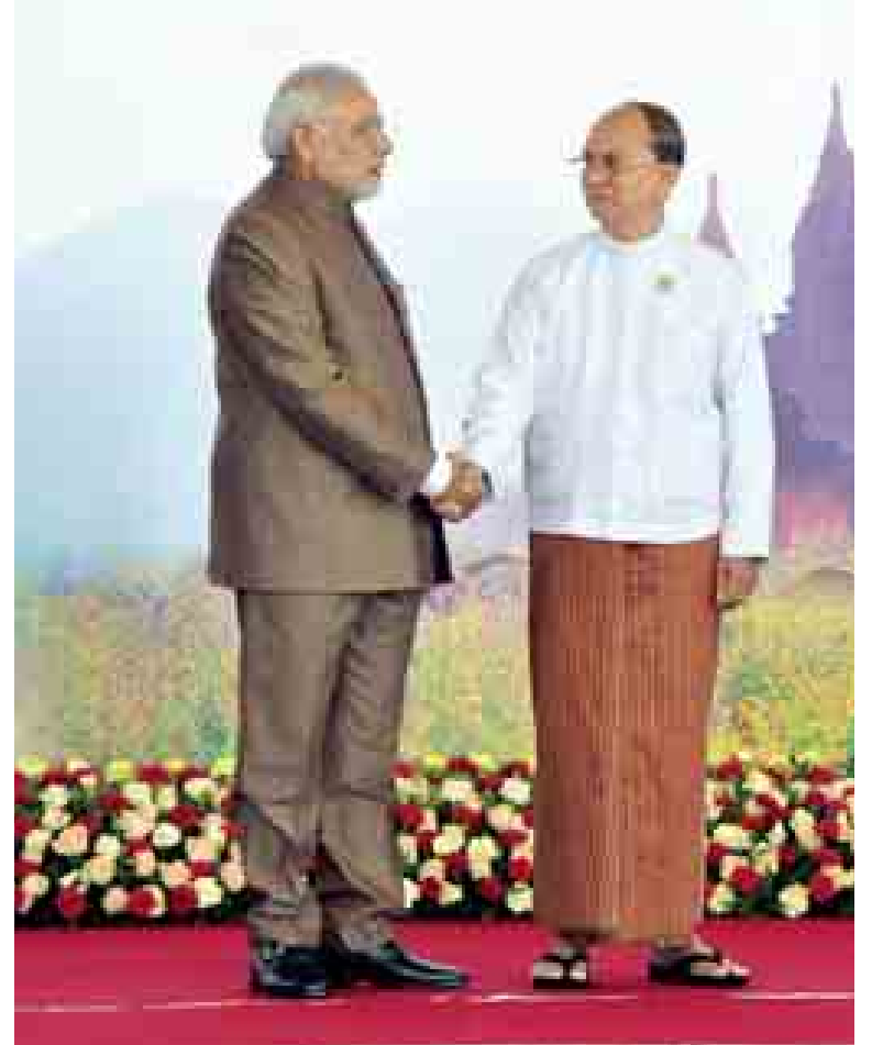
Myanmar, 13 November 2014

နိုဝင်ဘာ ၁၃ ရက်က နိုင်ငံတော်သမ္မတဦးသိန်းစိန် အရှေ့အာရှထိပ်သီးအစည်းအဝေးသို့ တက်ရောက်လာသော အိန္ဒိယနိုင်ငံ ဝန်ကြီးချုပ် နရန်ဒရာ မိုဒီနှင့် ရင်းရင်းနှီးနှီးနှုတ်ဆက်စဉ်။ (ယာပုံ)