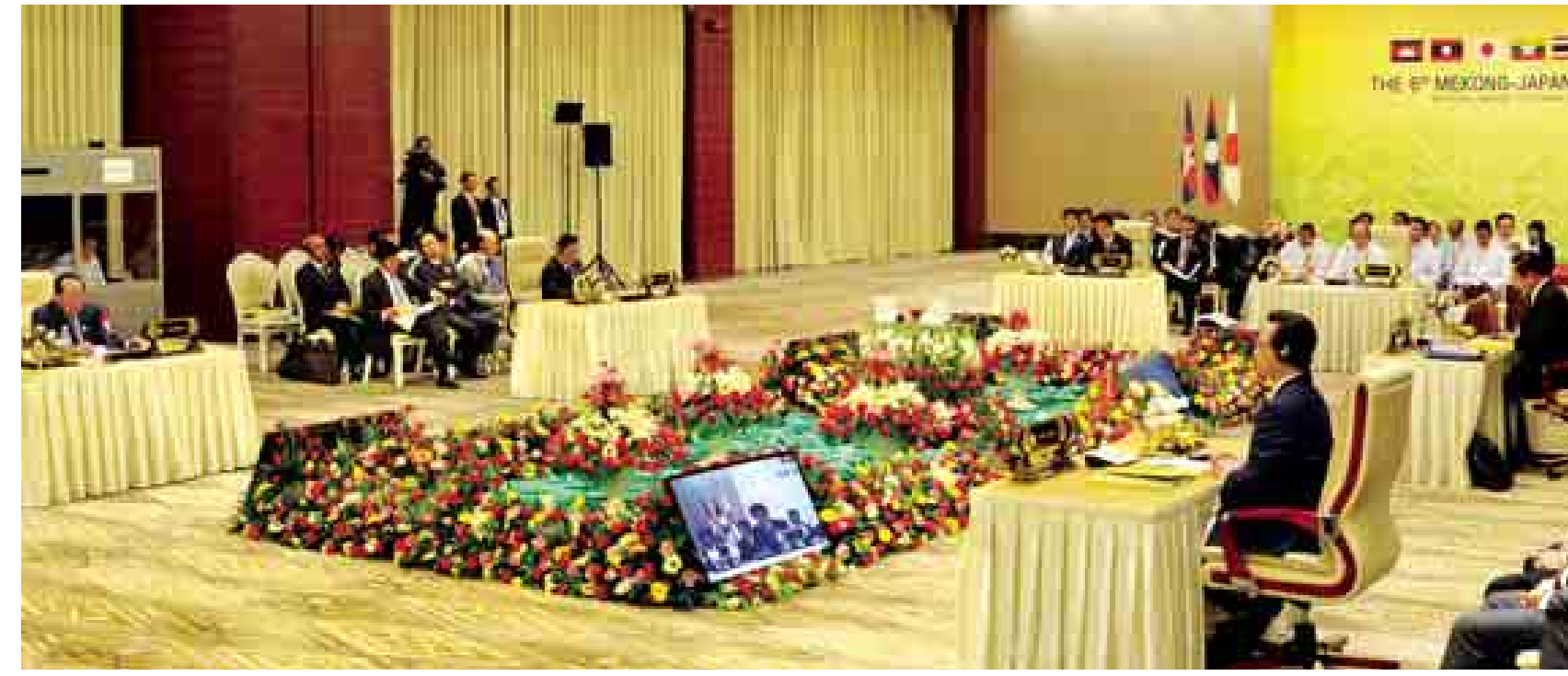
နိုဝင်ဘာ ၁၂ ရက်က (၆)ကြိမ်မြောက် မဲခေါင်-ဂျပန်ထိပ်သီးအစည်းအဝေးကျင်းပစဉ်။ (အပေါ်ပုံ)