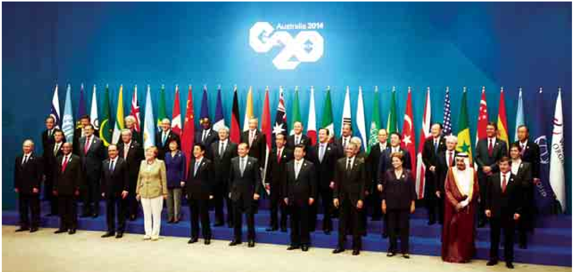
နိုင်ငံတော်သမ္မတ ဦးသိန်းစိန် ဂျီ-၂၀ ထိပ်သီးအစည်းအဝေး တက်ရောက်လာသည့် နိုင်ငံခေါင်းဆောင်များနှင့်အတူ မှတ်တမ်းတင်ဓာတ်ပုံရိုက်စဉ်။