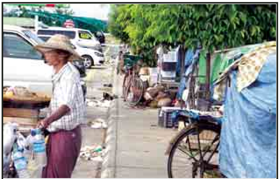
သီးကုန်းယာဉ်ရပ်နားစခန်းအတွင်း ပျံကျဈေးသည်များ စည်းကမ်းမဲ့စွာ ဈေးရောင်းချနေစဉ်။