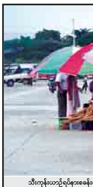
သီးကုန်းယာဉ်ရပ်နားစခန်းအတွင်း ပျံကျဈေးသည်များ စည်းကမ်းမဲ့စွာ ဈေးရောင်းချနေစဉ်။

တွေရဲ့ လုံခြုံရေးနဲ့ ယာဉ်ရပ်နားစခန်းရဲ့ သန့်ရှင်းမှုကို အများကြီး ထိခိုက်လာပါတယ်။ ဒါ့အပြင်