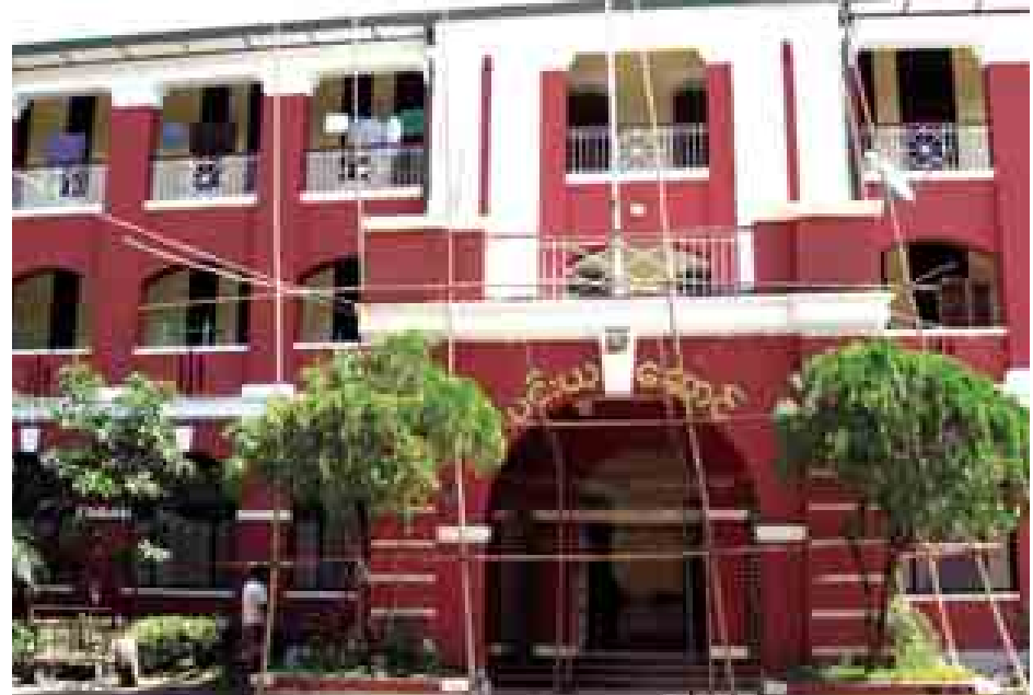
ရန်ကုန်တက္ကသိုလ်နယ်မြေရှိ အဆောင်များ ပြုပြင်မွမ်းမံနေသည်ကို တွေ့ရစဉ်။

ကို မြင်တွေ့ခဲ့ရသလို မနက်ဖြန် တည်းဟူသော နောင်နှစ်နောက်နှစ် များတွင်မူကား ပို၍ပို၍သစ်လွင် တောက်ပြောင် နေချင်စဖွယ်ဖြစ် လာတော့မည်မှာ ကေန်မလွဲဟု ယုံကြည်မြင်ယောင် နေမိပါသည်။