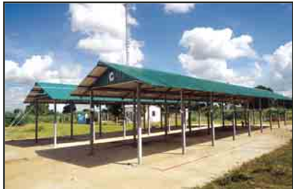
အသစ်ဆောက်လုပ်ပေးထားသော သီးကုန်းယာဉ်ရပ်နားစခန်းမှ ရပ်ကျေးဈေးဆိုင်ခန်းများ။

အခုလိုဆောင်ရွက်ရာမှာလည်း ကျွန်တော်တို့ ဌာနတစ်ခုတည်း ဆောင်ရွက်လို့မရနိုင်ပါဘူး။ ဒေသဆိုင်ရာ အာဏာပိုင်အဖွဲ့တွေနဲ့ ဒေသပြည်သူတွေရဲ့ ပူးပေါင်းဆောင်ရွက်မှုက အများကြီးအရေးကြီးပါတယ်။ နိုင်ငံတကာမှာလည်း အမြန်လမ်းမကြီးတွေပေါ်မှာ ယာဉ်ရပ်နားစခန်းတွေရှိပါတယ်။ အဲဒီစခန်းတွေမှာလည်း အခုလိုပဲ ဈေးဆိုင်ကြီးငယ်မျိုးစုံ ရှိပါတယ်။ သူတို့ နိုင်ငံတွေမှာတော့ အခွန်အခပေး ဆောင်ပြီးတော့ ရောင်းချတာဖြစ်ပါတယ်။ ကျွန်တော်တို့ အခု တည်ဆောက်ပေးတဲ့ ရပ်ကျေးဈေးက အခွန်အခပေးစရာ လုံးဝမလိုတဲ့ အပြင် မည်သူမဆို လာရောက်ရောင်းချနိုင်ပါတယ်။