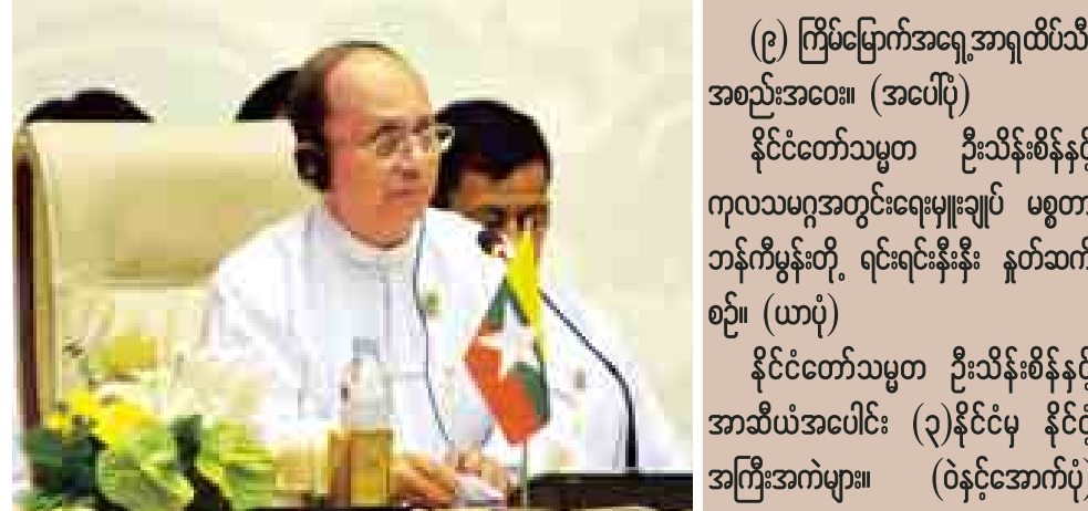
(၉) ကြိမ်မြောက်အရှေ့အာရှထိပ်သီး အစည်းအဝေး။ (အပေါ်ပုံ) နိုင်ငံတော်သမ္မတ ဦးသိန်းစိန်နှင့် ကုလသမဂ္ဂအတွင်းရေးမှူးချုပ် မစ္စတာ ဘန်ကီမွန်းတို့ ရင်းရင်းနှီးနှီး နှုတ်ဆက် စဉ်။ (ယာပုံ) နိုင်ငံတော်သမ္မတ ဦးသိန်းစိန်နှင့် အာဆီယံအပေါင်း (၃)နိုင်ငံမှ နိုင်ငံ့ အကြီးအကဲများ။ (ဝဲနှင့်အောက်ပုံ)