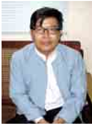
ဒုတိယပါမောက္ခချုပ် ဒေါက်တာအောင်ကျော်

ရန်ကုန်တက္ကသိုလ်နယ်မြေရှိ အဆောင်များအကြီးစား ပြုပြင်မွမ်းမံလျက်ရှိသည်။ အဆောင်များအကြီးစား ပြုပြင်မွမ်းမံလျက်ရှိသည်။ အဆောင်များအကြီးစား ပြုပြင်မွမ်းမံလျက်ရှိသည်။