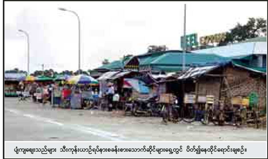
ပျံကျဈေးသည်များ သီးကုန်းယာဉ်ရပ်နားစခန်းစားသောက်ဆိုင်များရှေ့တွင် ပိတ်၍နေထိုင်ရောင်းချစဉ်။

ဒီလိုအခြေအနေတွေကို ကျွန်တော်တို့ အမြန်လမ်းအဖွဲ့အနေနဲ့ လေ့လာတွေ့ရှိသလို လမ်းအသုံးပြုသူ ခရီးသွားပြည်သူတွေရဲ့ အမြန်လမ်းအသုံးပြုမှုအပေါ် အကြံပြုချက်တွေမှာလည်း တွေ့ရပါတယ်။ ဒါကြောင့် ခရီးသွားပြည်သူတွေလည်း စိတ်အေးချမ်းလုံခြုံစွာနဲ့ ယာဉ်ရပ်နားစခန်းကို အသုံးပြုနိုင်သလို စခန်းပတ်ဝန်းကျင် ကျေးရွာတွေက ဒေသပြည်သူများအနေနဲ့ ဒေသထွက်ကုန်တွေနဲ့ မုန့်ပဲသရေစာ