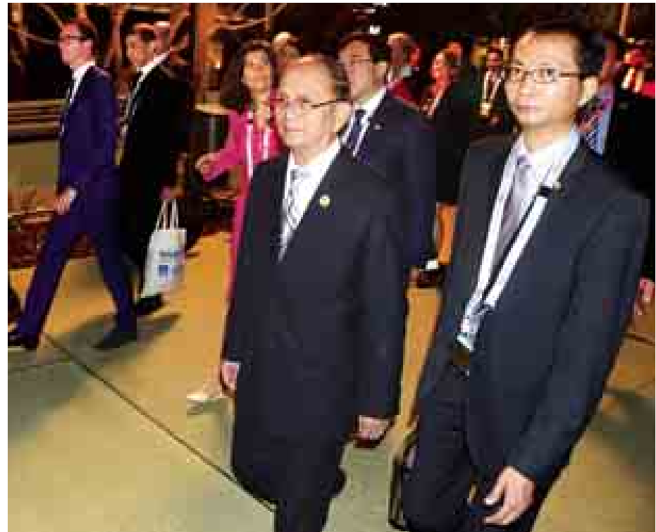
နိုင်ငံတော်သမ္မတ ဦးသိန်းစိန် ဂျီ-၂၀ ထိပ်သီးအစည်းအဝေးသို့ တက်ရောက်လာကြသည့် ခေါင်းဆောင်များ၏ အလုပ်သဘော ညစာစားပွဲသို့တက်ရောက်ရန် ရောက်ရှိလာစဉ်။ (သတင်းစဉ်)

ယင်းနောက်နိုင်ငံတော် သမ္မတသည် ဘရစ္စတိန်းကွန်ပင်းရှင်းစင်တာ (BCEC) မှ Gallery of Modern Art သို့ ရောက်ရှိပြီး ဂျီ-၂၀ ထိပ်သီးအစည်းအဝေး ညှိနှိုင်း အခမ်းအနားသို့ တက်ရောက်သည်။ ညှိနှိုင်းတွင် နိုင်ငံတော်သမ္မတသည် ဂျီ-၂၀ ထိပ်သီးအစည်းအဝေး သို့ တက်ရောက်လာကြသည့် ခေါင်းဆောင်များ၏ အလုပ်သဘော ညစာစားပွဲသို့တက်ရောက်ခဲ့ပြီး ယဉ်ကျေးမှု ဖျော်ဖြေပွဲသို့ ဆက်လက် တက်ရောက်ခဲ့သည်။