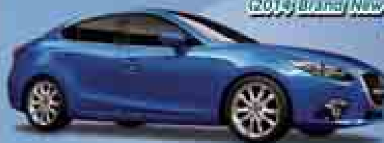
MAZDA 3 (2014 Brand/New Car) ချီးမြှင့်ပါမည်။