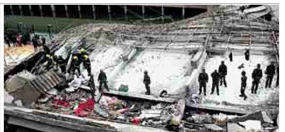
တရုတ်နိုင်ငံတောင်ပိုင်း ကွမ်တုံပြည်နယ်၌ ဆောက်လုပ်ရေးလုပ်ငန်းခွင်အတွင်း ခြောက်ထပ်တိုက်တစ်လုံး ဖြိုကျမှုဖြစ်ပွားခဲ့ရာ နှစ်ဦးသေဆုံးပြီး အခြားခုနစ်ဦး ဒဏ်ရာရရှိခဲ့ကြောင်း သိရသည်။ (ဆင်ဟွာ)

အင်ဒိုနီးရှားလျှင်လှုပ်ပြီးနောက် ဆူနာမီသတိပေးချက်ထုတ်ပြန် အင်ဒိုနီးရှားနိုင်ငံသည် ပစ်ဖိတ်မီးတောင်ရပ်ဝန်း နယ်မြေအတွင်း တည်ရှိနေရာ ငလျင်လှုပ်ခတ်မှုကြောင့် ခဏဖြစ်ပွားခဲ့သည်။ ၂၀၁၄ ခုနှစ်က Boxing Day ၌ အင်ဒိုနီးရှားအများစုနေထိုင်သော ဘန်ဒါအာချေးကမ်းလွန်တွင် အင်အား ၉ ဒေသ ၁ ရစ်ချ်တာစကေးအဆင့်ရှိ ငလျင်သည် ဆူနာမီအဖြစ်သို့ ကြီးထွားလာပြီး လူပေါင်း ၂၃၀၀၀၀ ကျော် သေဆုံးခဲ့ရသည်။ (ဘီဘီစီ)