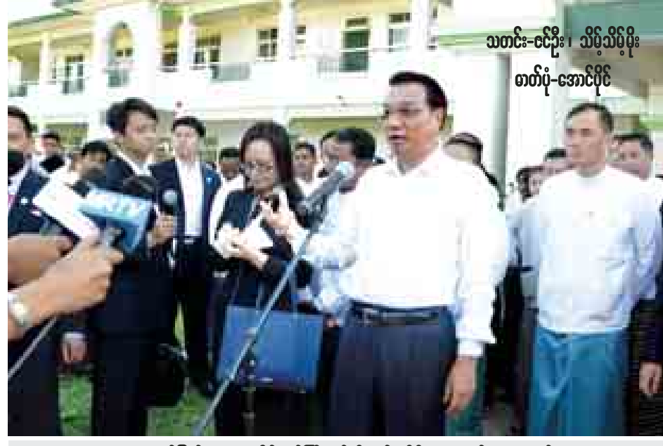
တရုတ်ပြည်သူ့သမ္မတနိုင်ငံဝန်ကြီးချုပ်လီခချန်း မီဒီယာများနှင့် တွေ့ဆုံစဉ်။

တရုတ်-မြန်မာ နှစ်နိုင်ငံ ဆွေမျိုး ပေါက်ဖော်ချစ်ကြည်ရေးအတွက် မြန်မာနိုင်ငံမှ ကျောင်းသားများကို ပညာတော်သင် အရေအတွက် ပိုမိုလက်ခံသွားမည်ဖြစ်ပြီး ၂၀၁၅ ခုနှစ်တွင် ပညာတော်သင် ၁၀၀ ခန့် လက်ခံသွားမည်ဖြစ်ကြောင်း သိရ သည်။ “ခု ဒီကျောင်းမှာလည်း ကျောင်းသား ကျောင်းသူတွေကို ဒီ သတင်းကောင်းကိုလည်း ပြောလိုက် ပါတယ်။ နောက်ပြီး သူတို့က တရုတ် ပြည်ကို လာဖို့လည်း အားလုံးဆန္ဒ ရှိကြတယ်”ဟု ဝန်ကြီးချုပ်က ပြော ကြားသည်။