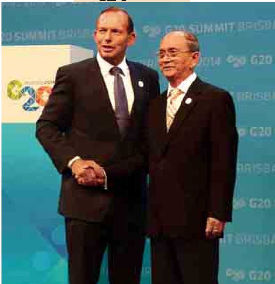
နိုင်ငံတော်သမ္မတဦးသိန်းစိန်အား ဩစတြေးလျနိုင်ငံဝန်ကြီးချုပ် မစ္စတာ တိုနီအဘော့တ်က ရင်းရင်းနှီးနှီး ကြိုဆိုနှုတ်ဆက်စဉ်။

၂၀၁၄ ခုနှစ် အာဆီယံအလှည့်ကျဥက္ကဋ္ဌ သိသာစွာတိုးတက်လာခဲ့ကြောင်း၊ ထို့ကြောင့် မြန်မာနိုင်ငံက ၂၀၁၄ ခုနှစ် အာဆီယံအလှည့်ကျဥက္ကဋ္ဌ