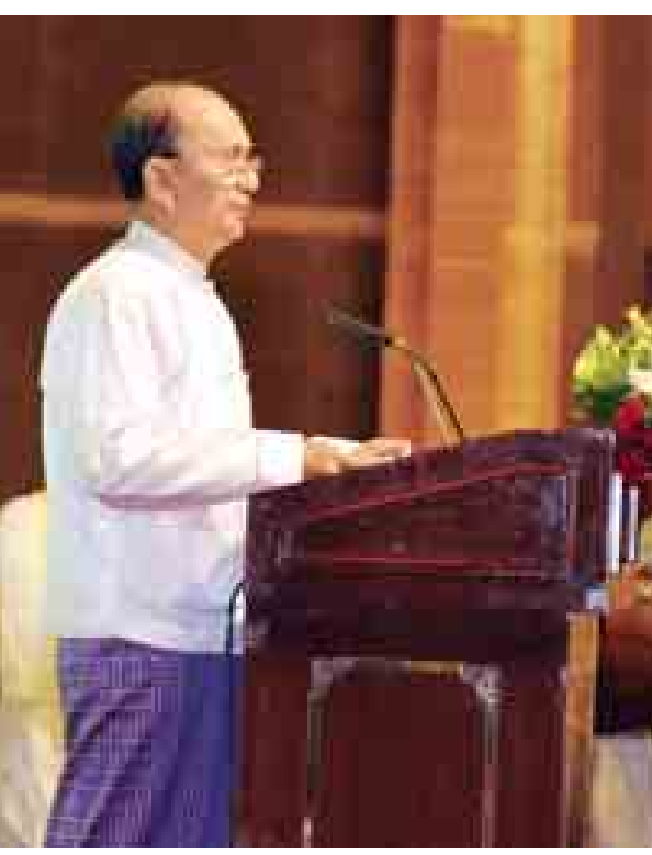
နိုင်ငံတော်သမ္မတ ဦးသိန်းစိန် (၂၅)ကြိမ်မြောက်အာဆီယံထိပ်သီးအစည်း အဝေးဖွင့်ပွဲတွင် အမှာစကားပြောကြားစဉ်။

အာဆီယံအနေဖြင့် ယခုနှစ် အတွင်းတွင် အဓိကကျသော လုပ်ငန်းနှစ်ရပ်ကို စတင်နိုင်ခဲ့ပါ ကြောင်း၊ အဆိုပါလုပ်ငန်းများမှာ အာဆီယံ အဖွဲ့အစည်းများကို အာဆီယံပဋိညာဉ်စာတမ်းနှင့်အညီ မည်သို့ ပိုမိုထိရောက်ခိုင်မာအောင်