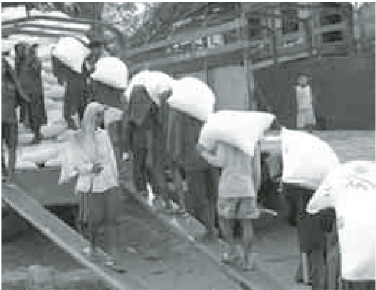
ဧရာဝတီတိုင်းဒေသကြီး မြောင်းမြမြို့နယ်အတွင်း ဆန်သိုလှောင်ရုံသို့ ကြော်ငြာပြီးဆန်များ တင်ပို့စဉ်။

လည်း ကုန်သည်အချို့၏ ဆန်အရည်အသွေးထိန်းချုပ်မှုအားနည်းချက်ကြောင့် ဈေးကွက်ထိခိုက်မည်ကို စိုးရိမ်နေကြကြောင်း သိရသည်။