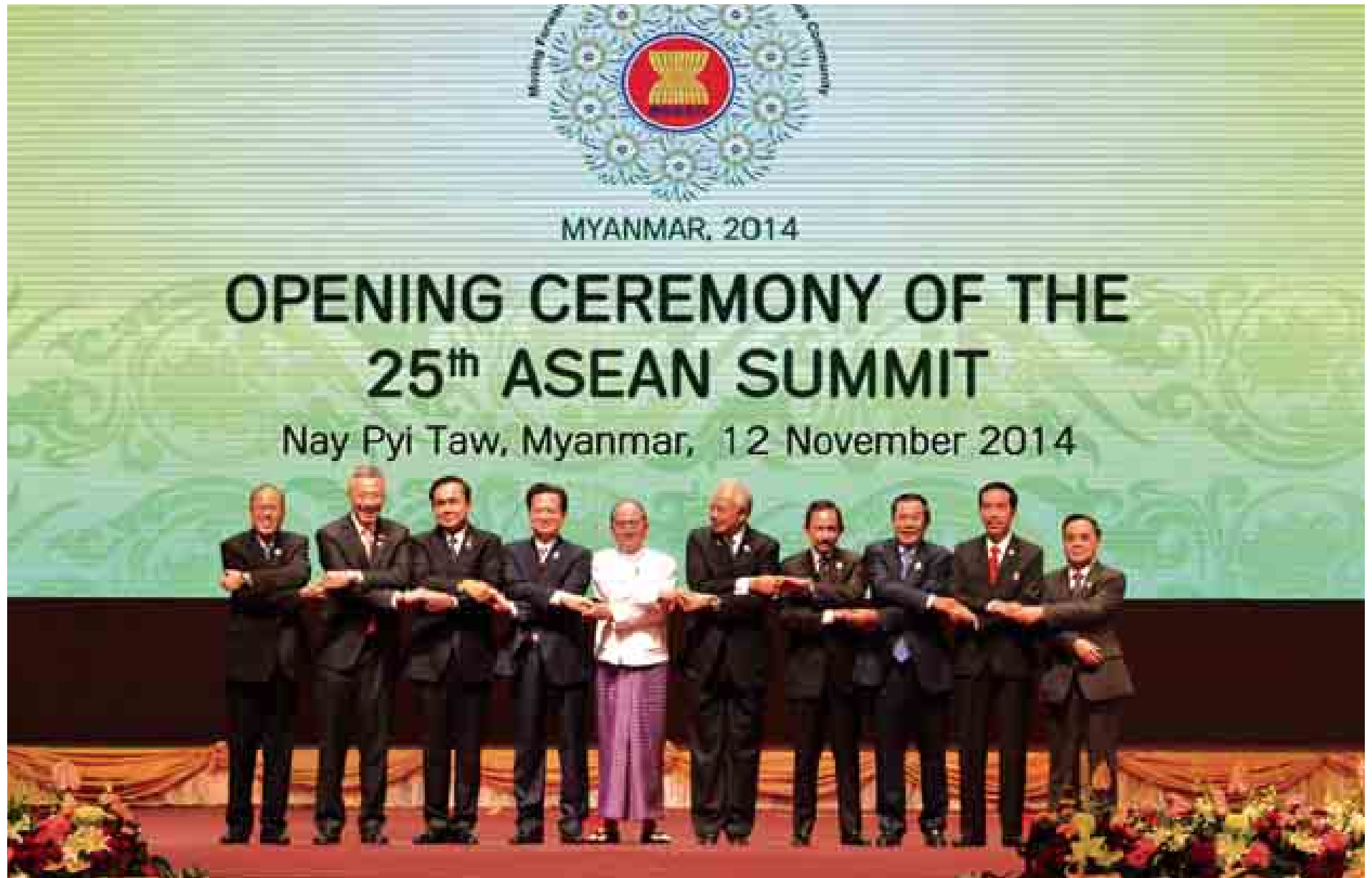
နိုင်ငံတော်သမ္မတ ဦးသိန်းစိန် အာဆီယံနိုင်ငံများမှ နိုင်ငံခေါင်းဆောင်များနှင့် (၂၅)ကြိမ်မြောက် အာဆီယံထိပ်သီးအစည်းအဝေးဖွင့်ပွဲအခမ်းအနားတွင် မှတ်တမ်းဓာတ်ပုံရိုက်စဉ်။

နေပြည်တော် နိုဝင်ဘာ ၁၂ (၂၅)ကြိမ်မြောက် အာဆီယံထိပ်သီးအစည်းအဝေးဖွင့်ပွဲအခမ်းအနားကို ယနေ့နံနက် ၉ နာရီတွင် နေပြည်တော်ရှိ မြန်မာအပြည်ပြည်ဆိုင်ရာ ကွန်ဗင်းရှင်း ဗဟိုဌာန၌ကျင်းပရာ နိုင်ငံတော်သမ္မတ ဦးသိန်းစိန် တက်ရောက်၍ မိန့်ခွန်းပြောကြားသည်။ ရှေးဦးစွာ အာဆီယံနိုင်ငံများမှ နိုင်ငံခေါင်းဆောင်များနှင့် အစိုးရအဖွဲ့အကြီးအကဲများသည် မြန်မာအပြည်ပြည်ဆိုင်ရာ ကွန်ဗင်းရှင်းဗဟိုဌာနသို့ ရောက်ရှိလာရာ နိုင်ငံတော်သမ္မတ ဦးသိန်းစိန်နှင့်ဇနီး ဒေါ်ခင်ခင်ဝင်းတို့က ကွန်ဗင်းရှင်းဗဟိုဌာန အဝင်မုခ်ဦးမှ ကြိုဆိုနှုတ်ဆက်ကြသည်။ ထို့နောက် ကွန်ဗင်းရှင်းဗဟိုဌာန ပထမထပ်ရှိ ကျောက်စိမ်းခန်းမ၌