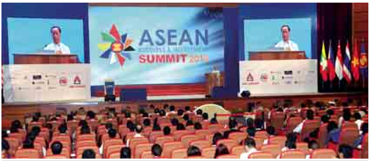
ဒုတိယသမ္မတ ဒေါက်တာစိုင်းမောက်ခမ်း (၁၁)ကြိမ်မြောက် အာဆီယံစီးပွားရေးနှင့် ရင်းနှီးမြှုပ်နှံမှုဆိုင်ရာ ထိပ်သီးအစည်းအဝေးတွင် အမှာစကား ပြောကြားစဉ်။ (သတင်းစဉ်)

လူမှုရေး ပြောင်းလဲမှုများအတွက် အာဆီယံဒေသတွင်းအမျိုးသမီးများ ၏အခန်းကဏ္ဍ၊ အာဆီယံဒေသတွင်း နယ်ပယ်၊ Nikkei Asia Review ၏ဘဏ္ဍာရေးပါဝင်မှု အခွင့်အလမ်း များမှတစ်ဆင့်ဖွံ့ဖြိုးခြင်း ပြန်လည် ဆန်းသစ်မှု၊ အနာဂတ်အာဆီယံ၏ ဖွံ့ဖြိုးတိုးတက်မှုဗဟိုဌာနများ ကမ္ဘာ့ ဒီဇိုင်း၊ လာအို၊ မြန်မာနိုင်ငံတို့၏ မူဝါဒပိုင်းဆိုင်ရာ စိန်ခေါ်မှုများ စသည့်အကြောင်းအရာများကို ပြည် တွင်းပြည်ပမှပညာရှင်များ၊ စီးပွားရေး လုပ်ငန်းရှင်များက ကဏ္ဍအလိုက် ဆွေးနွေးခဲ့ကြပြီး တက်ရောက်လာကြ သူများ၏ မေးမြန်းချက်များကို သက်ဆိုင်ရာ တာဝန်ရှိသူများက ပြန်လည်ရှင်းလင်း ဖြေကြားကြ သည်။ (သတင်းစဉ်)