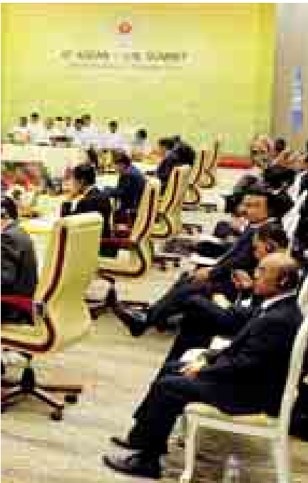
ဒေါ် ခြိမ်း ဆောင်ရွက်မှု ခိုင်မာစေရေးစသည့် ဘေးကို ဖြေရှင်း ကိစ္စရပ်များကိုလည်းဆွေးနွေး ခဲ့ကြ သည့်။ (သတင်းစဉ်)