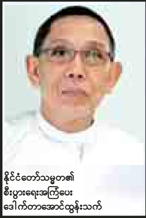
နိုင်ငံတော်သမ္မတ၏ စီးပွားရေးအကြံပေး ဒေါက်တာအောင်ထွန်းသက်

“အမျိုးသမီး စီးပွားရေးလုပ်ငန်းရှင်တွေအတွက် ရော၊ စာမျက်နှာ ၃ သို့