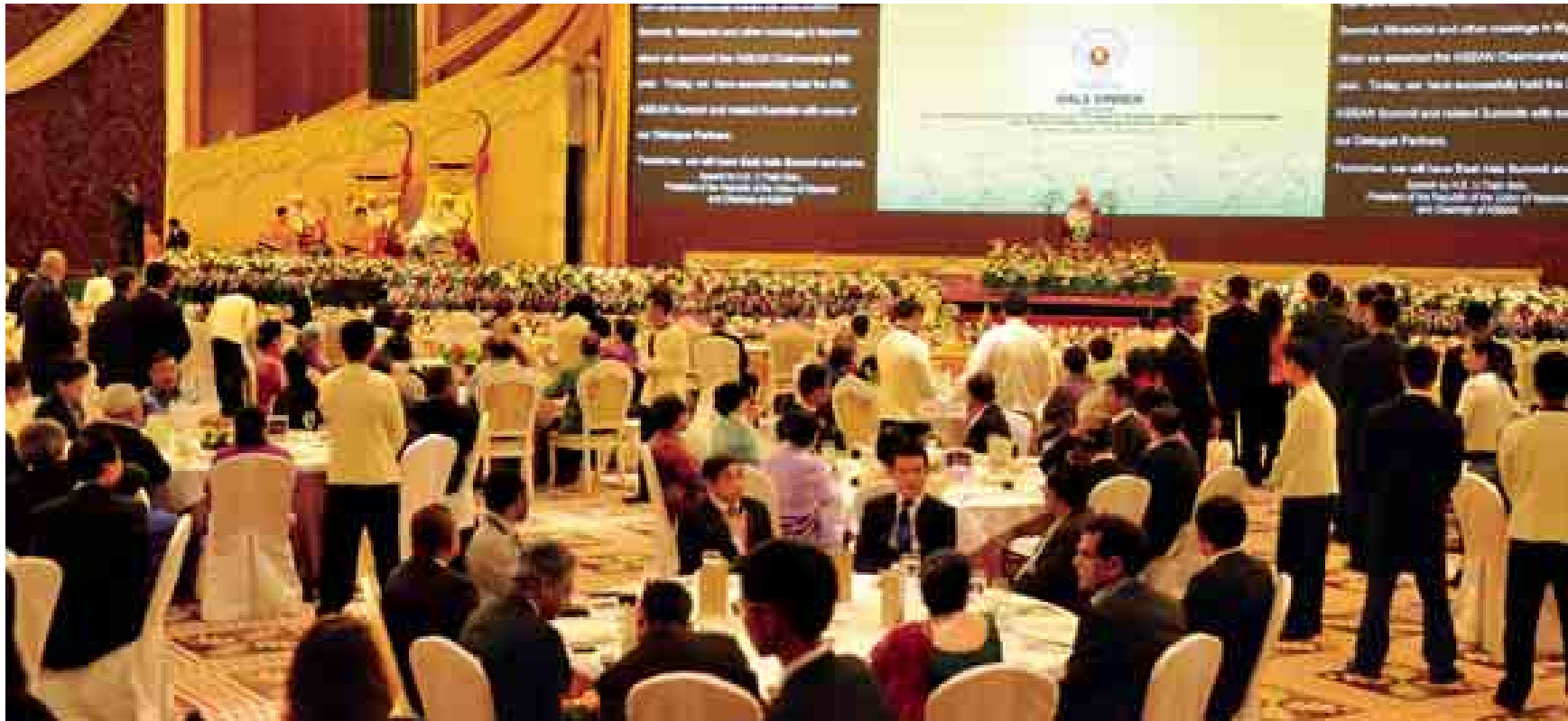
အာဆီယံ ဥက္ကဋ္ဌ နိုင်ငံတော် သမ္မတ ဦးသိန်းစိန် ဂုဏ်ပြု ညစာစားပွဲတွင် ကြိုဆိုနှုတ်ခွန်း ဆက်စကားပြော ကြားစဉ်။ (သတင်းစဉ်)