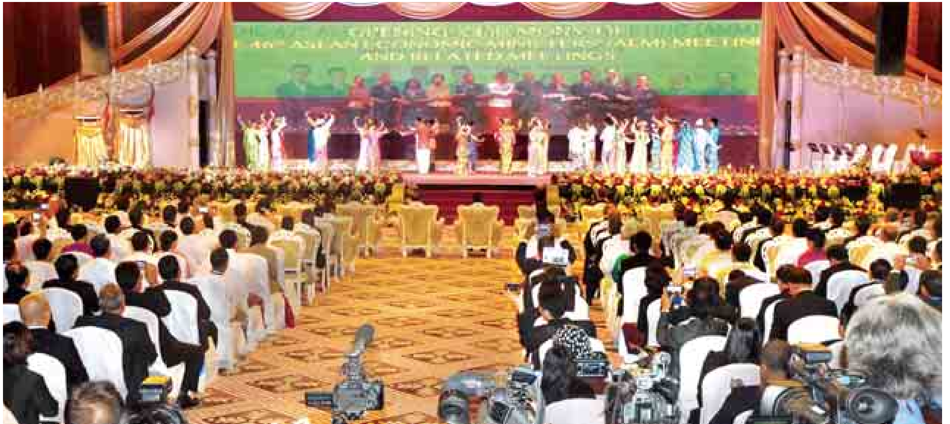
(၂၅)ကြိမ်မြောက် အာဆီယံထိပ်သီးအစည်းအဝေးဖွင့်ပွဲအခမ်းအနားကို နိုဝင်ဘာ ၁၂ ရက်တွင် နေပြည်တော်ရှိ မြန်မာအပြည်ပြည်ဆိုင်ရာကွန်ဗင်းရှင်းဗဟိုဌာန၌ ကျင်းပရာ အာဆီယံဂုဏ်ပြုတေးသီချင်းဖြင့် ကပြဖျော်ဖြေတင်ဆက်ကြစဉ်။ (သတင်းစဉ်)