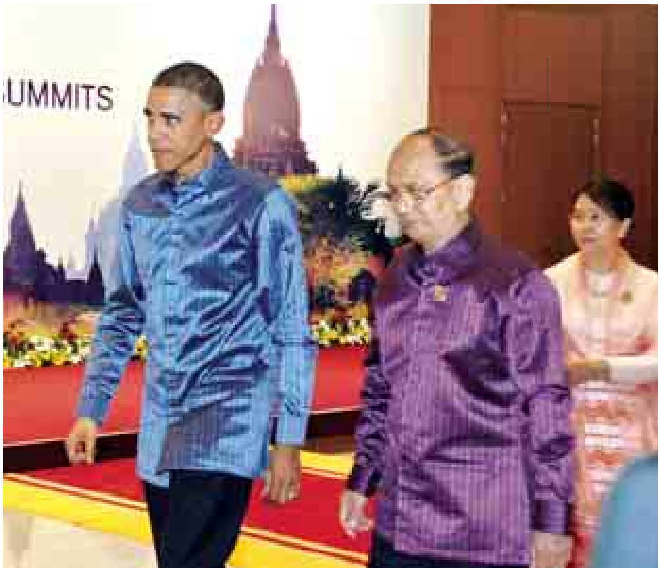
နိုင်ငံတော်သမ္မတ ဦးသိန်းစိန်နှင့်ဇနီး ဒေါ်ခင်ခင်ဝင်းတို့ တည်ခင်းညှိနှိုင်းသော ဂုဏ်ပြုညစာစားပွဲသို့ အမေရိကန် ပြည်ထောင်စုသမ္မတ ဘားရက် အိုဘားမား တက်ရောက်လာစဉ်။ (သတင်းစဉ်)

အာရှနိုင်ငံများမှ နိုင်ငံခေါင်းဆောင်များ၊ အစိုးရအဖွဲ့အကြီးအကဲများနှင့် ညစာကို အတူတကွသုံးဆောင်ကြသည်။ ညစာမသုံးဆောင်မီနှင့် သုံးဆောင်နေစဉ်အတွင်း ယဉ်ကျေးမှုဝန်ကြီးဌာနမှ အနုပညာရှင်များက ရိုးရာယဉ်ကျေးမှု အဆိုအကများ၊ အာဆီယံနိုင်ငံများ၏ ယဉ်ကျေးမှု သရုပ်ဖော်အကများဖြင့် သီဆိုဖျော်ဖြေ တင်ဆက်ကြသည်။ (သတင်းစဉ်)