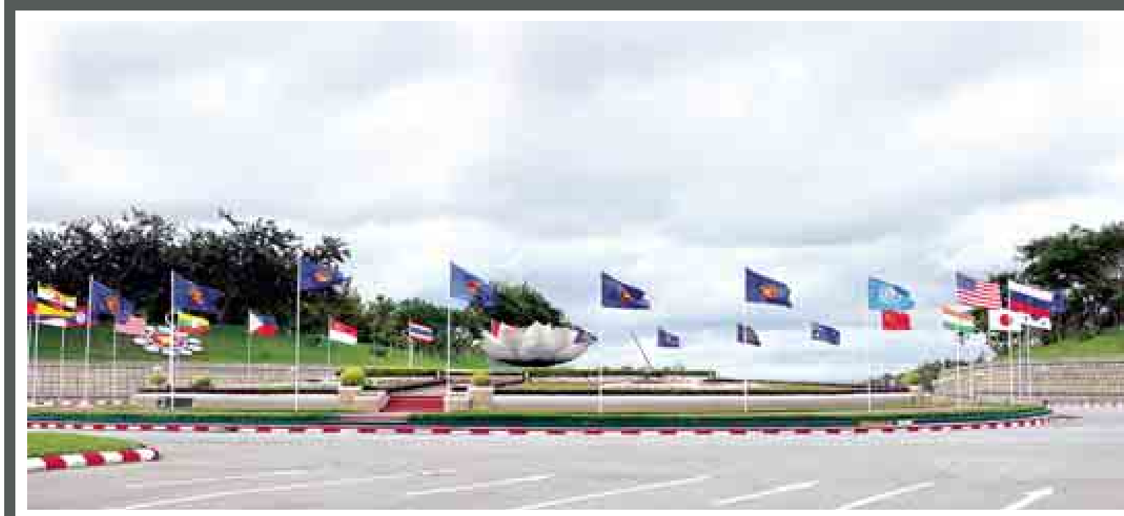
(၂၅) ကြိမ်မြောက် အာဆီယံ ထိပ်သီးအစည်းအဝေးနှင့် ဆက်စပ်အစည်းအဝေးများကို နေပြည်တော်၌ ကျင်းပလျက်ရှိရာ ရာဇဓာန်ဟလမ်းမပေါ်ရှိ ကြာပန်းအဝိုင်း၌ အစည်းအဝေး အထိမ်းအမှတ် လှုံ့ဆော်ရေး အလံများစိုက်ထူထားသည်ကို တွေ့ရစဉ်။

စီးပွားရေးပူးပေါင်းဆောင်ရွက်မှု သဘောတူညီချက်တို့အတွက် ခေါင်းဆောင်များက ထောက်ခံထားပြီး အာဆီယံအသိုက်အဝန်းနှင့်ပို၍ နက်ရှိုင်းသည့် ဒေသတွင်းစီးပွားရေးပူးပေါင်းဆောင်ရွက်မှုအတွက် အထောက်အပံ့ပြုမည်ဖြစ်သည်။ (RCEP)၏ ကုန်ထွက်စုပေါင်းသည် ၂၀၁၃ ခုနှစ်တွင် အမေရိကန်ဒေါ်လာ ၂၁ ဒသမ ၃ ထရီလီယံရှိခဲ့ပြီး ကမ္ဘာ့ကုန်ထွက်၏ ၃၀ ရာခိုင်နှုန်းခန့်ဖြစ်သည်။ (RCEP) အတွင်း ကုန်သွယ်ရေးနှင့် ရင်းနှီးမြှုပ်နှံမှုတွင် အားကောင်းလျက်ရှိသည်။ စာမျက်နှာ ၂ သို့