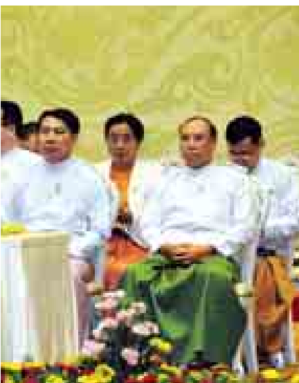
ဦးသိန်းစိန် (၂၅)ကြိမ်မြောက်အာဆီယံထိပ်သီး မျက်နှာ သဘာပတ်အဖြစ်ဆောင်ရွက်စဉ်။ (သတင်းစဉ်)

ချက်မှုများနှင့် ရုတ်ပင်လယ်အရေကိစ္စ၊ ဆီးရီးယား ရောဂါများကို နှင့် အီရတ်နိုင်ငံများမှ အစွန်းရောက်၊ သားချင်းစာနာ အကြမ်းဖက်မှုများ၏ ခြိမ်းခြောက် များ စသည့် မှုများနှင့် အီဘိုးလာဇိုင်းရပ်စ် ရောဂါ ခွင်းနှင့် နိုင်ငံ ဖြန့်ပွားမှုများနှင့်စပ်လျဉ်း၍ လည်း င်းဆောင်ရွက် အမြင်ချင်း ဖလှယ်ခဲ့ကြကြောင်း နှင့် နိုင်ငံတကာ သတင်းရရှိသည်။ (သတင်းစဉ်)