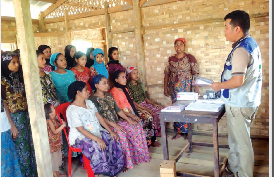
ရခိုင်ပြည်နယ် စစ်တွေမြို့နယ် အနောက်စံပြကျေးရွာ(ဘာဆာရာ)တွင် ဖွင့်လှစ်ထားသည့် ဘင်္ဂါလီကယ်ဆယ်ရေး စခန်းတွင် ကိုယ်ဝန်ဆောင်မိခင်များအား ကျန်းမာရေးဦးစီးဌာနမှ ဆရာဝန်က အသိပညာပေး ဟောပြောစဉ်။ ဓာတ်ပုံ-ဇေယျာ(မိုင်ရာ)