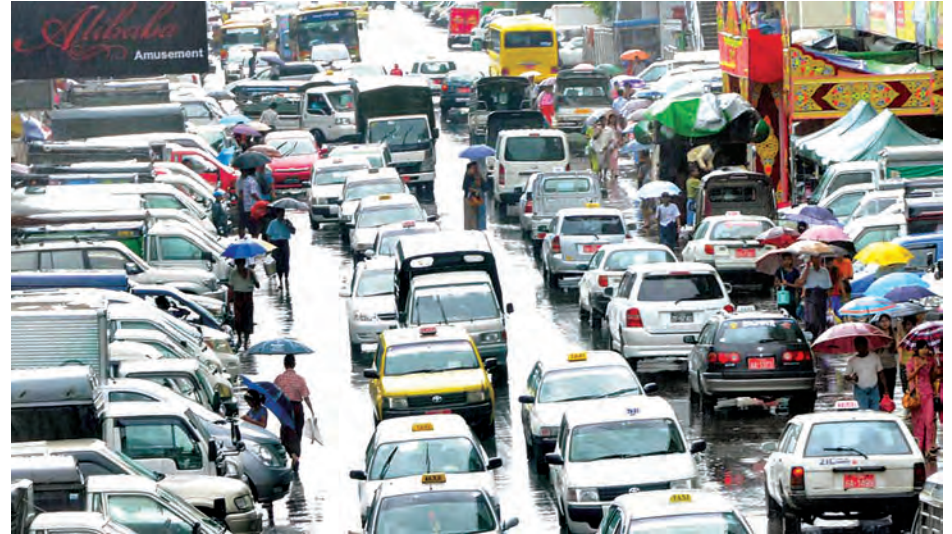
ရန်ကုန်မြို့၌ မြို့ပြဖွံ့ဖြိုးမှုနှင့်အတူ မော်တော်ယာဉ်များ တစ်နေ့တခြားများပြားလာပြီး လမ်းစရိယာကျဉ်းမှုကြောင့် ယာဉ်ကြောကျပ်တည်းနေမှုကို တွေ့ရစဉ်။