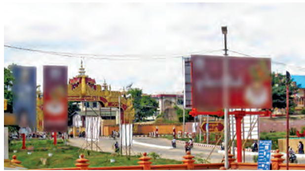
တယ်ကာ မြင်ရသူအပေါင်း စိတ် မချမ်းမြေ့ ဖွယ် မြင်တွေ့နေရပါသည်။ မင်းကြီးညိုရုပ်တုကြီးနှင့် ရင်ပြင် ကြီးကို တောင်ငူမြို့ဗိုလ်မှူးဖိုးကွန်း လမ်း (အောင်နန်းတံခါးယိပ်)တည် ဆောက်ထားသောကြောင့် အနီးရှိ ကျုံးရေပြင်၊ မြို့ရိုးကွန်း၊ ခရစ်ယာန်

ကျွန်း ကန်တော်ကြီးကို ပြန်လည် တူးဖော် ခြင်း၊ မြန်မာ့မူလကဏ္ဍများဖြင့် တည်ဆောက်ထားသော မြို့အဝင် မုခ်ဦး၊ မင်းကြီးညို ရုပ်တုကြီးနှင့် ရင်ပြင်ကြီးကို ငွေကျပ်သိန်းပေါင်း ထောင်ကျော် အကုန်ကျခံ တည် ဆောက်ခဲ့သောကြောင့် တောင်ငူ ကေတုမတီမြို့တော်ကြီးသည် နှစ် ၅၀၀ ပြည့် အထိမ်းအမှတ်တွင် ခမ်းနားထည်ဝါစွာ တည်ရှိခဲ့သည်။