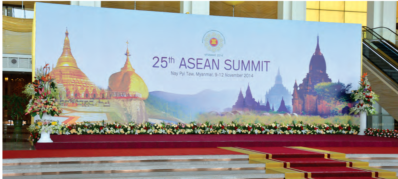
အာဆီယံထိပ်သီးအစည်းအဝေးတက်ရောက်ကြမည့်နိုင်ငံများမှ နိုင်ငံခေါင်းဆောင်များနှင့် အစိုးရအဖွဲ့အကြီးအကဲများအား ကြိုဆိုပွဲတက်စဉ်နေရာ၌ ပြင်ဆင်ထားရှိမှုကို တွေ့ရစဉ်။