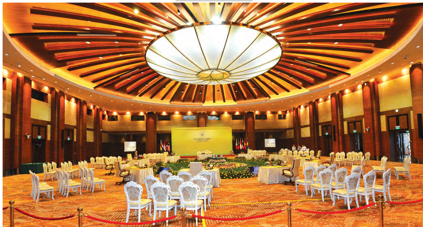
အာဆီယံထိပ်သီးအစည်းအဝေးအတွက် ကြိုတင်ပြင်ဆင်ထားရှိမှုကို ခမ်းနားစွာတွေ့ရစဉ်။