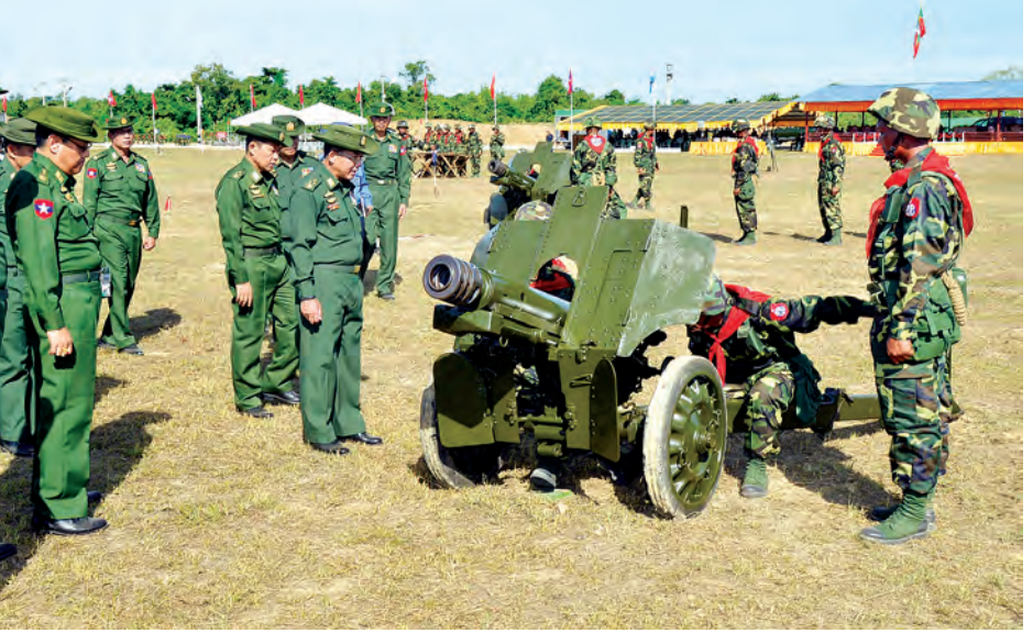
တပ်မတော်ကာကွယ်ရေးဦးစီးချုပ် ဗိုလ်ချုပ်မှူးကြီးမင်းအောင်လှိုင် အမြောက်စွမ်းရည်ပြသမှုအား ကြည့်ရှုစဉ်။ (မြဝတီ)

သာမက တပ်မတော်တည်ဆောက်ရေးတာဝန်ကို တစ်ဖက်တစ်လမ်းအားဖြင့် ဝိုင်းဝန်းထမ်းဆောင်နေခြင်းဖြစ်သည်ဆိုသည်ကို သိရှိနားလည်ထားကြရန် လိုအပ်ကြောင်း။ ယနေ့အချိန်အခါတွင် နိုင်ငံတော်အစိုးရအနေဖြင့် တိုင်းရင်းသားစည်းလုံးညီညွတ်ရေးနှင့် ပြည်တွင်းငြိမ်းချမ်းရေးလုပ်ငန်းများကို အားသွန်ခွန်စိုက် ကြိုးပမ်းဆောင်ရွက်နေခြင်းဖြစ်၍ သင့်လျော်သည့်အချိန်ကာလအတွင်းတွင် ငြိမ်းချမ်းရေးတည်ဆောက်နိုင်တော့မည် ဖြစ်ကြောင်း၊ ထို့ကြောင့် နိုင်ငံတကာ