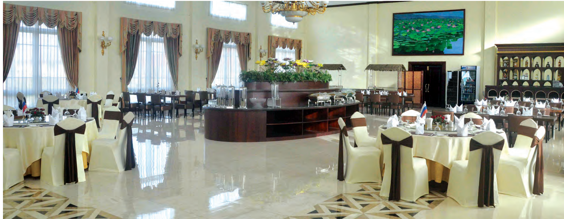
(၂၅)ကြိမ်မြောက် အာဆီယံထိပ်သီးအစည်းအဝေးနှင့် ဆက်စပ်အစည်းအဝေးများသို့ တက်ရောက်လာမည့် နိုင်ငံခေါင်းဆောင်များနှင့်ကိုယ်စားလှယ်များ စိတ်ကြည်နှူးချမ်းမြေ့စွာတည်းခိုနိုင်ရန် ဟိုတယ်တစ်ခု၏ ကြိုတင်ပြင်ဆင်ထားမှု။

တင်ယာဉ် ၃၅ စီးဖြစ်ပါတယ်။ နောက်တစ်ခုကတော့ နေပြည်တော်ခုတင် (၁၀၀၀) ဆေးရုံကြီးမှာ အရေးပေါ် လိုအပ်လို့ပဲဖြစ်ဖြစ်၊ ကျန်းမာရေးစောင့်ရှောက်မှုအတွက် ပြုသလို ရင်ပဲဖြစ်ဖြစ် ဆေးရုံမှာပြင်ဆင်ထားတာရှိပါတယ်။ လူနာရောက်ရောက်ချင်း စာမျက်နှာ ၃ သို့