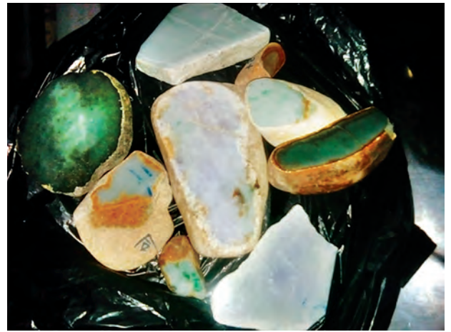
ဆေးရေးအဖွဲ့ထံ လွှဲပြောင်းပေးအပ်ခဲ့ ကြောင်း၊ Mobile Team အဖွဲ့မှ စစ်ဆေးတွေ့ရှိခဲ့သော ကျောက်စိမ်းဟု ယူဆရသည့် အလေးချိန် လေးကီလို ခန့်ရှိ ကျောက်တုံးအပိုင်းအစ ကိုးတုံး ကို နိုဝင်ဘာ ၆ ရက်က လုပ်ထုံးလုပ်နည်းနှင့်အညီ အမှုတွဲ ဖွင့်လှစ်ပြီး အကောက်ခွန်ဦးစီးဌာနသို့ လွှဲပြောင်း ပေးအပ်ခဲ့ကြောင်း သတင်းရရှိသည်။ (သတင်းစဉ်)

ကြွပ်ကြွပ်အိတ်အတွင်းထည့်ပြီး ယူဆောင်လာသည့် ကျောက်စိမ်းဟု ယူဆရသော ကျောက်တုံးအပိုင်းအစ ကိုးတုံး အလေးချိန် လေးကီလိုခန့်ကို ပြသကာ မန္တလေးရှိ မိတ်ဆွေမှ လက်ဆောင်ပေး၍ ယူဆောင်လာကြောင်း ကို Mobile Team နှင့် တာဝန်ရှိ ဌာနဆိုင်ရာ ပူးပေါင်းအဖွဲ့သို့ သယ်ဆောင်ခွင့်ပြုရန် သတင်းပို့ခဲ့ကြောင်း၊ Mobile Team အဖွဲ့မှ ပစ္စည်းပိုင်ရှင် နိုင်ငံခြားသားအား ၎င်းကျောက်စိမ်း များသည် တရားဝင်ဝယ်ယူထားသည့် သတ်မှတ် အထောက်အထားစာရွက် စာတမ်းမပါရှိဘဲ သယ်ဆောင်ခွင့်မရှိ ပါကြောင်း၊ နောင်တွင်လည်း အထောက်အထား စာရွက်စာတမ်း မပါရှိပါက သယ်ဆောင်ခွင့်မရှိ ကြောင်း ရှင်းလင်းအသိပေးတားဆီး ခဲ့ရာ အဆိုပါနိုင်ငံခြားသားမှ လက်ခံ ခဲ့ပြီး ကျောက်စိမ်းတုံးများကို စစ်