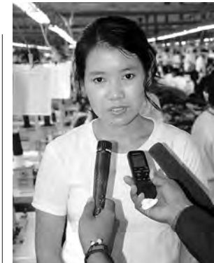
မနင်းသီတာဝေ