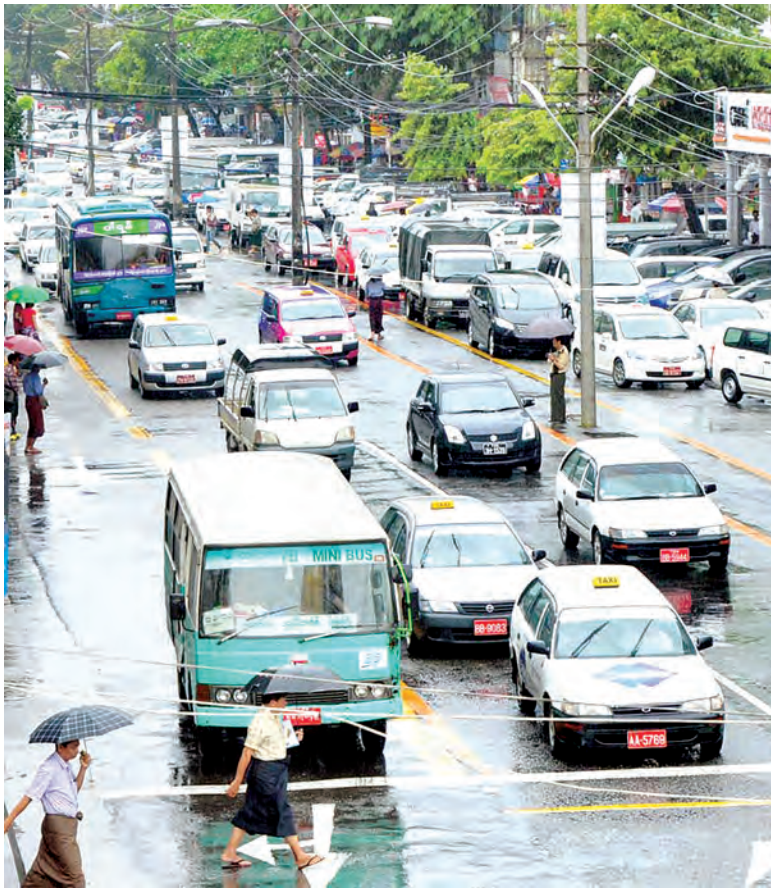
ရန်ကုန်မြို့၌ မော်တော်ယာဉ်များ သတ်မှတ် ယာဉ်ကြောအတိုင်း မောင်းနှင်ရန် စည်းကမ်း ချက်များ ထုတ်ပြန် ထားရာ ခရီးသည် တင်ယာဉ်များ၊ ကိုယ်ပိုင် ယာဉ်များ၊ အငှားယာဉ်များ သတ်မှတ် လမ်းကြောင်း အတိုင်း မောင်းနှင်နေမှုကို တွေ့ရစဉ်။