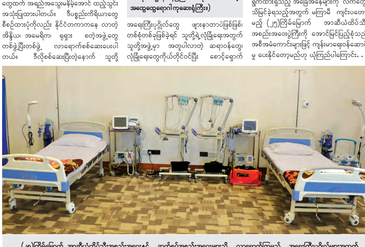
(၂၅)ကြိမ်မြောက် အာဆီယံထိပ်သီးအစည်းအဝေးနှင့် ဆက်စပ်အစည်းအဝေးများသို့ လာရောက်ကြမည့် အရေးကြီးပုဂ္ဂိုလ်များအတွက် ကျန်းမာရေးစောင့်ရှောက်ကုသမှုပြုလုပ်ပေးနိုင်ရန် MICC တွင် ဖွင့်လှစ်ထားသည့်ဆေးခန်း၌ ပြင်ဆင်ထားမှုကိုတွေ့ရစဉ်။

ပေါင်းစည်း အုပ်ချုပ်သည့် အဖွဲ့အစည်း (Supranational Organization) လည်း မဟုတ်ချေ။ အာဆီယံသည် အီးယူကို မိတ္တူကူးမည် တော့ မဟုတ်ပေ။ ဒေသဆိုင်ရာ အသိုက်အဝန်း အချင်းချင်းဖြစ်သည့်အားလျော်စွာ ဆင်တူမှုတော့ရှိမည် ဖြစ်လေသည်။