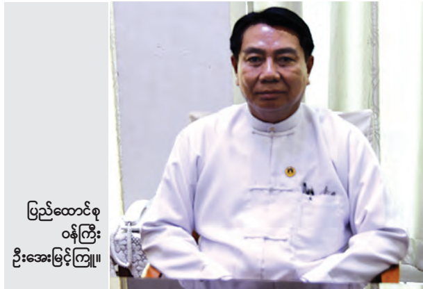
ပြည်ထောင်စု ဝန်ကြီး ဦးအေးမြင့်ကြူ

မှတ်ခိုင်းတာရှိတယ်။ Master Plan ပြီးရင် Management Plan ဆိုပြီး နှစ်နှစ်ပြီးမှ တင်ရမယ်။ ဆိုလိုတာကတော့ ပြည်သူများနဲ့ ဒေသဆိုင်ရာတွေ ပေါ်မှာမူတည် ပါတယ်” ဟု ၎င်းက ဆက်လက်