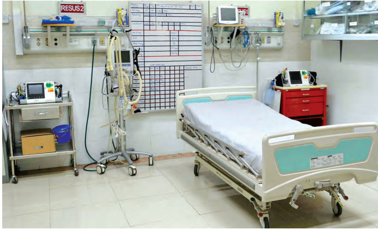
(၂၅)ကြိမ်မြောက် အာဆီယံထိပ်သီးအစည်းအဝေးနှင့် ဆက်စပ်အစည်းအဝေးများသို့ လာရောက်ကြမည့် အရေးကြီးပုဂ္ဂိုလ်များအတွက် ကျန်းမာရေးစောင့်ရှောက်ကုသမှုပြုလုပ်ပေးနိုင်ရန် ဧပြီလအတွင်း ခုတင် (၁၀၀၀) ဆေးရုံအရောက်ပို့ရာတွင် နိုင်ငံတကာဆောင်ရွက်ပေးပေးနိုင်ရန် ပစ္စည်းများဖြင့် ပြင်ဆင်ထားမှုကို တွေ့ရစဉ်။

အာဆီယံသည် အာရှနိုင်ငံများဖြစ်သည့် အာလော်စွာ မိသားစုကို တန်ဖိုးထားသည်။ တစ်ဦးချင်းထက် မိမိတို့အသိုင်းအဝိုင်းကို ဦးစားပေးသည်။ တစ်ဦးစီ၏ ကွဲပြားခြားနားမှုကို လေးစားသည်။ အသိအမှတ်ပြုသည်။ နားလည်သဘောပေါက်သည်။