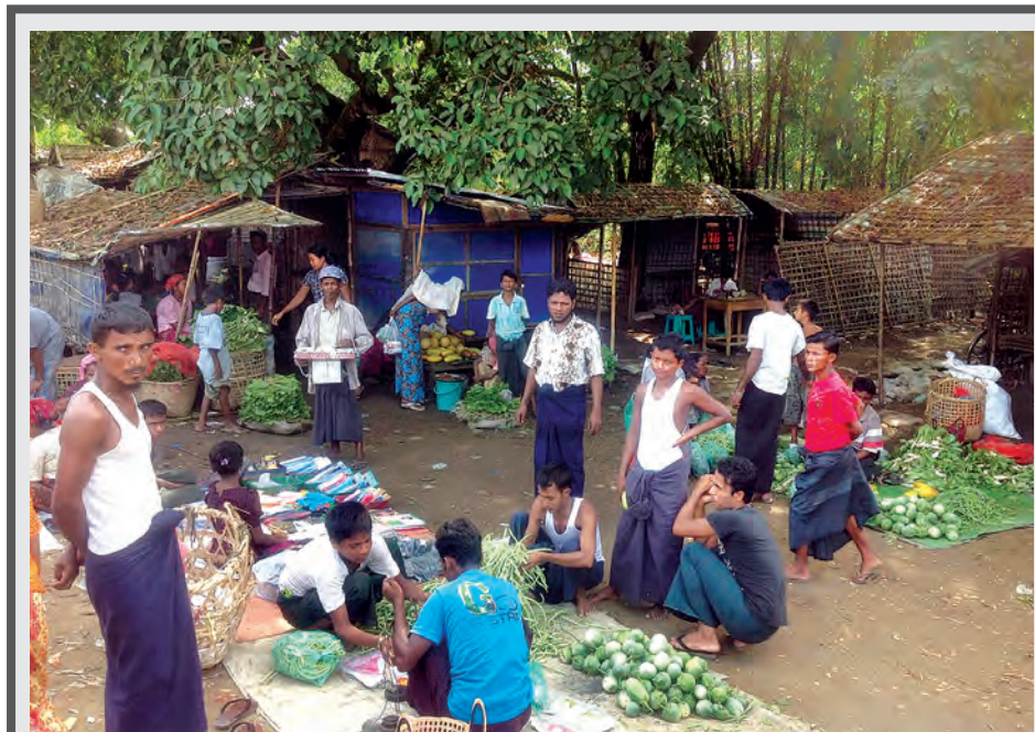
စစ်တွေမြို့ ဘင်္ဂါလီအများစုနေထိုင်ရာ ဒါးပိုင်ရွာ၌ အေးချမ်းတည်ငြိမ်စွာဖြင့် ဈေးရောင်းဝယ်ဖောက်ကားနေ မှုကို တွေ့ရစဉ်။