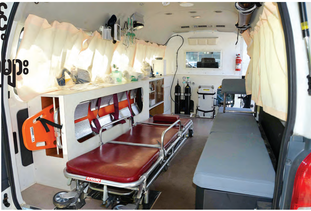
ဆေးဝါးအစုံအလင်ပါသည့် လူနာတင်ယာဉ်(အပေါ်ပုံ)နှင့် ခုတင်(၁၀၀၀) အထူးကြပ်မတ်ကုသဆောင်တွင် ပြင်ဆင်ထားမှုများကို တွေ့ရစဉ်။(အောက်ပုံ)

အောက်ထပ်ကကျန်းမာရေးစောင့်ရှောက်မှုအခန်းမှာလည်း အပေါ် ထပ်မှာလို့ပဲ ပစ္စည်းကိရိယာ အစုံအလင်ပါရှိပြီး သမားတော်တစ်ဦးနဲ့ အရိုး အထူးကုဆရာဝန်၊ သူနာပြုတွေ ထားရှိဆောင်ရွက်သွားမှာဖြစ်ပါတယ်။ ကျန်းမာရေးစောင့်ရှောက်မှုအတွက် MICC (1) မှာ အခန်းတွေဆောင်ရွက် ထားသလိုပဲ ဆေးဝါးတွေအစုံအလင်ပါရှိတဲ့ လူနာတင်ယာဉ် နှစ်စီးကို