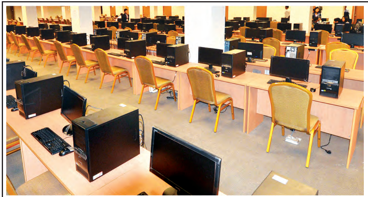
(၂၅)ကြိမ်မြောက် အာဆီယံထိပ်သီးအစည်းအဝေးနှင့် ဆက်စပ်အစည်းအဝေးများကျင်းပမှုကို သတင်းရယူမည့် ပြည်တွင်းပြည်ပ မီဒီယာသမားများ အတွက် ဖွင့်လှစ်ထားသည့် မီဒီယာစင်တာကို တွေ့ရစဉ်။

ခြင်းကြောင့် ဒေသခံပြည်သူများ ဘေးကင်းရာသို့ ရွှေ့ပြောင်းနေထိုင် လျက်ရှိပြီး သက်ဆိုင်ရာ အဖွဲ့ အစည်းများက ကယ်ဆယ်ထောက်ပံ့ ရေးလုပ်ငန်းများကို ဆောင်ရွက် ပေးလျက်ရှိသည်။ အဆိုပါ ဖြစ်စဉ် တွင်လူ တိရစ္ဆာန် သေကြေပျက်စီး မှုမရှိကြောင်း သိရသည်။ (မြန်မာ့ ပြန်/ဆက်)