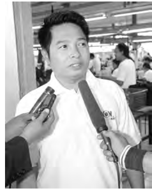
ကိုဇော်ဇော်