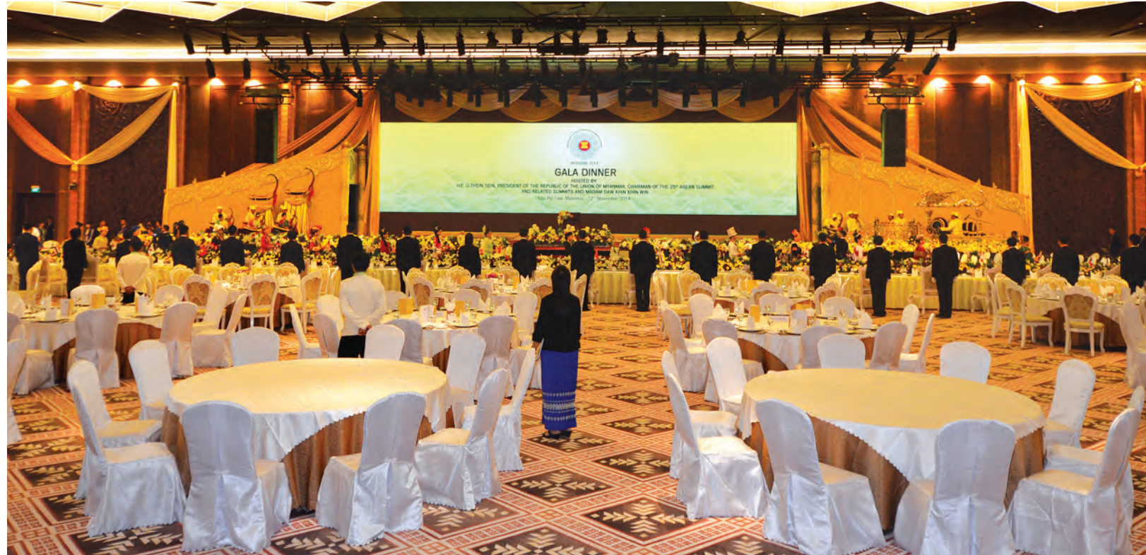
အာဆီယံထိပ်သီးအစည်းအဝေးတက်ရောက်ကြမည့်နိုင်ငံများမှ နိုင်ငံခေါင်းဆောင်များနှင့် အစိုးရအဖွဲ့အကြီးအကဲများအား စည်းခံမည့်ညစာစားပွဲအတွက် ကြိုတင်ပြင်ဆင်ထားရှိမှုကိုတွေ့ရစဉ်။

ကျွန်းမှ သာမန်နိုင်ငံကူးလက်ကိုင်ဆောင်သူများ အတွက် ဗီဇာကင်းလွတ်ခွင့် မူဘောင်စာချုပ်သည် မကြာမီ အသက်ဝင်လာတော့မည်။ အာဆီယံနိုင်ငံသားတို့သည် အာဆီယံတစ်နိုင်ငံမှ တစ်နိုင်ငံ ဗီဇာကင်းလွတ်ခွင့်လွှာသွားလာနိုင်မှု စီမံကိန်းကြောင့် အာဆီယံနိုင်ငံ တစ်နိုင်ငံနှင့် တစ်နိုင်ငံအကြား လမ်းပန်းသွားလာဆက်သွယ်မှုများ ပိုမိုလွယ်ကူ လာမည်။