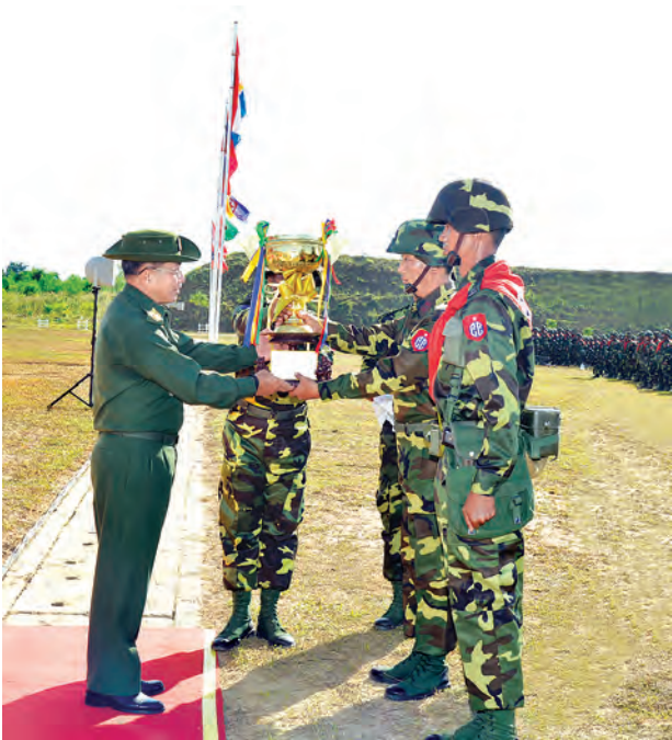
တပ်မတော်ကာကွယ်ရေးဦးစီးချုပ် ဗိုလ်ချုပ်မှူးကြီးမင်းအောင်လှိုင် တံခွန်စိုက်ဆုရရှိသည့် ခြေမြန်တပ်မဌာနချုပ်အား တံခွန်စိုက် ခိုင်းဆုချီးမြှင့်စဉ်။ (မြဝတီ)

ယနေ့ကာလတွင် စက်မှုနှင့် အီလက်ထရွန်နစ် နည်းပညာများ သတင်းဆက်သွယ်ရေး နည်းပညာများ ဖွံ့ဖြိုးတိုးတက်လာမှုနှင့် အတူ စစ်ရေးဆိုင်ရာ အယူအဆ သဘောတရားများသည်လည်း လိုက်ပါတိုးတက်ပြောင်းလဲလာနေပြီဖြစ်ကြောင်း၊ စစ်မှုဆိုင်ရာ အတတ်ပညာများသာမက နိုင်ငံတကာတွင် ဖြစ်ပေါ် တိုးတက်ပြောင်းလဲနေမှုများကိုလည်း စဉ်ဆက်မပြတ်လေ့လာပြီး မိမိနိုင်ငံတော်ကို ဘက်ပေါင်းစုံက ကာကွယ်နိုင်စွမ်းရှိအောင် လေ့ကျင့်ပြင်ဆင်ထားရန် လိုကြောင်းဖြင့် တပ်မတော်ကာကွယ်ရေး ဦးစီးချုပ် ဗိုလ်ချုပ်မှူးကြီး မင်းအောင်လှိုင်က ယနေ့နံနက်ပိုင်း အုတ်တွင်းတပ်နယ် တပ်မတော် တန်းမြင့် လေ့ကျင့်ရေးကျောင်း၌ ကျင်းပပြုလုပ်သော ဗဟိုအဆင့်စစ်ရေးစွမ်းရည် အထောက်အကူပြု Professional Skills ပြိုင်ပွဲ ဆုချီးမြှင့်ပွဲအခမ်းအနားတွင် အမှာစကားပြောကြားရာ၌ ထည့်သွင်းပြောကြားသည်။