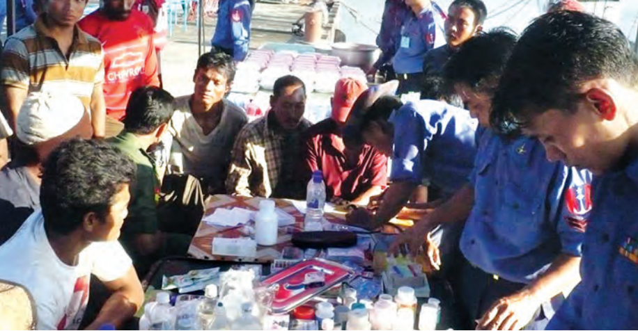
ပင်လယ်ပြင်မျောပါရေလုပ်သားများအား တပ်မတော်(ရေ)က ကျန်းမာရေးအတွက် ဆေးဝါးကုသဆောင်ရွက် ပေးစဉ်။

တတိယအကြိမ် ရှာဖွေကယ် ဆယ်လာသော ပင်လယ်ပြင်မျောပါ