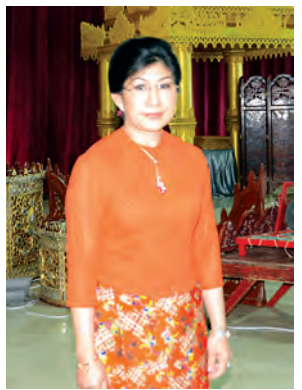
ဒုတိယဝန်ကြီး ဒေါ်စန္ဒာခင်

“ကမ္ဘာ့အမွေအနှစ် စာရင်းဝင်ဖို့ အတွက် မိမိတို့ပြည်သူတွေအပေါ် မှာလည်းအများကြီးမူတည်ပါတယ်။ ပုံရိပ်ပေးသလို ယဉ်ကျေးမှုအမွေအနှစ် အဖြစ် ထိန်းသိမ်းပြီး လူမှုစီးပွား ဘဝဖွံ့ဖြိုးမှုကိုလည်း အထောက် အကူဖြစ်စေချင်တယ်။ ရှဉ့်လည်း လျှောက်သာ ပျားလည်းစွဲသာ ဆို သလိုပါပဲ။ Master Plan ကို အချိန် ခြောက်လပေးပြီး အဆောက် အအုံတွေ မဆောက်လုပ်ဖို့ ယူနက် စကိုက တောင်းဆိုထားပါတယ်။ ဘယ်လို အဆောက်အအုံတွေ လဲလို့ မေးတဲ့အခါ စီးပွားရေးဆိုင်ရာ အဆောက်အအုံတွေ ဖြစ်ပါတယ်။