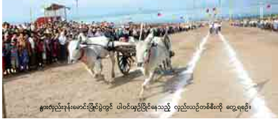
နွားလှည်းဒုန်းမောင်းပြိုင်ပွဲတွင် ပါဝင်ယှဉ်ပြိုင်နေသည့် လှည်းယဉ်တစ်စီးကို တွေ့ရစဉ်။