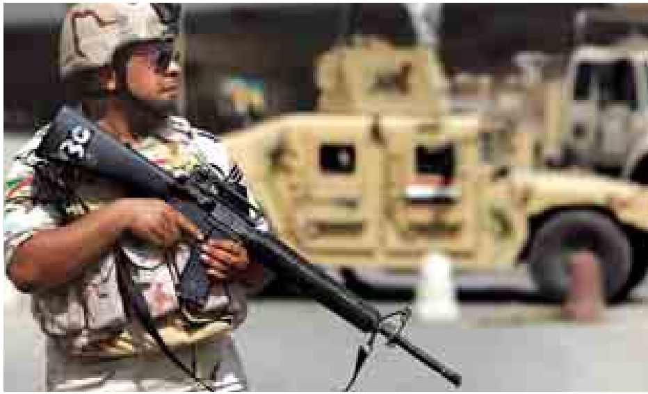
အီရတ်နှင့် ဆီးရီးယားနိုင်ငံတို့၌ ထားသည်။ သို့သော်လည်း ဩဂုတ် ၁၅ သော ညွန့်ပေါင်းတပ်ဖွဲ့က ရာပေါင်း နယ်မြေအများအပြားကို ထိန်းချုပ် လက်တည်းက အမေရိကန်ဦးဆောင် များစွာသော လေကြောင်းတိုက်ခိုက်

ဝါရှင်တန် နိုဝင်ဘာ ၈ အမေရိကန်နိုင်ငံသည် အီရတ် တပ်ဖွဲ့ဝင်များက အိုင်အက်စ်စစ်သွေး ကြွများအား တိုက်ခိုက်ရာတွင် အထောက်အကူဖြစ်စေရန်တိုက်ခိုက် ရေးတပ်ဖွဲ့ဝင်မဟုတ်သောတပ်ဖွဲ့ဝင် ၁၅၀၀ စေလွှတ်သွားမည်ဖြစ်ကြောင်း အိမ်ဖြူတော်က ပြောကြားလိုက် သည်။ အဆိုပါ အမေရိကန်တပ်ဖွဲ့ဝင် များသည် လေ့ကျင့်သင်ကြားရေးနှင့် အီရတ်တပ်ဖွဲ့ဝင်များအားအကူအညီ ပေးရေးအတွက်ဖြစ်ကြောင်း ပင်တဂွန် က ပြောသည်။ အဆိုပါတပ်ဖွဲ့ဝင်များ ဖြန့်ကြက်စေလွှတ်ပေးရေးအီရတ် အစိုးရက မေတ္တာရပ်ခံတောင်းဆိုခဲ့ပြီး နောက် သမ္မတအိုဘားမားကခွင့်ပြု ပေးခဲ့ကြောင်းဖြင့်လည်း ပင်တဂွန်က ထပ်လောင်းပြောကြားသည်။ အိုင်အက်စ်စစ်သွေးကြွများသည်