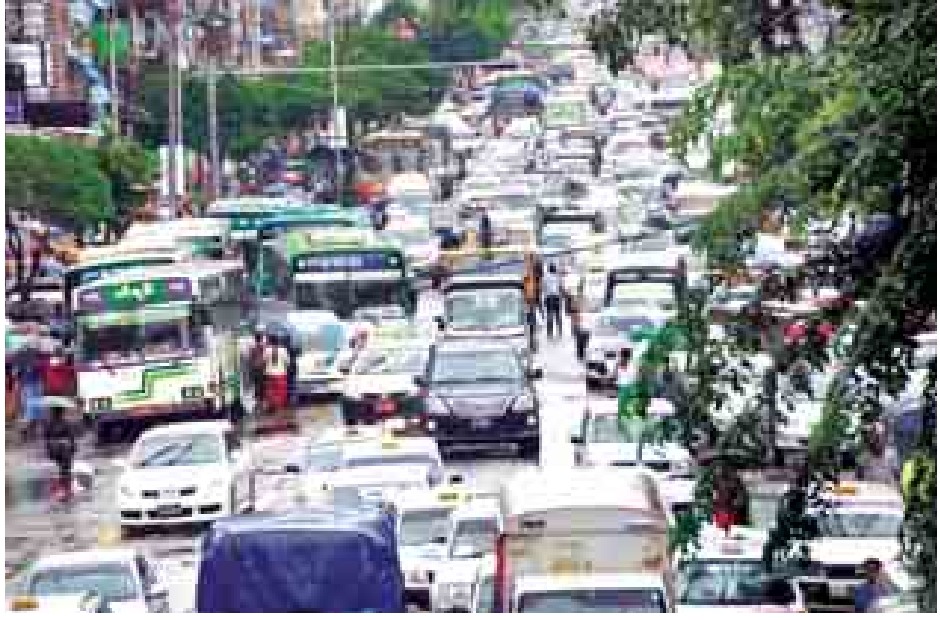
ရန်ကုန်မြို့တွင်း၌ မော်တော်ယာဉ်များ တစ်နေ့တခြားများပြားလာမှုကြောင့် ဘတ်စ်ကားယာဉ်လိုင်းများ၊ ကိုယ်ပိုင်ယာဉ်ငယ်များ၊ အငှားယာဉ်များဖြင့် ယာဉ်ကြောကျပ်နေသည်ကို တွေ့ရစဉ်။