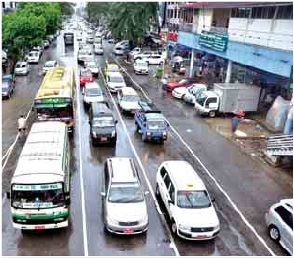
ရန်ကုန်မြို့ အနော်ရထာလမ်းမကြီးပေါ်၌ ဘတ်စ်ကားယာဉ်လိုင်းများ၊ ကိုယ်ပိုင်ယာဉ်ငယ်များ၊ အငှားယာဉ်များ၊ သတ်မှတ်ယာဉ်ကြောအတိုင်း မောင်းနှင်နေသည်ကိုတွေ့ရစဉ်။