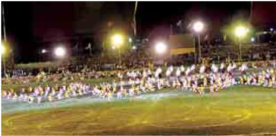
နိုဝင်ဘာ ၈ ရက်က ရခိုင်ပြည်နယ်ဝန်ကြီးချုပ်ဖလား တိုင်းဒေသကြီးနှင့် ပြည်နယ် နပန်းအားကစားပြိုင်ပွဲ ဖွင့်ပွဲအခမ်းအနားကို စစ်တွေမြို့ ဝေသာလီအားကစားကွင်း၌ စည်ကားသိုက်မြိုက်စွာကျင်းပစဉ်။ (သတင်းစဉ်)

စာမျက်နှာ ၅ မှ ကျွန်တော်တို့နေတဲ့နေရာ အသီးသီးကို ပြန်ပို့ပေးမယ်ပြောတယ်။ စားဖို့လည်း အတတ်နိုင်ဆုံး လုပ်ပေးပါတယ်။ ကျားဖောင်မှာ ခွာကြီးဆိုတာရှိတယ်။ လှိုင်းကြီးလို့ ခွာကြီးကို မခတ်ဖြတ်ရင် ဖောင်မှောက်တယ်။ တချို့ကဖြုတ်တယ်။ ဖြုတ်ချိန်မရရင် ဓားနဲ့ခတ်ဖြတ်ရတယ်။ ဖောင်ဖြုတ်ဆီးရင် ဆူတယ်။ ကျွန်တော်တို့အတွက် အလုပ်လာလုပ်တာ ပိုက်ဆံက ဘယ်လောက် ရမလဲတော့ မသိဘူး။ ပွဲစားပဲသိတာ။