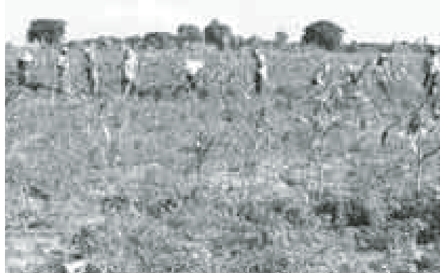
ဒါပေမယ့်လည်း မိသားစုစားဝတ်နေရေးအတွက် တစ်ဖက်တစ်လမ်းက အဆင်ပြေသလို ကိုယ့်ဒေသရေမြေမှာ သီးနှံတွေအောင်မြင်ဖြစ်ထွန်းနေတာ မြင်ရရင် ဝမ်းသာကြည်နူးရပါတယ်” ဟု ပေါင်းလိုက်နေသူ အမျိုးသားတစ်ဦးက ပြောသည်။

မှာဆိုတော့ ပေါင်းသင်၊ မြေဆွအလုပ်က မဖြစ်မနေလုပ်ရတဲ့ လုပ်ငန်းဖြစ်ပါတယ်” ဟု စိုက်ခင်းရှင်တစ်ဦးက ပြောပြသည်။ “ကျွန်တော်တို့ အမျိုးသားတွေက တစ်မနက်ဆိုရင် ငွေကျပ် ၁၅၀၀ ရပါတယ်။ တစ်နေ့ကုန်ဆိုရင် ငွေကျပ် ၃၀၀၀ ပေါ့။ အမျိုးသမီးတွေက တစ်မနက် ငွေကျပ် ၁၀၀၀၊ တစ်နေ့ကုန်ဆိုရင် ငွေကျပ် ၂၀၀၀ ရတယ်။ မုန့်တွေလည်း ကျွေးကြပါတယ်။ နေပူထဲမှာ ပေါက်ပြားနဲ့ ပေါက်နေရတာဆိုတော့ နည်းနည်းပင်ပန်းတယ်ဗျ။