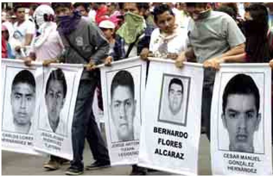
အဆိုပါ ဂူယာရေးရောယူနီဒေါ မှမ်းဆီးခဲ့သည်။ ၎င်းကျောင်းသား များပျောက်ဆုံးသွားရာ မြစ်တစ် လျှောက် အမည်မသိလူသေအလောင်း များထည့်ထားသော အိတ်ခြောက်လုံး ကို တွေ့ရှိကြောင်းပျောက်ဆုံးကျောင်း သူများ၏ မိဘဆွေမျိုးများက ပြော သည်။ (ဘီဘီစီ)

မက္ကဆီကိုစီးတီး နိုဝင်ဘာ ၈ လွန်ခဲ့သော ခြောက်ပတ်က ပျောက်ဆုံးနေသော ကျောင်းသား ၄၀ ကျော်ကို သတ်ပစ်လိုက်ပြီဖြစ် ကြောင်း သံသယရှိ မက္ကဆီကို ဂိုဏ်းအဖွဲ့ဝင်များက ဝန်ခံပြောကြား ခဲ့သည်ဟု မက္ကဆီကို ရှေ့နေချုပ် ဂျိုးဆက်မူရီလိုက ပြောသည်။ ရဲများက အဆိုပါ ကျောင်းသား များကို မိမိတို့အား လွှဲပေးခဲ့ခြင်းဖြစ် ကြောင်း ဂိုဏ်းအဖွဲ့ဝင်သုံးဦးက ပြော ကြားသည်။ ကျောင်းသားများ၏ ရုပ် အလောင်းများကို မီးပုံရိမ် မပြုလုပ်မီ အချို့ကို အသက်ရှူကျပ်အောင်လုပ် ပြီး သတ်ခဲ့သလို အခြားသူများအား သေနတ်များဖြင့် ပစ်သတ်ခဲ့ကြောင်း ၎င်း ဂိုဏ်းအဖွဲ့ဝင်သုံးဦးက ပြော သည်။ ကျောင်းသားစုစုပေါင်း ၄၃ ဦး သည် စက်တင်ဘာ ၂၆ ရက်က အီဂျူယာလာမြို့၌ ရဲတပ်ဖွဲ့ဝင်များ နှင့်အဓိကရုဏ်းဖြစ်ပြီး ပျောက်ဆုံး သွားခဲ့သည်။