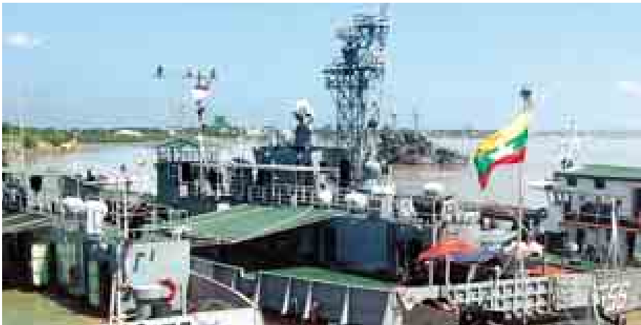
ရေလုပ်သားများအားဆယ်ယူခဲ့သော တပ်မတော်ရေမှ စစ်ရေယာဉ်ကိုတွေ့ရစဉ်။

တပ်မတော် စစ်ရေယာဉ်က ကယ်တင်ခဲ့သော ရေလုပ်သားများ