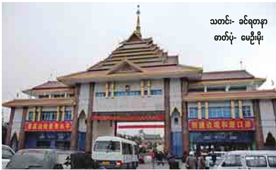
မူဆယ်- ကျယ်ဝန်းစည်ပင်စိတ်တစ်နေရာကို တွေ့ရစဉ်။