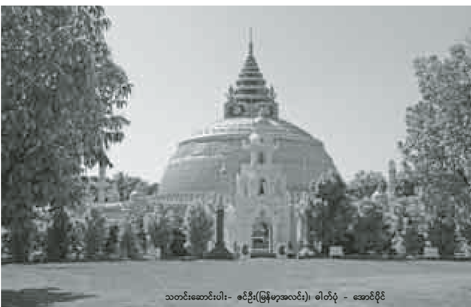
သတင်းဆောင်းပါး- စင်ဦး(မြန်မာ့အလင်း)

သီတဂူကမ္ဘာ့ဗုဒ္ဓ တက္ကသိုလ်မှ ၂၀၀၀ ပြည့်နှစ်မှစတင်ပြီး တက္ကသိုလ်ပညာရပ်များကို စတင်ပို့ချလျက်ရှိရာ “သီတဂူလမင်း၊ ကြယ်ခမင်း အလင်း ကမ္ဘာပြန့်ပွားစေသော်” ဟူသည့် ကြွေးကြော်သံနှင့်အတူ ကမ္ဘာ့အဆင့်ယှဉ်ပြိုင်ထိုးဖောက်နိုင်သော တက္ကသိုလ်ကြီးတစ်ခုဖြစ်လာစေရေး၊ ဗုဒ္ဓတက္ကသိုလ်မှ ဘွဲ့ယူသွားကြသော