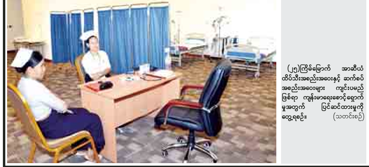
(၂၅)ကြိမ်မြောက် အာဆီယံထိပ်သီးအစည်းအဝေးနှင့် ဆက်စပ်အစည်းအဝေးများ ကျင်းပမည့်ဖြစ်ရာ ကျန်းမာရေးစောင့်ရှောက်မှုအတွက် ပြင်ဆင်ထားမှုကိုတွေ့ရစဉ်။ (သတင်းစဉ်)