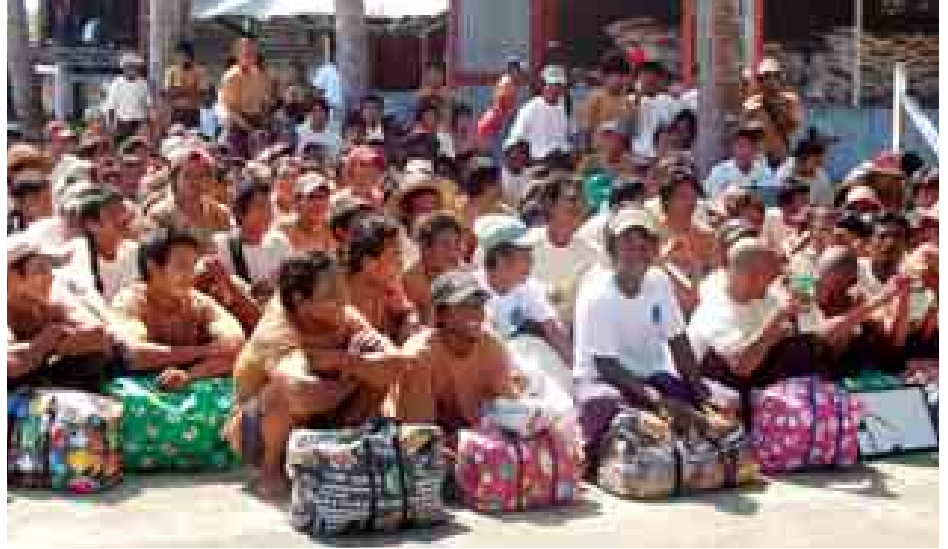
တပ်မတော်(ရေ)မှ ကယ်ဆယ်ခဲ့သော ရေလုပ်သားများကို တွေ့ရစဉ်။