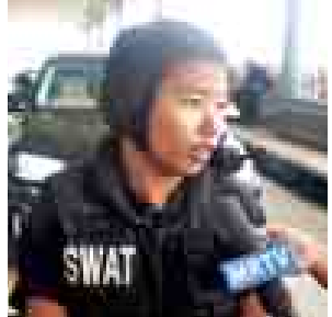
ဒုတပ်ကြပ် သန္တာလှိုင်