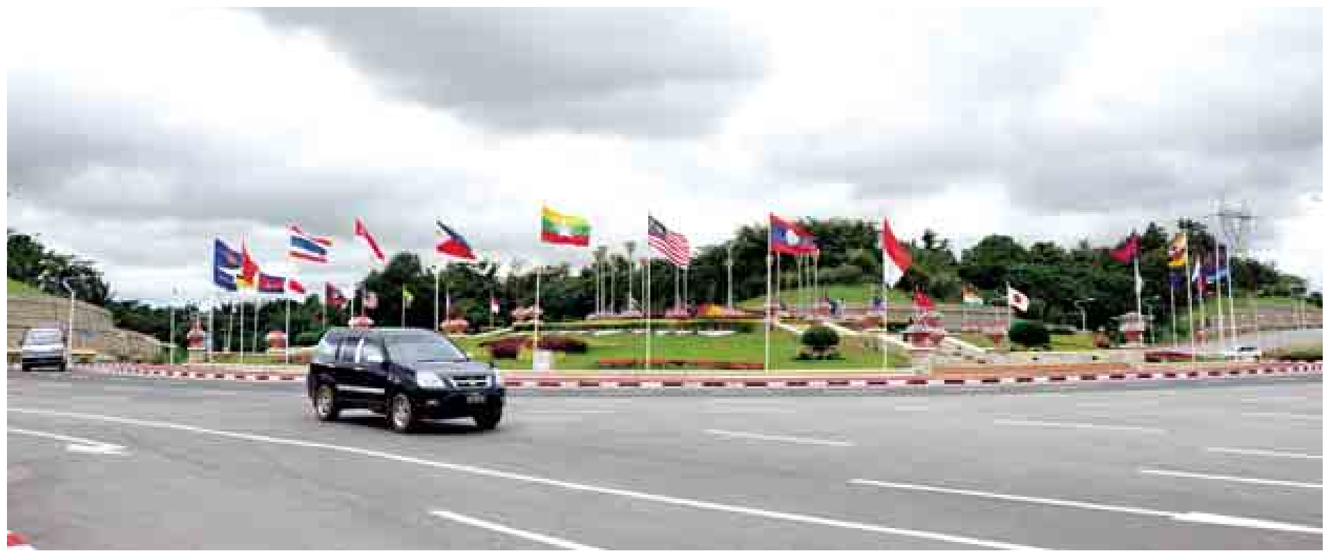
(၅၉)ကြိမ်မြောက် အာဆီယံထိပ်သီးအစည်းအဝေးနှင့် ဆက်စပ်အစည်းအဝေးများကို နေပြည်တော်၌ကျင်းပမည်ဖြစ်ရာ သပြေကုန်းအဝိုင်း၌ အာဆီယံအလံနှင့် အာဆီယံအဖွဲ့ဝင်နိုင်ငံများ၏အလံများ လွှင့်ထူထားသည်ကို တွေ့ရစဉ်။