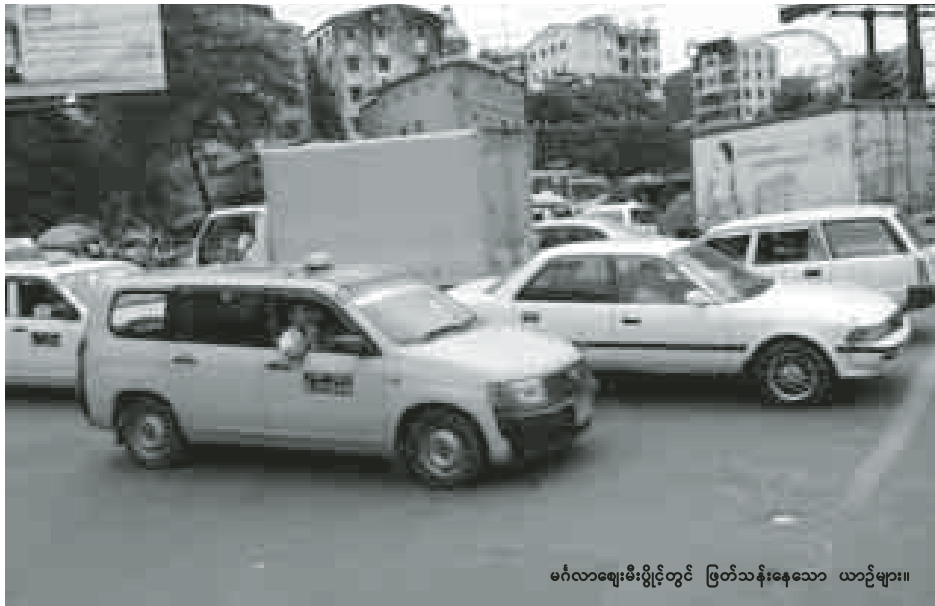
မင်္ဂလာဒုံမီးပွိုင့်တွင် ဖြတ်သန်းနေသော ယာဉ်များ။

“ဒီစနစ်က မော်တော်ယာဉ်အလာ များတဲ့ ယာဉ်ကြောကို အချိန်ပိုလွတ် ပေးတဲ့ အလိုအလျောက် Auto မီးပွိုင့်စနစ်ဖြစ်ပါတယ်။ မင်္ဂလာဒုံ၊ မီးပွိုင့်မှာဆိုရင် ယာဉ်အလာများတဲ့ ယာဉ်ကြောကို ယာဉ်ထိန်းတပ်ဖွဲ့ဝင် တစ်ဦးက မီးခလုတ်မှတစ်ဆင့် လွတ် ပေးနေတာရှိတယ်။ အခုဒီစနစ်က ယာဉ်ထိန်းတပ်ဖွဲ့ဝင်တစ်ဦးက ခလုတ် ကို အဖွင့်အပိတ်လုပ်ပြီး ယာဉ်ကြော ရှင်းပေးစရာမလိုဘဲ သူ့အလို အလျောက်ယာဉ်ကြောကို ရှင်းပေး သွားမှာဖြစ်ပါတယ်။ ဒီအစီအစဉ်က JICA နဲ့ ပူးပေါင်းဆောင်ရွက်တဲ့ မီးပွိုင့်များကို ထိန်းချုပ်ဆောင်ရွက် မယ့် အစီအစဉ်တစ်ခုဖြစ်ပါတယ်။ ကနဦးအနေနဲ့ ယာဉ်ကြောရှုပ်ထွေး တဲ့ မီးပွိုင့်တွေမှာ စတင်ဆောင်ရွက် သွား မှာဖြစ်ပါတယ်”ဟု အဆိုပါ တာဝန်ရှိသူက ပြောသည်။