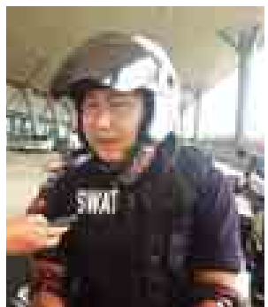
ရဲအုပ် ဘိုဘိုမော်ဝင်း

ခွင့်ရတဲ့အတွက် အမြဲတမ်းဂုဏ်ယူ နေမှာပါ”ဟု ပြောသည်။ အထူးတာဝန်တပ်ဖွဲ့ဝင် ဒု တပ်ကြပ်သင်းသင်းဝေက “ကျွန်မတို့ တပ်ဖွဲ့မှာ တပ်ဖွဲ့ဝင်မိန်းကလေးတွေ