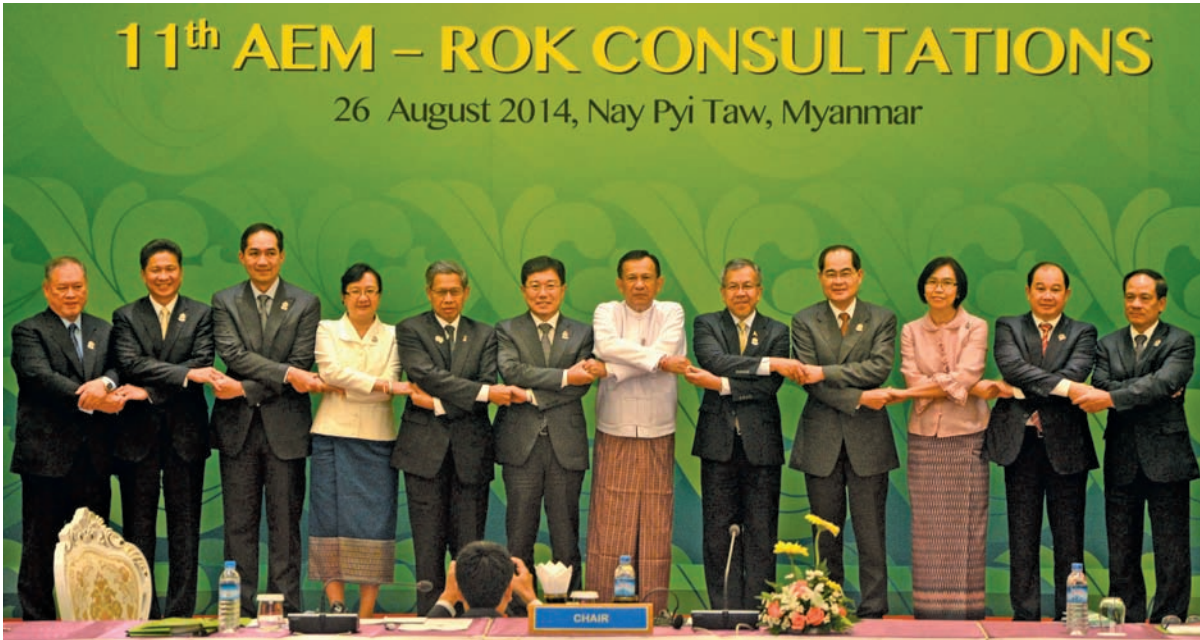
11 th AEM – ROK CONSULTATIONS 26 August 2014, Nay Pyi Taw, Myanmar