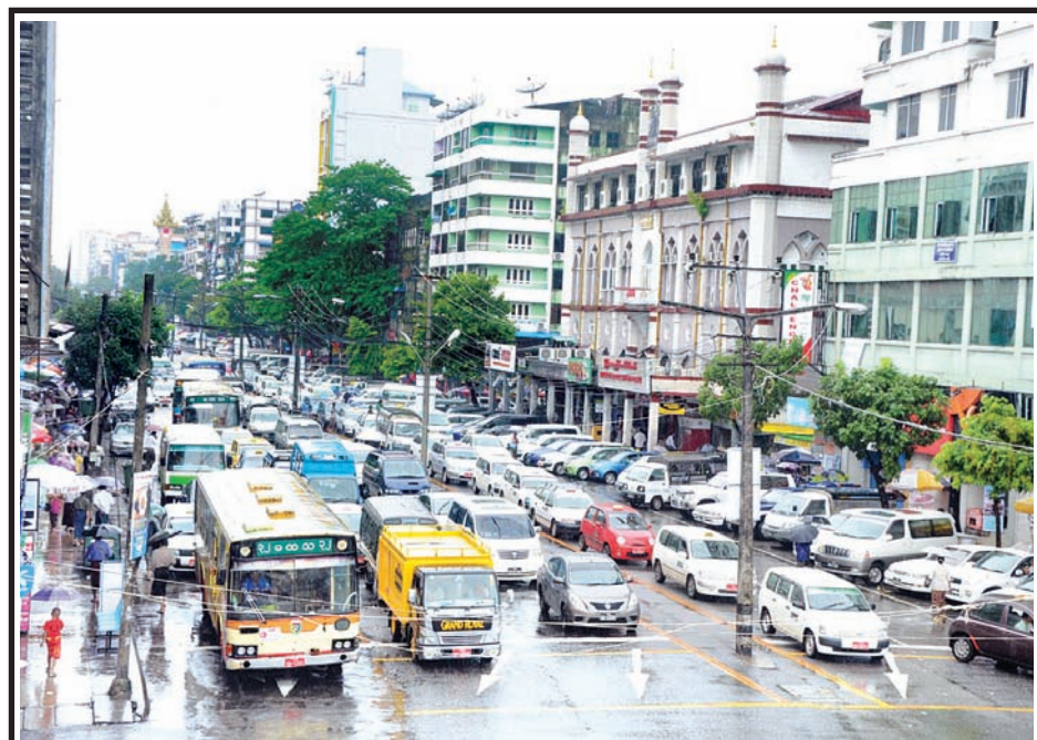
ရန်ကုန်မြို့လယ်တွင် ခရီးသည်တင်ယာဉ်ကြီးများ၊ ယာဉ်ငယ်များ သတ်မှတ်ယာဉ်ကြောအတိုင်း သွားလာမောင်းနှင်နေမှုကို နိုဝင်ဘာ ၅ ရက်က တွေ့ရစဉ်။ (ခရီးသည်တင်ယာဉ်များ သတ်မှတ်ယာဉ်ကြောအတိုင်း မောင်းနှင်ခြင်းနှင့် ကိုယ်ပိုင်ယာဉ်များ၊ အငှားယာဉ်များ၊ အနွေးယာဉ်များ၊ ခရီးသွားပြည်သူများ၊ ဈေးသည်များ ယာဉ်စည်းကမ်း၊ လမ်းစည်းကမ်း လိုက်နာခြင်းဖြင့် ယာဉ်ပိတ်ခိမ့်မှု၊ ကျပ်တည်းမှုများ လျော့နည်းသွားမည်ဖြစ်ပါသည်။)

“၃၇-က။ ခုံရုံးသည် ဤဥပဒေပါ လုပ်ငန်းတာဝန်များ ဆောင်ရွက်ရာတွင် တရားမကျင့်ထုံး ဥပဒေ၊ ဖြစ်မှုဆိုင်ရာကျင့်ထုံး ဥပဒေ၊ သက်သေခံအက်ဥပဒေပါ ပြဋ္ဌာန်းချက်များမှ စပ်ဆိုသည့် ပြဋ္ဌာန်းချက်များကို ဆီလျော်သလို ကျင့်သုံးဆောင်ရွက်နိုင်သည်။”