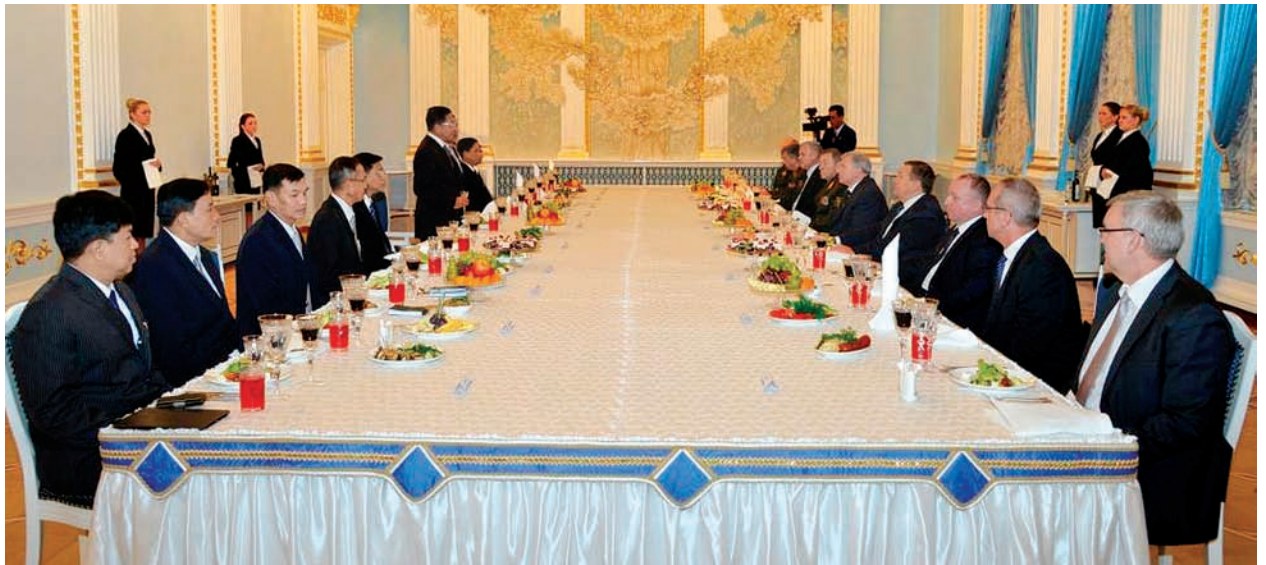
တပ်မတော်ကာကွယ်ရေးဦးစီးချုပ် ဗိုလ်ချုပ်မှူးကြီးမင်းအောင်လှိုင် ဘယ်လားရစ်သမ္မတနိုင်ငံ နိုင်ငံတော်လုံခြုံရေးကောင်စီအတွင်းရေးမှူးက တည်ခင်းစဉ်ခံသည့် ဂုဏ်ပြုညစာစားပွဲတွင် ကျေးဇူးတင်စကားပြောကြားစဉ်။ (မြဝတီ)

အလားတူ နိုဝင်ဘာ ၄ ရက် ဒေသစံတော်ချိန် ညနေ ၃ နာရီတွင် တပ်မတော်ကာကွယ်ရေးဦးစီးချုပ် ဗိုလ်ချုပ်မှူးကြီးမင်းအောင်လှိုင် ဦးဆောင်သော မြန်မာ့တပ်မတော်ချစ်ကြည်ရေးကိုယ်စားလှယ်အဖွဲ့နှင့် ဘယ်လားရစ်သမ္မတနိုင်ငံ ကာကွယ်ရေးဝန်ကြီး Lt-Gen. Yuri Zhadobin ဦးဆောင်သည့်