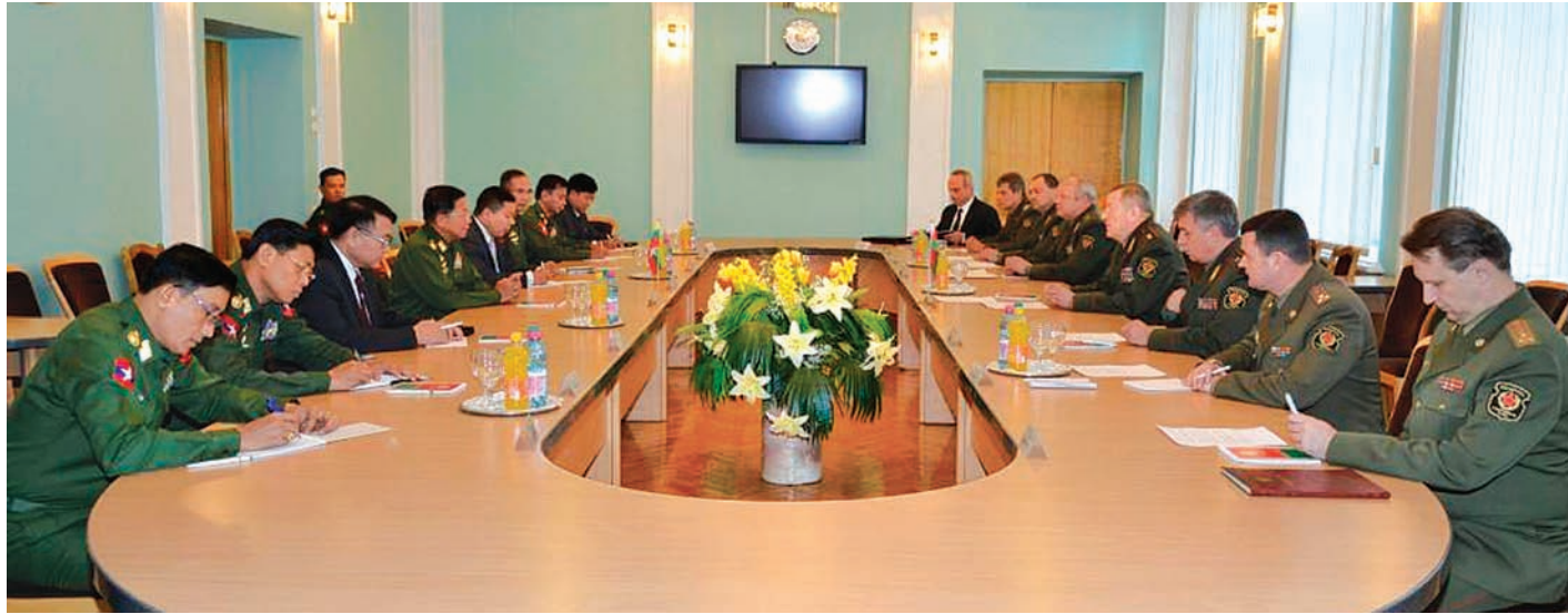
တပ်မတော်ကာကွယ်ရေးဦးစီးချုပ် ဗိုလ်ချုပ်မှူးကြီးမင်းအောင်လှိုင်နှင့် ဘယ်လာရစ်သမ္မတနိုင်ငံ ကာကွယ်ရေးဝန်ကြီးတို့ တွေ့ဆုံဆွေးနွေးစဉ်။