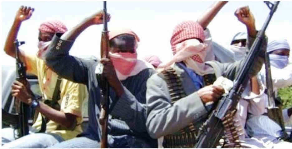
လာနိုင်ကြောင်း ၎င်းက ပြောကြားခဲ့သည်။ အပစ်အခတ်ရပ်စဲရေး သဘောတူညီမှုရရှိခဲ့ကြောင်း ကြေညာခဲ့ပြီး

နေခြင်းသည် အကြီးမားဆုံးရာဇဝတ်မှုတစ်ခုဖြစ်ကြောင်း၊ ပြစ်မှုဆိုင်ရာ လုပ်ထုံးလုပ်နည်းများသည် စစ်ရေးအရ နှိမ်နင်းခြင်းထက် ပိုပြီးသင့်တော်ကြောင်း အဆိုပါ မြို့တော်ဝန်က ထပ်လောင်းပြောကြားခဲ့သည်။ လုံခြုံရေးဆောင်ရွက်ချက်များ မလုံလောက်ပါက စစ်သွေးကြွများသည် အဆိုပါပြည်နယ်များနှင့် သိပ်မဝေးသောနေရာတွင်ရှိနေသဖြင့် ၎င်းနယ်မြေများကို မကြာမီသိမ်းပိုက်