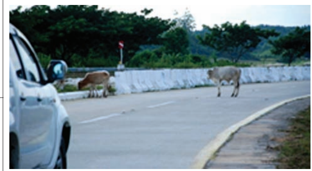
ထင်သာမြင်သာ ပြုပြင်စရာ

ပြည်ထောင်စုဝန်ကြီး နော်ဝေနိုင်ငံ၊ အော်စလိုမြို့သို့ စတင်လာရောက်ခဲ့သည့် အချိန်မှစတင်၍ နှစ်နိုင်ငံပူးပေါင်းဆောင်ရွက်ရေး လုပ်ငန်းများ ပိုမိုတိုးမြှင့်နိုင်ခဲ့ပါကြောင်း၊ ၂၀၁၃-၂၀၁၄ ခုနှစ်တွင် ဆွေးနွေးပွဲများ၊ သင်တန်းများ ကျင်းပနိုင်ခဲ့ပါကြောင်း၊ နော်ဝေနိုင်ငံအနေဖြင့် မြန်မာနိုင်ငံ၏ REDD+ လုပ်ငန်းစဉ်များနှင့်အတူ ပြည်ထောင်စုဝန်ကြီး တင်ပြခဲ့သည့် အဓိကကဏ္ဍကြီး(၄)ရပ်တွင် နည်းပညာနှင့် ရန်ပုံငွေအကူအညီများ ထောက်ပံ့ပေးလျက် ရှိပါကြောင်းနှင့် အဆိုပါ ပူးပေါင်းဆောင်ရွက်ရေး လုပ်ငန်းစဉ်များမှတစ်ဆင့် ရေရှည် တည်တံ့ခိုင်မြဲသည့် နှစ်နိုင်ငံချစ်ကြည်ရေးကို တည်ဆောက်သွားနိုင်မည်ဖြစ်ကြောင်း ပြောကြားသည်။ နော်ဝေနိုင်ငံနှင့် မြန်မာနိုင်ငံတို့အကြား ပတ်ဝန်းကျင်ထိန်းသိမ်းရေး ပူးပေါင်းဆောင်ရွက်မှုအစီအစဉ် (၂၀၁၅-၂၀၁၇) ရေးဆွဲရေး အလုပ်ရုံဆွေးနွေးပွဲကို နိုဝင်ဘာ ၃ ရက်မှ ၄ ရက်အထိ ကျင်းပခဲ့ကြောင်း သတင်းရရှိသည်။ (မြန်မာ့အလင်း)