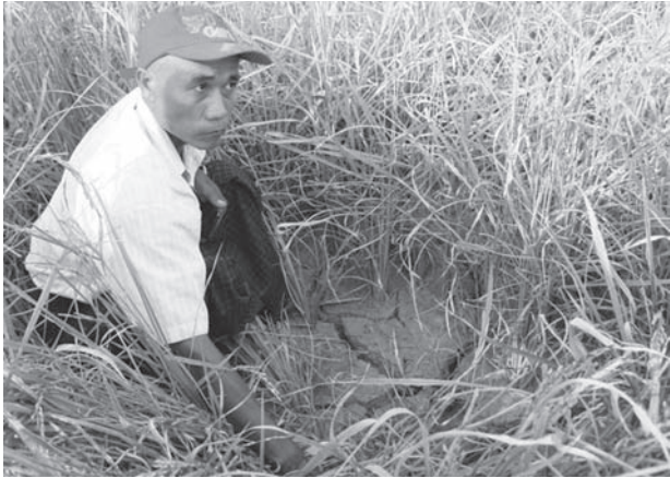
မိုးခေါင်သဖြင့် ပုပ်ကြားအက်နေသော လယ်မြေကို ပြသနေသည့်တောင်သူတစ်ဦး။

မြန်အောင် နိုဝင်ဘာ ၄ ရေဝတ်တိုင်းဒေသကြီး မြန်အောင်မြို့နယ် ကနောင်တိုက်နယ် အတွင်း ကျေးရွာအုပ်စုများဖြစ်သော ပေါက်ကုန်းစွန်းကျေးရွာအုပ်စု၊ ကျွဲတဲကုန်းအုပ်စု၊ ငဝ်ဆိပ်အုပ်စု၊ ကန်စွန်းခုံအုပ်စု၊ အိုးတိုအုပ်စု စသည့်ကျေးရွာအုပ်စုများအတွင်းရှိ လယ်များတွင် ယခုနှစ် မိုးခေါင်ခြင်းကြောင့် စပါးများ မအောင်မြင်ဖြစ်ကာ ပျက်စီးမှုများရှိနေပြီး တောင်သူများ အခက်တွေ့နေသည့်အတွက် ဘဏ်ချေးငွေ