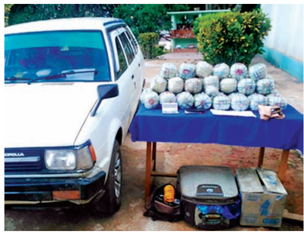
ပိုင်ရှင်မဲ့ဖမ်းဆီးရမိ ဘိန်းစိမ်းများအား တွေ့မြင်ရစဉ်။ အဆိုပါ သိမ်းဆည်းရမိခဲ့သည့် ဘိန်းစိမ်းများနှင့်ပတ်သက်၍ ကွန်ဟိန်းမြို့မရဲစခန်း၌ မူးယစ်ဆေးဝါးနှင့်စိတ်ကို ပြောင်းလဲစေသောဆေးဝါးများဆိုင်ရာ ဥပဒေအရအရေးယူထားကြောင်း သိရသည်။ (သတင်းစဉ်)

နေပြည်တော် နိုဝင်ဘာ ၄ နိုဝင်ဘာ ၂ ရက်က ကွန်ဟိန်းမြို့နယ် ဆိုင်းမွန်ကျေးရွာအရှေ့ဘက် တစ်မိုင်ခန့်အကွာ နတ်စင်အနီး၌ နယ်မြေခံတပ်မှ တပ်ဖွဲ့ဝင်များသည် ကွန်ဟိန်းမြို့နယ်မှ ခိုလှုံတက်သို့ မောင်းနှင်လာသည့် ယာဉ်အမှတ် SHN 9A/--- နံပါတ်ပါအဖြူရောင် ဗင်ကားအားတားဆီးစဉ် မောင်းနှင်ထွက်ပြေးသဖြင့် လိုက်လံဖမ်းဆီးရာ ယာဉ်ကို ကိုက် ၂၅၀ ခန့်အကွာတွင် ရပ်တန့်ပြီး ယာဉ်ပေါ်ပါသူများ ထွက်ပြေးသွားသဖြင့် ယာဉ်ကို စစ်ဆေးရာ ဆာလာအိတ် သုံးအိတ်နှင့် လက်ဆွဲထောင့်တစ်လုံးအတွင်းမှ ဘိန်းစိမ်းအထုပ် ၄၈ ထုပ် စုစုပေါင်း ဘိန်းစိမ်း အလေးချိန် ၇၆ ဒဿ ၉၃၆ ကီလို ပိုင်ရှင်မဲ့ သိမ်းဆည်းရမိခဲ့သည်။