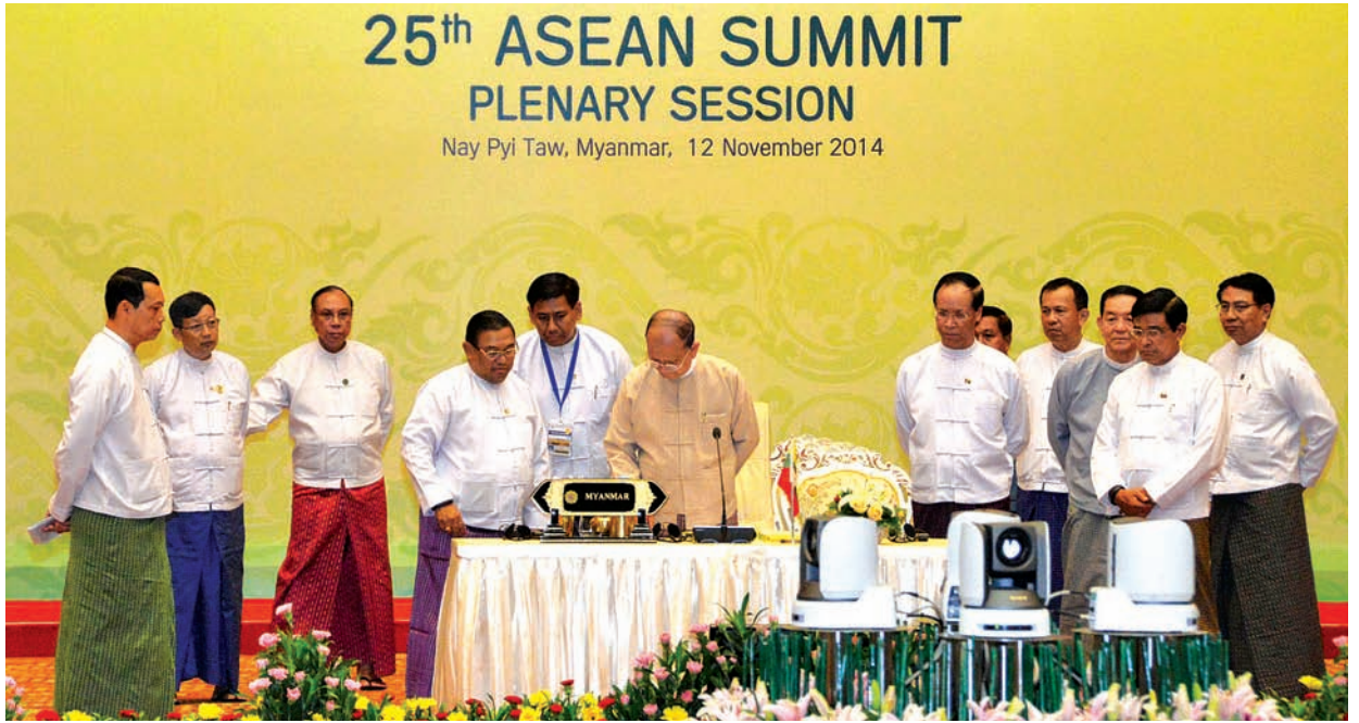
၂၅ th ASEAN SUMMIT PLENARY SESSION Nay Pyi Taw, Myanmar, 12 November 2014

နေပြည်တော်၌ နိုဝင်ဘာ ၁၂ ရက်မှ ၁၃ ရက်အထိ ကျင်းပမည့် (၂၅)ကြိမ်မြောက် အာဆီယံထိပ်သီးအစည်းအဝေးနှင့် ဆက်စပ်ထိပ်သီးအစည်းအဝေးများ အောင်မြင်စွာ ကျင်းပနိုင်ရေးအတွက် ဆက်ဆံမှု