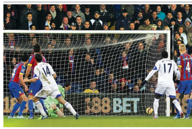
အုပ်စု (A)မှာ သုံးပွဲကစားပြီး ခုနစ်မှတ်နဲ့ဗီလာရီးရဲ့တို့ ဦးဆောင်နေပါတယ်။ ဆွစ်ဇာလန်ကလပ် ဇူးရစ်ဟာ ပထမအကျော့မှာ လေးဂိုး-တစ်ဂိုးနဲ့

အသားစီးရနိုင်တဲ့ပွဲပါ။ ပါနာသီနာကိုဖီနှင့် ဝီအက်စ်ဂျီ အုပ်စု (E)မှာ ဝီအက်စ်ဂျီတို့ အားသွန်ကစားရမယ့်ပွဲပါ။ ဒီပွဲနိုင်မှ နောက်တစ်ဆင့်မျှော်လင့်နိုင်တာမို့ အားထည့်ယှဉ်ပြိုင်ပါလိမ့်မယ်။