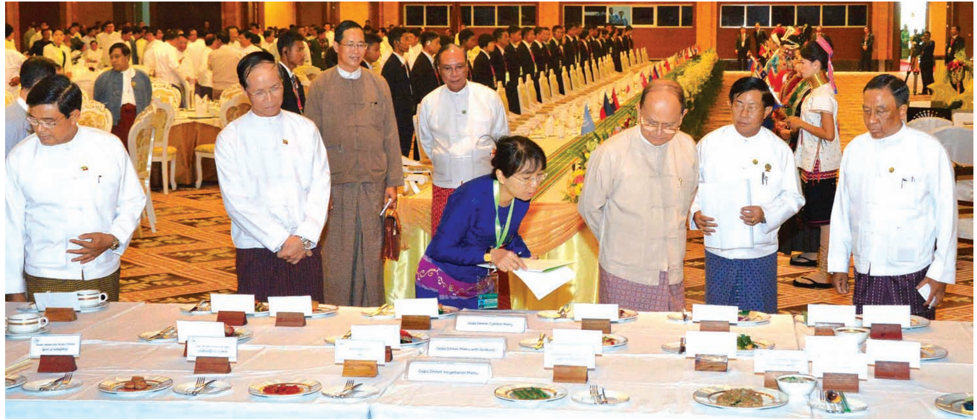
နိုင်ငံတော်သမ္မတဦးသိန်းစိန် (၂၅)ကြိမ်မြောက် အာဆီယံထိပ်သီးအစည်းအဝေးနှင့် ဆက်စပ်အစည်းအဝေးများအတွက် ပြင်ဆင်ထားရှိမှုကို ကြည့်ရှုစစ်ဆေးစဉ်။ (သတင်းစဉ်)