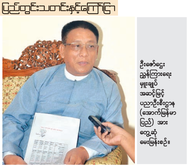
ဦးစော်ဌေး ညွှန်ကြားရေး များချုပ် အဆင့်မြင့် ပညာဦးစီးဌာန (အောက်မြန်မာ ပြည်) အား တွေ့ဆုံ မေးမြန်းစဉ်။