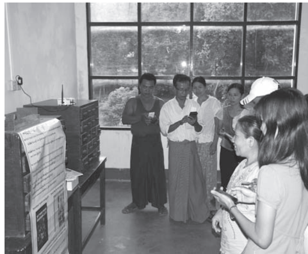
Public Digital Library စနစ်အသုံးပြုမှုကို ရှင်းပြနေစဉ်။

မော်လမြိုင် နိုဝင်ဘာ ၄ မွန်ပြည်နယ်အတွင်း ဒစ်ဂျစ်တယ်စာကြည့်တိုက်စက် Public Digital Library Service စက်များကို မေလအတွင်း မော်လမြိုင်မြို့ဘူတာကြီးနှင့် သထုံမြို့သာသနာ့ဗိမာန်တော်ကြီးတို့တွင် ပထမအကြိမ်တပ်ဆင်ပေးခဲ့ရာ ပြည်သူများကျေနပ်အားရလျက်ရှိပြီး ဒုတိယအကြိမ်အဖြစ် မော်လမြိုင်မြို့တွင် ပြည်နယ်အစိုးရအဖွဲ့ရုံး၊ မော်လမြိုင်တက္ကသိုလ်၊ ပညာရေးကောလိပ်၊ နည်းပညာတက္ကသိုလ်၊ မင်းစည်းစိမ်လက်ဖက်ရည်ဆိုင်နှင့် သထုံမြို့တွင် ကွန်ပျူတာတက္ကသိုလ် စုစုပေါင်း ခြောက်နေရာ၌ ထပ်မံတပ်ဆင်ပြီးဖြစ်ကြောင်းနှင့် ပြည်သူများ၊ ဌာနဆိုင်ရာဝန်ထမ်းများ၊ ကျောင်းသားလူငယ်များ ကျေနပ်အားရစွာ အသုံးပြုလျက်ရှိကြောင်း သိရသည်။