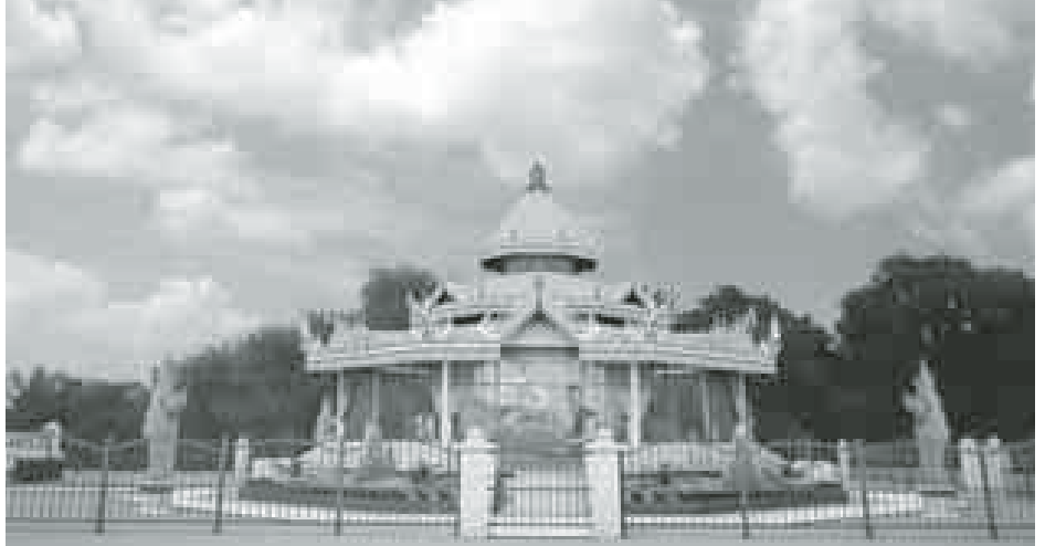
အလှူရှင်မိသားစုသည် မန္တလေးမြို့တည်နန်းတည် သတ္တဌာနများ အနက် ပျက်စီးပျောက်ကွယ်သွားသော ပိဋကတ်တိုက်တော်ကြီး၊ မဟာပဌာန်းဟော ရွှေသိမ်တော်ကြီးနှင့် သုဓမ္မာဇရပ်တော်ကြီးများကို ရှေးမူပျက် အသစ်ပြန်လည်တည်ဆောက် လှူဒါန်းနေသူများဖြစ်ပြီး ဆက်လက်၍လည်း ဗောဓိပင်နှင့် ရွှေပလ္လင်၊ သုဓမ္မာပေါင်းကူး စနုဆောင်၊ မင်းတုန်းမင်းပြတိုက်၊ မုခ်ဦးများနှင့် ၎င်းအဆောက်အအုံများ လုံခြုံရေး

အဆောင် ပစ္စည်းများကိုလည်း ပြုသွားမည်ဖြစ်ကြောင်း သိရသည်။ ပြတိုက်ဆောင်ကို ကျောက်တော်ကြီးဘုရား အရှေ့တောင်ထောင့်ရှိ ဗောဓိပင်နှင့်ရွှေပလ္လင်နှင့် သုဓမ္မာဇရပ်တော်ကြီးကြားရှိ မြေအကျယ်ပေ(၈၀x ၆၀)ပေါ်တွင် တည်ဆောက်မည်ဟု သိရသည်။