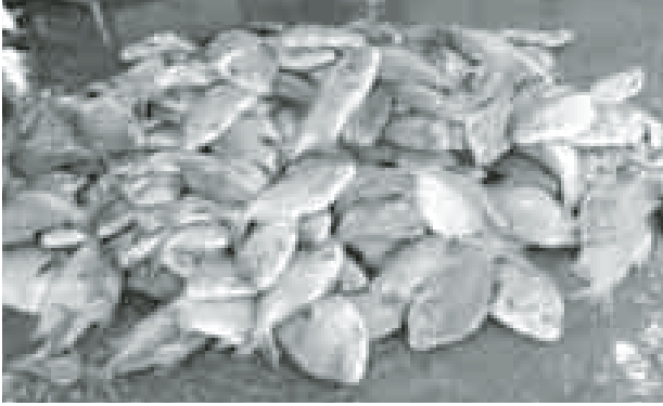
မွေးမြူထုတ်လုပ်ရာ ဒေသများမှာ ရန်ကုန်တိုင်းဒေသကြီး တွဲတေးမြို့နယ်နှင့် ဧရာဝတီတိုင်းဒေသကြီးရှိ

တီလားပီးယားငါးများကို လွန်ခဲ့သည့် ဆယ်စုနှစ်အတွင်း မြန်မာနိုင်ငံတွင် စတင်မွေးမြူခဲ့ပြီး အများဆုံး