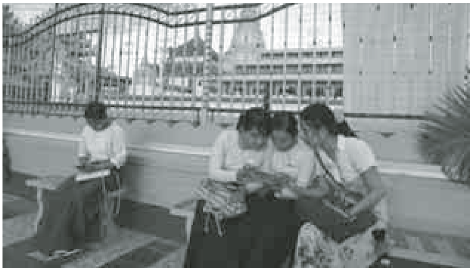
မြစန္ဒီမင်းသမီးရေကန်အနီးတွင် စာအုပ်ဖတ်ခန်းအသစ်များကို တွေ့ရစဉ်။