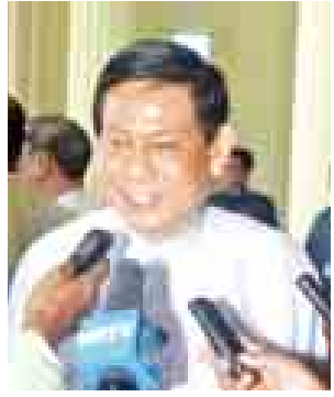
ဦးဌေးဦး (ပြည်ထောင်စုကြံ့ခိုင်ရေးနှင့် ဖွံ့ဖြိုးရေးပါတီ)