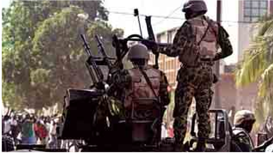
ကာကွယ်ရေးတပ်ဖွဲ့ဝင်များ ဆန္ဒပြသူများကို ဖြိုခွဲရန်ကြိုးစားနေစဉ်။

ဘာကီနာဖာဆို အောက်တိုဘာ ၃၁ ဘာကီနာဖာဆိုသမ္မတ ဘလိုင် ဆေးကွန်ပေါ်ရေးက ၎င်းအားနုတ် ထွက်ပေးရန် အကြမ်းဖက်ဆန္ဒပြမှု ဖြစ်ပွားပြီး တစ်ရက်အကြာ ကြားဖြတ် အစိုးရအနေဖြင့် တစ်နှစ်ကြာ အာ