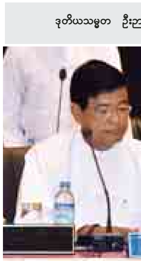
ဒုတိယသမ္မတ ဦးညွှန်