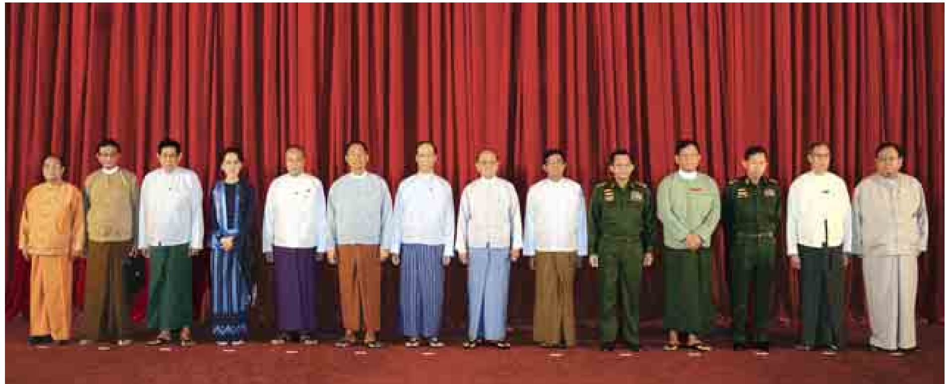
နိုင်ငံတော်သမ္မတ ဦးသိန်းစိန်နှင့် အမျိုးသားနိုင်ငံရေးအင်အားစုငါးဖွဲ့မှ ခေါင်းဆောင်များ၏ နိုင်ငံရေးရာဆွေးနွေးပွဲသို့ တက်ရောက်လာကြသူများ စုပေါင်းမှတ်တမ်းတင်ဓာတ်ပုံရိုက်စဉ်။ (သတင်းစဉ်)

နေပြည်တော် အောက်တိုဘာ ၃၁ အမျိုးသားနိုင်ငံရေးအင်အားစု ငါးဖွဲ့မှ ခေါင်းဆောင်များ၏ နိုင်ငံရေးရာ ဆွေးနွေးပွဲကို နေပြည်တော်ရှိ နိုင်ငံတော်သမ္မတအိမ်တော် ငူရွှေဝါခန်းမ၌ ယနေ့နံနက် ၉ နာရီခွဲတွင် ကျင်းပသည်။ အဆိုပါဆွေးနွေးပွဲသို့ နိုင်ငံတော်သမ္မတ ဦးသိန်းစိန်၊ ဒုတိယသမ္မတ ဒေါက်တာစိုင်းမောက်ခမ်းနှင့် ဦးညွှန်ထွန်း၊ ပြည်ထောင်စုလွှတ်တော်နာယက