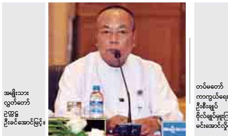
အမျိုးသား လွှတ်တော် ဥက္ကဋ္ဌ ဦးခင်အောင်မြင့်။

သို့သော် တက်ရောက်လာကြ သည့် ပုဂ္ဂိုလ်များအားလုံးအနေဖြင့် မိမိတို့ဆွေးနွေးလိုသည့် ကိစ္စရပ်များ ကိုလည်း ရရှိနိုင်သည့် အချိန်အတော အတွင်း၌ ကျယ်ကျယ်ပြန့်ပြန့်ဆွေး နွေးကြရန်လည်း ဖိတ်ခေါ်ပါကြောင်း၊ ပထမဦးဆုံးဆွေးနွေးလိုသည့် ကဏ္ဍ ရပ်မှာ လက်ရှိဖြစ်ထွန်းနေသည့် ဒီမို ကရေစီ ပြုပြင်ပြောင်းလဲရေးလုပ် ငန်းစဉ်များနှင့် နိုင်ငံရေးဖြစ်စဉ်ကို အဆင့်ဆင့် ဆက်လက်ရှင်သန်ဖြစ် ထွန်းနေစေရန်နှင့် ယင်းဖြစ်ထွန်းမှု များမှ ဒီမိုကရေစီစနစ် အမြစ်တွယ် ခိုင်မာရေးနှင့် ပွင့်လင်းလွတ်လပ် သည့် မြန်မာ့လူ့အဖွဲ့အစည်းပေါ် ပေါက်ရေးပင် ဖြစ်ပါကြောင်း။