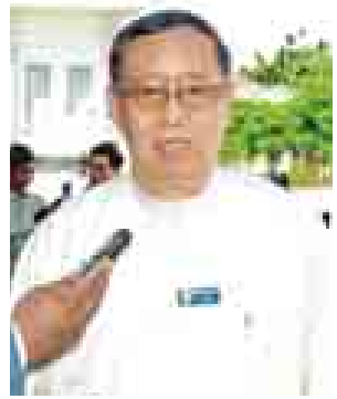
ဦးသိန်းထွန်း (တိုင်းရင်းသားစည်းလုံးညီညွတ်ရေးပါတီ)