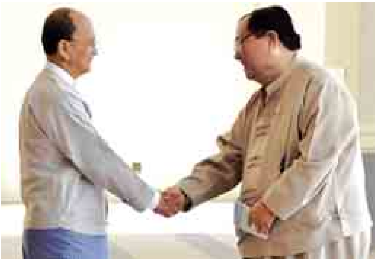
နိုင်ငံတော်သမ္မတဦးသိန်းစိန် ညီနောင်တိုင်းရင်းသားများမဟာမိတ်အဖွဲ့ ကိုယ်စားလှယ် ဦးခွန်ထွန်းဦးအား ရင်းရင်းနှီးနှီး နှုတ်ဆက်စဉ်။ (သတင်းစဉ်)