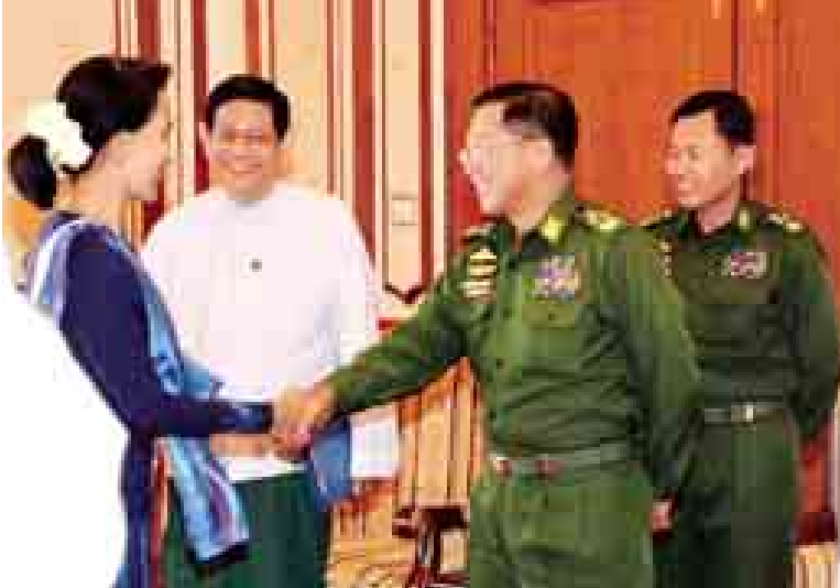
တပ်မတော် ကာကွယ်ရေး ဦးစီးချုပ် ဗိုလ်ချုပ်မှူးကြီး မင်းအောင်လှိုင် နှင့် အမျိုးသား ဒီမိုကရေစီ အဖွဲ့ချုပ် ဥက္ကဋ္ဌ ဒေါ်အောင်ဆန်း စုကြည်တို့ ရင်းရင်းနှီးနှီး နှုတ်ဆက်စဉ်။ (သတင်းစဉ်)

သားနိုင်ငံရေးအင်အားစုအချင်းချင်း စုစည်းကြိုးပမ်းဆောင်ရွက်ခြင်းအား ဖြင့် ရေရာသေချာသည့် နိုင်ငံရေး ဖြစ်စဉ်များ ရှင်သန်ရေးအတွက် နည်းလမ်းကောင်းများရှာဖွေနိုင်မည် ဟုလည်း အလေးအနက်ယုံကြည်ထား ပါကြောင်း၊ ယနေ့ဆွေးနွေးပွဲတွင် မိမိအနေဖြင့် ကဏ္ဍ(၃)ခုကို အဓိက ထားဆွေးနွေးသွားရန် ပြင်ဆင်ထား ပါကြောင်း။