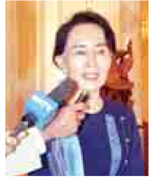
ဒေါ်အောင်ဆန်းစုကြည် (အမျိုးသားဒီမိုကရေစီအဖွဲ့ချုပ်ဥက္ကဋ္ဌ)

ရင်းရင်းနှီးနှီး ဆွေးနွေးထွေးထွေးနဲ့ ပွင့်ပွင့်လင်းလင်း ဆွေးနွေးနိုင်ခဲ့ပါတယ်။ နောက်ကိုလည်း အခုလိုပွဲမျိုးတွေ ရှိဦးမယ်လို့ မျှော်လင့်ရပါတယ်။ အခုဆွေးနွေးမှုမှာ အခြေခံဥပဒေကို လွှတ်တော်ထဲမှာ ပြင်ဆင်မယ့် သဘောထားတွေတွေ့မြင်ခဲ့ရပါတယ်။ နောက်ပြီး လူမှုစီးပွားဖွံ့ဖြိုးတိုးတက်ရေးအတွက် လယ်ယာမြေတွေကို စက်မှုလယ်ယာစနစ်ပြောင်းလဲတပ်ဆင်ပေးနိုင်ဖို့ ဆွေးနွေးနိုင်ခဲ့ပါတယ်။ အရေးအကြီးဆုံးဖြစ်တဲ့ ငြိမ်းချမ်းရေးဆွေးနွေးပွဲဆောင်ရွက်ကြဖို့ အားလုံးက တိုက်တွန်းကြပါတယ်။ ရလဒ်အနေနဲ့ ကတော့ ကောင်းတယ်လို့ ပြောရမှာဖြစ်ပါတယ်။ အခုလိုတွေ့ဆုံ ဆွေးနွေးတာဟာ မဆွေးနွေးတာထက်စာရင် အများကြီးကောင်းပါတယ်။ ပထမအကြိမ်ဖြစ်လို့ ဘယ်လောက်အထိ အကျိုးရလဒ်ပြန်ရမလဲဆိုတာတော့ မသိသေးဘူးပေါ့။ အဖွဲ့အစည်းအသီးသီးရဲ့ သဘောထားတွေကို အကုန်ရှင်းရှင်းလင်းလင်း သိလိုက်ရတဲ့အခါကျတော့ သွားနေတဲ့လမ်းကြောင်းတွေက ဆန့်ကျင်ဘက် မရှိဘူးဆိုတာ တွေ့လာရပြီလေ။ အပစ်အခတ်ရပ်စဲရေးမှာ လက်မှတ်ထိုးဖို့ကျန်နေတဲ့သူတွေကိုလည်း နိုင်ငံရေးဆွေးနွေးပွဲအထိ ထည့်သွင်းဆွေးနွေး