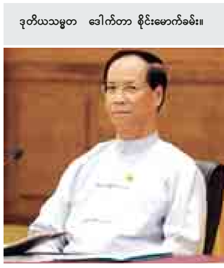
ဒုတိယသမ္မတ ဒေါက်တာ စိုင်းမောက်ခမ်း။