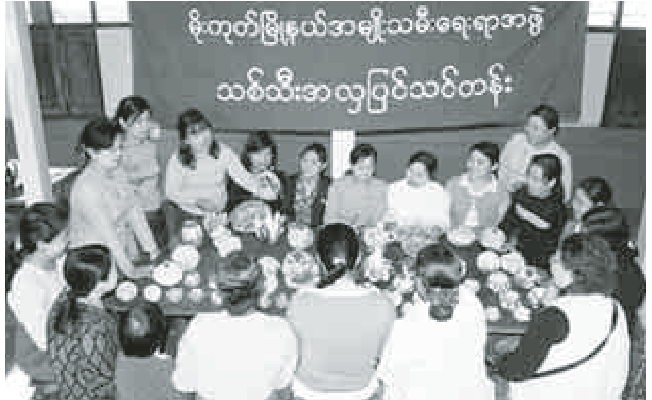
မိုးကုတ်မြို့နယ်အမျိုးသမီးရေးရာအဖွဲ့ သစ်သီးအလှပြင်သင်တန်း