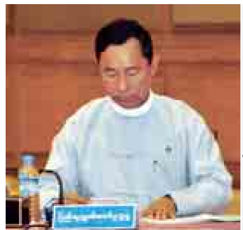
ပြည်ထောင်စု လွှတ်တော် နာယက ပြည်သူ့ လွှတ်တော်ဥက္ကဋ္ဌ သူရဦးရွှေမန်း။

သည့် ပြုပြင်ပြောင်းလဲရေးလုပ်ငန်း စဉ်များအနေဖြင့် အကောင်အထည် ဖော်ရန် ကြိုးပမ်းခဲ့ပါကြောင်း၊ လက်ရှိပြုပြင်ပြောင်းလဲရေး လုပ်ငန်း စဉ်များနှင့် နိုင်ငံရေးဖြစ်စဉ်ရှင်သန် လာမှုသည် မိမိတို့အစိုးရ တစ်ဖွဲ့ တည်း၏ ကြိုးပမ်းဆောင်ရွက်မှု မဟုတ်ဘဲ သက်ဆိုင်ရာ နိုင်ငံရေး အင်အားစုများဖြစ်သည့် လွှတ်တော် များ၊ နိုင်ငံရေးပါတီများ၊ တပ်မတော် နှင့် ပြည်သူ့တစ်ရပ်လုံး ပါဝင်ခဲ့ခြင်း ကြောင့် ရေရာသေချာသည့် အဆင့် တစ်ခုကို တက်လှမ်းနိုင်ခဲ့ခြင်းဖြစ် သည်ဟု မိမိအနေဖြင့် အစဉ်ခံယူ ထားပါကြောင်း။ ယခုကြိုးပမ်းအကောင်အထည် ဖော်နေသည့် ပြုပြင်ပြောင်းလဲရေး လုပ်ငန်းစဉ်များသည်လည်း အောင် မြင်ဖြစ်ထွန်းမှုများ ရှိသကဲ့သို့ ဆက် လက်ကြိုးပမ်းကျော်လွှားရမည့် စိန်