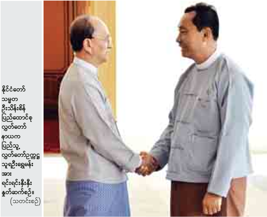
နိုင်ငံတော် သမ္မတ ဦးသိန်းစိန် ပြည်ထောင်စု လွှတ်တော် နာယက ပြည်သူ့ လွှတ်တော်ဥက္ကဋ္ဌ သူရဦးရွှေမန်း အား ရင်းရင်းနှီးနှီး နှုတ်ဆက်စဉ်။ (သတင်းစဉ်)