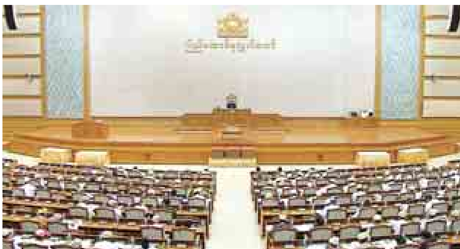
ပြည်ထောင်စုလွှတ်တော် (၁၁)ကြိမ်မြောက် ပုံမှန်အစည်းအဝေး ကျင်းပစဉ်။ (သတင်းစဉ်)