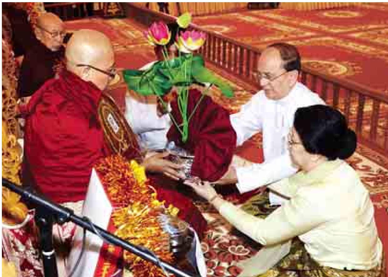
ပြည်ထောင်စုသမ္မတ မြန်မာနိုင်ငံတော်အစိုးရ၏ ကထိန်သင်္ကန်း ဆက်ကပ်လှူဒါန်းပွဲ အခမ်းအနားတွင် နိုင်ငံတော်သမ္မတ ဦးသိန်းစိန်နှင့် နန်း ဒေါ်ခင်ခင်ဝင်းတို့က ဆရာတော်အား ကထိန်လှူဒါန်းပွဲ ဆက်ကပ်လှူဒါန်းစဉ်။