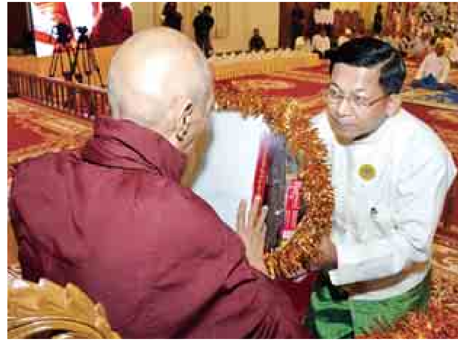
နိုင်ငံတော် သမ္မတ ဦးသိန်းစိန်နှင့် နန်း ဒေါ်ခင်ခင်ဝင်းတို့က ဆရာတော်အား ကထိန်လှူဒါန်းပွဲ ဆက်ကပ်လှူဒါန်းစဉ်။