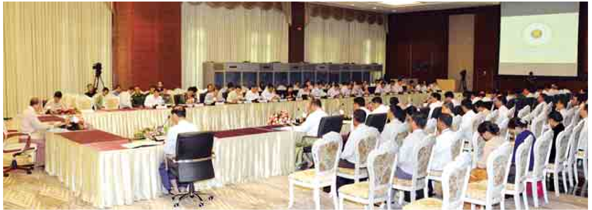
၂၀၁၄ ခုနှစ် မြန်မာနိုင်ငံအာဆီယံအလှည့်ကျဥက္ကဋ္ဌတာဝန်ယူရေးနှင့် အာဆီယံအသိုက်အဝန်းထူထောင်ရေးဆိုင်ရာဗဟိုကော်မတီ၏ ၂၀၁၄ ခုနှစ်(နှစ်ဝက်) ဒုတိယအကြိမ် အစည်းအဝေးကျင်းပစဉ်။