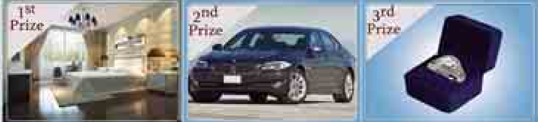
(၂)ရက်ရှိ အိမ်နဲ့ပစ္စည်းပါ CONDOMINIUM ဝယ်ခန့် BMW 328i BRAND NEW GIA Diamond Ring အိမ်နဲ့ပစ္စည်းပါ

ကံစမ်းမဲ ပွင့်လှစ်ပေးမည့်နေ့ ၂၀၁၅ခုနှစ် ခပေပတ်ဝါရီလ (၁၂)ရက်နေ့