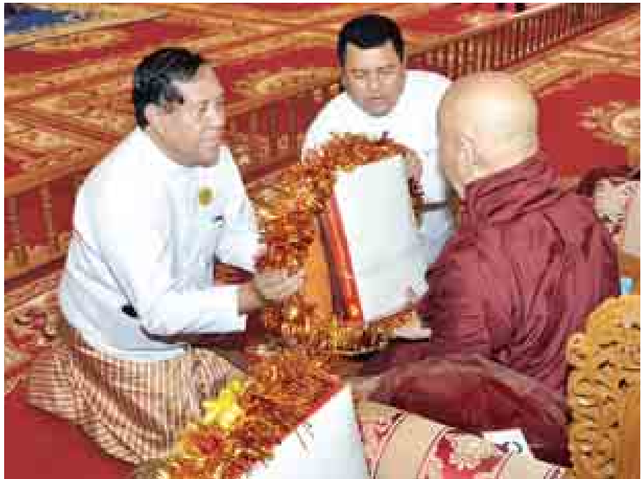
ပြည်ထောင်စု တရား သူကြီးချုပ် ဦးထွန်းထွန်းဦး ဆရာတော်အား လှူဖွယ်ပစ္စည်းများ ဆက်ကပ် လှူဒါန်းစဉ်။ (သတင်းစဉ်)