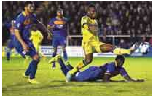
ကောင်းမြတ်သူ

ယင်းဂိုးကို မာဂ်နက် ပွဲချိန် ၇၇ မိနစ်တွင် ပြန်လည်ချေပခဲ့သည်။ ချယ်လ်ဆီးအသင်းသည် ရှာရော်စ်ဘူရီကွင်းတွင် အကြိတ်အနယ်ကြိုးစားခဲ့ရသည်။ ချယ်လ်ဆီးအတွက် အနိုင်ဂိုးကို ဂရန်ဒီဒင်က ကိုယ့်ဂိုးကိုယ်ပြန်သွင်းမိပြီး ဂိုးရခဲ့ခြင်းဖြစ်သည်။ အခြားပွဲအဖြစ် လီဗာပူးနှင့်ဆွမ်ဆီးတို့ ယှဉ်ပြိုင်ကစားခဲ့ရာ လီဗာပူးက နှစ်ဂိုး-တစ်ဂိုးဖြင့်နိုင်ပြီး ကွာတားတက်ခဲ့သည်။ ဆွမ်ဆီးက ဦးဆောင်ဂိုးသွင်းခဲ့သော်လည်း ဘာလော့တယ်လီနှင့်လော်ဗရင်တို့က ပွဲပြီးရန် ငါးမိနစ်အလို ဆက်တိုက်ဂိုးများသွင်းခဲ့၍ အနိုင်ရခဲ့ခြင်းဖြစ်သည်။