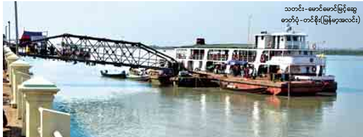
သတင်း-မောင်မောင်မြင့်ဆွေ