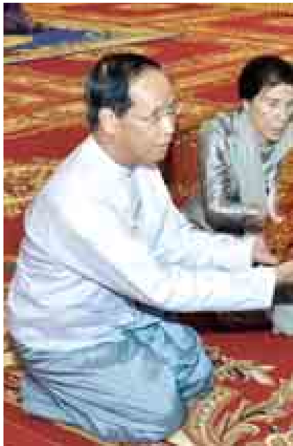
ဒုတိယသမ္မတဒေါက်တာစိုင်းမောက်ခမ်းနှင့် နန်း လှူဒါန်းစဉ်။

သည့် ပရိတ်တရားတော်များကို နာယူကြသည်။ ယင်းနောက် နိုင်ငံတော်သမ္မတနှင့် နန်းတို့က နာယကအဖွဲ့ဥက္ကဋ္ဌ ဆရာတော်အား လှူဖွယ်ပစ္စည်း လှူဒါန်းပြီး ဇေယျသီရိမြို့နယ် နန်းဦးကျောင်းတိုက် ပဓာန ဘဒ္ဒန္တဥဇ္ဇောတထံ ကထိန်လှူဒါန်းပွဲနှင့် လှူဖွယ်ပစ္စည်း လှူဒါန်းသည်။