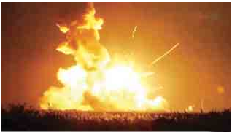
စစ်ဆေးရေးအဖွဲ့တစ်ဖွဲ့ ပေါက်ကွဲရာနေရာသို့ အချက်အလက်များ စုဆောင်းဖို့ ထွက်ခွာသွားပြီဖြစ်ကြောင်းလည်း ငင်းက ပြောသည်။ (အီဘီစီ)

“ဒီပေါက်ကွဲမှုဖြစ်စဉ်နှင့် ပတ်သက်ပြီး နားမလည်နိုင်အောင် ဖြစ်ရပါတယ်။ စုံစမ်းစစ်ဆေးမှုများ ဆက်လက်ပြုလုပ် သွားမှာဖြစ်ပါတယ်” ဟု အော်ဘတ်တယ်သိပ္ပံ ဒုတိယအမှုဆောင်ဥက္ကဋ္ဌ ဖရန်ကော့ဘာတန်က ပြောသည်။ စုံစမ်း