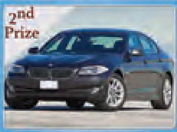
BMW 528 BRAND NEW