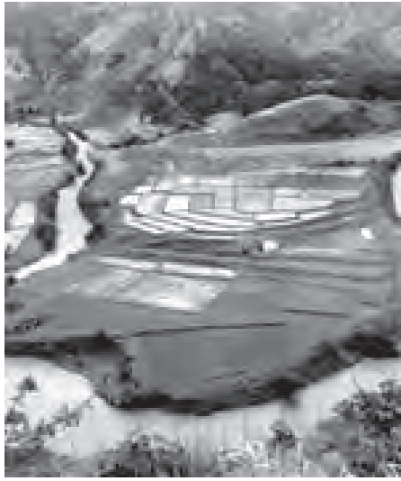
တလန်မြို့ဘက်ရှိ တောင်ကုန်းတောင် တန်းများပေါ်မှမြင်၍ တီးဆင်းလာ သော တီးမစ်ချိုင့်ဝှမ်း လွင်ပြင်

နေရာတစ်ခုဖြစ်ကြောင်း၊ ထို့ပြင် ရှေးနစ်ပေါင်းမြောက်မြားစွာကပင် ချင်းတိုင်းရင်းသားတို့၏ တန်ဖိုးထား ထိန်းသိမ်းထားသော နယ်မြေတစ်ခု ဖြစ်ကြောင်း၊ ယခုအခါ ထိုလွင်ပြင် ဒေသ၌ စပါးစိုက်ပျိုးကာ သစ်ပင်ခုတ် လှဲမှု၊ အမဲလိုက်မှု၊ ကျေးငှက်ခတ်မှု များရှိလာရာ သက်ဆိုင်ရာက ပိုင်းဝန်း ထိန်းသိမ်းရန် လိုလားလျက်ရှိကြောင်း၊ ထို့ကြောင့် ပြည်နယ်အစိုးရအနေဖြင့် ပြည်ထောင်စုဝန်ကြီးဌာန၏ ခွင့်ပြု ချက်ဖြင့် သဘာဝထိန်းသိမ်းရေး နယ်မြေအဖြစ် သတ်မှတ်ခဲ့ခြင်းဖြစ် ကြောင်း ဒေသခံမြို့မိမြို့ဖတစ်ဦး၏ ပြောပြချက်အရ သိရသည်။ သဘာဝထိန်းသိမ်းစောင့်ရှောက် ရေးနယ်မြေအဖြစ် သတ်မှတ်ထားရှိ သော တီးမစ်ချိုင့်ဝှမ်းလွင်ပြင်သည် စပါးစိုက်ခင်းများအလယ်တွင် ထန်