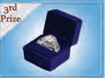
GIACIကျောက်စိမ်းပန်းကင်ပွင့်

ဝတ္ထုပိုင်ခွင့်ရရှိချက်တာဝန်ကူးအမှတ်(၈)နံပါတ်အောင် တည်ဆောက်ထားပါသည်။