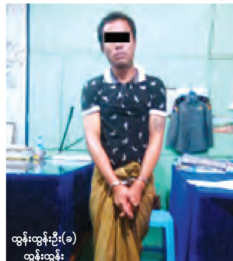
ဝင်းနိုင်