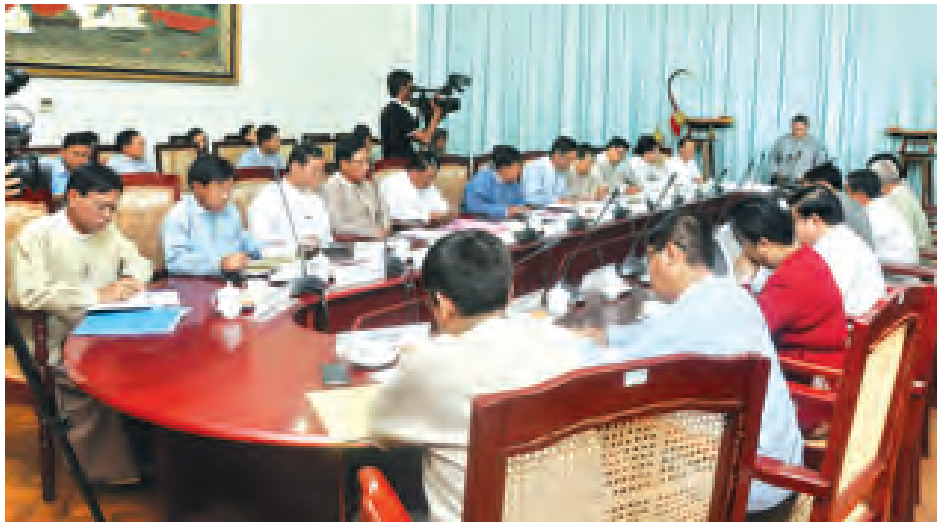
အသီးသီး၏ ဥက္ကဋ္ဌများ၊ အတွင်းရေးမှူးများနှင့် တာဝန်ရှိသူများက သက်ဆိုင်ရာကဏ္ဍအလိုက် ဆွေးနွေးခဲ့ကြသည်။

ရွက်နိုင်ရေးတို့နှင့်စပ်လျဉ်း၍ ပြောကြားသည်။ ယင်းနောက် အမျိုးသားစီမံကိန်းနှင့် စီးပွားရေးဖွံ့ဖြိုးတိုးတက်မှုဝန်ကြီးဌာန ပြည်ထောင်စုဝန်ကြီး ဒေါက်တာကလေးက အာဆီယံစီးပွားရေးမဏ္ဍိုင်နှင့် စပ်လျဉ်းသည့် ကိစ္စရပ်များကို ဆွေးနွေးပြောကြားသည်။ ထို့နောက် (၂၅)ကြိမ်မြောက် အာဆီယံထိပ်သီးအစည်းအဝေးနှင့် ဆက်စပ်အစည်းအဝေးများ ကျင်းပရေးနှင့်စပ်လျဉ်း၍ ဆက်တိုက်မတီ