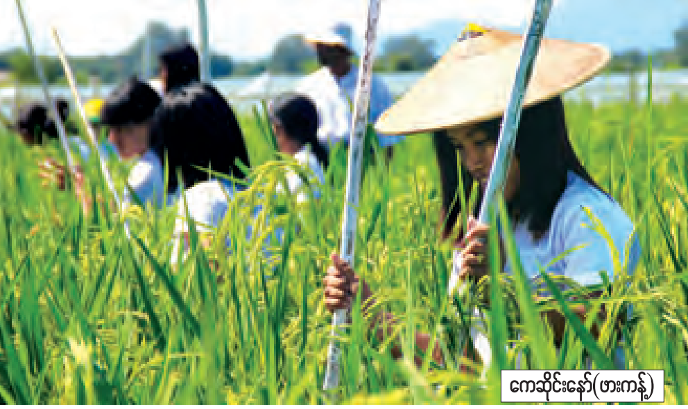
ကချင်ပြည်နယ် မိုးညှင်းမြို့နယ် စိုက်ပျိုးရေးဦးစီးဌာနက ကြီးပျားဖြင့် ပုလဲသွယ် (၁) အထူးအထွက်တိုးစမ်းပျိုးစပါး (F-1) ထုတ်လုပ်ရေး ဝတ်မှုန်ကုမ္ပဏီကို အောက်တိုဘာ ၂၁ ရက်က အင်ကြင်းကုန်းကျေးရွာအုပ်စု ကွင်းအမှတ် (၃၀၈) မျိုးစေ့ထုတ်စိုက်ခင်း ငါးစောညို ပြုလုပ်ခဲ့ပုံ။