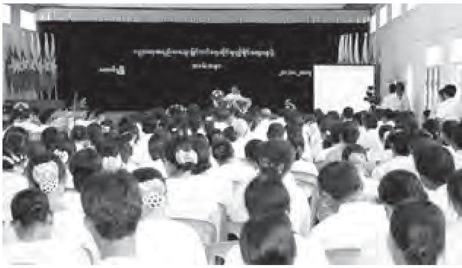
နှင့် ဆက်စပ်လျက်ရှိသော ဥပဒေ များကို တင်ပြဆွေးနွေးကြသည်။ ထို့နောက် တက်ရောက်လာသူ များက ပညာရေးနှင့် ပတ်သက်သည့် များကို ဆွေးနွေးမေးမြန်းကြရာ တာဝန်ရှိသူများက ပြန်လည်ဖြေကြား ဆွေးနွေးသည်။ အဆိုပါ အခမ်းအနားသို့ တောင်ငူတက္ကသိုလ်မှ ပါမောက္ခများ၊ ဆရာ ဆရာမများ၊ တောင်ငူကွန်ပျူ တာတက္ကသိုလ်မှ ဆရာ ဆရာမများ၊ စိတ်ပါဝင်စားသူများနှင့် ပညာရေး နယ်ပယ်အသီးသီးမှ ပညာရှင်များ တက်ရောက်ကြပြီး ပဲခူးတိုင်းဒေသကြီး လွှတ်တော်ဥက္ကဋ္ဌ ဦးဝင်းတင်က နိဂုံးချုပ် အမှာစကားပြောကြား၍ အခမ်းအနားကို ရုပ်သိမ်းကြောင်း သိရသည်။

ပညာရေးအရည်အသွေးမြှင့်တင် မှုဆိုင်ရာ ညှိနှိုင်းဆွေးနွေးပွဲ အခမ်း အနားကို အောက်တိုဘာ ၂၀ ရက် မွန်းလွဲ ၁ နာရီက တောင်ငူမြို့ ခပေါင်း ခန်းမ၌ ကျင်းပသည်။ (ယာဝု) အခမ်းအနားတွင် ပဲခူးတိုင်း ဒေသကြီးအစိုးရအဖွဲ့၊ လူမှုရေးဝန်ကြီး ဒေါက်တာကျော်ဦးက အမှာစကား ပြောကြားပြီး ရန်ကုန်ပညာရေး တက္ကသိုလ် ပါမောက္ခချုပ် ဒေါက်တာ အောင်မင်းက လူထုပူးပေါင်းပါဝင် မှုဖြင့် ပညာရေး အရည်အသွေး မြှင့်တင် အကောင်အထည်ဖော်ရေး အစီအစဉ်ကို တင်ပြဆွေးနွေးသည်။ ယင်းနောက် ရန်ကုန်အဝေးသင် တက္ကသိုလ် ပါမောက္ခချုပ် ဒေါက်တာ လှတင်က ပညာရေးအရည်အသွေး မြှင့်တင်မှုဆိုင်ရာ ဆောင်ရွက်ချက်များ ကို ရှင်းလင်းတင်ပြပြီး ဥပဒေပြုရေး လုပ်ငန်းအဖွဲ့မှ အဖွဲ့ဝင် ဥပဒေပညာ ရှင် ပါမောက္ခ ဒေါက်တာတင်မေ ထွန်းက အမျိုးသားပညာရေးဥပဒေ နှင့် ဆက်စပ်လျက်ရှိသော ဥပဒေ များကို တင်ပြဆွေးနွေးကြသည်။ ထို့နောက် တက်ရောက်လာသူ များက ပညာရေးနှင့် ပတ်သက်သည့် များကို ဆွေးနွေးမေးမြန်းကြရာ တာဝန်ရှိသူများက ပြန်လည်ဖြေကြား ဆွေးနွေးသည်။ အဆိုပါ အခမ်းအနားသို့ တောင်ငူတက္ကသိုလ်မှ ပါမောက္ခများ၊ ဆရာ ဆရာမများ၊ တောင်ငူကွန်ပျူ တာတက္ကသိုလ်မှ ဆရာ ဆရာမများ၊ စိတ်ပါဝင်စားသူများနှင့် ပညာရေး နယ်ပယ်အသီးသီးမှ ပညာရှင်များ တက်ရောက်ကြပြီး ပဲခူးတိုင်းဒေသကြီး လွှတ်တော်ဥက္ကဋ္ဌ ဦးဝင်းတင်က နိဂုံးချုပ် အမှာစကားပြောကြား၍ အခမ်းအနားကို ရုပ်သိမ်းကြောင်း သိရသည်။