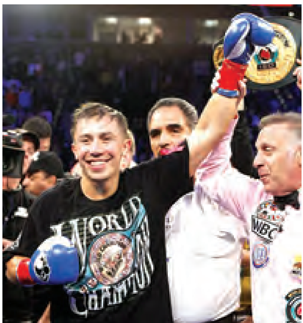
စံချိန်တင်ထားသူဖြစ်သည်။ “ရုဘိုင်အိုက လက်ဝှေ့သမားကောင်း တစ်ဦးပါ။ သူ့ကို ကျွန်တော်လေးစားပါတယ်။ ရုဘိုင်အိုကို လဲကျသွားစေတဲ့ လက်သီး ချက်ကို ခက်ခက်ခဲခဲ ထိုးခဲ့ရတာပါ”ဟု ဂိုလော့ပ်ကင်က ပြောသွားသည်။ လာမည့် အောက်တိုဘာ ၂၅ ရက်တွင် မိုနာကို၌ ထိုးသတ်မည့် အိတလီ နိုင်ငံသား ဒိုမီနီကိုပေါဒါ နှင့် အင်္ဂလန်နိုင်ငံသား မာတင်မာရေတို့ပွဲမှ အနိုင် ရရှိသူသည် လာမည့် ၂၀၁၅ခုနှစ် ဖေဖော်ဝါရီလအတွင်း ဂိုလော့ပ်ကင်နှင့် ထိုးသတ်ခွင့်ရရှိမည်ဖြစ်သည်။

ဩဂုတ် ၁၄ ရက်တွင် ကိုလံဘီယာနိုင်ငံသား မိလ်တန် နွန်ကို အလဲထိုးအနိုင်ယူကာ WBA မှတ်တမ်း တန်း ချန်ပီယံခါးပတ်ပိုင်ရှင်ဖြစ်လာခဲ့ပြီး ၂၀၁၁ ခုနှစ် ဒီဇင်ဘာ ၉ ရက်တွင် အမေရိကန်နိုင်ငံသား လာဂျူအန် ဆီမွန်အား အနိုင်ယူကာ IBO မှတ်တမ်းတန်း ခါးပတ်ရရှိခဲ့သူဖြစ်။