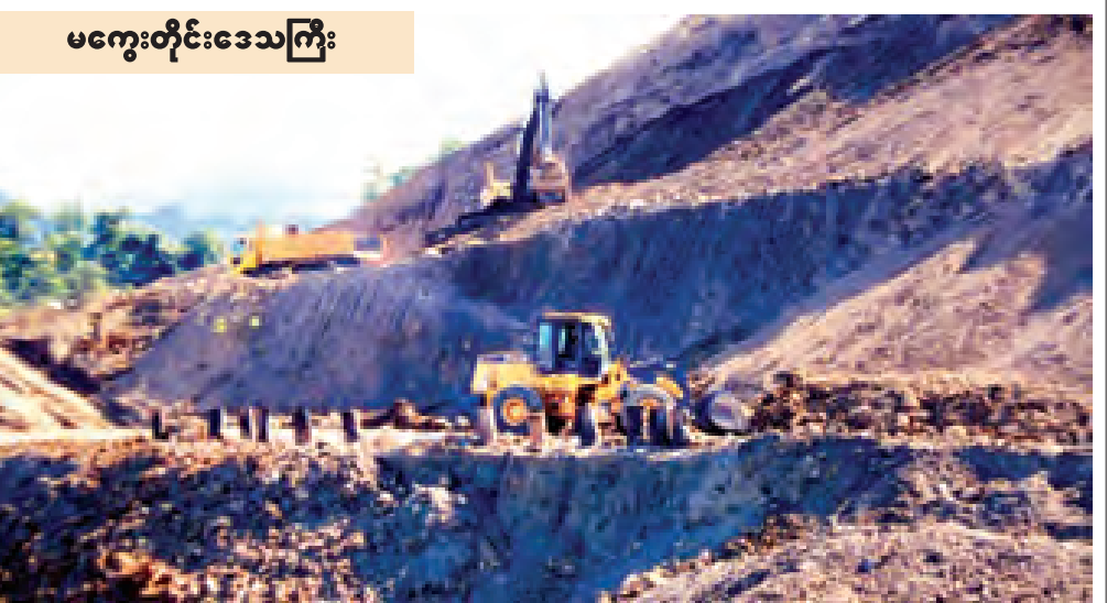
မကွေးတိုင်းဒေသကြီး ဝန်ကြီးချုပ် ဦးကျော်စွာနှင့် အဖွဲ့ဝင်များသည် တိုးချဲ့ဆောင်သစ်ကို လှည့်လည်ကြည့်ရှုစစ်ဆေးကြသည်။

ကချင်ပြည်နယ်အစိုးရအဖွဲ့ရုံး တိုးချဲ့ဆောင်သစ်ဖွင့်ပွဲအခမ်းအနားကို အောက်တိုဘာ ၁၈ ရက် နံနက်က မြစ်ကြီးနားမြို့ ပြည်နယ်အစိုးရအဖွဲ့ရုံးအတွင်းရှိ အဆိပ်တိုးချဲ့ အဆောက်အအုံနှင့် ကျင်းပရာ ပြည်နယ်ဝန်ကြီးချုပ်ဦးလွင်ဝန်ဆိုင်ခန်းက တိုးချဲ့ဆောင်သစ်ကို ဖဲကြိုးဖြတ် ဖွင့်လှစ်ပေးပြီး ကမ္ဘည်းမော်ကွန်းကို ပြည်နယ်ဝန်ကြီးချုပ်၊ ပြည်နယ်လွှတ်တော်ဥက္ကဋ္ဌ၊ ပြည်နယ်တရားလွှတ်တော်တရားသူကြီးချုပ် ဦးတူးကျား၊ လွှတ်တော်ဒုတိယဥက္ကဋ္ဌ၊ ပြည်နယ်ဝန်ကြီးများနှင့် အစိုးရအဖွဲ့ အတွင်းရေးမှူးတို့က အမွှေးနံ့သာရည်ဖြင့် ပတ်ဖျန်းပေးကြသည်။