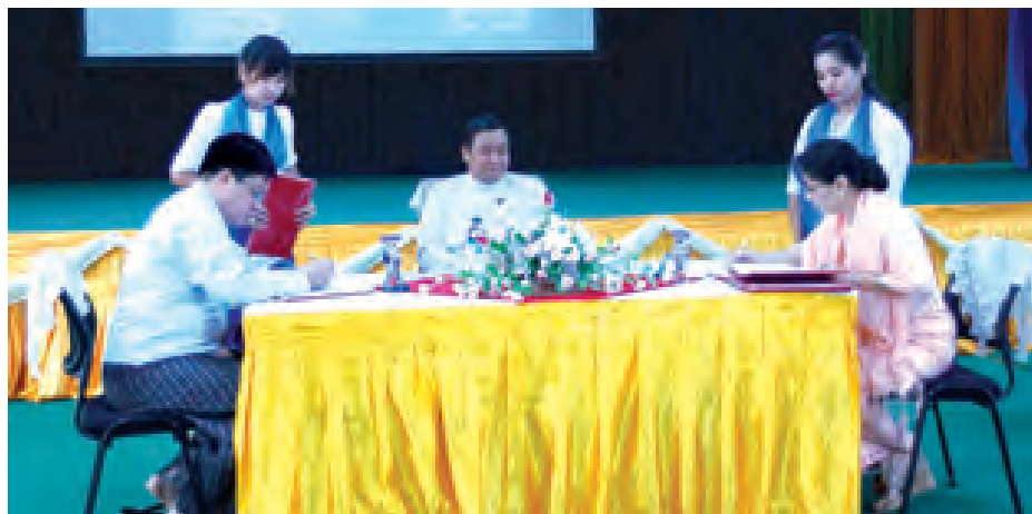
အဆိုပါ လက်မှတ်ရေးထိုးပွဲ အခမ်းအနားသို့ ဒုတိယဝန်ကြီး ဦးပိုင်ထွေးနှင့် ဌာနဆိုင်ရာအကြီးအကဲများ၊ မြန်မာ့အသံနှင့် ရုပ်မြင်သံကြားနှင့် အကျိုးတူပူးပေါင်းဆောင်ရွက်လျက်ရှိသော ရုပ်သံလွှင့်ကုမ္ပဏီများနှင့် FM ကုမ္ပဏီများမှ တာဝန်ရှိသူများ တက်ရောက်ခဲ့ကြသည်။ (မြန်မာ့အလင်း)

နေပြည်တော် အောက်တိုဘာ ၂၃ မြန်မာ့အသံနှင့် ရုပ်မြင်သံကြားနှင့် ရုပ်သံလွှင့်ကုမ္ပဏီများ၊ FM ကုမ္ပဏီများအကြား ချုပ်ဆိုခွဲသောမူလစာချုပ်အပေါ် ပြင်ဆင်ပြည့်စွက်သည့်စာချုပ်များ လက်မှတ်ရေးထိုးခဲ့ကြောင်း သိရသည်။ (ယာဝု) အဆိုပါစာချုပ်များကို မြန်မာ့အသံနှင့် ရုပ်မြင်သံကြား ညွှန်ကြားရေးမှူးချုပ် ဦးတင်ဆွေနှင့် သက်ဆိုင်ရာကုမ္ပဏီများမှ တာဝန်ရှိသူများက လက်မှတ်ရေးထိုးကြပြီး စာချုပ်များကို အပြန်အလှန်လဲလှယ်ခဲ့ကြသည်။