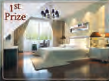
(၂၅)ထပ်ရှိ အိမ်ခန်းစံပုံပါ CONDOMINIUM တစ်ခန်း

ကံမ်းမဲ ပွင့်လှစ်ပေးမည့်နေ့ ၂၀၁၅ခုနှစ် ဖေဖော်ဝါရီလ (၁၂)ရက်နေ့