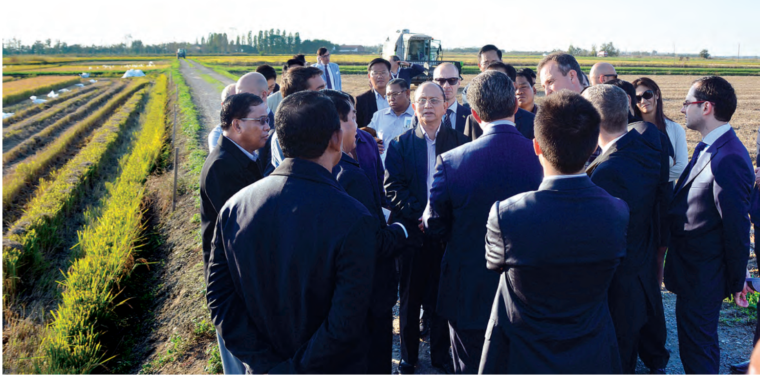
အိတ်လီနိုင်ငံ စွမ်းအင်ကုမ္ပဏီ Eni မှ တည်ခင်းစဉ်အတွင်း အလုပ်သဘော ပြောစာစားပွဲသို့ နိုင်ငံတော်သမ္မတ ဦးသိန်းစိန် တက်ရောက်ရာ အမှုဆောင်အရာရှိချုပ် မစ္စတာ ကလော်ဒီရို ဒက်ကာဇီက ကြိုဆိုနှုတ်ဆက်စဉ်။ (သတင်းစဉ်)