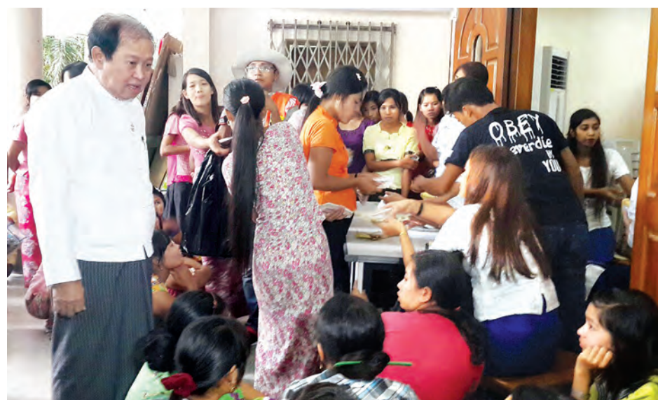
နေပြည်တော် အောက်တိုဘာ ၁၈

အလုပ်သမား၊ အလုပ်အကိုင်နှင့် လူမှုဖူလုံရေး ဝန်ကြီးဌာန ပြည်ထောင်စုဝန်ကြီး ဦးအေးမြင့်သည် အောက်တိုဘာ ၁၇ ရက်က လှိုင်သာယာစက်မှုဇုန် ကနောင်ခန်းမ၌ ကျင်းပသည့် Master Sports ဖိနပ် စက်ရုံမှ အလုပ်သမား ၇၅၇ ဦး၏ ၂၀၁၄ ခုနှစ် ဇွန်လ အတွက် လုပ်ခလစာနှင့် ဥပဒေနှင့်အညီ ခံစားခွင့်ပေး အပ်ရမည့် စက်ရုံပိတ်နှစ်နာကြေးပေးအပ်ခြင်း အခမ်း