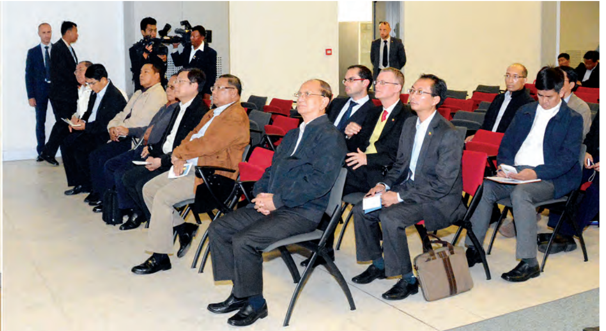
နိုင်ငံတော်သမ္မတ ဦးသိန်းစိန်နှင့်အဖွဲ့ဝင်များ အီတလီစပါးမျိုးစေ့သုတေသနသို့ သွားရောက်လေ့လာရာ တာဝန်ရှိသူတစ်ဦးက ရှင်းလင်းတင်ပြစဉ်။