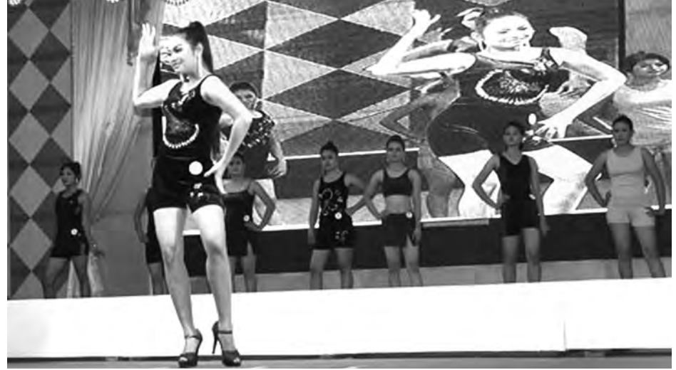
မကွေးတိုင်းဒေသကြီး အစိုးရ အဖွဲ့ဝန်ကြီးချုပ်ဖလား ငါးခရိုင် ကာယဗလမောင်နှင့် ကာယကြံ့ခိုင်မှုမယ်ပြိုင်ပွဲကို အောက်တိုဘာ ၁၆ ရက်က မကွေးမြို့တွင် ကျင်းပရာ ကာယကြံ့ခိုင်မှုမယ်ပြိုင်ပွဲတွင် ပါဝင်ယှဉ်ပြိုင်နေသည့် မယ်တစ်ဦးကို တွေ့ရစဉ်။ (ကာယဗလ မောင် ပြိုင်ပွဲတွင် ပွဲစဉ်(၁) ၇၅ ကီလိုတန်း သုံးဦး၊ ပွဲစဉ်(၂) ၆၀ ကီလိုတန်း ခြောက်ဦး၊ ပွဲစဉ်(၃) ၆၅ ကီလိုတန်း ခုနစ်ဦးနှင့် ကာယကြံ့ခိုင်မှုမယ်ပြိုင်ပွဲတွင် အရပ် ငါးပေသုံးလက်မ အောက် ၁၄ဦး၊ အရပ်ငါးပေ သုံးလက်မအထက် ၁၂ ဦး ပါဝင် ယှဉ်ပြိုင်ခဲ့သည်) ခင်မာလာ(မကွေး)

စာတည်းခင်ဗျား- မင်္ဂလာတောင်ညွန့်မြို့နယ် ဖွဲ့မြေရပ်ကွက် သိမ်ဖြူလမ်းရှိ အိမ်တစ်အိမ်၏ မြေညီထပ်နှင့်ပထမထပ်တို့အတွက် အသုံးပြုရန် လုပ်ငန်းသုံးမီးစက်ကြီးကို သိမ်ဖြူလမ်းနှင့်ဖွဲ့မြေလမ်း စည်ပင်နောက်ဖမ်းလမ်းကြားတွင် ချထားပါသည်။ အများမြင်သာသည့်နေရာတွင်ထားရှိခြင်း မဟုတ်သည့်အတွက် အကြောင်းတစ်စုံတစ်ရာပေါ်ပေါက်လာပါက လမ်းသူလမ်းသားများအနေဖြင့် မီးဘေးအန္တရာယ်စိုးရိမ်နေကြ၍ အဆိုပါမီးစက်ကြီးကို အခြားကုမ္ပဏီလုပ်ငန်းများနည်းတူ သိမ်ဖြူလမ်းမကြီးပေါ်တွင် ပြောင်းရွှေ့ထားရန်အတွက် ဆောင်ရွက်ပေးနိုင်ပါရန် တင်ပြအပ်ပါသည်။ လမ်းသူလမ်းသားများ