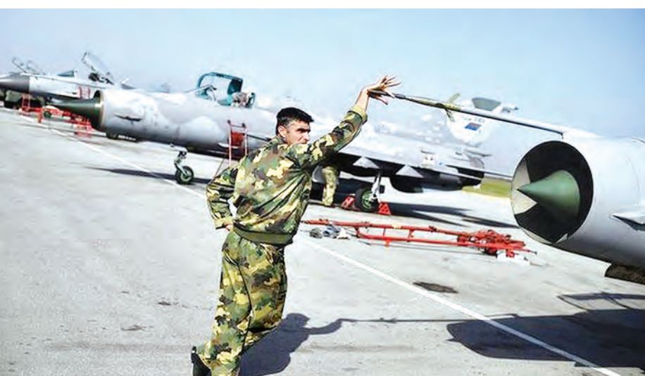
မန်က ပြောခဲ့သည်။ ရိုက်တာ သတင်းဌာနသည် အဆိုပါသတင်းနှင့် ပတ်သက်ပြီး ချက်ချင်းအတည်မပြုနိုင်သေးပေ။ အမေရိကန် ဗဟိုကွပ်ကဲရေးဌာနက ဆီးရီးယားတွင် လေယာဉ်ပျံသန်း မောင်းနှင်ခဲ့ခြင်းသည် အိုင်အက်စ်တို့ကို လုံးဝဂရုမစိုက်သည့်သဘော ဖြစ်ကြောင်း ပြောခဲ့သည်။ အမေရိကန် ဦးဆောင်သော တပ်ဖွဲ့များသည် ဆီးရီးယားနှင့် အီရတ်အခြေစိုက် အိုင်အက်စ်စစ်

ကိုဘာနီ အောက်တိုဘာ ၁၈ ဆီးရီးယားနိုင်ငံရှိ အိုင်အက်စ်စစ်သွေးကြွအဖွဲ့ထံ ဝင်ရောက်သွားသည့် အီရတ်ပိုင်းလော့များက အသိမ်းခံ ဂျက်လေယာဉ်သုံးစင်းကို မောင်းနှင်နိုင်ရန် အဖွဲ့ဝင်များကို လေ့ကျင့်ပေးနေသည်။ အဆိုပါအဖွဲ့သည် စစ်ပွဲကို ထိန်းချုပ်ထားသူများဖြစ်ကြောင်း သောကြာနေ့က ပြောခဲ့သည်။ ထိုသို့ မောင်းနှင်မှုသည် စစ်သွေးကြွအုပ်စုအတွက် ပထမဆုံးအကြိမ် လေယာဉ်မောင်းနှင်မှုပင်ဖြစ်သည်။ ဆီးရီးယားနှင့် အီရတ်တစ်ခွင်ကို သိမ်းပိုက်ခဲ့သော အဆိုပါ အုပ်စုသည် အလက်ပိုအရှေ့ဘက် သိမ်းပိုက်ခံ အယ်ဂျာရာဟ် စစ်လေတပ်စခန်းပေါ်တွင် လေယာဉ်ပျံသန်းမောင်းနှင်ခဲ့ကြောင်း ဗြိတိန်အခြေစိုက် ဆီးရီးယားလူ့အခွင့်အရေး လေ့လာစောင့်ကြည့်သူ ရာပီအဗ္ဗဒူရာ