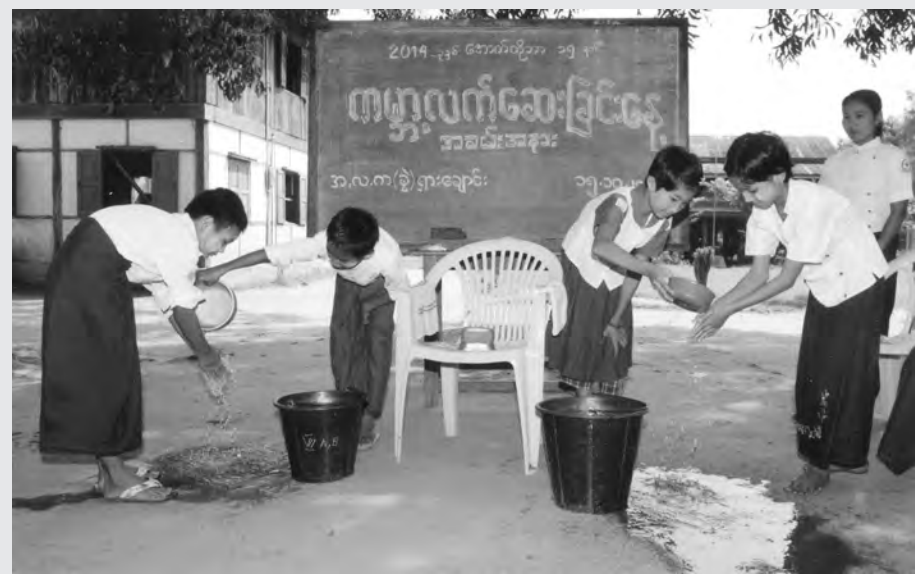
နေပြည်တော်ကောင်စီနယ်မြေ လယ်ဝေးမြို့နယ် ရှားချောင်းကျေးရွာ အလယ်တန်းကျောင်းခွဲ၌ ကမ္ဘာ့လက်ဆေးခြင်းနေ့ အခမ်းအနားကျင်းပရာ ကျောင်းသား ကျောင်းသူလေးများအား လက်ဆေးခြင်းအလေ့အထများ သင်ကြားပေးနေစဉ်။ (မြို့နယ် ပြန်/ဆက်)