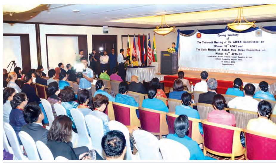
ပြည်ထောင်စုဝန်ကြီး ဒေါက်တာဒေါ်မြတ်မြတ်အုန်းခင် (၆)ကြိမ်မြောက် အာဆီယံအမျိုးသမီးရေးရာ ကော်မတီ+၃ အစည်းအဝေး၌ အမှာစကားပြောကြားစဉ်။ (သတင်းစဉ်)

မြန်မာနိုင်ငံတွင် နိုင်ငံလူဦးရေ ၏ ထက်ဝက်ကျော်ဖြစ်သော အမျိုး သမီးများသည် နိုင်ငံတော်၏အရေး ပါသော ပြုပြင်ပြောင်းလဲရေးလုပ် ငန်းများတွင် အင်အားစုတစ်ရပ် အဖြစ် ပါဝင်နေသည်ကို နိုင်ငံတော် ကအသိအမှတ်ပြုထားပြီး ဖြစ်သည်။ ထို့ပြင် အမျိုးသား အမျိုးသမီး တန်းတူညီမျှရေး ခွဲခြားဆက်ဆံမှု ပပျောက်ရေးဆိုင်ရာ လုပ်ငန်းအစီ အစဉ်များချမှတ်ခြင်း၊ ဥပဒေများ ပြင်ဆင်ခြင်း၊ ဥပဒေသစ်များပြဋ္ဌာန်း ရန် သုတေသနစာတမ်း၊ အမျိုးသား အမျိုးသမီးလူမှုရေးရာအလေ့အထ၊ ယဉ်ကျေးမှုစံနှုန်းများနှင့် သတ်မှတ် ချက်များပါဝင်သည့် စာတမ်းများ၊ အမျိုးသမီးရေးရာ လေ့လာဆန်းစစ်