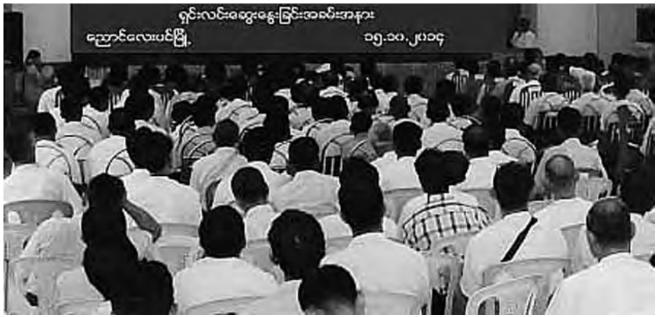
ကော်မရှင် ဖွဲ့စည်းခြင်းနှင့် လုပ်ငန်းဆောင်ရွက်ချက်များကို ရှင်းလင်းဆွေးနွေးကြသည်။ (အပေါ်ပုံ)

ဥက္ကဋ္ဌ ဦးစစ်မြိုင်က လူ့အခွင့်အရေးဆိုင်ရာ အခြေခံအနှစ်သာရနှင့် ဖွဲ့စည်းပုံအခြေခံဥပဒေပါ နိုင်ငံသားများနှင့် မူလအခွင့်အရေးအကြောင်းကို လည်းကောင်း၊ ကော်မရှင်အဖွဲ့ဝင် ဦးစိုးဘုန်းမြိုင်က ကမ္ဘာ့လူ့အခွင့်အရေး ကြေညာစာတမ်းပါ ပြဋ္ဌာန်းချက်များကို လည်းကောင်း ကော်မရှင်အဖွဲ့ဝင် ဦးယုလွင်အောင်က မြန်မာနိုင်ငံ အမျိုးသားလူ့အခွင့်အရေး