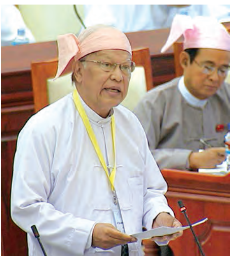
မြန်မာနိုင်ငံ အမျိုးသား လူ့အခွင့်အရေး ကော်မရှင် ဥက္ကဋ္ဌ ဦးဝင်းမြ ရှင်းလင်း ဖြေကြားစဉ်။ (သတင်းစဉ်)

နေပြည်တော် အောက်တိုဘာ ၁၇ ပထမအကြိမ် ပြည်သူ့လွှတ်တော် (၁၁) ကြိမ်မြောက် ပုံမှန်အစည်းအဝေး (၁၉) ရက်မြောက်နေ့ကို ယနေ့ နံနက်ပိုင်းတွင် ဆက်လက်ကျင်းပရာ ကန်ကြီးထောင့် မဲဆန္ဒနယ်မှ ဦးကျော်ဝင်း၏ အမျိုးသားလူ့အခွင့်အရေးကော်မရှင်သည် သီးခြားလွတ်လပ်သည့် အဖွဲ့ဖြစ်၊ မဖြစ်နှင့် ကော်မရှင်၏ ဆောင်ရွက်မှုကို သိလိုခြင်းမေးခွန်းနှင့် စပ်လျဉ်း၍ မြန်မာနိုင်ငံ အမျိုးသားလူ့အခွင့်အရေးကော်မရှင်ဥက္ကဋ္ဌ ဦးဝင်းမြက ဥပဒေပြဋ္ဌာန်းချက်များအရ မြန်မာနိုင်ငံ အမျိုးသားလူ့အခွင့်အရေး ကော်မရှင်သည် နိုင်ငံတော်ဖွဲ့စည်းပုံ ဥပဒေပါ နိုင်ငံသားများ၏ မူလအခွင့်အရေးများကို ပိုမို၍ ကာကွယ်စောင့်ရှောက်နိုင်ရန် အလို့ငှာ နိုင်ငံတော်က ဥပဒေပြဋ္ဌာန်း၍ ဖွဲ့စည်းပေးပြီး နိုင်ငံတော်၏ဘဏ္ဍာငွေပံ့ပိုးမှုဖြင့် လွတ်လပ်စွာ ဆောင်ရွက်သည့် အဖွဲ့အစည်းတစ်ရပ်ဖြစ်ပါကြောင်း၊ ကော်မရှင်အနေဖြင့် လူ့အခွင့်အရေး မြှင့်တင်ရေးနှင့် ကာကွယ်ရေးကို မဟာဗျူဟာစီမံကိန်းနှင့် လုပ်ငန်းစီမံချက်များနှင့်အညီ ဆက်လက်ဆောင်ရွက်ပြီး အစီရင်ခံစာ ညှိနှိုင်းပြုစုခြင်းနှင့် ကုလသမဂ္ဂ လူ့အခွင့်အရေးကောင်စီသို့ သွား