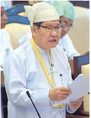
ဒုတိယဝန်ကြီး ဦးခင်ဇော် ဖြေကြားစဉ်။ (သတင်းစဉ်)

နေပြည်တော် အောက်တိုဘာ ၁၇ ပထမအကြိမ် အမျိုးသားလွှတ်တော် (၁၁)ကြိမ်မြောက် ပုံမှန်အစည်းအဝေး (၁၉) ရက်မြောက်နေ့ကို ယနေ့နံနက် ၁၀ နာရီတွင် အမျိုးသားလွှတ်တော် အစည်းအဝေးခန်းမ၌ ဆက်လက်ကျင်းပသည်။ အစည်းအဝေးတွင် ပဲခူးတိုင်းဒေသကြီး မဲဆန္ဒနယ်အမှတ် (၁) မှ ဦးစောမော်ထွန်း၏ ကမ္ဘာတစ်ဝန်း ရာသီဥတုပြောင်းလဲလာခြင်းကြောင့် ဖြစ်ပေါ်လာနိုင်သော သီးနှံဖျက်ပိုးမွှားနှင့် သီးနှံပင်ရောဂါများကို ကြိုတင်ထုတ်ချက်ကာကွယ်ပေးရန် အစီအစဉ် ရှိ/မရှိ မေးခွန်းနှင့်စပ်လျဉ်း၍ လယ်ယာစိုက်ပျိုးရေးနှင့် ဆည်မြောင်းဝန်ကြီးဌာန ဒုတိယဝန်ကြီး ဦးခင်ဇော်က ကမ္ဘာ့ရာသီဥတုပြောင်းလဲလာမှုကြောင့် သီးနှံဖျက်ပိုးမွှားနှင့် သီးနှံဖျက်ရောဂါများ ကျရောက်ဖျက်ဆီးမှုကာကွယ်နိုင်ရန် အတွက် ရာသီအလိုက် စိုက်ပျိုးလျက်ရှိသည့် သီးနှံများတွင် ကျရောက်ဖျက်ဆီးတတ်သည့် ပိုးမွှား၊ ရောဂါများကို အချိန်နှင့်တစ်ပြေးညီ ကြိုတင်သတိပေးချက်များ ထုတ်ပြန်ပေးခြင်းကို