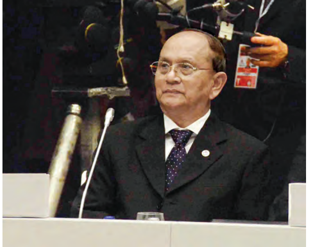
နိုင်ငံတော်သမ္မတဦးသိန်းစိန် (၁၀)ကြိမ်မြောက် အာရှ-ဥရောပ ထိပ်သီးအစည်းအဝေးသို့ တက်ရောက်စဉ်။

မိမိတို့ဆောင်ရွက်နေသော ခိုင်မာသည့်ဒီမိုကရေစီအခြေခံများ ချမှတ်