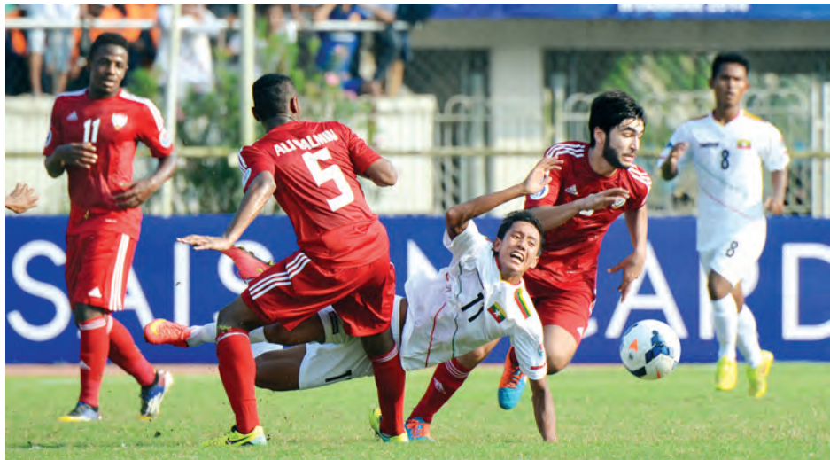
အာရှယူ-၁၉ ပြိုင်ပွဲ၌ မြန်မာအသင်းနှင့် ယူအေအီးအသင်းတို့ အကြိတ်အနယ်ယှဉ်ပြိုင်ကြစဉ်။

မြန်မာယူ-၁၉ အသင်းအနိုင်ရရှိရန်အတွက် မြန်မာဘောလုံးချစ်ပရိသတ်များမှာ နေပူပူထဲတွင် ကွင်းပြည့်ကွင်းလျှံ လာရောက်ကာ တစ်ခဲနက်အားပေးခဲ့ကြသည်။ မြန်မာဘောလုံးပရိသတ်များ၏တစ်ခဲနက်အားပေးမှုမှာ မြန်မာယူ-၁၉ အသင်းအတွက် အဓိကအားတစ်ခုဖြစ်ခဲ့ပြီး တိုက်စစ်မှူးသန်းပိုင်၏ ဆုံးပြိုင်ပွဲအဖြစ် ၁၉၇၂ မြူးနစ်အိုလံပစ်ပြိုင်ပွဲကို ယှဉ်ပြိုင်ခဲ့ဖူးပြီး ၄၂ နှစ်ကြာမှ ကမ္ဘာ့အဆင့်ပြိုင်ပွဲတစ်ခုကို ယှဉ်ပြိုင်နိုင်ခဲ့ခြင်းဖြစ်သည်။