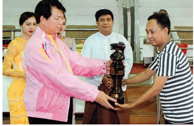
မြန်မာနိုင်ငံစစ်တုရင်အဖွဲ့ချုပ်က ကြီးမှူးကျင်းပသော ၂၀၁၄ ခုနှစ် မြန်မာအိုးပင်း စစ်တုရင်ပြိုင်ပွဲဆုချီးမြှင့်ပွဲကို အောက်တိုဘာ ၁၅ ရက်က ရန်ကုန်မြို့ အောင်ဆန်းအားကစားပြိုင်ဝင်း မိုးလုံလေလုံခန်းမ၌ ကျင်းပရာ မြန်မာအိုးပင်းစစ်တုရင်ပြိုင်ပွဲတွင် တံခွန်စိုက်ဆုပေးလားရရှိသွားသော စည်သူ (လယ်/ဆည်)ကို မြန်မာနိုင်ငံစစ်တုရင်အဖွဲ့ချုပ် ဥက္ကဋ္ဌဦးမောင်မောင်လွင်က ဆုချီးမြှင့်စဉ်။

အဆိုပါဆိုင်ခွဲတွင် ကျောက်စိမ်း၊ ပတ္တမြား၊ နီလာ၊ ပုလဲ၊ ဘယ်လ်ဂျီယံစိန်နှင့် အခြားကျောက်မျက်ရတနာမျိုးစုံကို ဝယ်ယူရရှိနိုင်ကြောင်း Jade Golf Putter ကိုလည်း မြန်မာနိုင်ငံတွင် ပထမဦးဆုံးတီထွင်ထုတ်လုပ်ရောင်းချပေးကြောင်း၊ နိုင်ငံတကာအဆင့်မီ ဒီဇိုင်းများကိုလည်း စိတ်တိုင်းကျ ပြုလုပ်ပေးနေကြောင်း၊ ဝယ်ယူအားပေးသူများ၏ စိတ်တိုင်းကျ များပြားမှုများကိုလည်း လက်ခံပြုလုပ်ပေးနေကြောင်း၊ ဝယ်ယူပြီးပစ္စည်းများ ပြန်လည်လဲလှယ် အသစ်ပြုလုပ်ချင်သူများကို ၁၅ ရာခိုင်နှုန်းလျှော့ချပြီး ပစ္စည်းမှန်၊ ဈေးနှုန်းမှန်ဖြင့် ရောင်းချပေးနေကြောင်း သတင်းရရှိသည်။ (သတင်းစဉ်)