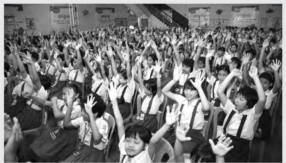
ကမ္ဘာလုံးဆိုင်ရာ လက်သန့်ရှင်းရေးနေ့ အထိမ်းအမှတ်အခမ်းအနားကို အောက်တိုဘာ ၁၅ ရက်က ရန်ကုန်တိုင်းဒေသကြီး အထက(၂) စမ်းချောင်းမြို့နယ်၌ ကျင်းပရာ ကျောင်းသား ကျောင်းသူများအား စနစ်တကျ လက်ဆေးခြင်းအလေ့အထများကို သင်ကြားပြသပေးစဉ်။