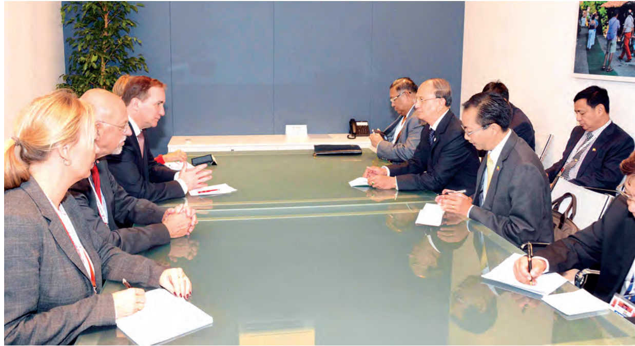
နိုင်ငံတော်သမ္မတ ဦးသိန်းစိန် ဆွီဒင်နိုင်ငံဝန်ကြီးချုပ် မစ္စတာ စတော့ဖန် လော့ဗ်ဗန်နှင့် တွေ့ဆုံဆွေးနွေးစဉ်။ (သတင်းစဉ်)

သည့်အဆိုကို နှစ်စဉ်တင်သွင်းနေမှု အား ရပ်ဆိုင်းရေးတို့ကို ဆွေးနွေး ခဲ့ကြသည်။