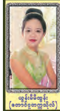
မယွန်းမိမိထွန်း (တောင်ငူတက္ကသိုလ်)