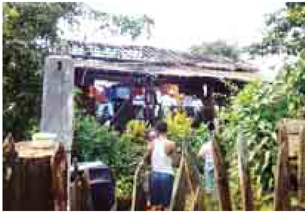
ကသာ အောက်တိုဘာ ၁၀

ကသာခရိုင် ကသာမြို့ အမှတ်(၅)ရပ်ကွက် မိုးကုတ်ရိပ်သာ အနောက်လမ်းတွင် အောက်တိုဘာ ၁၀ ရက် မွန်းလွဲ ၁ နာရီ ၁၀ မိနစ်က မီးရှူး၊ မီးပန်း ပစ်ဖောက်ရာမှ အိမ်