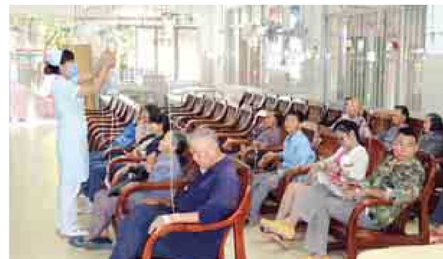
နန်နင်းမြို့၊ ဝုထန်ကျေးရွာအုပ်စု ဆေးရုံမှ ဒေသခံများအား ကျန်းမာရေးစောင့်ရှောက်မှုပေးနေစဉ်။

ယင်းတို့ကို တွေ့မြင်ရသည်မှာ မိမိတို့နိုင်ငံအဖို့ အတူယူဖွယ်ရာ ကောင်းလှသည်။ ဈေးကွက်ရှိပြီး သားဖြစ်သည့် မြန်မာပြည်တွင် ရေလည်းရှိ၊ မြေလည်းရှိ၊ စိုက်ပျိုးရေး ဆောင်ရွက်နိုင်သည့် အခြေခံကောင်း များ ရှိနေသည့်အတွက် သစ်သီးဝလံ များနှင့် ဟင်းသီးဟင်းရွက်များကို ယခုထက် ပိုမိုစိုက်ပျိုးပြီးထွက်ရှိလာ မည့် သစ်သီးဝလံများနှင့် ဟင်းသီး ဟင်းရွက်များကို အရည်အသွေးစစ် ဆေးရေးဌာနများ တည်ဆောက်ပြီး အရည်အသွေးစစ်ဆေးကာ ပြည်ပ နိုင်ငံများသို့ တင်ပို့နိုင်ရန်ကြိုးစားသင့် ပေသည်။