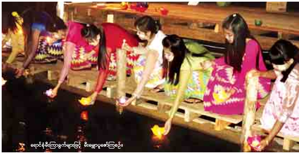
ရောင်စုံမီးကြာရွက်များဖြင့် မီးမျှောပူဇော်ကြစဉ်။

ပဲခူးတိုင်းဒေသကြီး (အရှေ့ခြမ်း)ပဲခူးခရိုင် ရွှေကျင်မြို့နယ်၏ အထင်ကရ ဘာသာရေးပွဲတော်တစ်ခုဖြစ်ပြီး ရှေးနှစ်ပေါင်း ၁၆၃ နှစ်ကတည်းက အစဉ်အလာမပျက် နှစ်စဉ်ကျင်းပလာခဲ့သော သီတင်းကျွတ်မီးမျှောပူဇော်ပွဲတော်ကို အောက်တိုဘာ ၉ ရက် နံနက် ၉ နာရီက ရွှေကျင်မြို့နယ် ရွှေကျင်ချောင်းအတွင်းရှိ ဗဟိုမဏ္ဍပ်၌ ကျင်းပသည်။