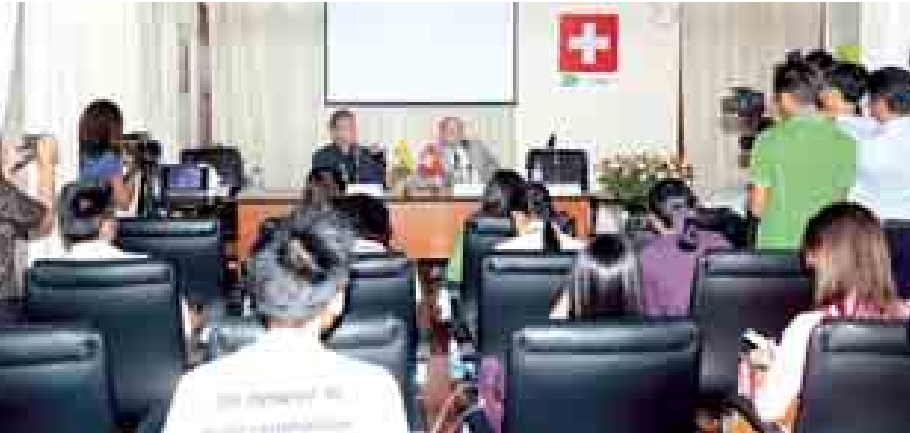
ရန်ကုန် အောက်တိုဘာ ၁၀