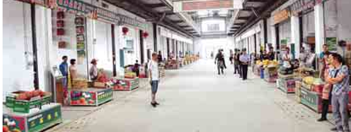
နန်နင်းမြို့ရှိ သစ်သီးဝလံ လက်ကားဈေး၌ ခင်းကျင်းပြသထားသော သစ်သီးဝလံဆိုင်ခန်းများကို တွေ့ရစဉ်။

ပစ္စည်းများ၊ ကွန်ပျူတာခန်းများနှင့် သင်ကြားရေး စက်ကိရိယာများက စုံလင်လှပြီး အဆိုပါ ဆေးတက္ကသိုလ် အနေဖြင့် တရုတ်ပြည်သူ့သမ္မတနိုင်ငံ အတွင်း နာမည်ကြီးသည့် ဆေး တက္ကသိုလ် ၂၀ တွင် တစ်ခုအပါအဝင် ဖြစ်ကြောင်း သိရသည်။ အဆိုပါ ဆေးတက္ကသိုလ်၏ အောက်ရှိ အမှတ်(၁) တွဲဖက်ဆေးရုံ မှာ ယင်းဆေးတက္ကသိုလ်နှင့် မလှမ်း မကမ်းတွင် တည်ဆောက်ထားသည့် ကို တွေ့ရှိရပြီး ဆေးရုံသို့ ကွမ်းရိုး အဝယ်ပြုလုပ်နေသည်ကို မြင်ရသည် မှာ အားကျစရာကောင်းလှသည်။