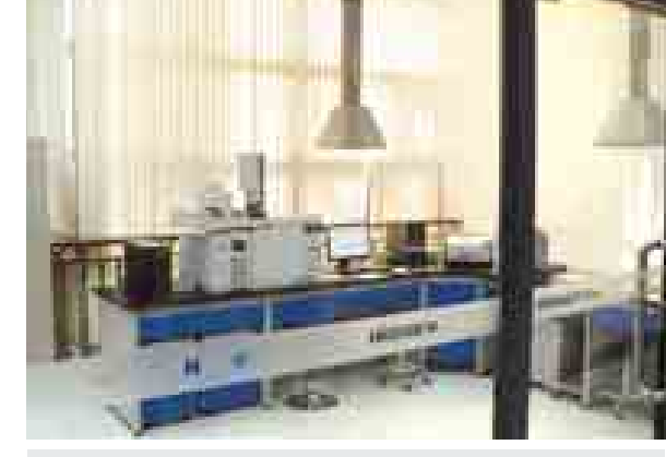
နန်နင်းမြို့၊ ကွမ်းရိုး Higreen လယ်ယာထွက်ကုန် ကုန်စည်စီးဆင်းမှု စင်တာရှိ လယ်ယာထွက်ကုန်အရည်အသွေးစစ်ဆေးစက်။

မျိုးမြင့်မြို့ဖွံ့ဖြိုးတိုးတက်မှုတို့ ဟန်ချက်ညီလှသည့် အဆောက် အအုံတို့ကို အစီအရီတွေ့မြင်ရ သည်။ ကျေးရွာအုပ်စုဆေးရုံ ဆိုသော်လည်း ဆရာဝန်အင်အား၊ ဆေးရုံသုံး စက်ကိရိယာပြည့်စုံမှု၊ ဒေသခံပြည်သူများအား ကျန်းမာ ရေးစောင့်ရှောက်မှု ဆောင်ရွက် ပေးနေမှုမှာ အားကျဖွယ်ရာ ကောင်းလှသလို တရုတ်တိုင်းရင်း ဆေးပညာဖြင့်လည်း ရောဂါအမျိုး မျိုးကို ကုသပေးလျက်ရှိသည်ကို တွေ့မြင်ရသည်။ ထိုမျှမက လူနာများကို သက်သေသင့် သက်သာ၊ ပေါ့ပေါ့ပါးပါးဖြင့် ဆေးသွင်းပေးနိုင်ရန် စီမံပေးထား သေးသည်။ ကျန်းမာရေး စောင့်ရှောက်မှု ပိုင်းတွင်သာမက ကမ္ဘာတိုင်းတွင် အစစအရာရာ ဖွံ့ဖြိုးတိုးတက်နေ သည့် တရုတ်ပြည်ကိုကြည့်ခြင်းဖြင့် မိမိတို့ တိုင်းပြည်ကိုလည်း အမှန် ပင် ဖွံ့ဖြိုးတိုးတက်စေချင်သည်။ ယင်းမှာ နိုင်ငံသားတိုင်း၏ ဆန္ဒ ဟု ထင်ပါသည်။ နိုင်ငံရေး အပြောင်းအလဲဖြင့် စတင်ခဲ့သော မြန်မာနိုင်ငံအဖို့ ကမ္ဘာ့နိုင်ငံရေး ဇာတ်ခုံပေါ်တွင် မျက်နှာပန်းလှချိန်၊ ကမ္ဘာ့စီးပွားရေး လုပ်ငန်းရှင်များ အနေဖြင့် ရင်းနှီးမြှုပ်နှံရန်အတွက် အထူးစိတ်ဝင်စားချိန်တွင် ပြုပြင် ပြောင်းလဲရေးနှင့် ငြိမ်းချမ်းရေး လုပ်ငန်းစဉ်ကြီးတွင် ပါဝင်ကြသ