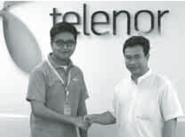
တစ်ဟုန်ထိုး တိုးတက်လာသော ဈေးကွက်နှင့် အာရှဒေသတွင်းရှိ Consumer App ဖန်တီးမှုတို့ကို အသိအမှတ်ပြုရန် ကျင်းပခြင်းဖြစ်ကြောင်း သိရသည်။ ညထန်းမြင့်

Digital Winners သည် တယ်လီနောအဖွဲ့မှ နှစ်စဉ်ကျင်းပသော တွေ့ဆုံပွဲတစ်ခုဖြစ်သည်။ အိုင်စီတီ ဆန်းသစ်တီထွင်သူများ၊ စီးပွားရေးလုပ်ငန်းရှင်တို့ကို အသိအမှတ်ပြုရန်ဖြစ်ကာ ဒေသတွင်းရှိ မီဒီယာ၊ နည်းပညာနှင့် ဆက်သွယ်ရေးလုပ်ငန်းများတွင် ဦးဆောင်လျက်ရှိသော ဆန်းသစ်တီထွင်သူများကိုလည်း တွေ့ဆုံစေမည့် ပွဲတစ်ခုဖြစ်သည်။ အာရှဒေသတွင်းမှ ဆန်းသစ်တီထွင်သူများ၊ စီးပွားရေးလုပ်ငန်းရှင်များကို တွေ့ဆုံစေရန် စီစဉ်ပြုလုပ်သော ပွဲဖြစ်သည်။ Digital Winners ၏ အာရှအကောင်းဆုံး App ပြိုင်ပွဲသည် မိုဘိုင်းခွဲတစ်ခုအဖြစ်