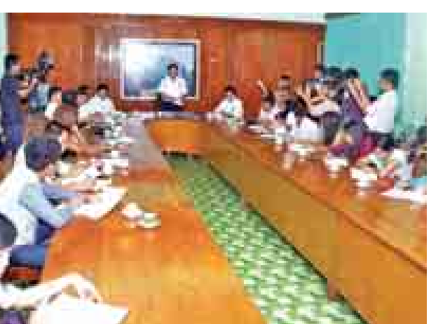
မြန်မာ့မီးရထားရုံး၌ စာနယ်ဇင်းရှင်းလင်းစဉ်။

မောင်းနှင်ပေးလျက်ရှိရာ တစ်ရက်လျှင် ခရီးသည်ရှစ်သောင်းခွဲနှင့် အထက် မြို့ပတ်ရထားကိုစီးရင်းလျက် ရှိသည့်အပြင် နိုင်ငံခြားသားခရီးသည်မှာလည်း တစ်နေ့လျှင် ၁၀၀ ဝန်းကျင် စီးရင်းလျက်ရှိသည်။ ရိုးရိုးမြို့ပတ်ရထားများအပြင် ခရီးသည်များ သက်သေခံသက်သာ စီးရင်းနိုင်ရေးအတွက် အဲကွန်းအာရ် ဘီအီး တွဲဆိုင်နှစ်ဆိုင်ကိုလည်း ဩဂုတ်လအတွင်း စတင်ပြေးဆွဲပေးခဲ့ပြီး လက်မှတ်ခများကို ယခုအခါ ငွေကျပ် ၄၀၀မှ ၅၀၀ သို့ လည်းကောင်း၊ ငွေကျပ် ၃၀၀တန် တွဲဆိုင်များတွင် ငွေကျပ် ၂၀၀ သို့လည်းကောင်း လျှော့ချပေးခဲ့ပြီးဖြစ်သည်။ မိုးတွင်းကာလပြီးဆုံးပြီး ခရီးသွား ရာသီ ပြန်လည်ရောက်ရှိလာခြင်းကြောင့် ခရီးသွားပြည်သူများ အဆင်ပြေချောမွေ့စေရေးအတွက် ရန်ကုန်-ကျိုက်ထို ရထားခရီးစဉ်များကို အောက်တိုဘာ ၁၁ ရက်မှ စတင် ပြေးဆွဲပေးသွားမည် ဖြစ်ကြောင်း မြန်မာ့မီးရထား (အောက်မြန်မာပြည်) မှ အောက်တိုဘာ ၉ ရက်က သတင်း