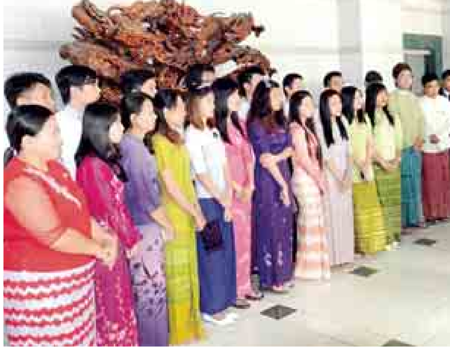
ကွမ်းရိုးဆေးတက္ကသိုလ်၌ ပညာသင်ကြားနေကြသည့် မြန်မာကျောင်းသား ကျောင်းသူများ။

လက်ကားဈေးတိုးဖြစ်သည်။ ထိုစင် တာ၌ ဒေသမှထွက်ရှိသည့် လယ်ယာ ထွက်ကုန်ပစ္စည်းများကို အရည် အသွေး စစ်ဆေးပေးလျက်ရှိပြီး အရည်အသွေးစစ်ဆေးပြီးသည့် သစ် သီးဝလံများကို တခြားပြည်နယ်များ နှင့် အခြားတိုင်းပြည်များသို့ တင်ပို့ ရောင်းချလျက်ရှိကြောင်း သိရသည်။ သစ်သီးဝလံလက်ကားဈေးတွင် ဒေသအသီးသီးမှ ထွက်ရှိသည့် သစ်သီးဝလံများကို ကွန်တိန်နာယာဉ် များဖြင့် သယ်ယူလျှိုး အရောင်း အဝယ်ပြုလုပ်နေသည်ကို မြင်ရသည် မှာ အားကျစရာကောင်းလှသည်။