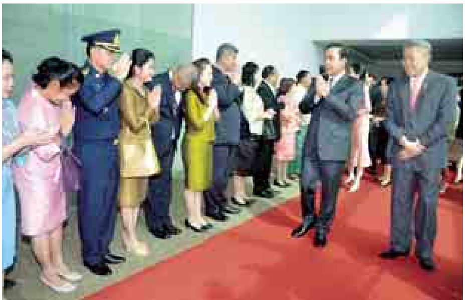
အလုပ်သမား၊ အလုပ်အကိုင်နှင့် လူမှုဖူလုံရေးဝန်ကြီးဌာန ပြည်ထောင်စုဝန်ကြီး ဦးအေးမြင့်နှင့်

သံရုံး၌ မြန်မာနိုင်ငံရှိ ထိုင်းစီးပွားရေးလုပ်ငန်းရှင်များနှင့် တွေ့ဆုံသည်။ ထို့အတူ ထိုင်းနိုင်ငံဝန်ကြီးချုပ်၏ ဇနီးနှင့်အဖွဲ့သည် နံနက် ၁၁ နာရီတွင် ထိုင်းနိုင်ငံမှ လှူဒါန်းထားသော Thai Study Center အတွင်း၌ ပြသထားသည့် ထိုင်းရုပ်ရှင်တိုများ၊ ထိုင်းယဉ်ကျေးမှုနှင့် ဘာသာရပ်ဆိုင်ရာ စာအုပ်များကို လှည့်လည်ကြည့်ရှုလေ့လာကြသည်။ ထို့နောက် ထိုင်းနိုင်ငံဝန်ကြီးချုပ်နှင့်ဇနီး ဦးဆောင်သော ကိုယ်စားလှယ်အဖွဲ့သည် မွန်လွဲ ၂ နာရီ မိနစ် ၄၀ တွင် ရန်ကုန်မြို့မှ အထူးလေယာဉ်ဖြင့် ပြန်လည်ထွက်ခွာကြရာ