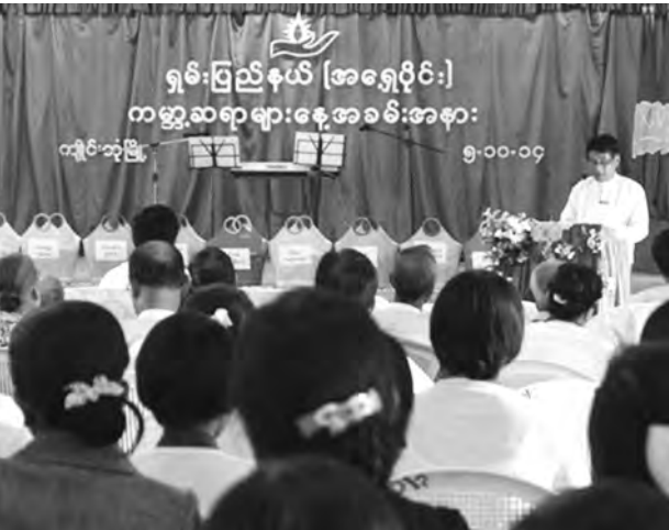
ကျင်းတုံမြို့ (အရှေ့ပိုင်း) ကမ္ဘာ့ဆရာများနေ့အခမ်းအနား ၅-၁၀-၁၄