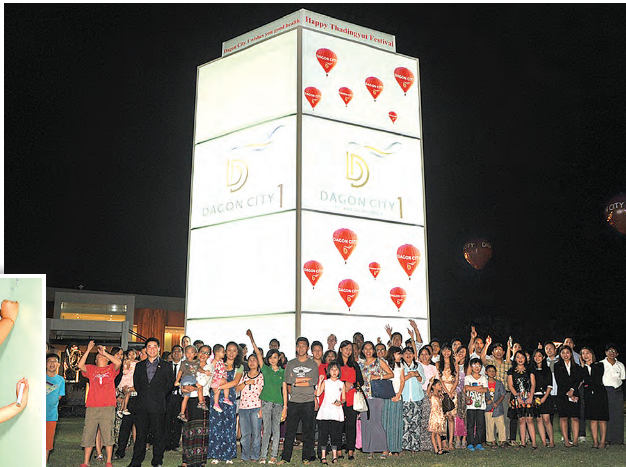
သီတင်းကျွတ်မီးထွန်းပွဲတော်အထိမ်းအမှတ် အကြီးဆုံးမီးပုံးကြီးကို နိုင်ငံခြားသားကလေးငယ်များ ဆုတောင်းစာများရေးသားပြီး မီးထွန်းညှိစဉ်။