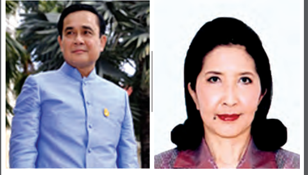
ဗိုလ်ချုပ်ကြီး ပရာယုဒ်ချန်အိုချာ မစ္စစ် နာရာပွန် ချန်အိုချာ

ဗိုလ်ချုပ်ကြီး ပရာယုဒ် ချန်အိုချာအား ၁၉၅၄ ခုနှစ် မတ်လ ၂၀ ရက်နေ့တွင် ထိုင်းနိုင်ငံ နာခွန်းရတ်ချစ်မာပြည်နယ်၌ မွေးဖွားခဲ့ပါသည်။ ဗိုလ်ချုပ်ကြီး ပရာယုဒ်ချန်အိုချာသည် ချူလာချမ်ကလောင်း တော်ဝင် စစ်တက္ကသိုလ် အပတ်စဉ် (၂၃)မှ သိပ္ပံဘွဲ့ကို ၁၉၇၆ ခုနှစ်တွင် ရရှိခဲ့ပြီး ခြေလျင်တပ်အရာရှိ အခြေခံသင်တန်းကို ၁၉၇၆ ခုနှစ်တွင်လည်းကောင်း၊ အဆင့်မြင့်သင်တန်းကို ၁၉၈၁ ခုနှစ်တွင်လည်းကောင်း တက်ရောက် အောင်မြင်ခဲ့ပါသည်။ ထို့ပြင် စစ်ဦးစီးအရာရှိတက္ကသိုလ်သို့ ၁၉၈၅