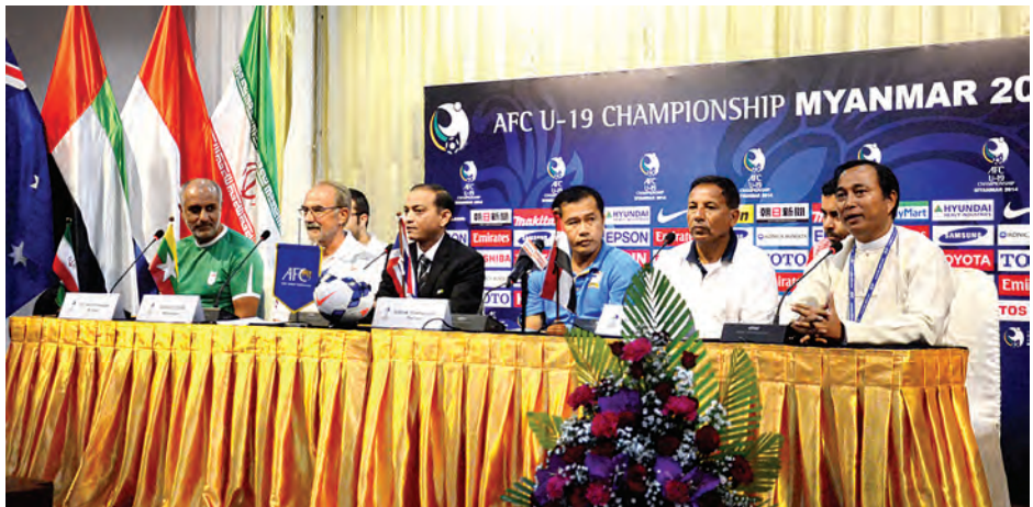
တော့ နောက်တစ်ဆင့်တက်ဖို့ အဆုံးအဖြတ်ပွဲဖြစ်လာနိုင်ပါတယ်” ဟု ပြောကြားခဲ့သည်။ အီရန်အသင်း နည်းပြအလီက “ဒီပြိုင်ပွဲကို ဝင်ရောက်ကစားခွင့်ရရှိတဲ့အတွက် ကျေနပ်မိသလို အိမ်ရှင်အဖြစ် လက်ခံကျင်းပတဲ့ မြန်မာနိုင်ငံကိုလည်း ချီးကျူးဂုဏ်ပြုပါတယ်။ ဒီပြိုင်ပွဲမှာ အောင်မြင်မှုရဖို့ ရည်မှန်းထားပြီး နောက်တစ်ဆင့် တက်ဖို့ အခွင့်အရေးကိုယ်စီရှိပါတယ်။

ကို သေချာလေ့လာထားပါတယ်။ မြန်မာအသင်းက အိမ်ရှင်အသင်းဖြစ်တဲ့အတွက် ပရိသတ်အားပေးမှု ရှိနေပြီး အလွန်ကိုခက်ခဲတဲ့ပွဲဖြစ်လာမှာပါ” ဟု ပြောကြားခဲ့သည်။ ထိုင်းအသင်းနည်းပြ ဆာဆွမ်က “အသင်းမှာ ကစားသမားအသစ် အများကြီးပါလာပါတယ်။ အသင်းမှာ ရွေးချယ်ထားတဲ့ကစားသမားတွေကို ကလပ်အသင်းတွေက မပေးတာကြောင့် ကာလရှည်တော့ မလေ့ကျင့်နိုင်ခဲ့ပါဘူး။ အခု အသစ်ပါလာတဲ့ ကစားသမားတွေဟာ ပြီးခဲ့တဲ့ ဘရူနိုင်းဘုရင့်ဖလား ပြိုင်ပွဲနဲ့ အာဆီယံယူ-၁၉ ပြိုင်ပွဲမှာတော့ ပါဝင်နိုင်ခြင်း မရှိခဲ့ပါဘူး။ မြန်မာအသင်းနဲ့ ပွဲက