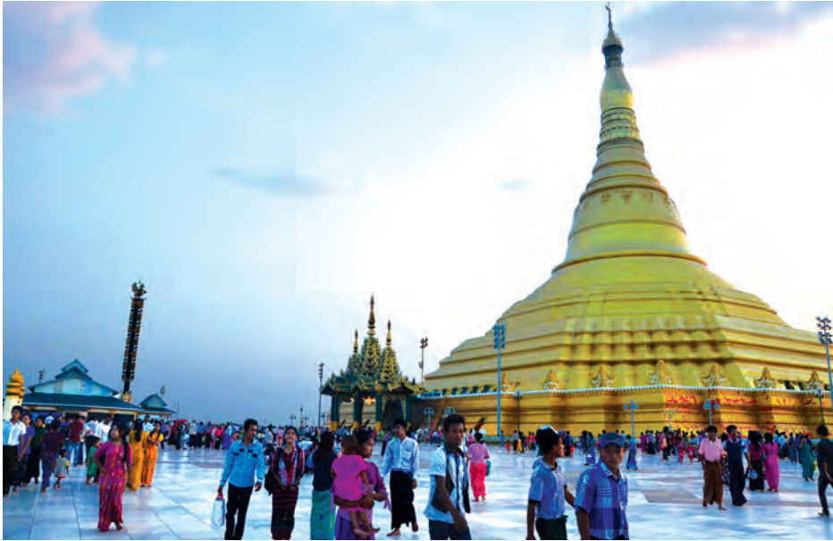
သီတင်းသီလ ခံယူဆောက်တည်ကြသူများ၊ အလှူအတန်းပြုကြသူများများပြားခဲ့ပြီး ဓမ္မစကြာတရားတော် ရွတ်ဖတ်ပူဇော်သံများနှင့်အတူ စည်ကားခဲ့ကာ နေပြည်တော်ရှိ ရေပန်းများဖြင့် စည်းကားလျက်ရှိသည်။ ရောက်အပန်းဖြေကြသည့် ပြည်သူများဖြင့် စည်းကားလျက်ရှိသည်။ ယနေ့နံနက်ပိုင်းတွင် ဥပုတ

ယနေ့သည် မြန်မာသက္ကရာဇ် ၁၃၇၆ ခုနှစ်၏ သီတင်းကျွတ်လပြည့်နေ့ဖြစ်သည်။ မြတ်စွာဘုရားရှင် ဝါတွင်းသုံးလ ကာလပတ်လုံး တာဝတိံသာနတ်ပြည်တွင် အဘိဓမ္မာ ဒေသနာတော် ဟောကြားတော်မူပြီး လူ့ပြည်သို့ ပြန်လည်ကြွရောက်တော်မူသည့်နေ့လည်းဖြစ်သည်။ ထိုနေ့တွင် နတ်ပြည်မှ ဆင်းသက်တော်မူလာသည့် မြတ်စွာဘုရားရှင်အား ပူဇော်သည့်အနေဖြင့် ဘုရားစေတီ၊ တန်ဆောင်း၊ ကျောင်း၊ အိမ်များ၌ ဆီမီး၊ ဖယောင်းတိုင်၊ မီးပုံးများ ထွန်းညှိ၍ ကြိုဆိုကြသည်။