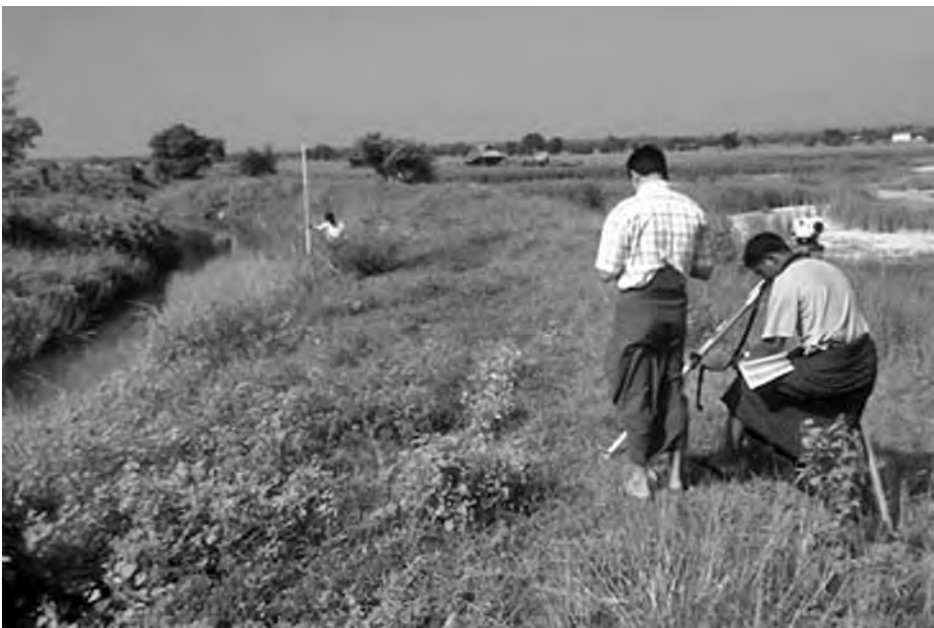
တိုင်းတာခြင်းများကို ဆောင်ရွက်ခဲ့သည်။ ထို့နောက် လေးတန်ချောင်းကမ်း နားနေအိမ်များ ကမ်းပါးပြိုကျပြီး

ဒေသကြီး လွှတ်တော်ကိုယ်စားလှယ် ဦးတင်မြင့်နှင့်အတူ ရေတိုက်စားခံရသည့် နန့်ကျဲချောင်းရေ အသုံးပြု ဒေသခံတောင်သူများနှင့်တွေ့ဆုံကာ နန့်ကျဲချောင်း၏ ပထဝီအနေအထား၊ ဆည်တည်ထားရှိပုံ၊ ရေကြောင်းပေါင်းစီးပုံ၊ ကောက်ကွေ့စွာ ရေစီးကြောင်းဖွဲ့တည်နေပုံများနှင့် နှစ်စဉ် မိုးရာသီကာလတွင် ကြုံတွေ့နေရသည့် တာပေါင်ရိုး ကျိုးပေါက်ခြင်းမှ ကင်းဝေးစေရန်အတွက် ရေအရင်းအမြစ်နှင့် မြစ်ချောင်းများ တိုးတက်ရေးကို ရည်ရွယ်လျက် အသေးစိတ်