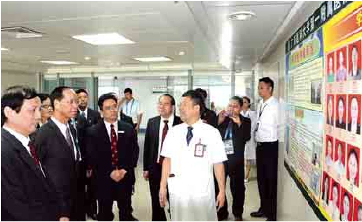
ဒုတိယသမ္မတ ဒေါက်တာစိုင်းမောက်ခမ်း ကွမ်းရိုးဆေးတက္ကသိုလ် အမှတ်(၁) တွဲဖက်ဆေးရုံအတွင်း လှည့်လည်ကြည့်ရှုစဉ်။ (သတင်းစဉ်)

ရန်ကုန် အောက်တိုဘာ ၇ မြန်မာနိုင်ငံ လူကုန်ကူးမှုတားဆီးကာကွယ်ရေးဗဟိုအဖွဲ့နှင့် အာဆီယံအတွင်းရေးမှူးချုပ်ရုံး၊ အာဆီယံ-အမေရိကန်လုပ်ငန်းစဉ်တို့ ပူးပေါင်း၍ အာဆီယံ-အမေရိကန် လူကုန်ကူးမှုတိုက်ဖျက်ရေးဆိုင်ရာ အစီရင်ခံစာနှင့်စပ်လျဉ်းသော ဆွေးနွေးပွဲကို ယနေ့နံနက် ၉ နာရီတွင် ရန်ကုန်မြို့ Park Royal Hotel ၌ ကျင်းပရာ လူကုန်ကူးမှု တားဆီးကာကွယ်ရေးဗဟိုအဖွဲ့ဥက္ကဋ္ဌ ပြည်ထဲရေးဝန်ကြီးဌာန ပြည်ထောင်စုဝန်ကြီး ဒုတိယဗိုလ်ချုပ်ကြီးကိုကို၊ ဒုတိယဝန်ကြီးများနှင့် ဌာနဆိုင်ရာအကြီးအကဲများ၊ အမေရိကန်နိုင်ငံ လူကုန်ကူးမှုတိုက်ဖျက်ရေးဆိုင်ရာ သံအမတ်ကြီး Mr.Luis CdeBaca၊ အာဆီယံနိုင်ငံများမှ သံအမတ်ကြီးများ၊ အာဆီယံအတွင်းရေးမှူးချုပ်ရုံးနှင့် အာဆီယံအဖွဲ့ဝင်နိုင်ငံများမှ ကိုယ်စားလှယ်များ၊ ဖိတ်ကြားထားသူများနှင့် မီဒီယာများ တက်ရောက်ကြသည်။ ဆွေးနွေးပွဲတွင် ပြည်ထဲရေးဝန်ကြီးဌာန ပြည်ထောင်စုဝန်ကြီး ဒုတိယဗိုလ်ချုပ်ကြီး ကိုကိုက အဖွဲ့အမှတ်စဉ်အရ အဖွဲ့ဝင်များသည် ခေတ်သစ်ကျေးကျွန်စနစ်အသွင်ဖြင့် ယနေ့ကမ္ဘာတွင် ပြန်လည်ပေါ်ပေါက်လာသော ပြဿနာတစ်ခုအဖြစ် ရှေ့တန်းသို့ရောက်ရှိလာနေပြီဖြစ်ကြောင်း၊ လူသားချင်းစာနာမှု ကင်းမဲ့စွာဖြင့် ခေါင်းပုံဖြတ်မှု လုပ်ရပ်များသည် လူသားများ၏ အခြေခံလူ့အခွင့်အရေးကို အကြီးမားဆုံးချိုးဖောက်လျက်ရှိသဖြင့် ကမ္ဘာ့နိုင်ငံအများစုကို စိန်ခေါ်လျက်ရှိနေကြောင်း၊ ထို့ကြောင့် နိုင်ငံတိုင်းအတွက် လူကုန်ကူးမှုတိုက်ဖျက်ရေး ပူးပေါင်းဆောင်ရွက်မှုသည် အရေးကြီးသော ကဏ္ဍသို့ ရောက်ရှိနေပြီဖြစ်ကြောင်း၊ ယခုနှစ်သည် မြန်မာနိုင်ငံအနေဖြင့်