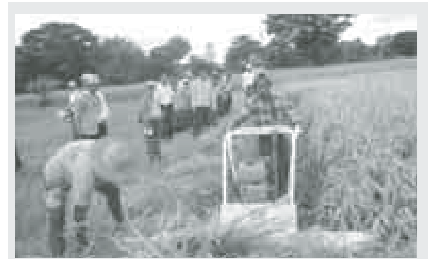
ဟင်္သာတခရိုင် မြန်အောင်မြို့နယ်တွင် မိုးစပါးများ စတင်ရိတ်သိမ်းနေပြီဖြစ်ရာ ထု ကျေးရွာအုပ်စု ကွင်းအမှတ်(၄၄)တွင် စိုက်ပျိုးထားသော ပုလဲသွယ်(ဗီယက်နမ်)စပါးမျိုး ကို မြို့နယ်စိုက်ပျိုးရေးဦးစီးဌာန ကြီးကြပ်၍ စိုက်ပျိုးစိုက်သိမ်းမှု ဆောင်ရွက်စဉ်။ (အဆိုပါ စိုက်ပျိုးစိုက်သိမ်းမှုမှ စပါးအခြေတင် ၁၁၃ ဒဿ ၄၈ တင်းထွက်ရှိခဲ့ကာ စိုက်ပျိုးရက် သက်တမ်းတိုပြီး စပါးအထွက်နှုန်းကောင်းမွန်သောကြောင့် တောင်သူများနှစ်သက်ကြ ကြောင်း သိရသည်။) (မြို့နယ် ပြန်/ဆက်)