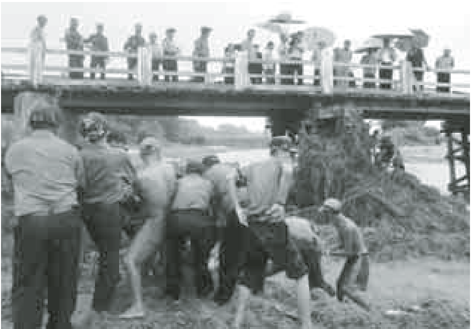
အမြစ်လည်းကောင်း၊ ခရိုင်ချင်းဆက်လမ်း မိုင်တိုင်အမှတ် ၂၀၀/၂ နှင့် ၂၀၀/၃ အကြား တံတားအမှတ် (၃) သစ်သားတံတား အရှည် ၁၂၆ ပေ၊ အကျယ် ၁၄ ပေ၊ ရေလယ်တိုင်ကျိုးကျပျက်စီးတံတားကို အာရုံစိုက်သံပေါင်

အဖြစ်လည်းကောင်း၊ ကသာ-အင်းတော်လမ်းမိုင်တိုင်အမှတ် ၈/၆ နှင့် ၈/၇ကြား ပြည်သူ့ဆောက်လုပ်ရေးလုပ်ငန်းက တည်ဆောက်ထားသည့် အရှည်ပေ ၂၀ တံတားအမှတ် ၅/၉ ဘေလီတံတား ကမ်းကပ်ခုံ ရေပျောပျက်စီးကို ဘေလီတံတား အဖြစ်လည်းကောင်း၊ ဗန်းမော်-ကသာလမ်းအနီး မင်းလယ်ကျေးရွာ နား အရှည် ပေ ၁၀၀၊ အကျယ် ၁၄ ပေသစ်သားတံတား ပေ ၅၀ ခန့် ပျောပျက်စီးကို အုတ်ခုံသံပေါင်ခင်း တံတားအဖြစ်လည်းကောင်း၊ ကသာမြို့ရှိ ပြည်သာယာစည်ပင်သာယာမူ တည်ဆောက်ထားသည့် အမှတ် (၃) ခရိုင်ချင်းဆက်လမ်း သစ်သားတံတား အရှည် ပေ ၂၀၀၊ အကျယ် ၂၄ ပေ တံတား ပေ ၈၀ ခန့် ရေပျောပျက်စီးကို အုတ်ခုံ သံပေါင်ခင်းတံတားအဖြစ် လည်းကောင်း၊ ကသာမြို့နယ် မိဿလင်းအုပ်စု ပေကုန်းရွာမှ အမှတ်(၃) ခရိုင်ချင်းဆက်လမ်း မိုင်တိုင်အမှတ် ၁၉၉/၆ နှင့် ၁၉၉/၇ အကြား ဒေသခံများတည်ဆောက်ထားသော သစ်သားတံတား အရှည်ပေ ၈၀၊ အကျယ် ၁၄ ပေ တံတားရေပျောပျက်စီးကို အာရုံစိုက်သံပေါင်