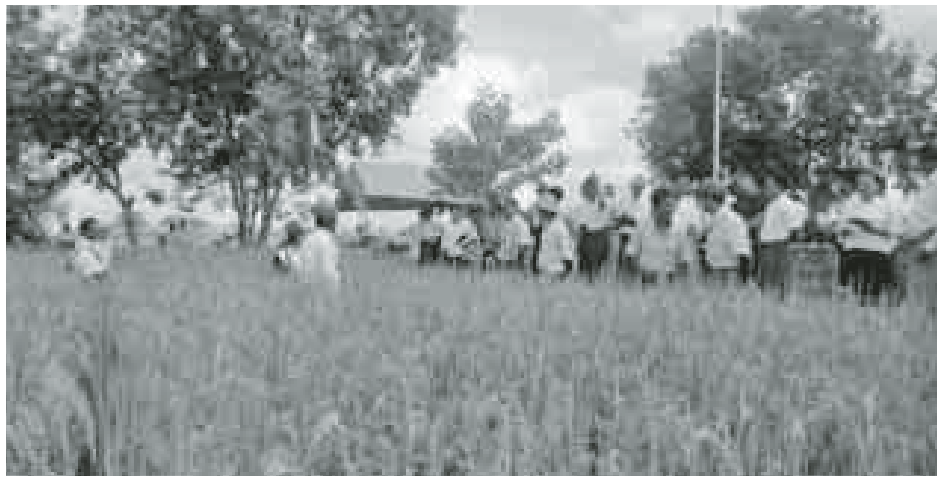
သာယာဝတီ အောက်တိုဘာ ၇ ဝဲခူးတိုင်းဒေသကြီး သာယာဝတီ ခရိုင် သာယာဝတီမြို့နယ် မိုးစပါး ရတနာတိုး ၁၀ ဧက မျိုးသန့်စံပြကွက်

မျိုးကွဲနုတ်ပယ်ခြင်း လက်တွေ့သရုပ် ပြပွဲကို အောက်တိုဘာ ၂ ရက် နံနက် ၈ နာရီက ရေတွင်းကုန်းကျေးရွာ ကွင်းအမှတ်(၁၃၁၂) ဦးပိုင်အမှတ်