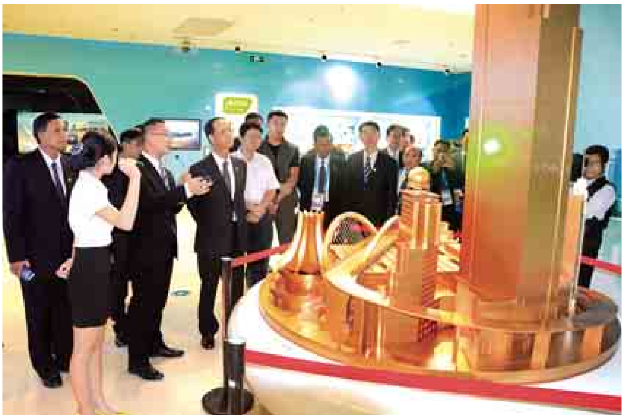
ဒုတိယသမ္မတ ဒေါက်တာစိုင်းမောက်ခမ်း နန်နင်းစီမံခန့်ခွဲမှုပြတိုက်အတွင်း ကြည့်ရှုစဉ်။