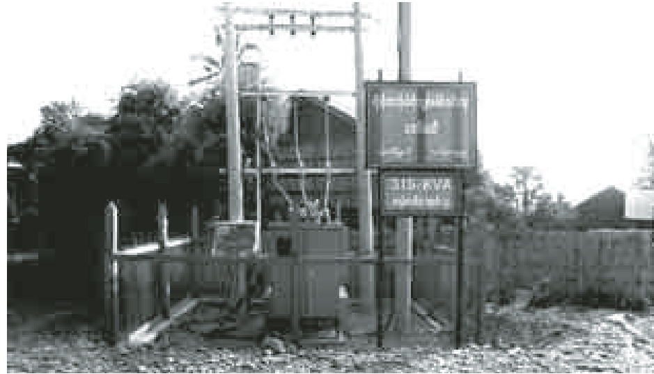
ဂန့်ဂေါ အောက်တိုဘာ ၇

မကွေးတိုင်းဒေသကြီး ဂန့်ဂေါခရိုင် ဂန့်ဂေါမြို့နယ် လာပို့ကျေးရွာတွင် မဟာဓာတ်အားလိုင်းစနစ်ဖြင့် ၂၄ နာရီ စီးလင်းရေအတွက် ကိုယ့်အားကိုယ်ကိုး ဆောင်ရွက်ခဲ့ကြရာ လျှပ်စစ်ဓာတ်အားလိုင်းများ သွယ်တန်းချိတ်ဆက်တည်ဆောက်ခြင်း လုပ်ငန်းများ ပြီးစီးအောင်မြင်ခဲ့ပြီဖြစ်၍ စက်တင်ဘာ ၂၈ ရက်မှစတင်ကာ ကျေးရွာအတွင်း၌ လျှပ်စစ်ဓာတ်အား စတင်ဖြန့်ဖြူးနေပြီဖြစ်ကြောင်း သိရသည်။