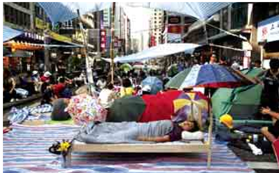
ဟောင်ကောင် မောင်းကောက်ရပ်ကွက်နေ သံလမ်းပေါ်တွင်ရှိနေဆဲဖြစ်သည့် ဆန္ဒပြသူများကို အောက်တိုဘာ ၇ ရက်က တွေ့ရစဉ်။