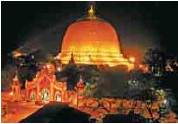
စစ်ကိုင်း အောက်တိုဘာ ၆ မီးထွန်းပွဲတော်တွင် ဆီမီး ၉၀၀၀ စစ်ကိုင်းမြို့ ကောင်းမှုတော် ပူဇော်ပွဲကို သီတင်းကျွတ်လပြည့်နေ့ ဘုရား သီတင်းကျွတ်လပြည့် (အဘိဓမ္မာနေ့) အောက်တိုဘာ ၈

ရက် ၂၆ နာရီတွင် ရာမဏီစုဌာ ကောင်းမှုတော်ဘုရားကြီး ရင်ပြင် တော်ပေါ်၌ ထွန်းညှိပူဇော်မည်ဖြစ် သည်။ ကောင်းမှုတော် ဘုရားကြီး၏ ပွဲတော်ဖြစ်သော သီတင်းကျွတ် လပြည့်နေ့မတိုင်မီတွင် နှစ်စဉ် စစ် ကိုင်းတိုင်းဒေသကြီး အစိုးရအဖွဲ့က ကြီးပွားကျင်းပသည့် တိုင်းလုံးကျွတ် ဓမ္မစကြာရေးပြိုင်ပွဲ၊ ရွတ်ဆို ပူဇော်ပွဲတော်ကြီးများကိုလည်း ယခု နှစ်ဆိုလျှင် ရေးပြိုင်ပွဲမှာ (၁၅) ကြိမ်သို့ရောက်ရှိပြီး၊ ရွတ်ဆိုပူဇော် ပြိုင်ပွဲမှာ အကြိမ် (၂၀)သို့တိုင်ရောက် ရှိနေပြီဖြစ်သည်။ ပြိုင်ပွဲတွင် အကဲ ဖြတ်၊ အမှတ်ပေးပိုင်အဖွဲ့များနှင့်