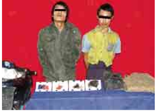
လော်အေး(ခ)ကျဖနှင့် လီးစိတို့နှစ်ဦးအား ဖမ်းဆီးရမိမှုပစ္စည်းပေးပို့မှုများနှင့် အတူ တွေ့ရစဉ်။