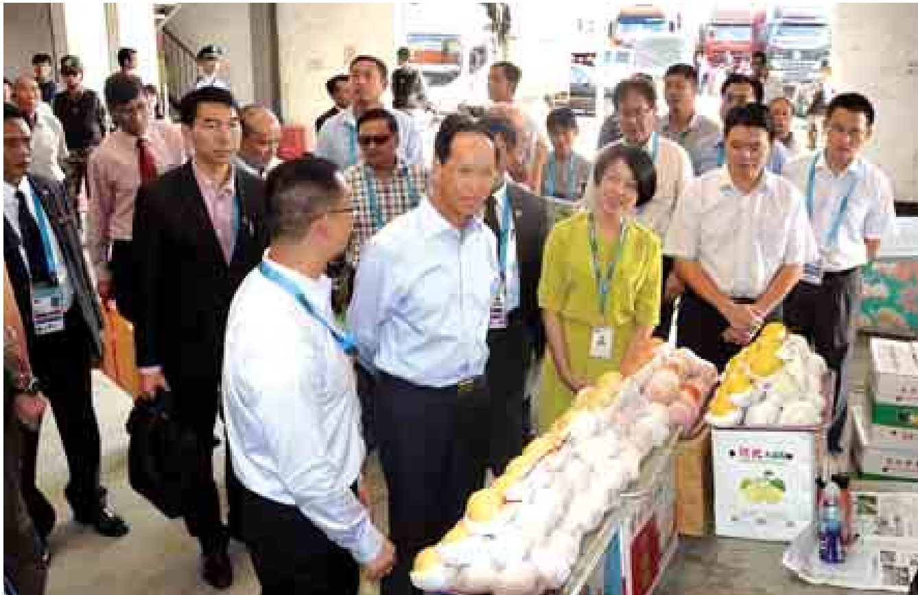
ဒုတိယသမ္မတ ဒေါက်တာစိုင်းမောက်ခမ်း သစ်သီးဝလံလက်ကားစောင့်ကြည့်ရေးရောင်းဝယ်ရေးမှုကို ကြည့်ရှုစဉ်။ (သတင်းစဉ်)