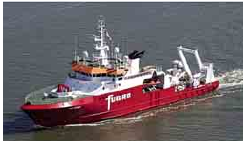
ပျောက်ဆုံးမလေးရှား ခရီးသည်လေယာဉ် ရှာဖွေမှု သင်္ဘော။

ပျောက်ဆုံး မလေးရှား လေယာဉ် MH-370 ရှာဖွေမှု နောက်တစ်ဆင့်ကို အိန္ဒိယသမုဒ္ဒရာ တောင်ပိုင်း၌ စတင်လိုက်ပြုဖြစ်သည်။ အသံလှိုင်းဖြင့် ရေအောက် အရာဝတ္ထုများကို ရှာဖွေနိုင်သည့် နည်းပညာသုံးကိရိယာ အထူးပြုလုပ် တပ်ဆင်ထားသော အဆိုပါ သင်္ဘောသည် ၎င်းလေယာဉ်ခရီးစဉ် အဆုံးသတ်ခဲ့သည်ဟု ယုံကြည်ရသော သမုဒ္ဒရာအတွင်း ရှာဖွေမှုလုပ်ငန်း စတင်ရန် ရောက်ရှိလာခဲ့သည်။ ခရီးသည် ၂၃၉ ဦး လိုက်ပါလာသော အဆိုပါ ဘိုးရင်း-၇၇၇ လေယာဉ်သည် မတ်လ ၈ ရက်တွင် ပျောက်ဆုံးခဲ့ခြင်းဖြစ်သည်။ နိုင်ငံတကာအဖွဲ့အစည်းများ အပါအဝင် ဝေဟင်နှင့် ရေပြင် ရှာဖွေမှုများ အကြီးအကျယ်ပြုလုပ်ခဲ့သော်လည်း အစအနပင်မတွေ့ရသေးဟု ဆိုသည်။ ဂြိုဟ်တုသတင်းအချက်အလက်များကို အသုံးပြုပြီး အဆိုပါ လေကြောင်းလိုင်းက ၎င်း၏ခရီးစဉ် အဆုံးသတ်သွားနိုင်သည့် အိန္ဒိယသမုဒ္ဒရာ အတွင်း ဩစတြေးလျနိုင်ငံ ပျံသံမြို့ အနောက် မြောက်ဘက်၌ ရှာဖွေမှုပြုလုပ်ခဲ့သည်ဟု ဆိုသည်။ မလေးရှား လေကြောင်းလိုင်းက စာချုပ်