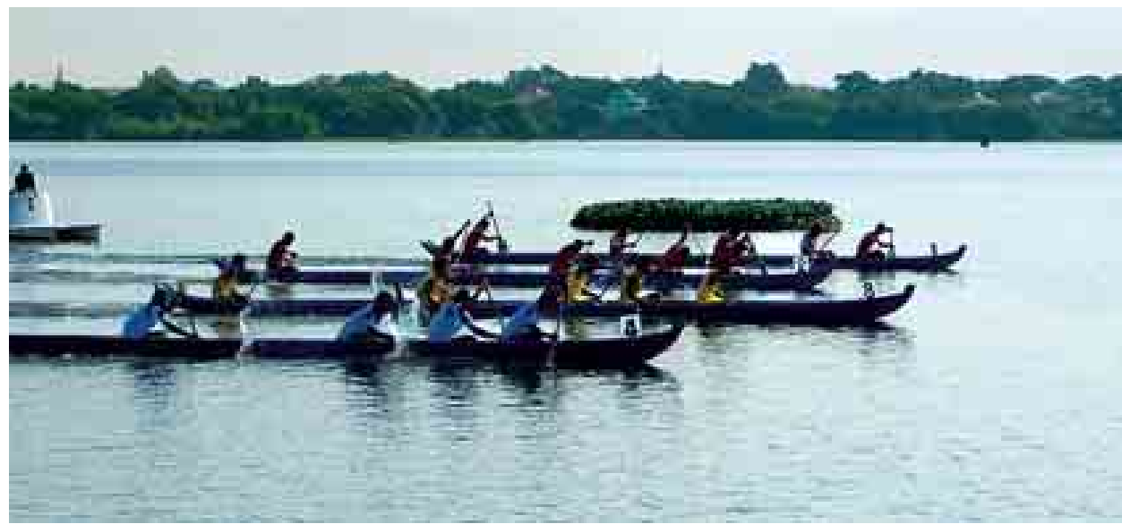
မန္တလေးကန်တော်ကြီးရေပြင်၌ကျင်းပသည့် တိုင်းဒေသကြီးနှင့်ပြည်နယ် ရိုးရာလှေပြိုင်ပွဲမှ အမျိုးသား မိတာ ၂၀၀ ငါးတက်လှော်ပြိုင်ပွဲတွင် ရန်ကုန်တိုင်းဒေသကြီး၊ တနင်္သာရီတိုင်းဒေသကြီးအသင်းနှင့် ရခိုင်ပြည်နယ်အသင်းတို့ ယှဉ်ပြိုင်နေစဉ်။ (သတင်း၊ စာ-၉)

နေစွမ်းအင်မှ ဓာတ်အားထုတ်ယူရာတွင် မဂ္ဂါဝပ် ၁၅၀ ထုတ်လုပ်နိုင်မည့် စာမျက်နှာ ၃ ကော်လံ ၅