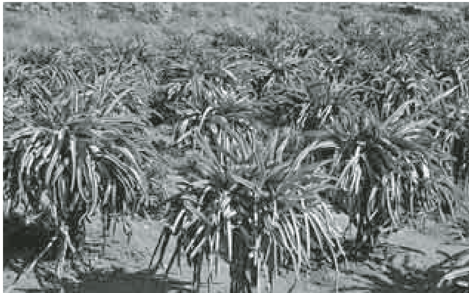
ကလေး အောက်တိုဘာ ၆

နဂါးမောက်ပင်များသည် ထိုင်း၊ ဗီယက်နမ်၊ ဖိလစ်ပိုင်နိုင်ငံတို့တွင် စီးပွားဖြစ်စိုက်ပျိုးကြပြီး မြန်မာနိုင်ငံတွင်လည်း ဒေသအချို့တွင် စီးပွားဖြစ် စိုက်ပျိုးအောင်မြင်လျက် ရှိသည်။