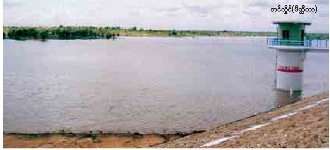
တင်လှိုင်(မိတ္ထီလာ)

ပေါင်း ရာချီကြာလာပြီဖြစ်၍ သဲနုန်း ပို့ချမှုများလာခြင်းကြောင့် ၁၉၅၆-၅၇ ခု ဖဆပလခေတ်က မွမ်းမံပြင်ဆင်ခဲ့ သည်။ ကန်ပြုပြင်ပြီးနောက် ၅၇ နှစ် အကြာတွင် ကန်အတွင်း သဲနုန်းပို့ချ မှုကြောင့် ရေသိုလှောင်မှုပမာဏ တဖြည်းဖြည်းလျော့နည်းလာသည်။ ရေလုံလောက်စွာ မပေးဝေနိုင်သဖြင့် သီးနှံစိုက်ပျိုးစေ လျော့နည်းလာပြီး နှစ်စဉ် ရေကြီးရေလျှံမှုများဖြစ်ပေါ်ခဲ့ သည်။ လယ်ယာစိုက်ပျိုးရေးနှင့် ဆည် မြောင်းဝန်ကြီးဌာနဝန်ကြီးက ၂၀၁၀ ခုနှစ်က အလောင်းစည်သူကန် ရေဝင် မှုအခြေအနေလာရောက် ကြည့်ရှုစဉ်