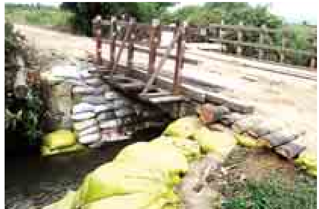
ပြည်သူများ အသွားအလာများ များလည်းရှိကြောင်း၊ ၂၀၁၃ ခုနှစ်က သည့်အပြင် သစ်ကားများသွားလာမှု ချောင်းရေကြီးစဉ် တံတားပြိုကျ

မန္တလေးတိုင်းဒေသကြီး စဉ့်ကူးမြို့နယ် ကြို့ပင်-ရွာသစ်ကြီးသွား ကျေးလက်လမ်းပေါ်ရှိ ချောင်းကူးတံတားသည် ယခင်က ကျေးလက်ဒေသဖွံ့ဖြိုးတိုးတက်ရေး၊ လမ်းပန်းဆက်သွယ်မှု လုံခြုံချောမွေ့စေရေးနှင့် ကုန်စည်စီးဆင်းမှု မှန်ကန်ရေးအတွက် အထောက်အကူပြုခဲ့သော်လည်း ယခုအခါ အဆိုပါတံတားမှာ ရေစီးသန်တောင်ကျချောင်းရေ မြင့်တက်မှုကြောင့် အသုံးပြု၍ မရတော့ဘဲ ဒေသခံ ကျေးလက်နေပြည်သူများ သွားလာမှု ခက်ခဲလျက်ရှိကြောင်း သိရသည်။