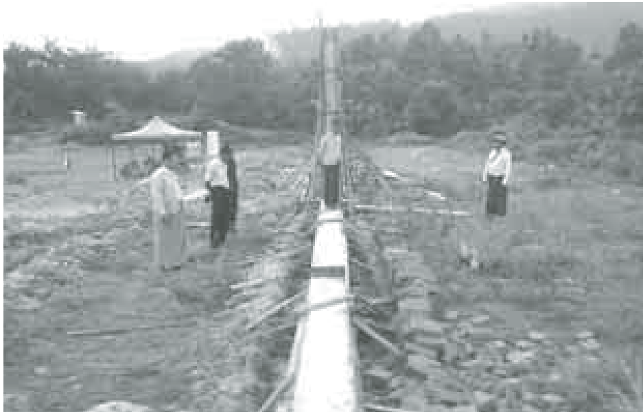
ပြည်သူ့အားကစားကွင်း ခြံစည်းရိုးခတ်လုပ်ငန်းဆောင်ရွက်နေစဉ်။

ကလေးဝပြည်သူ့အားကစားကွင်း ကြီး အဆင့်မြှင့်တင်မှုလုပ်ငန်းတွင် အထူးတန်းပြကြည့်စင်၊ မီတာ ၄၀၀ ပြေးလမ်း ကပ်တုံးပြုလုပ်ခြင်း၊ နန်း မြေကျောက်မှုန့်ခင်းခြင်း၊ အစီစီစဉ် တွင်းတူးခြင်းနှင့် ရေစင်ဆောက်လုပ် ခြင်း၊ ရုံးခန်းနှင့် အရာရှိနေအိမ်တွဲ များ ဆောက်လုပ်ခြင်းနှင့် စကီးလ် ဘုတ်တပ်ဆင်ခြင်း လုပ်ငန်းများပါဝင် မည်ဖြစ်သည်။ ပြည်သူ့အားကစား ကွင်းကြီး ပြိုင်ကွင်းပတ်လည်ကို တံခါးမကြီးအပါ အုတ်တံတိုင်းဖြင့် ကာရံမည်ဖြစ်ပြီး ခြံစည်းရိုး အလျား ၂၃၂၃ ပေ၊ ကပ်တုံး ၂၈၁၄ ပေ၊ တံခါးမကြီး အကျယ် ၁၈ ပေနှင့် တံခါးအကျယ် ငါးပေဖြင့် အဆင့်မြှင့် တင် ဆောက်လုပ်သွားမည် ဖြစ်