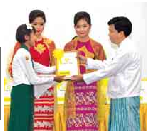
ဒုတိယဝန်ကြီး ဒေါက်တာဇော်မင်းအောင် ကမ္ဘာ့ဆရာများနေ့အထိမ်း အမှတ် အခမ်းအနားတွင် ဆရာမတစ်ဦးအား ဂုဏ်ပြုဆု ချီးမြှင့်စဉ်။ (သတင်းစဉ်)