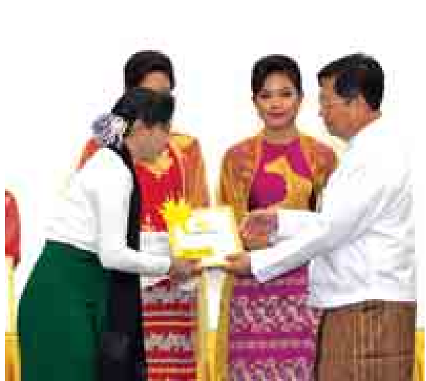
ပြည်ထောင်စုဝန်ကြီး ဦးတင်နိုင်သိန်း ကမ္ဘာ့ဆရာများနေ့အထိမ်း အမှတ်အခမ်းအနားတွင် ဆရာမတစ်ဦးအား ဂုဏ်ပြုဆု ချီးမြှင့်စဉ်။ (သတင်းစဉ်)

ဒုတိယသမ္မတ ကမ္ဘာ့ဆရာများနေ့အထိမ်းအမှတ် အခမ်းအနားတွင် ဆရာမတစ်ဦးအား ဂုဏ်ပြုဆု ချီးမြှင့်စဉ်။ (သတင်းစဉ်)