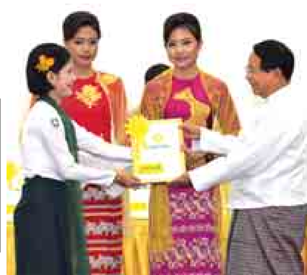
ပြည်ထောင်စုဝန်ကြီး ဦးကျော်ဆန်း ကမ္ဘာ့ဆရာများနေ့အထိမ်း အမှတ်အခမ်းအနားတွင် ဆရာမတစ်ဦးအား ဂုဏ်ပြုဆု ချီးမြှင့်စဉ်။ (သတင်းစဉ်)