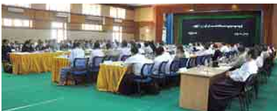
ပြန်လည်ဖော်ပြလိုက်ပါသည်။

ပြန်ကြားရေးဝန်ကြီးဌာန Deutsche Welle နှင့် International Media Support တို့ ပူးပေါင်းကျင်းပသည့် မဏ္ဍိုင်(၃)ရပ်နှင့် သတင်းမီဒီယာ တွေ့ဆုံဆွေးနွေးပွဲ ဒုတိယနေ့ကို ယနေ့နံနက် ၉ နာရီတွင် နေပြည်တော်ရှိ ပြန်ကြားရေးဝန်ကြီးဌာနဝန်ကြီးရုံး စုဝေးခန်းမ၌ ဆက်လက်ကျင်းပသည်။