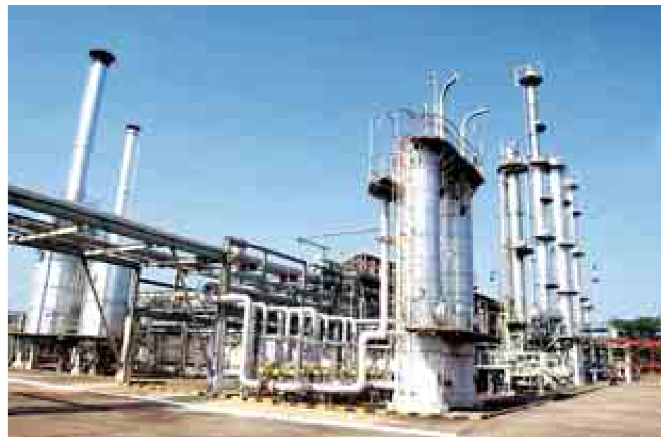
ယင်းစက်ရုံမှ ရေနံဓာတ်ငွေ့ရည်များ များတွင် မီးပုံးပျံဖြင့် လေ့လာလိုသော ကမ္ဘာလှည့် ခရီးသွားများအတွက် ရာသီ၌ ပုဂံဒေသနှင့် အင်းလေးဒေသ စာမျက်နှာ ၇ ကော်လံ ၆

သတင်း-ဝေယံဦး ရေနံဓာတ်ငွေ့ရည်စက်ရုံသည် ၁၉၈၅ ခုနှစ်က ကန်ထရိုက်ဖြစ်သော ဂျပန်နိုင်ငံမှ Mitsubishi Heavy Industry မှ အကောင်အထည်ဖော် တည်ဆောက်ခဲ့သော စက်ရုံဖြစ်သည်။ ယင်းစက်ရုံမှ Propane Refrife-ration Compressor ချွတ်ယွင်းသွား သဖြင့် ၂၀၁၃ ခုနှစ် ဒီဇင်ဘာ ၁၉ ရက်မှ စတင်ကာ ရုပ်ဆိုင်ခဲ့ခြင်းဖြစ် သည်။ ယခုအခါ အငြိမ်းစားပညာရှင်နှင့် ဝန်ထမ်းများ၏ ကြိုးစားပြုပြင်မှု ကြောင့် ပြန်လည်၍ စက်ရုံလည်ပတ် နိုင်ခဲ့ပြီဖြစ်ရာ ရေနံဓာတ်ငွေ့ရည်များ ကို နေ့စဉ်ထုတ်လုပ်နိုင်ပြီဖြစ်သည်။