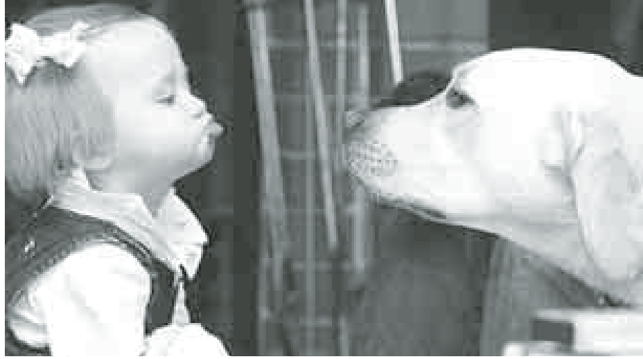
အိမ်မွေးတိရစ္ဆာန်တွေနဲ့ နီးနီးကပ်ကပ် ရင်းရင်းနီးနီးနေထိုင်တဲ့ကလေးတွေကို ကာကွယ်ဆေးထိုးပေးသင့်။

အစာစားချိန်၊ အိပ်ချိန်၊ သားပေါက် ချိန်စတဲ့ အချိန်တွေမှာ အနှောင့် အယှက်မပေးဖို့၊ ခွေးအနားရောက် လာရင် တည်တည်ငြိမ်ငြိမ်နဲ့ ရပ်ပြီး ဝေးရာကိုကြည့်ဖို့ စတာတွေသင်ကြား ထားပါ။ ခွေးကိုက်ခံရရင် အရင်ဆုံး ဒဏ်ရာကိုရေများများနဲ့ ဆပ်ပြာနဲ့ အရက်ပြန်နဲ့ဆေးရင် အမြန်ဆုံး ကျန်းမာရေးဌာနမှာ ကုသမှုခံယူပါ” ဟု မြန်မာနိုင်ငံတီရစ္ဆာန်ဆေးကုဆရာ ဝန်များအသင်းဥက္ကဋ္ဌ ပါမောက္ခ ဒေါက်တာဒေါ်တင်တင်မြိုင်က ပြော ကြားသည်။ ခွေးကိုက်ခံခဲ့ရပါက လည်း ကမ္ဘာကျန်းမာရေးအဖွဲ့က သတ်မှတ်ထားသော စံချိန်စံညွှန်း ပြည့်ဝသည့်ဆေးများကိုသာ ထိုးနဲ့ သင့်ကြောင်း သိရသည်။