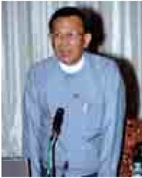
ပြည်ထောင်စုဝန်ကြီး ဒေါက်တာ ကဲဒော် ရှင်းလင်းပြောကြားစဉ်။ (သတင်းစဉ်)

ပြောကြားသည်။ ဆက်လက်၍ အခွန်ကောက်ခံ မှု စိစစ်ကြပ်မတ်ရေးဘုတ်အဖွဲ့၊ ဥက္ကဋ္ဌသူရဦးသောင်းလွင်က အခွန် ကောက်ခံခြင်းဆိုင်ရာများနှင့် စပ် လျဉ်း၍ ရှင်းလင်းပြောကြားသည်။ ယင်းနောက် တက်ရောက်လာ ကြသည့် မီဒီယာများက သိလိုသည့် များနှင့်စပ်လျဉ်း၍ မေးမြန်းကြရာ