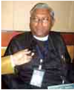
ဦးကိုနီ(တရားလွတ်တော်ရှေ့နေ)

အောင် ဆောင်ရွက်တာဖြစ်ပါတယ်။ အဲဒီကမူ အားသာချက်တွေကို ဆွဲထုတ်ပြီး အားနည်းချက်တွေကို