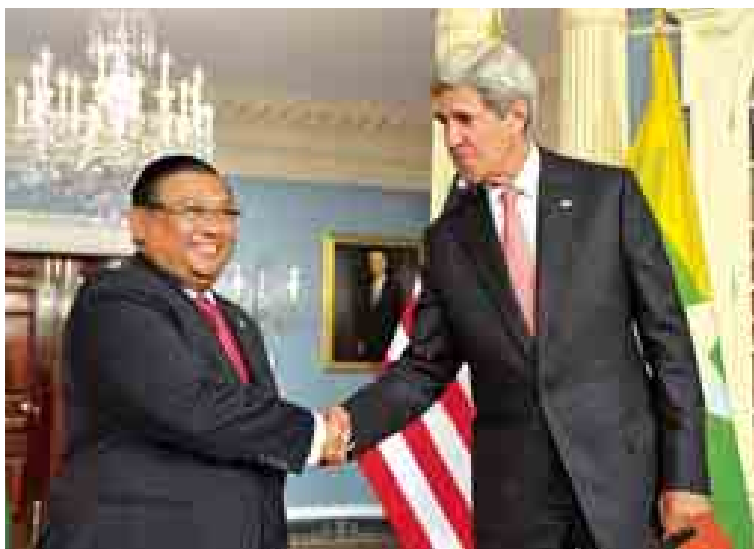
ပြည်ထောင်စုဝန်ကြီး ဦးဝဏ္ဏမောင်လွင် အမေရိကန်နိုင်ငံခြားရေးဝန်ကြီး Mr. John F. Kerry နှင့် ရင်းရင်းနှီးနှီး နှုတ်ဆက်စဉ်။