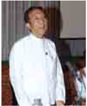
ပြည်ထောင်စုဝန်ကြီး ဦးဝင်းရှိန် ရှင်းလင်းပြောကြားစဉ်။ (သတင်းစဉ်)

ကြောင်း၊ မူဘောင်အတွင်းမှနေ၍ လုပ်ငန်းစဉ်များကို အစီအစဉ်တကျ ရေးဆွဲအကောင်အထည်ဖော်ဆောင် ရွက်လျက်ရှိကြောင်း။ နိုင်ငံတော်အနေဖြင့် အမျိုးသား ဖွံ့ဖြိုးတိုးတက်မှုအတွက် ပထမ(၅) နှစ် စီမံကိန်းကို ၂၀၁၁ခုနှစ် ဧပြီ ၁ရက်မှ ၂၀၁၆ခုနှစ် မတ် ၃၁ရက် အထိ ရေးဆွဲအကောင်အထည်ဖော်