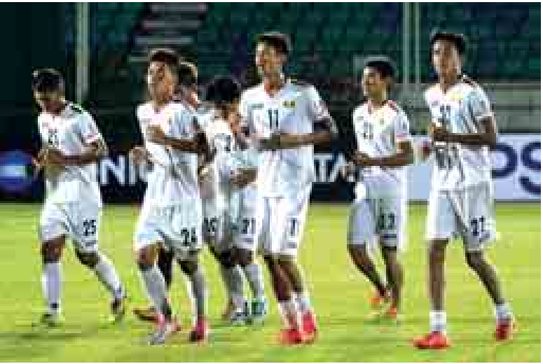
များကို ဝဏ္ဏသိဒ္ဓိကွင်းတို့တွင် ကျင်းပ မည်ဖြစ်သော်လည်း အုပ်စုနောက်ဆုံး ပွဲစဉ်များကို အဆိုပါနှစ်ကွင်း၌ တစ်ပြိုင်နက် ကစားစေမည်ဖြစ်သည်။ အုပ်စုပွဲစဉ်များမှာ အောက်တိုဘာ ၁၄ ရက်တွင် ပြီးဆုံးမည်ဖြစ်ပြီး စာမျက်နှာ ၅ ကော်လံ ၁ ○

သတင်း-ညီမြတ်သော်တာ အောက်တိုဘာ ၉ ရက်မှ ၂၃ ရက် အထိ ရန်ကုန်မြို့ရှိ သုဝဏ္ဏကွင်းနှင့် နေပြည်တော်ရှိ ဝဏ္ဏသိဒ္ဓိကွင်းတို့၌ ကျင်းပမည်ဖြစ်ပြီး အိမ်ရှင်မြန်မာ အသင်းအပါအဝင် အာရှဒေသတွင်း မှ အသင်း(၁၆)သင်း ဝင်ရောက် ယှဉ်ပြိုင်မည်ဖြစ်သည်။ အုပ်စုခွဲဝေ ထားမှုအရ အိမ်ရှင်မြန်မာအသင်းမှာ အုပ်စု(က)တွင် အီရန်၊ ယီမင်၊ ထိုင်း အသင်းတို့နှင့်အတူကျရောက်နေပြီး အုပ်စု(ခ)တွင် ဥရဘက်ကစွတန်၊ ဩစတြေးလျ၊ ယူအေအီး၊ အင်ဒို နီးရှား၊ အုပ်စု(ဂ)တွင် တောင်ကိုရီး