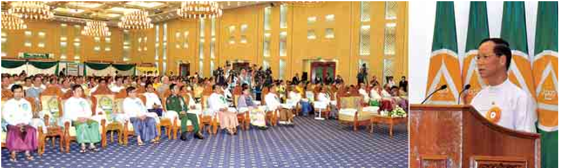
ဒုတိယသမ္မတ ဒေါက်တာစိုင်းမောက်ခမ်း ကမ္ဘာ့ဆရာများနေ့အထိမ်းအမှတ်အခမ်းအနားတွင် အမှာစကား ပြောကြားစဉ်။

နေပြည်တော် အောက်တိုဘာ ၅ မျိုးဆက်သစ်လူငယ်များကို အသိအတတ်ပညာရှင် များဖြစ်စေရန် ပြုစုပျိုးထောင်ပေးကြသည့် ဆရာ ဆရာမ များ၏ ကြိုးပမ်းဆောင်ရွက်မှုကိုလည်းကောင်း၊ လူ့အဖွဲ့ အစည်းတွင် ဆရာ ဆရာမများ၏ အခန်းကဏ္ဍသည် မရှိ မဖြစ် အရေးပါမှုကို အသိအမှတ်ပြုသည့် အနေဖြင့်လည်း ကောင်း၊ ပညာရေးလုပ်ငန်းများကို အဓိကအကောင်အထည်