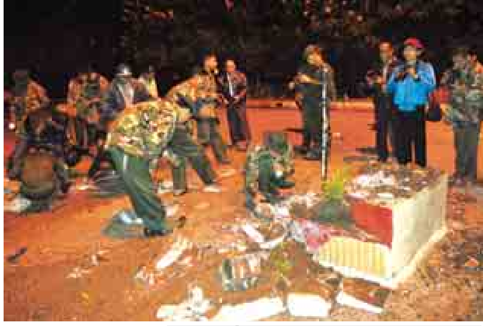
ပေါက်ကွဲမှုဖြစ်ပွားသည့်နေရာကို တာဝန်ရှိသူများ စစ်ဆေးစဉ်။ များကာရံကာ ရေလုံစနစ်ဖြင့် ဖောက်ခွဲဖျက်ဆီးခဲ့ကြောင်းနှင့် လုံခြုံရေး၊ တည်ငြိမ်အေးချမ်းရေးနှင့်

အဆိုပါပေါက်ကွဲမှုကြောင့် အရှည်ပေ ၂၀ ခန့်ရှိ ကားမှတ်တိုင်(သစ်သား) ထိုင်ခုံမှာ ၁၀ ပေခန့်ယှက်စီးပြီး အမြင့် ၁၅ ပေခန့်ရှိ မှတ်တိုင်(သွပ်မိုး)မှာ လည်း ပွင့်ထွက်ပျက်စီးကာ လူထိခိုက်ဒဏ်ရာရမှုမရှိကြောင်း သိရသည်။ ဆက်လက်၍ ည ၁၀ နာရီ မိနစ် ၄၀ တွင် တောင်ကြီးမြို့ သစ်တောရပ်ကွက် ဗိုလ်ချုပ်အောင်ဆန်းလမ်းဘေး တောင်ဘက်ခြမ်းတွင် ပေါက်ကွဲမှုဖြစ်ပွားပြီးနောက် ည ၁၀ နာရီ မိနစ် ၅၀ တွင် အဆိုပါနေရာအနီး ထပ်မံပေါက်ကွဲမှုဖြစ်ပွားခဲ့ရာ တာဝန်ထမ်းဆောင်နေသည့် လုံခြုံရေးတပ်ဖွဲ့ဝင်နှစ်ဦး ထိမှန်ဒဏ်ရာ(မစိုးရိမ်ရ) ရရှိခဲ့ကြောင်းသိရသည်။ အဆိုပါ ပေါက်ကွဲမှုနေရာများသို့ နယ်မြေခံတပ်မှ မိုင်းရှင်းလင်းရေးနှင့် လုံခြုံရေးတပ်ဖွဲ့ဝင်များတောင်ကြီးမြို့နယ်ရဲတပ်ဖွဲ့မှ လှည့်ကင်းလုံခြုံရေးတပ်ဖွဲ့ဝင်များက ရှင်းလင်းဆောင်ရွက်ခဲ့ရာ အခင်းဖြစ်နေရာအနီးတွင် ပေါက်ကွဲမှုမရှိသေးသည့် ရှေ့ထွက်မိုင်းတစ်လုံးနှင့် စစ်ဘက်ဆိုင်ရာ အတွင်း မပေါက်ကွဲသေးသည့် မိုင်းတစ်လုံးတို့အား ထပ်မံတွေ့ရှိရ၍ မိုင်းရှင်းလင်းရေးအဖွဲ့က သိအိတ်