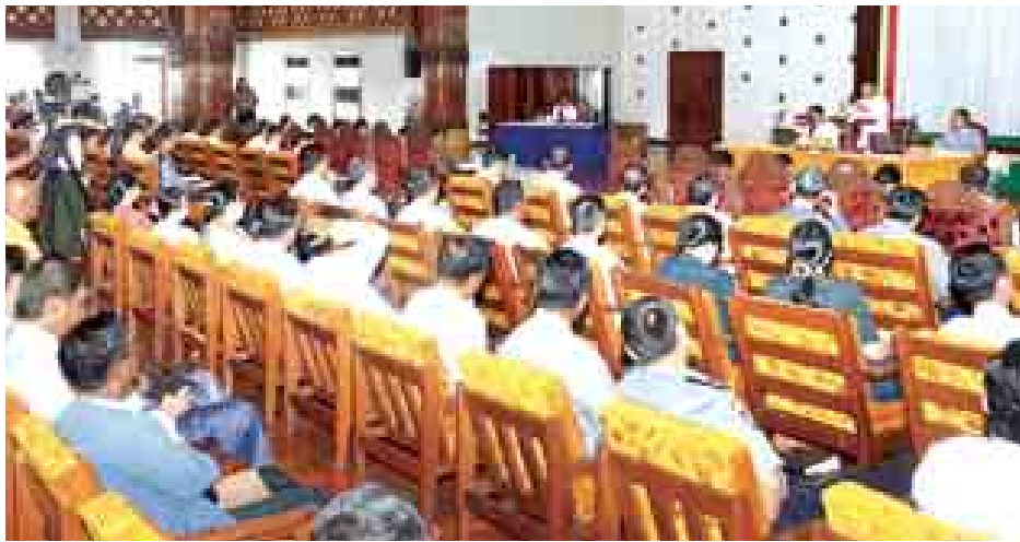
ပြည်ထောင်စုဝန်ကြီး ဦးစိုးသိန်း ပြည်ထောင်စုဝန်ကြီးများနှင့် မီဒီယာများ တွေ့ဆုံပွဲတွင် အမှာစကားပြော ကြားစဉ်။

ထို့နောက် အမျိုးသားစီမံကိန်း နှင့်စီးပွားရေးဖွံ့ဖြိုးတိုးတက်မှုဝန်ကြီး ဌာန ပြည်ထောင်စုဝန်ကြီး ဒေါက်တာ ကဲဒော်က မိမိတို့ အစိုးရအဖွဲ့တာဝန် ယူပြီးနောက် အသွင်ကူးပြောင်းရေး ကာလအဖြစ် လိုအပ်သည့်နိုင်ငံ၏ စီးပွားရေးမူဝါဒ (၄)ချက်ကို ချမှတ်ခဲ့ ကြောင်း၊ စီးပွားရေးနှင့် လူမှုရေး ပြုပြင်ပြောင်းလဲရေးမူဘောင် (၁၀) ချက်ကို အခြေခံပြီး ချမှတ်ခဲ့ခြင်းဖြစ် ကြောင်း၊ အဆိုပါ အခြေခံမူဘောင် (၁၀)ချက်နှင့်အညီ ပထမ(၅) နှစ် စီမံကိန်းလုပ်ငန်းများကို အကောင် အထည်ဖော် ဆောင်ရွက်လျက်ရှိ