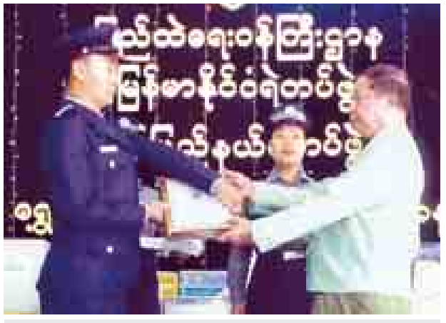
စက်တင်ဘာ ၁ ရက်က မြန်မာနိုင်ငံရဲတပ်ဖွဲ့နှစ် (၅၀)ပြည့် ရွှေရတုနှစ်ပတ်လည်နေ့ အထိမ်းအမှတ်အခမ်းအနားကို မွန်ပြည်နယ်ရဲတပ်ဖွဲ့မှူးချုပ်ရုံး ဓမ္မဗိမာန်၌ကျင်းပရာ မွန်ပြည်နယ်ရဲတပ်ဖွဲ့မှ မူခင်းဖော်ထုတ်နိုင်မှုဆုရ ရဲတပ်ဖွဲ့ဝင်တစ်ဦးအား မွန်ပြည်နယ်ဝန်ကြီးချုပ် ဦးအုန်းမြင့် ဆုချီးမြှင့်စဉ်။ (ပြည်နယ်ရဲတပ်ဖွဲ့)