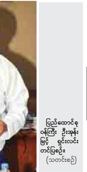
ပြည်ထောင်စု ဝန်ကြီး ဦးကျော် ဆန်း ရှင်းလင်း တင်ပြစဉ်။ (သတင်းစဉ်)

ဒေသဖွံ့ဖြိုးရေး အသီးအပွင့်များကို ခံစားရရှိဖို့ လိုအပ်ပါကြောင်း၊ ချ မှတ်ထားသော ဥပဒေ၊ လုပ်ထုံးလုပ် နည်းများညီ/ မညီစစ်ဆေးမှတ် ကျောက်တင်ခံနိုင်ရန် တရား ဥပဒေ စိုးမိုးရေးသည် အရေးကြီးပါကြောင်း။ တိကျသော သတင်းအချက် အလက်များကို ပြည်သူများနှင့် သက်ဆိုင်သူအားလုံး သိရှိနိုင်အောင်