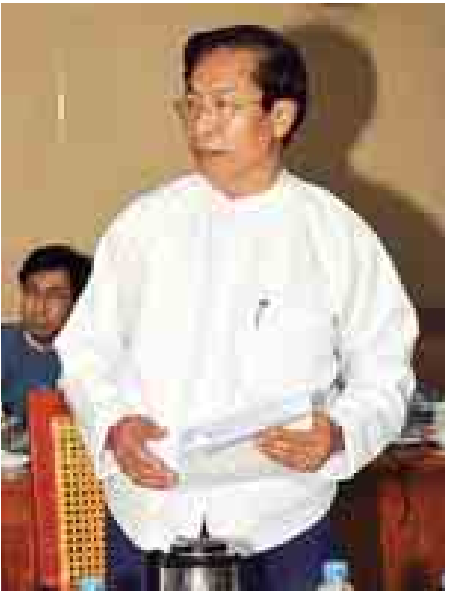
ပြည်ထောင်စု ဝန်ကြီး ဦးအုန်း မြင့် ရှင်းလင်း တင်ပြစဉ်။ (သတင်းစဉ်)

နည်းများ၊ စီမံကိန်းထောက်ပံ့မှုနှင့် အကျိုးရလဒ်အကဲဖြတ်ခြင်းဆိုင်ရာ လုပ်ထုံးလုပ်နည်းများ ရေးဆွဲလိုက် နာသွားကြရန် ဖြစ်ပါကြောင်း။ ငွေစာရင်းဆိုင်ရာ စီမံခန့်ခွဲမှု၊ လုပ်ငန်းပြီးစီးမှုတို့ကို နိုင်ငံတော် မှပြဋ္ဌာန်းထားသော လုပ်ထုံးလုပ်နည်း များအတိုင်း ဆောင်ရွက်သွားရန် ဖြစ်သလို ပြည်သူလူထုပါဝင်သည့်