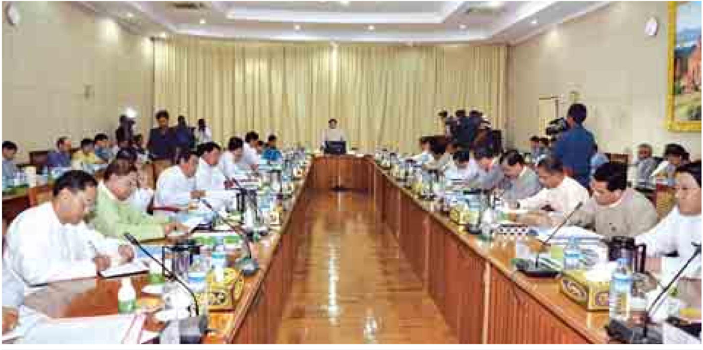
ကျေးလက်ဒေသဖွံ့ဖြိုးရေးနှင့် ဆင်းရဲနွမ်းပါးမှုလျော့ချရေးလုပ်ငန်းကော်မတီဥက္ကဋ္ဌ ဒုတိယသမ္မတ ဦးညွှန်ထွန်း ကျေးလက်ဒေသဖွံ့ဖြိုးရေးနှင့်ဆင်းရဲနွမ်းပါးမှုလျော့ချရေးလုပ်ငန်းကော်မတီ လုပ်ငန်းညှိနှိုင်းအစည်းအဝေး၌ အမှာစကားပြောကြားစဉ်။ (သတင်းစဉ်)

ရှေးဦးစွာ ဒုတိယသမ္မတက နိုင်ငံတော်၏ရည်မှန်းချက်ဖြစ်သော ဆင်းရဲမွဲတေအား ၂၀၁၅ ခုနှစ်တွင် ၁၆ ရာခိုင်နှုန်းအထိ လျော့ချနိုင်ရန်အတွက် ကျေးလက်ဒေသဖွံ့ဖြိုးရေးလုပ်ငန်းစဉ်တွင် အားလုံးပူးပေါင်းပါဝင်လျက် ရေရှည်တည်တံ့ခိုင်မြဲမည့် ဖွံ့ဖြိုးရေးဖော်ဆောင်ရန် ကျေးလက်လူထု၏ စွမ်းဆောင်ရည်မြှင့်တင်ရေးအတွက် လူထုအခြေပြုအဖွဲ့များ အားကောင်းလာစေပြီး ကောင်းမွန်သော အုပ်ချုပ်မှုစနစ်ဖြစ်ပေါ်လာစေရန်၊ မမျှော်မှန်းနိုင်သော ဘေးအန္တရာယ်များ ကျရောက်လာပါက ကျေးလက်ဒေသကို စာမျက်နှာ ၈ ကော်လံ ၁ *: