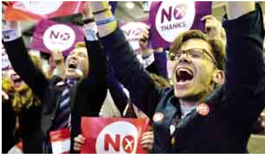
ဗြိတိန်မှ ခွဲထွက်လိုခြင်းမရှိကြောင်း ဆန္ဒပြုကြသည့် စကော့တလန်ပြည်သူများ အောင်ပွဲခံစဉ်။

ကနေတစ်ဆင့် ပူးပေါင်းဆောင်ရွက်ရပါတယ်။ စကော့ အများစုက ပိုမိုလုပ်ပိုင်ခွင့်ရရှိလိုပြီး လူမျိုးရေးစိတ်ဓာတ် ပြင်းထန်သူတွေကတော့ လုံးဝလွတ်လပ်ရေးလိုချင်ကြ ပါတယ်။ စကော့တလန်မြောက်ပိုင်း ပင်လယ်ကမ်းလွန် ရေနံက ရတဲ့ဝင်ငွေတွေကြောင့် ခွဲထွက်ခြင်းဖြင့် စီးပွား ရေးအရ ပိုမိုတောင့်တင်းအင်အားရှိလာမယ်လို့ ယူဆကြပါတယ်။ ဒီအခြေအနေမှာ ၂၀၁၁ ခုနှစ် စကော့ ပါလီမန်ရွေးကောက်ပွဲမှာ အနိုင်ရတဲ့ စကော့အမျိုးသား ပါတီအင်္ဂလန်အစိုးရခေါင်းဆောင် အဲလက်စ်ဆာလမ္မန် စကော့တလန်ဝန်ကြီးချုပ်ဖြစ်လာပြီး ရွေးကောက်ပွဲ ကာလက ကြွေးကြော်ခဲ့သည့် အတိုင်းခွဲထွက်ရေး လှုပ်ရှားတောင်းဆိုလာပါတယ်။ လူထုဆန္ဒခံယူပွဲပဒေ ကြမ်းကို စကော့တလန်ပါလီမန်မှ ၂၀၁၃ မတ်လ ၂၁ ရက်မှာ တင်သွင်းပြီး နိုဝင်ဘာလ ၁၄ ရက်တွင် အတည် ပြုကာ ဘုရင်မကြီးက ဒီဇင်ဘာလ ၁၇ ရက်တွင် သဘော တူခဲ့ပါတယ်။