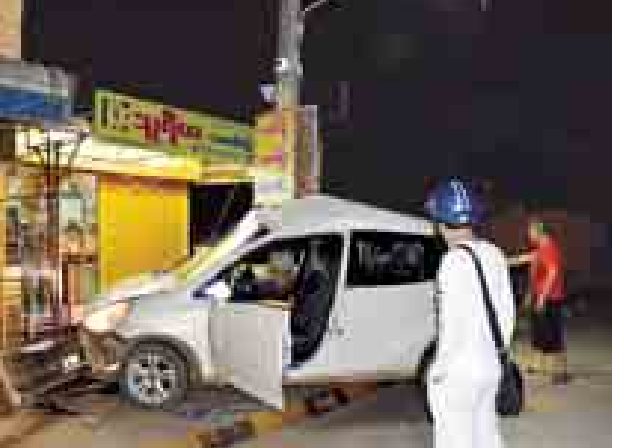
လှိုင်၊နောက်ခန်းတွင်လိုက်ပါလာသည့် အရှိန်ပြင်းထန်စွာ တိုက်မိမှုကြောင့် မယဉ်ယဉ်သက်နှင့်မရွန်းလှဝင်းတို့ သုံးဦးတွင်လည်း ထိခိုက်ဒဏ်ရာများ (မစိုးရိမ်ရ) ရရှိသွားခဲ့သည်။ ထို့ပြင် ပျက်စီးခဲ့သည်။ မောင်ယဉ်ကျေး

ပြားတစ်ခု၊ အလေးချိန် ၂ ပဲ ၃ ရွှေ့ရှိ ရွှေညောင်ရွက် တစ်ခု၊ အလေးချိန် ၁ ပဲ ၁ ရွှေ့ရှိ ရွှေတိုရွှေစသုံးခု၊ အလေးချိန် ၁ ကျပ်သား ၄ ပဲ ၂ ရွှေ့ရှိ သစ်စေးသရိုးပြားတစ်ခုတို့ကို ရေသပွယ်သည့် ရေနှင့်အတူ မျောပါလာသည်ကို တွေ့ရှိသဖြင့် တောင်ဂေါ် ဘုရားဂေါပကအဖွဲ့က ထိန်းသိမ်းထားကြောင်း သိရသည်။ တင်ထွင်