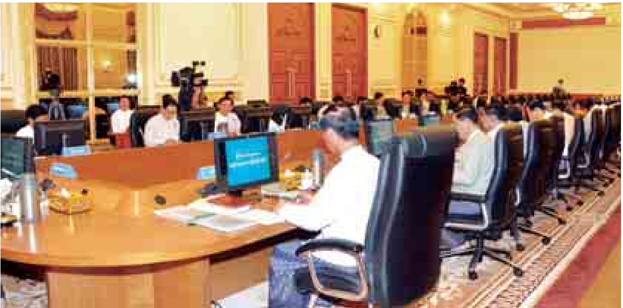
ပြည်ထောင်စုသမ္မတမြန်မာနိုင်ငံတော် ဘဏ္ဍာရေးကော်မရှင် (၃/၂၀၁၄) ကြိမ်မြောက် အစည်းအဝေးသို့ တက်ရောက်ကြသူများအား တွေ့ရစဉ်။ (သတင်းစဉ်)

မိမိတို့အနေဖြင့် ပြည်ထောင်စုနှင့် တိုင်းဒေသကြီး/ပြည်နယ်များအကြား ဘဏ္ဍာငွေအရအသုံးဆိုင်ရာ ခွဲဝေကျင့်သုံးမှုကို ပိုမိုသင့်လျော်