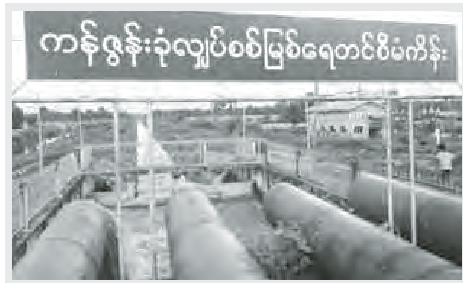
မြန်အောင်မြို့နယ်တွင် စက်တင်ဘာလအတွင်း မိုးနည်းခဲသော်လည်း မိုးစပါး အောင်ရေရရှိရေးအတွက် မြို့နယ်စိုက်တိုးမြှင့်အဖွဲ့၏ စီစဉ်မှုဖြင့် ကန်စွန်းခုံလျှပ်စစ်မြစ်ရေတင်စီမံကိန်းနှင့် ငမိဆိပ်လျှပ်စစ်မြစ်ရေတင်စီမံကိန်းတို့မှ ရေတင်၍ မိုးစပါးအောင်ရေဖြန့်ဝေပေးနေမှုကို စက်တင်ဘာ ၃၀ ရက်က တွေ့မြင်ရစဉ်။