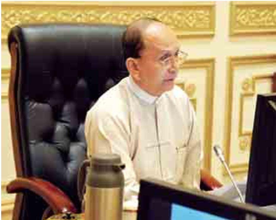
နိုင်ငံတော်သမ္မတ ဦးသိန်းစိန် ပြည်ထောင်စုသမ္မတမြန်မာနိုင်ငံတော် ဘဏ္ဍာရေးကော်မရှင် (၃/၂၀၁၄) ကြိမ်မြောက် အစည်းအဝေးတွင် အမှာစကားပြောကြားစဉ်။ (သတင်းစဉ်)