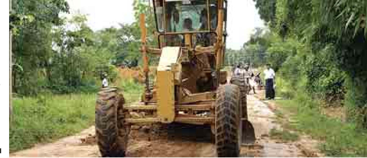
ငွေသိန်း(ပေါ်ဘက်)

ကျေးလက်နေပြည်သူလူထု လူမှုဘဝ မြှင့်တင်ပေးပြီးတိုးတက်ရေးအတွက် ရန်ကုန်တိုင်းဒေသကြီး စည်ပင်သာယာရေးအဖွဲ့က ကြီးကြပ်ဆောင်ရွက်လျက်ရှိသော ရန်ကုန်မြောက်ပိုင်းခရိုင် မှော်ဘီမြို့နယ် ဘိုးဒေါက်ကျေးရွာနှင့် ကြိမ်ခံစမ်းကျေးရွာဆက်သွယ်ဖောက်လုပ်ထားသော အရွှည်ပေ ၆၅၀၀ ရှိ ကျေးရွာချင်းဆက်ခြင်းလမ်းကို နှစ်ဘီးသွားကွန်ကရစ်လမ်းအဖြစ် ဖောက်လုပ်ဆောင်ရွက်မည်ဖြစ်ရာ စက်တင်ဘာ ၂၉ ရက်က မြေထိုးစက်ကြီးများဖြင့် မြေသားလမ်းပြင်ဆောင်ရွက် လျက်ရှိသည်ကို တွေ့ရသည်။