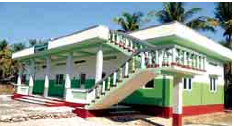
ဝှံမြို့နယ် လောင်းကျိုးအမကကျောင်းကို တွေ့ရစဉ်။

အောင်မြင်လှအမကနှင့် ကျေးတောအမက၊ ကျောက်တော်မြို့နယ်တွင် ပြင်လှမူလွန်နှင့် ဒေါင်းတောယိုးအမက၊ မြောက်ဦးမြို့နယ်တွင် တောင်ဦးမူလွန်နှင့် ကြက်ဖျေးအမကကျောင်းများ ဖြစ်ကြသည်။ ယင်းကျောင်းများအနက် ပေါက်တောမြို့နယ်နှင့် ပုဏ္ဏားကျွန်းမြို့နယ်မှ ကျောင်းလေးကျောင်းကို သံကုက္ကနီကရစ်သဘာဝဘေးဒဏ်ခံ အဆောက်အအုံများအဖြစ် တည်ဆောက်ပေးထားခြင်းဖြစ်သည်။ စီမံကိန်း ဒုတိယနှစ် ၂၀၁၄ ခုနှစ် မတ်လမှစ၍ စီမံကိန်းဒုတိယနှစ်တွင် အကျုံးဝင်သော ကျောင်း ၂၀ ကို ဆက်လက်ဆောက်လုပ်ခဲ့ရာ ဇူလိုင်လအထိ တောင်ကုတ်မြို့နယ်တွင် သံပုရာကိုင်း(၁) အမက၊ ကင်းတောင် အမက၊ ဇနီအမကနှင့် နတ်ကန် မူလွန်ကျောင်းများ၊ ဝှံမြို့နယ်တွင် အလယ်ချောင်း အမက၊ သပြေချောင်း အမကနှင့် လောင်းကျိုးအမကကျောင်းများ၊ သံတွဲမြို့နယ်တွင် ကွေ့ချောင်း အမကနှင့် ဂုံမင်းချောင်း အမကကျောင်းများ၊ စစ်တွေမြို့နယ်တွင် ပျားလည်ချောင်းအမကနှင့် ကံကော်ကျွန်း အမကကျောင်းများ၊ မောင်တောမြို့နယ်တွင် ပြားသားမူလွန်ကျောင်း၊ ရသေ့တောင်မြို့နယ်တွင် အောင်စည်ကျွန်း အမက အပါအဝင် စုစုပေါင်း ၁၃ ကျောင်းမှာ ရာနှုန်းပြည့် ဆောက်လုပ်ပြီးစီးခဲ့ပြီဖြစ်သည်။ ကျန်ခဲ့ရာ