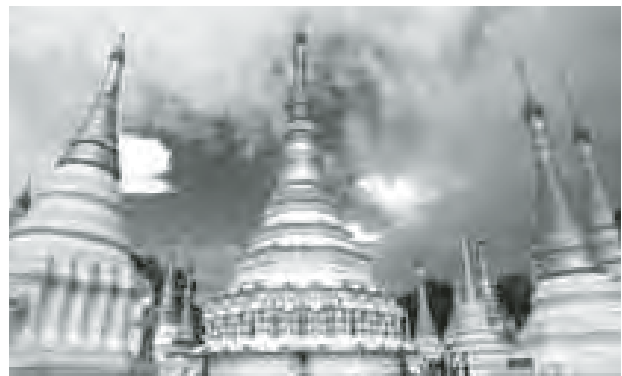
ဆင်ခံဘုရား

တော်ဘွားများနှင့်ပြည်သူများ စုပေါင်း၍ ပန္နက်အုတ်မြစ်ချခဲ့ကြောင်း၊ ကောဇာ သက္ကရာဇ် ၁၂၇၀ ပြည့်နှစ်တွင် ထီးတော်တင်လှူခဲ့ကြောင်း၊ ကောဇာသက္ကရာဇ် ၁၂၇၁ ခုနှစ် ကဆုန်လပြည့်နေ့တွင် မန္တလေးမြို့မှပင့်ဆောင်လာသော မဟာ မြတ်မုနိဆင်းတုတော်ကြီးကို ရွှေသင်္ကန်းပေါ်သို့ ပင့်ဆောင်စံမြန်းတော်မူခဲ့ကြောင်း သိရသည်။