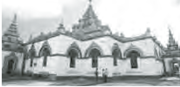
မဟာမြတ်မုနိဘုရားကြီး

ရှမ်းပြည်နယ်(တောင်ပိုင်း) လွိုင်လင်ခရိုင် လဲချားမြို့သည် လွိုင်လင်မြို့၏ မြောက်ဘက် ၃၂ မိုင်အကွာတွင် တည်ရှိသောမြို့တစ်မြို့ဖြစ်သည်။