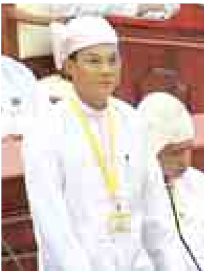
ဒုတိယရှေ့နေချုပ် ဦးထွန်းထွန်းဦး ဖြေကြားစဉ်။ (သတင်းစဉ်)

ပထမအကြိမ် ပြည်သူ့လွှတ်တော် (၁၁)ကြိမ်မြောက် ပုံမှန်အစည်းအဝေး (၁၄)ရက်မြောက်နေ့ကို ယနေ့ နံနက် ၁၀ နာရီတွင် ကျင်းပရာ ရမည်းသင်းမဲဆန္ဒနယ်မှ ဦးဘိုနီ၏ “မြန်မာ့အားကစား မြင့်မားတိုးတက်ရေး အတွက် ပြုပြင်ထိန်းသိမ်းစရိတ်၊ ပြိုင်ပွဲစရိတ်များကို နှစ်စဉ်ဘတ်ဂျက်များတွင် ထည့်သွင်းချထားပေးရန် အစီအစဉ် ရှိ/မရှိ” မေးခွန်းနှင့် စပ်လျဉ်း၍ အားကစားဝန်ကြီးဌာန ဒုတိယဝန်ကြီး ဦးဇော်ဝင်းက အားကစားဝန်ကြီးဌာန အနေဖြင့် တိုင်းဒေသကြီးနှင့် ပြည်နယ်ဝန်ကြီးချုပ်ဖလား အားကစားပြိုင်ပွဲများကို သက်ဆိုင်ရာတိုင်းဒေသကြီးနှင့် ပြည်နယ် ၁၅ ခု၏ မြို့တော်များတွင် ကျင်းပပြုလုပ်ပေးလျက်ရှိပြီး ယင်းပြိုင်ပွဲ၏ ပြိုင်ပွဲကျင်းပစရိတ်၊ ခရီးစရိတ်၊ စားသောက်စရိတ်များကို နေရာဒေသအလိုက် ကျင်းပသည့် အားကစားနည်းများနှင့် ပြိုင်ပွဲအမျိုးအစားပေါ်မူတည်ပြီး အနည်းဆုံး ငွေကျပ် ၁၆၃ သိန်းမှ အများဆုံးကျပ် ၅၂၈ သိန်းကို အားကစားဝန်ကြီးဌာန ဘတ်ဂျက်မှ ကျခံပေးလျက်ရှိပါကြောင်း။