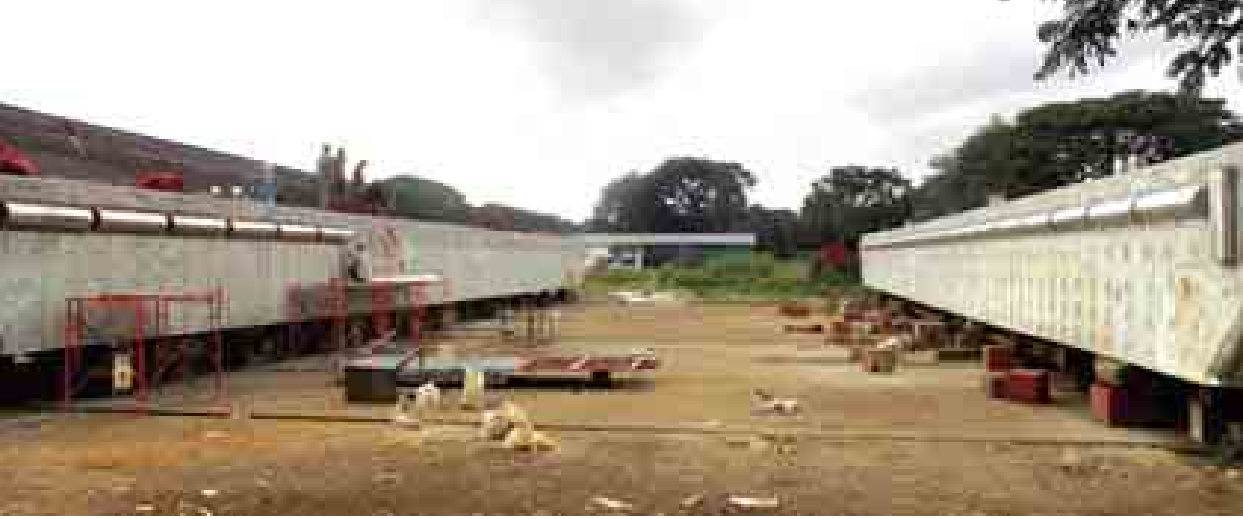
ကွန်ကရစ်ဆိပ်ခံဗောအသစ်နှစ်စင်း တည်ဆောက်မှုရာနှုန်းပြည့်ပြီးစီးပြီဖြစ်ရာ ရေချဆောင်ရွက်တော့မည့်အနေအထားကို တွေ့ရစဉ်။

ဒလ အောက်တိုဘာ ၂ ပြည်တွင်းရေးကြောင်းပို့ဆောင်ရေးက ပန်းဆိုးတန်း-ဒလကူးတို့လမ်းမှကူးတို့စီးခရီးသည်များ အဆင်ပြေလွယ်ကူကြစေရန်အတွက် ဒလဘက်ကမ်းတွင် ဒလဆိပ်ကမ်း ပြန်လည်ထူထောင်ရေးရှေ့ပြေးစီမံကိန်းကို အကောင်အထည်ဖော်ဆောင်ရွက်လျက်ရှိကြောင်း သိရသည်။ ထို့ကြောင့် ယခုအခါ ဒလ ဆိပ်ကမ်း ပြန်လည်ထူထောင်ရေး ရှေ့ပြေးစီမံကိန်းထဲမှ ပြည်တွင်း ရေကြောင်းပို့ဆောင်ရေး၊ ဒလ သင်္ဘောကျင်းမှ ဆောင်ရွက်နေသည့် မြန်မာနိုင်ငံတွင် တည်ဆောက် လိုက်သော ကွန်ကရစ်ဆိပ်ခံဗော အမျိုးအစားဖြစ်သည့် ဒလ-ပန်းဆိုး တန်း Ferry ကွန်ကရစ် ဆိပ်ခံဗော အသစ်နှစ်စင်း တည်ဆောက်မှုသည် ရာနှုန်းပြည့် ပြီးစီးနေပြီဖြစ်သော ကြောင့် လာမည့်အောက်တိုဘာ ၇ ရက်တွင်ကွန်ကရစ် ဆိပ်ခံဗော တစ်စင်းကို ရေချဆောင်ရွက်မည် ဖြစ်ပြီး အောက်တိုဘာ ၁၁ ရက်တွင် ကျန်ကွန်ကရစ် ဆိပ်ခံဗောတစ်စင်း ကို စာမျက်နှာ ၃ ကော်လံ ၁ *