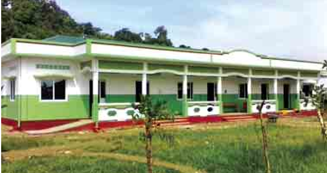
မင်းပြားမြို့နယ် ဈေးဟောင်းပိုင်း အမကကျောင်းကို တွေ့ရစဉ်။

လုပ်ငန်းခွင်ဝင်ရင်း စာတွေ့၊ လက်တွေ့သင်ကြားပို့ချပေးခဲ့ရာ ကျေးရွာသူ၊ ကျေးရွာသားများအတွက် အကျိုးကျေးဇူးဖြစ်ထွန်းခဲ့ကြောင်း တွေ့ရသည်။ စီမံကိန်းကာလနှစ်နှစ်အတွင်း ကျောင်းပေါင်း ၃၀ ဆောက်လုပ်ခဲ့ရာတွင် လုပ်ငန်းခွင်ကျွမ်းကျင်လုပ်သား ၄၇၆ ဦး ပေါ်ထွက်ခဲ့ပြီး ၎င်းတို့အနက် BAJ အဖွဲ့တွင် ၅၀၊ အခြားဆောက်လုပ်ရေး ကုမ္ပဏီများတွင် ၂၃၀ ဝင်ရောက်လုပ်ကိုင်လျက်ရှိကြောင်း သိရသည်။ ကျောင်း(၁၀၀)ပြည့် အခမ်းအနား နိပုန်ဖောင်ဒေးရှင်း၏မူအရ ကျောင်းပေါင်း (၁၀၀) ပြည့် အခမ်းအနားများ ကျင်းပလေ့ရှိကြောင်း သတိပြုမိသည်။ စေတနာအဖွဲ့က ရှမ်းပြည်နယ်အတွင်း စာသင်ကျောင်းများ ဆောက်လုပ်ပေးလျက်ရှိရာ ကျောင်း(၁၀၀)ပြည့် အခမ်းအနားကို နောင်ချိုမြို့နယ်အတွင်းမှ အမှုသီး ကျေးရွာတွင်လည်းကောင်း၊ ကျောင်း(၂၀၀)ပြည့် အခမ်းအနားကို ဓနုကိုယ်ပိုင်အုပ်ချုပ်ခွင့်ရ ဒေသ အင်းငယ်တွင်လည်းကောင်း ကျင်းပခဲ့သည်။ ယခုလည်း ရခိုင်ပြည်နယ်အတွင်း BAJက ကျောင်းများ ဆောက်လုပ်ပေးခဲ့ရာ ထိုအထဲတွင်မှ ကျောင်းတစ်ကျောင်းမှာ ကျောင်း(၁၀၀)ပြည့် အခမ်းအနားကျင်းပ၍ ဖွင့်လှစ်ခွင့်ရမည်ဖြစ်သည်။ ကျောင်းဆောင်သစ်များ ပေါ်ထွန်းလာခြင်းနှင့်အတူ BAJ ၏ စေတနာကိုလည်း ဒေသခံတိုင်းရင်းသားများက အမြဲထာဝရအသိအမှတ်ပြုနေမည် ဖြစ်ပါကြောင်း။ ။