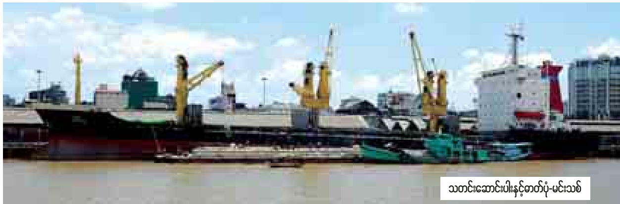
သတင်းဆောင်းပါးနှင့်စာတိုပုံ-မင်းသစ်

နိုင်ငံ၏စီးပွားရေးစနစ်ပြောင်းလဲ ဖွံ့ဖြိုးတိုးတက်လာမှုနှင့်အတူ ကုန် သွယ်မှု လုပ်ငန်းတွင်လည်း ပင်လယ် ရေကြောင်းကုန်သွယ်မှုလုပ်ငန်းသည် တစ်နှစ်ထက် တစ်နှစ်ကြီးထွားလာ သည်။ ထိုနည်းတူ ဆိပ်ကမ်းလုပ်ငန်း သည် နိုင်ငံ၏စီးပွားရေးအတွက် အဓိကအခန်းကဏ္ဍမှ ပါဝင်လာသည်။ မြန်မာနိုင်ငံ၏ ပင်လယ် ရေကြောင်း ကုန်သွယ်မှုတွင် ၂၀၁၃-၂၀၁၄ ခုနှစ်တွင် ပို့ကုန် သွင်းကုန် ပမာဏတန်ချိန် ကိုးသန်းရှိခဲ့ရာမှ ၂၀၁၃-၂၀၁၄ ခုနှစ်တွင် တန်ချိန် ၂၄ သန်းကျော်ရှိခဲ့သည်။ ရန်ကုန်ဆိပ် ကမ်းသို့ ပင်လယ်ရေကြောင်းမှ နိုင်ငံ တကာသင်္ဘောကြီးများ ဝင်ရောက် ဆိုက်ကပ်မှုမှာလည်း ၂၀၁၃-၂၀၁၄ ခုနှစ်တွင် ၉၇၁ စင်းရှိခဲ့ရာမှ ၂၀၁၃-၂၀၁၄ ခုနှစ်တွင် ၂၃၃၄ စင်းအထိ နှစ်ဆခွဲခန့်တိုးတက်များပြားလာသည် ကို တွေ့ရသည်။ မြန်မာ့ဆိပ်ကမ်း အာဏာပိုင်က