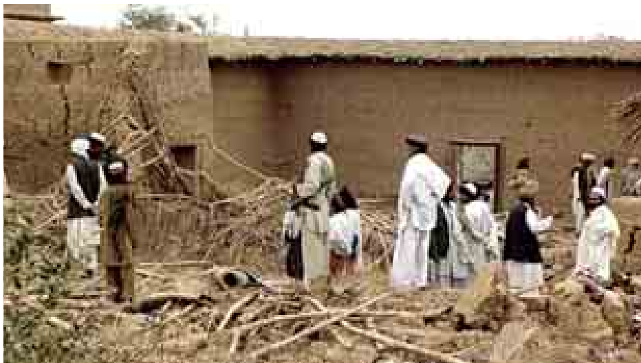
ဝါရှင်တန် စက်တင်ဘာ ၂၉ တောင်တန်းထူထပ်ရာ လူမျိုးစုံ အာဖဂန်နယ်စပ်အနီး ပါကစ္စတန် အမေရိကန်တို့၏ ကမ္ဘာတန် အနောက်မြောက်ပိုင်း မောင်းသူမဲ့လေယာဉ်ဖြင့် တိုက်ခိုက်မှုကြောင့် အနည်းဆုံး လူပေါင်း ၅၉၀၀ကျော် သေဆုံးပြီး ၁၀၆၀၀ ဒဏ်ရာရရှိခဲ့ကြောင်း စစ်ဘက်ဆိုင်ရာ စာရင်းဇယားများ၌ ဖော်ပြသည်။ (ဆင်ဟွာ)

လွန်ခဲ့သည့်နှစ်က အီရတ်ကို သွေးချောင်းစီးသည့် နှစ်တစ်နှစ်အဖြစ် ကြေညာခဲ့ပြီး နှစ်ကုန်ပိုင်းတွင် လူ ၈၀၀၀ထက်မနည်း အသတ်ခံခဲ့ရသည်။ (ပရက်စ်တီဗီ)