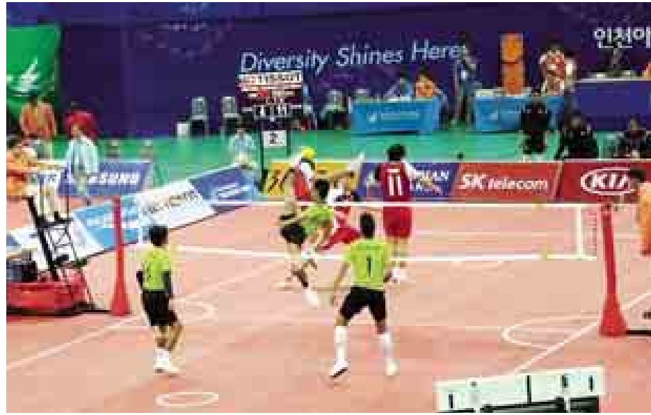
အမျိုးသားသုံးယောက်တွဲ ပိုက်ကျော်ခြင်းပြိုင်ပွဲတွင် မြန်မာအသင်းနှင့် တရုတ်အသင်းတို့ ယှဉ်ပြိုင်ကြစဉ်။