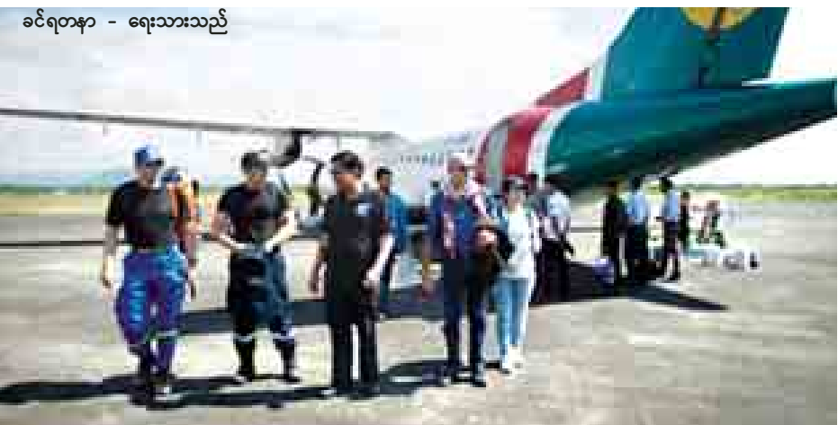
ခင်ရတနာ - ရေးသားသည်

ခါကာဘို ရာဇဝိဒေဝီတို့၏ အတွင်း တောင်တက်သမားနှင့်အတူ ရှာဖွေစဉ် ထပ်မံအဆက်အသွယ်ပြတ်တောက်သွားခဲ့သည့် ထိုင်းနိုင်ငံ ဘီဖိုးရဟတ်ယာဉ်နှင့် လိုက်ပါသွားသူများအား ကယ်ဆယ်မှုတိုးမြှင့်နိုင်ရေးအတွက် စက်တင်ဘာ ၂၈ ရက် ည ၁၂ နာရီက တရုတ်နိုင်ငံမှ ကျွမ်းကျင်တောင်တက်သမား နှစ်ဦးသည် ရန်ကုန်အပြည်ပြည်ဆိုင်ရာ လေဆိပ်သို့ ရောက်ရှိခဲ့ပြီး ယနေ့ညနေ ၄နာရီခွဲတွင် နောက်ထပ် တောင်တက်ကျွမ်းကျင်သူ ၁၀ ဦး ရောက်ရှိလာပြီဖြစ်သည်။