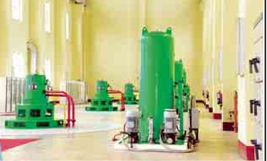
သမန်းဆိပ်ရေအားလျှော့စား စက်ရုံကို တွေ့ရစဉ်။

သမန်းဆိပ် ရေလျှော့စားစက်ရုံ ဆည်ရေသောက် မိုးစပါးစိုက်ပျိုးနိုင်မှု ဧက ၃၆၉၃၈၀ နှင့် ဧန္တပေးစိုက်ပျိုးနိုင်မှု ဧက ၄၈၀၀၀၀ ရှိပြီး ကုန်ထုတ်သီးနှံများဖြစ်သည့် နှမ်း၊ ပဲတီစိမ်း၊ အခြားပဲအမျိုးမျိုးစိုက်ပျိုးနိုင်မှုအနေဖြင့် ဧကတစ်သိန်းကျော် ရှိကြောင်း သိရှိရပါသည်။ သမန်းဆိပ်ရေလျှော့စားစက်ရုံ မြေသားတပ်အမျိုးအစား၊ တပ်အမြင့် ၁၀၈ပေ၊ တပ်အလျား ၂၅၈၇ ပေ (လေးမိုင်ကျော်) ရှည်လျားပြီး မြန်မာနိုင်ငံ၏ အကြီးဆုံး၊ အရှေ့တောင်အာရှ၌ တပ်အလျား အရှည်လျားဆုံးဆည်တစ်ကြီးဖြစ်ပါသည်။ ရွှေဘို၊ ခင်ဦး၊ ကန့်ဘလူ၊ တန့်ဆည်၊ ရေဦး၊ ဒီပဲယင်း၊ ဘုတလင်နှင့် အရာတော်မြို့နယ်များရှိ စိုက်ပျိုးမြေဧကငါးသိန်းကျော်ကို တစ်နှစ်ပတ်လုံး သီးနှံများဖြင့် စိမ်းလန်းနေစေရန် စိုက်ပျိုးရေးပေးဝေလျက်ရှိပါသည်။ ထို့ကြောင့် ဆည်ရေသည် ထက်ဝက် လယ်မြေလှည့်လည်ထက် လှလှသော အထက်မြန်မာပြည်၏ စပါးကျို စစ်ကိုင်းတိုင်းဒေသကြီးတွင် မြေကြီးမှ ရွှေသီးပေးနေပုံကို တွေ့မြင်