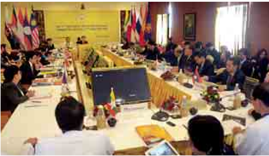
အခြေပြမြေပုံ နှစ်ဝက်သုံးသပ်ချက် အကောင်အထည်ဖော်ဆောင်ရွက်ခြင်း၊ Resource Mobilization နှင့် အာဆီယံ လူမှုရေး-ယဉ်ကျေးမှု အသိုက်အဝန်း၏ ၂၀၁၅ အလွန် ဦးတည်ချက်များအတွက်

ရွက်ရေးသဘောတူညီချက်၊ မြန်မာနိုင်ငံက အာဆီယံဥက္ကဋ္ဌအဖြစ် တာဝန်ယူစဉ် ASEAN Awareness မြှင့်တင်ရေး၊ အာဆီယံနိုင်ငံများနှင့် ယဉ်ကျေးမှုအနုပညာရပ်ဆိုင်ရာများ၌ အပြန်အလှန်နားလည်ရေးနှင့် မြှင့်တင်ရေးတို့အတွက် ASEAN Cultural Fair-2014 ကို အောက်တိုဘာ ၁ ရက်တွင် ရန်ကုန်မြို့ အမျိုးသားဇာတ်ရုံ၌ ကျင်းပနိုင်ရေးဆိုင်ရာ ကိစ္စရပ်များကို ဆွေးနွေးခဲ့ကြသည်။ အလားတူ စက်တင်ဘာ ၂၈ ရက် နံနက်ပိုင်းကလည်း ASCC Blueprint MTR 2015 Vision အတွက် ပူးပေါင်းဆောင်ရွက်ရန် Action Plan, Work Plan များ ချမှတ်ပြီး Work Schedule အတိုင်း ဆောင်ရွက်နိုင်ရေးအတွက် 3 rd Working Group Meeting အစည်းအဝေးကို ကျင်းပခဲ့ရာ အာဆီယံလူမှုရေး-ယဉ်ကျေးမှု အသိုက်အဝန်း