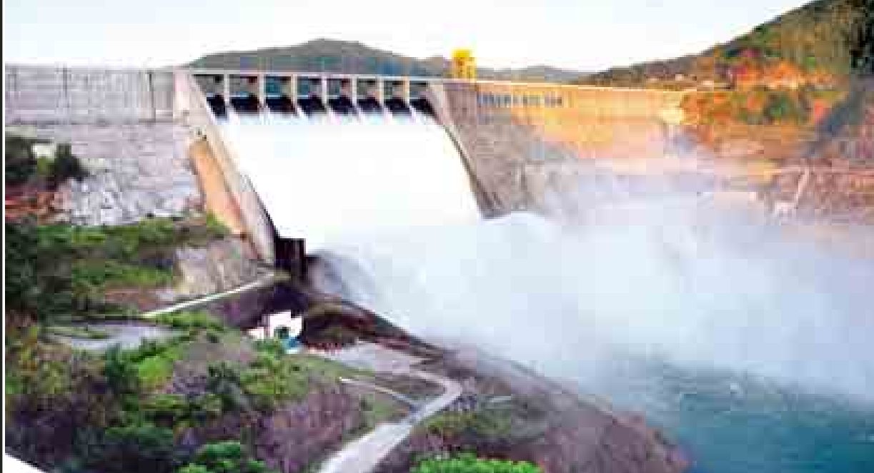
ရဲရွာရေလျှော့စားစက်ရုံ တွေ့ရစဉ်။

ကဏ္ဍနှစ်မျိုးစလုံးအတွက် အကောင်အထည်ဖော်ရန် သင့်လျော်သော စီမံကိန်းတစ်ခုမှာ ရှမ်းပြည်နယ် (တောင်ပိုင်း) ရွာခံမြို့နယ် မြို့ကြီးရွာ၏ မြောက်ဘက် တစ်မိုင်ခန့် အကွာရှိ ဇော်ဂျီမြစ်ပေါ်တွင် တည်ရှိသည့် မြို့ကြီးရေလျှော့စားစက်ရုံကို စီမံကိန်းပင် ဖြစ်ပါသည်။ အဆိုပါစီမံကိန်းကို ၂၀၁၅-၂၀၁၆ ခုနှစ်တွင် ပြီးစီးအောင် တည်ဆောက်လျက်ရှိပြီး ၂၀၁၄ ခုနှစ် စက်တင်ဘာလ ၂၆ ရက်နေ့အထိ ၈၁ ရာခိုင်နှုန်းပြီးစီးပြီဖြစ်ပါသည်။ စီမံကိန်းပြီးစီးပါက နှစ်စဉ် ပျမ်းမျှ လျှပ်စစ်စွမ်းအား ၁၃၅ ဒသမ ၇ ကီလိုဝပ်နာရီသန်းပေါင်း ထုတ်လွှတ်ပေးနိုင်မည် ဖြစ်ပြီး ကျောက်ဆည်ခရိုင်အတွင်းရှိ ဇော်ဂျီရေသောက်စရိယာ ဧက ၈၂၀၀ ကို ရေပိုမိုပေးဝေနိုင်မည်ဖြစ်ပါသည်။ အထူးသဖြင့် ပူပြင်းခြောက်သွေ့ဒေသဖြစ်သည့် မိတ္ထီလာလွင်ပြင်အတွင်းရှိ မြေဧရိယာ ဧက ၃၃၀၀၀ ကို စိုက်ပျိုးရေးပေးဝေနိုင်မည်ဖြစ်ကာ ဒေသတွင်း စိမ်းလန်းစိုပြည်လာစေမည့် အကျိုးကျေးဇူးများ ရရှိလာမည်ဖြစ်ပါသည်။ နိုင်ငံတော်သမ္မတ ဦးသိန်းစိန်သည် စက်တင်ဘာလ ၂၇ ရက်နှင့် ၂၈ ရက်နေ့တို့တွင် မြို့ကြီးရေလျှော့စားစက်ရုံစီမံကိန်း၊ ရဲရွာရေအား လျှပ်စစ်စီမံကိန်းနှင့် သမန်းဆိပ်ရေလျှော့စားစက်ရုံတို့သို့ လှည့်လည်ကြည့်ရှုပြီး လုပ်ငန်းဆိုင်ရာများ စစ်ဆေးခဲ့ပါသည်။ အဆိုပါခရီးစဉ်အတွင်း မြို့ကြီးရေလျှော့စားစက်ရုံစီမံကိန်းနှင့် ပတ်သက်၍ နိုင်ငံတော်သမ္မတက ဆည်တစ်ခု တည်ဆောက်ရေးလုပ်ငန်းနှင့်အတူ ရေရရှိရေးအတွက် မြောင်းတူးဖော်မှုလုပ်ငန်းကိုလည်း တစ်ပြိုင်တည်းပြီးစီးအောင် ဆောင်ရွက်သွားရန်နှင့် ရေအားလျှပ်စစ်ထုတ်လုပ်မှုကိုလည်း တစ်ချိန်တည်း ထုတ်လုပ်နိုင်ရေး ဆောင်ရွက်သွားရန်၊ ရေမြောင်းများကို ကွန်ကရစ်ရေမြောင်းပြုလုပ်ပြီး ရေမြောင်းတစ်လျှောက်တွင် ဆိုလာစနစ်ဖြင့်