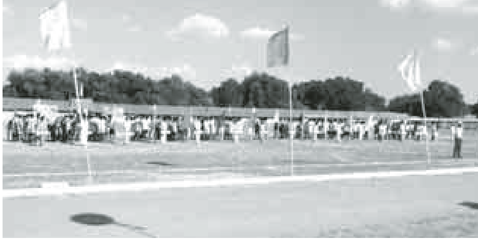
နှင့် ဝေးပင်ကျေးရွာဘောလုံးအသင်းတို့ ယှဉ်ပြိုင်ကစားကြရာ ဝေးပင်ကျေးရွာအသင်းက သုံးဂိုး-နှစ်ဂိုးဖြင့် အနိုင်ရရှိခဲ့သည်။ မြို့နယ်အဆင့်ဌာန လာရောက် အားပေးကြသူများဖြင့် ဆိုင်ရာ တာဝန်ရှိသူများ၊ ဘောလုံးစည်ကားသိုက်မြိုက်စွာ ကျင်းပခဲ့ပါသနာရှင်များ၊ နှစ်ဖက်အသင်းမှ ကြောင်း သိရသည်။ ကိုမျိုး(ယောစရာ)

မကွေးတိုင်းဒေသကြီး ဆိပ်ဖြူမြို့နယ်တွင် ၂၀၁၄ ခုနှစ် မြို့နယ်အုပ်ချုပ်ရေးမှူးပလား အမျိုးသားအလွတ်တန်း ဘောလုံးပြိုင်ပွဲကို စက်တင်ဘာ ၂၇ ရက် ညနေ ၃နာရီက မြို့နယ်အားကစားကွင်း၌ ဖွင့်ပွဲကျင်းပရာ မြို့နယ်အုပ်ချုပ်ရေးမှူးဦးညီညီဝင်းက အမှာစကားပြောကြားပြီး(အထက-၉) ကိုးတောင့်ကျေးရွာနှင့်(အထက) အောက်ဆိပ်ကျေးရွာတို့မှ ကျောင်းသူများက အေရိုးဗစ်နှင့် ပန်းပွားအကများဖြင့် ဖျော်ဖြေပေးကြသည်။