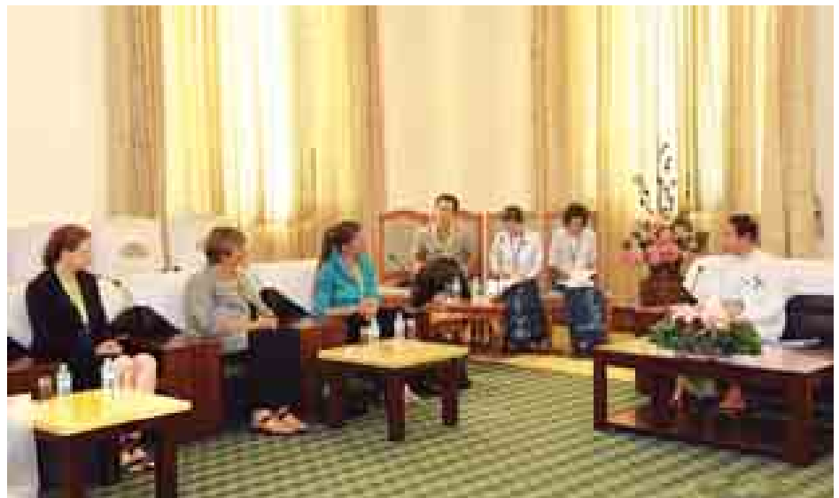
နှင့် ပြည်သူ့လွှတ်တော်ရုံးမှ တာဝန်ရှိသူများ တက်ရောက်ကြသည်။ တွေ့ဆုံစဉ် မြန်မာနိုင်ငံနှင့် ကနေဒါနိုင်ငံ လွှတ်တော်တို့အကြား အပြန်အလှန် ပူးပေါင်းဆောင်ရွက်ရေးနှင့် အမျိုးသမီးလွှတ်တော် ကိုယ်စားလှယ်များ၏ အခန်းကဏ္ဍတို့နှင့် စပ်လျဉ်း၍ ရင်းနှီးခင်မင်စွာ ဆွေးနွေးကြသည်။ (သတင်းစဉ်)

ပြည်ထောင်စုလွှတ်တော် ဒုတိယနာယက ပြည်သူ့လွှတ်တော် ဒုတိယဥက္ကဋ္ဌ ဦးနန္ဒကျော်စွာသည် ကနေဒါနိုင်ငံမှ လွှတ်တော်ကိုယ်စားလှယ် H. E. Mr. Kirsty Duncan ဦးဆောင်သည့် ကနေဒါလွှတ်တော်ကိုယ်စားလှယ်အဖွဲ့အား ယနေ့နံနက် ၉ နာရီတွင် နေပြည်တော်ရှိ လွှတ်တော်အဆောက်အအုံ ရေးရာဆောင် အမှတ်(၁)၌ လက်ခံတွေ့ဆုံသည်။ (ယာပုံ)