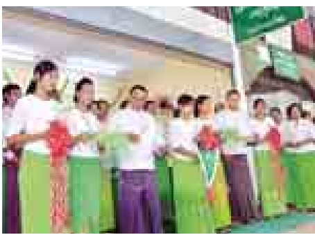
ငွေထုတ်ယူခြင်းတို့ကို အချိန်တိုအတွင်း လွယ်ကူလျင်မြန်စွာ ဆောင်ရွက်နိုင်တော့မည်ဖြစ်သည်။ မြန်မာ့စီးပွားရေးဘဏ်

မြန်မာ့စီးပွားရေးဘဏ် သိမ်ကြီးဈေးငွေလွှဲကိရိယာလှည့်လည်လုပ်ငန်းအခမ်းအနားကို စက်တင်ဘာ ၂၉ ရက် နံနက် ၈ နာရီက အဆိုပါရုံးခွဲတည်ရှိရာ ပန်းဘဲတန်းမြို့နယ် ရွှေတိဂုံဘုရားလမ်း သိမ်ကြီးဈေး(၈)ရုံ မြေညီထပ် အခန်းအမှတ်(၂၂) ၌ ကျင်းပသည်။