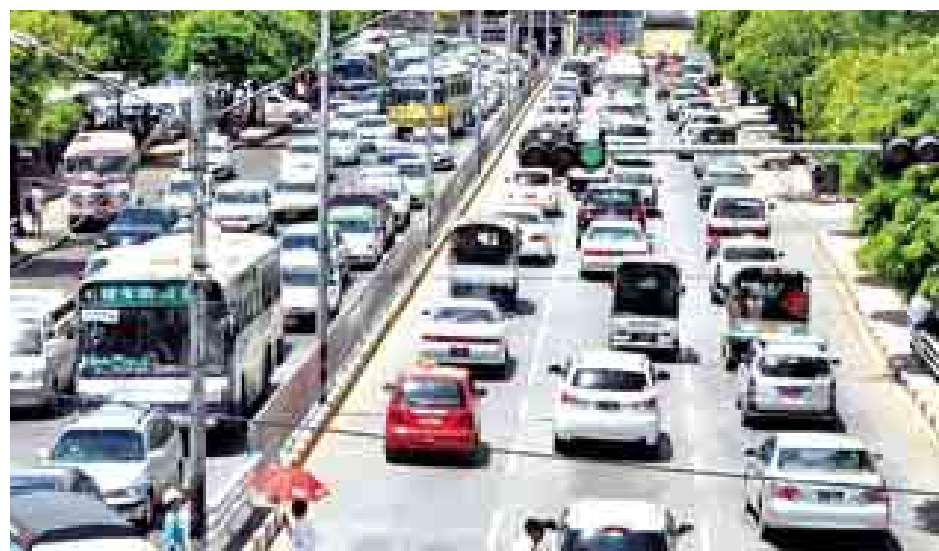
မြန်မာနိုင်ငံ၌ CNG သုံး ဖော်တော်ယာဉ် ၂၇၀၀၀ ကျော်ရှိနေသည်။

သတင်း-ဝေယံဦး