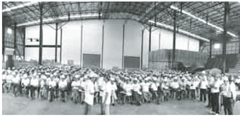
အလုပ်သမားများစုပေါင်းကာ လုပ်ငန်းခွင်ထိခိုက်မှုမရှိသည့် one million man hours of zero accident အတွက် အချင်းချင်း ဂုဏ်ပြုလွှာပေးအပ်စဉ်။

နိမ့်ကျသောအားဖြင့်သာ အသွားမတော်တစ်လှမ်းဟု ဆိုသည့်အတိုင်း မိမိလည်ပင်းကို အလှည့်မတော်မဖြစ်မိစေရန် သတိဂရုပြုသင့်ပါကြောင်းပင် ဖြစ်ပါသတည်း။