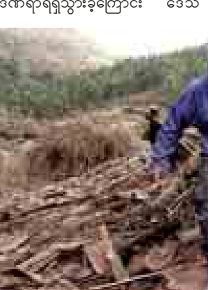
ဆိုင်ရာ တာဝန်ရှိသူများက ပြောသည်။ ရစ်ချ်တာစကေး ၅ ဒသမ ၁ ရှိ ငလျင်တစ်ခု ပီရူးနိုင်ငံတောင်ပိုင်း ပါဂူရီပြည်နယ် အင်ဒရီးယန်ဒေသ၌ စနေနေ့ညပိုင်းက လှုပ်ခတ်ခဲ့ခြင်း

ပီရူးနိုင်ငံတောင်ပိုင်း၌ အင်အားအသင့်အတင့် ငလျင်တစ်ကြိမ် လှုပ်ခဲ့ရာ ရှစ်ဦးသေဆုံးပြီး ခြောက်ဦးဒဏ်ရာရရှိသွားခဲ့ကြောင်း ဒေသ