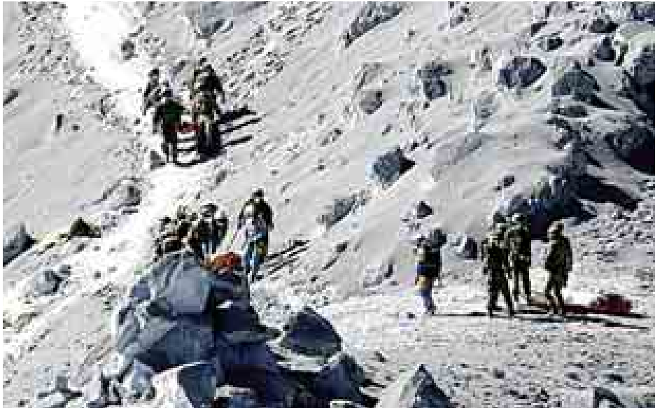
အွန်တာဂေးမီးတောင်၌ ကယ်ဆယ်ရေးတပ်ဖွဲ့ဝင်များ ရှာဖွေရေးပြုလုပ်နေစဉ်။